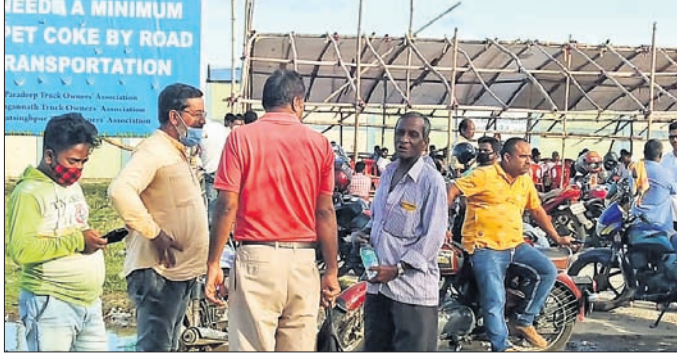
ପେଟ୍‌କୋକ୍‌ର ରୋଡ୍ ପରିବହନ ଦାବିରେ ଧାରଣା। ପେଟ୍‌କୋକ୍‌ର ରୋଡ୍ ପରିବହନ ଦାବିରେ ଧାରଣା କରୁଥିଲେ। ୨୦୧୬-୧୭ବେଳେ ଟେକ୍‌ବିଶୋଧନାଗାରରୁ ୨୦ରୁ ୩୦ ଟନ ୮୦୦ ହଜାର ଟ୍ରକ୍ ଗଣ୍ୟ ପରିବହନ କରୁଛି। ଟେକ୍ ବିଶୋଧନାଗାର ପ୍ରକଳ୍ପ ୨୦୧୫ରେ ଲୋକାର୍ପଣ ହୋଇଥିଲା। ସେତେବେଳେ କେସିସି ଦାବି ଅନୁସାରେ ଟେକ୍‌ବିଶୋଧନାଗାର ଚଳାଣୀ

ପାରାଦୀପ ଟେକ୍ ବିଶୋଧନାଗାର ପ୍ରକଳ୍ପ ସଂଯୋଗ ରାସ୍ତାର ରଜିଆଗଡ଼ଠାରେ ମଙ୍ଗଳବାର କେସିସି(ଜଏସ୍ କୋ-ଡାକ୍ ବାପା ଥାନାରେ ଅଭିଯୋଗ କରିଥିଲେ। ପୋଲିସ୍ ନଂ.୧୮୬/୨୧ରେ ଏକ ମାମଲା ରୁଜୁ କରି ତଦନ୍ତ ଆରମ୍ଭ କରିଥିଲା। ତେବେ ନାବାଳିକା ତାଙ୍କର ଜଣେ ସମ୍ପର୍କୀୟଙ୍କ ଘରର ରଖୁଥିବା ନେଇ ପରିବାର ଲୋକେ ପୋଲିସ୍‌କୁ ଜଣାଇଥିଲେ। ଉକ୍ତ ଖବର ମୁତାବକ ପୋଲିସ୍ ସେଠାରେ ଚଢ଼ାଉ କରି ନାବାଳିକାଙ୍କୁ ଉଦ୍ଧାର କରିଥିଲା।