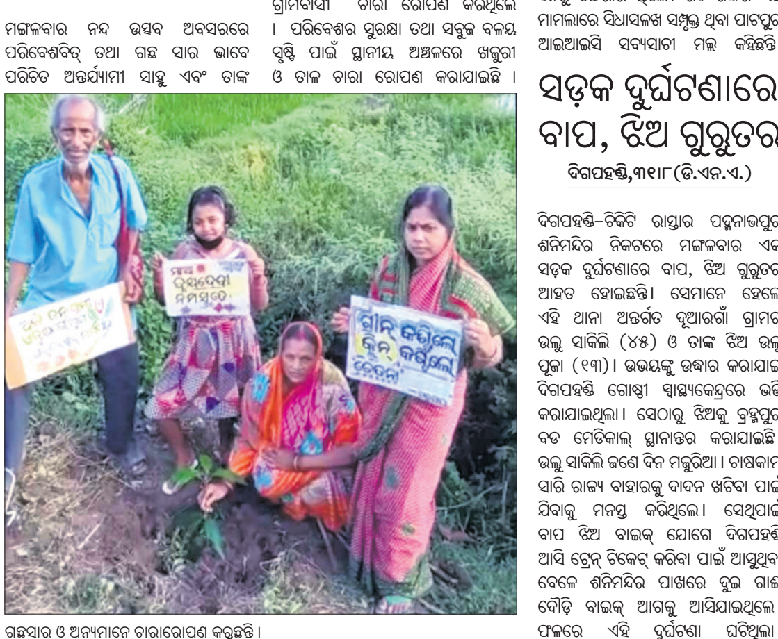
ଗଛପାଳ ଓ ଅନ୍ୟମାନେ ତାରା ରୋପଣ କରୁଛନ୍ତି।