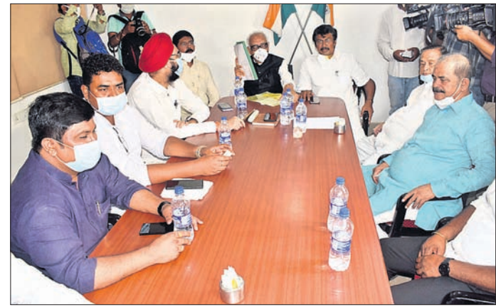
ବିଧାନସଭା ମୌସୁମୀ ଅଧିବେଶନ ପୂର୍ବରୁ ମଙ୍ଗଳବାର ଅନୁଷ୍ଠିତ ବିଜେଡି, ଭାଜପା ଓ କଂଗ୍ରେସ ବିଧାୟକ ଦଳ ବୈଠକ ।