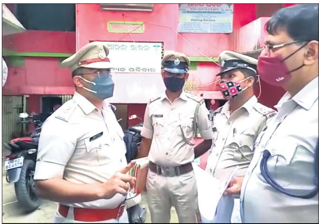
ଆଦିତ୍ୟ ହସ୍ତିଗାଳ ଆଞ୍ଚଳିକ ସମ୍ମୁଖରେ ସତର ପୋଲିସ୍ ଟିମ୍।

ନୟାଗଡ଼ ଜିଲ୍ଲା ପୁଖ୍ୟ ଚିକିତ୍ସାଳୟ ପଛପାଖରେ ଥିବା ଘରୋଇ ଆଦିତ୍ୟ ହସ୍ତିଗାଳ ଆଞ୍ଚଳିକ ସମ୍ମୁଖରେ ଭୂଷା ହତ୍ୟା ମହଙ୍ଗା ପଡ଼ିଛି। ଜିଲ୍ଲାପାଳଙ୍କ ନିର୍ଦ୍ଦେଶରେ ନୟାଗଡ଼ ପୋଲିସ୍ ଏକ ସ୍ୱତନ୍ତ୍ର ଟିମ୍ ସଂଘାବଦାନ ରାତିରେ ଚଢ଼ାଇ କରି ବେଆଇନ ଗର୍ଭପାତ କରାଉଥିବା ଅଭିଯୋଗରେ ୫ଜଣଙ୍କୁ ଆନାକୁ ଆଣି ଅଟକ ରଖିଥିଲା।