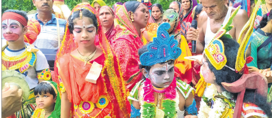
ନନ୍ଦୋସ୍ତର ଗୋପାଳ ସମାଜ ପକ୍ଷରୁ ଅନୁଷ୍ଠିତ ନନ୍ଦୋସ୍ତର କୃଷ୍ଣ, ବକରାମ ଓ ଗୋପାଳ ବାଳକ ବେଶରେ ସଜିତ ହୋଇଥିବା ପିଲାମାନେ।

ଖଣ୍ଡପଡ଼ା, ୩୧୮୮ (ସ.ପ୍ର.) ବେହେରାଳ ଚତୁର୍ଦ୍ଧାଧାନରେ ନନ୍ଦୋସ୍ତର ପାରମ୍ପରିକ ରୀତିରେ ଅନୁଷ୍ଠିତ ହୋଇଥିଲା। ଏହି ଅବସରରେ କୁଳି କୁଳି ପିଲାମାନଙ୍କୁ କୃଷ୍ଣ, ବକରାମ ଓ ଗୋପାଳ ବାଳକ ବେଶରେ ସଜିତ କରାଯାଇ ନନ୍ଦ ରାଜାଙ୍କ ସହିତ ଗ୍ରାମ ପରିକ୍ରମା କରାଯାଇଥିଲା।