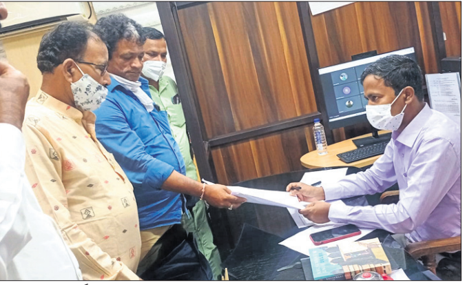
ଜିଲ୍ଲା ପ୍ରକଳ୍ପ ନିର୍ଦ୍ଦେଶକଙ୍କୁ ଦାବିପତ୍ର ପ୍ରଦାନ କରାଯାଇଛି। ପଞ୍ଚାୟତର ଖେଳପଡିଆ, ସର୍ବସାଧାରଣ ଶୌଚାଳୟ, ପଞ୍ଚାୟତ ଗ୍ରାମାଣ ପାର୍କ, ହତ୍ୟା ହତ୍ୟା କରାଯାଇଛି। ତେଣୁ ପ୍ରକଳ୍ପ ଅଭିଭାବକ ଓ କେତେଜଣ ମୁରବି ହସ୍ତକ୍ଷେପ କରି ଆପୋସ ଆଲୋଚନା ମାଧ୍ୟମରେ ଘଟଣାର ସମାଧାନ କରିଥିଲେ। ସେଥିପାଇଁ ଘଟଣା ପଦାକୁ ଆସି ନ ଥିଲା। ମାତ୍ର ଏବେ ସେହି ଘଟଣା ମହାବିଦ୍ୟାଳୟରୁ ଫେରୁଥିଲେ।

ଯାଜପୁର ଜିଲ୍ଲା ଦଶରଥପୁର ବ୍ଲକ୍ ଅଧୀନ ତାହାଣହତା ପଞ୍ଚାୟତରେ ମହାତ୍ମା ଗାନ୍ଧୀ ଜାତୀୟ ଗ୍ରାମାଣ ନିର୍ମୂଳ କର୍ମ ନିୟୁତ୍ତି ଯୋଜନା (ଏମ୍.ଜି.ଏନ୍.ଆର୍.ଇ.ଏ.ଏ.)ରେ ହୋଇଥିବା ଦୁର୍ନୀତିର ତଦନ୍ତ ଦାବି ହୋଇଛି। ଏନେଇ ସ୍ଥାନୀୟ ଭାଜପାର ଏକ ପ୍ରତିନିଧି ମଣ୍ଡଳ ଜିଲ୍ଲା ପ୍ରକଳ୍ପ ନିର୍ଦ୍ଦେଶକଙ୍କୁ ଭେଟି ଦାବିପତ୍ର ପ୍ରଦାନ କରିଛନ୍ତି। ପ୍ରତିନିଧିମଣ୍ଡଳ ଦାବିପତ୍ରରେ ଦର୍ଶାଇଛନ୍ତି, ତାହାଣହତା ପଞ୍ଚାୟତରୁ ସୂଚନା ଦେଇଥିଲେ, ଉକ୍ତ ଅର୍ଥ ୨୦୧୨ରୁ ପ୍ରଶାସନ ନିକଟରେ ଅଛି। ସେଥିପାଇଁ ବିଗତ ଦିନରେ ଏକାଧିକ ବାର ନୋଟିସ୍ ହୋଇଛି। ମାତ୍ର ଦାବିଦାର ମିଳୁନଥିବାରୁ ପ୍ରଶାସନ ଅର୍ଥ ଦେଇପାରିନାହିଁ। ଏଥିରେ କମ୍ପାନୀର କୌଣସି ଭୁଲ୍ ନାହିଁ ବୋଲି ସେ କ୍ଷମ୍ପା କରିଛନ୍ତି।