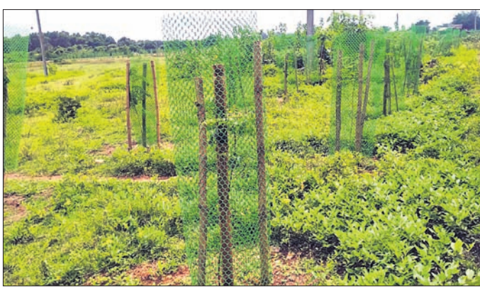
ଚାରା ଚୋପଣ କରାଯାଇଛି। ଏହାର ଉଦ୍ଦେଶ୍ୟ ଭାବେ ନିଆଯାଇ ପାରେ। ଏଠାରେ ୩୫୦୦ ଚାରାଚୋପଣ ନିମନ୍ତେ ଏମ୍.ଜି.ଏନ୍.ଆର୍.ଇ.ଏ.ଏ. ପାଇଁ ୧୬ ଲକ୍ଷ ଟଙ୍କା ବ୍ୟୟ ବରାଦ କରାଯିବ। ସହ ସେହି କାମକୁ ଯାଜପୁର ରୋଡ୍ ବନ ବିଭାଗକୁ ହସ୍ତାନ୍ତର କରାଯାଇଥିଲା। ସ୍ଥାନୀୟ ଲୋକଙ୍କୁ ଏହି କାମରେ ନିୟୋଜିତ କରିବା ନିମନ୍ତେ ରହିଥିବା ବେଳେ ବନବିଭାଗ ଜିଲ୍ଲା ସହାୟ ଶ୍ରମିକଙ୍କୁ ଆଣି କାମ କରିଥିବା ସ୍ଥାନୀୟ ଲୋକେ ଅଭିଯୋଗ କରିଛନ୍ତି। ସେହିପରି ନିଜର ୧୬ ଲକ୍ଷ ଟଙ୍କା ବ୍ୟୟ ବରାଦ କରାଯିବା ସହ ସେହି କାମକୁ ଯାଜପୁର ରୋଡ୍ ବନ ବିଭାଗକୁ ହସ୍ତାନ୍ତର କରାଯାଇଥିଲା। ସ୍ଥାନୀୟ ଲୋକଙ୍କୁ ଏହି କାମରେ ନିୟୋଜିତ କରିବା ନିମନ୍ତେ ରହିଥିବା

ରଗଡି, ୩୧୮୮ (ଡି.ଏନ.ଏ.): ଆବଶ୍ୟକ ସ୍ଥାନରେ ଚାରାଚୋପଣ କରି ରାସ୍ତାକୁ ସଜ୍ଜିତ କରିବା ପାଇଁ ଚୋଳିବାକୁ ବନୀକରଣ ଯୋଜନା ହାତକୁ ନିଆଯାଇଛି। ମହାତ୍ମା ଗାନ୍ଧୀ ଜାତୀୟ ଗ୍ରାମାଣ ନିର୍ମୂଳ କର୍ମ ନିୟୁତ୍ତି ଯୋଜନା (ଏମ୍.ଜି.ଏନ୍.ଆର୍.ଇ.ଏ.ଏ.)ରେ ମଧ୍ୟ ଗ୍ରାମାଞ୍ଚଳର ପଥପାର୍ଶ୍ୱ ଚାରାଚୋପଣ କାମ ଚାଲିଛି। ହେଲେ ଦାୟିତ୍ୱରେ ଥିବା ଅଧିକାରୀଙ୍କ ଆବଶ୍ୟକତା ଅଭାବ ଯୋଗୁଁ ଏହାର ଅଗ୍ରଗତି ହୋଇପାରୁନାହିଁ ବୋଲି ଅଭିଯୋଗ ହୋଇଛି। ଯାଜପୁର ଜିଲ୍ଲା କୋରେଇ ବ୍ଲକ୍ ଅଧୀନ କଟରାସାହି ପଞ୍ଚାୟତ ଅଧିକାରୀଙ୍କୁ ଗ୍ରାମଠାରୁ ଉତ୍ତରକୁ ପଞ୍ଚାୟତ ଉପପ୍ରଧାନ ଗ୍ରାମ ୧୪ କର୍ମ ପର୍ଯ୍ୟନ୍ତ ପଥପାର୍ଶ୍ୱ ବନୀକରଣ କାମକୁ