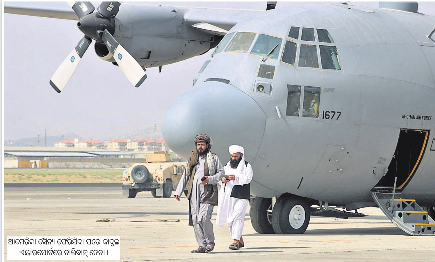
ଆମେରିକା ସୈନ୍ୟ ଫେରିଯିବା ପରେ କାବୁଲ ଏୟାରପୋର୍ଟରେ ତାଲିକାନ୍ ନେତା।

ଆଧୁନିକ ବିଶ୍ୱର ଅନ୍ୟତମ ଲକ୍ଷ୍ୟ ଯୁଦ୍ଧରେ ପୂର୍ଣ୍ଣସ୍ୱେଚ୍ଛା ଜୀବନର ୨ ଦଶନ୍ଧି ବିତାଇବା ପରେ ସ୍ୱଦେଶକୁ ପ୍ରତ୍ୟାବର୍ତ୍ତନ କରିଛନ୍ତି ଆମେରିକୀୟ ସୈନ୍ୟ। ଆଫଗାନିସ୍ତାନ ମାଡ଼ିରେ ଛାଡ଼ି ଯାଇଛନ୍ତି ଅନେକ ସତ୍ତକ, ଅଭୂଳା ଅତୀତ। ଯେଉଁ ତାଲିକାନ୍ ଆରମ୍ଭ ହୋଇଥିଲା କାହାଣୀ ସେଇ ତାଲିକାନ୍ ହାତରେ ଆଜି ଇସ୍ଲାମିକ୍ ଏମିରେଟ୍ସ ଅଫ୍ ଆଫଗାନିସ୍ତାନର ଶାସନ। ଏଥର ତାଲିକାନ୍ ଆସିଛି ନେଇ ନୂଆ ଚେହେରା ନୂତନ ସଂସ୍କରଣ ସହ। ସବୁଠି ଚର୍ଚ୍ଚାରେ ଆତଙ୍କବାଦୀ ସଙ୍ଘଠନର ମିଥ୍ୟା ଅହିଂସା ଘୋଷଣା ଓ ଚତ୍ୱର୍ଣ୍ଣିତ ଭଦ୍ର ଅଭିନୟ। ଯା' ଭିତରେ ଛିଡ଼ା ହୋଇଛି ଗୋଟିଏ ପ୍ରଶ୍ନ: ଆମେରିକା ବିରୋଧରେ ଯୁଦ୍ଧ ଶେଷ ହୋଇଗଲା ସିନା; ଦାରିଦ୍ର୍ୟ, ଦୁର୍ନୀତି, ଆତଙ୍କ, ଅସ୍ଥିରତା ବିରୋଧରେ ଚ୍ୟାଲେଞ୍ଜକୁ କିପରି ସାମ୍ନା କରିବ ଆଫଗାନିସ୍ତାନ।