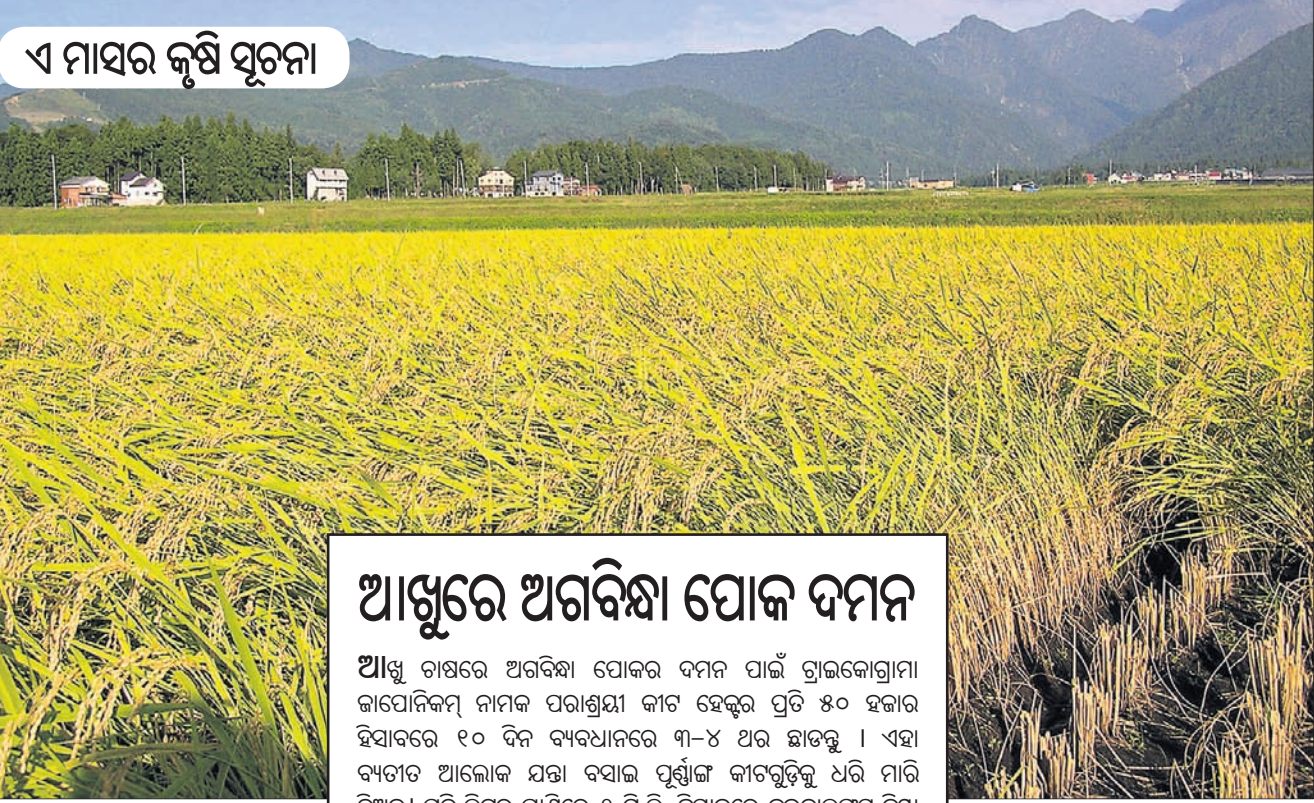
ଏ ମାସର କୃଷି ସୂଚନା