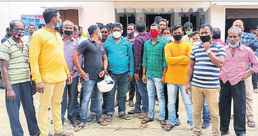
ତହସିଲଦାରଙ୍କୁ ଭେଟିବାକୁ ଆସିଥିବା ଗ୍ରାମବାସୀ।