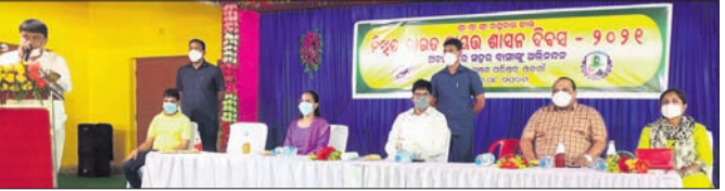
ସାଧରଣ ଶାସନ ଦିବସ ଅବସରରେ ମଞ୍ଚାସୀନ ଅତିଥିମାନେ।

ଓଡ଼ିଶା, ୩୧।୮ (ସ୍ୱ.ପ୍ର.) ଓଡ଼ିଶା ସର୍ବସମ୍ମତ ୪ ବର୍ଷ ପୂରିଛି। ଏହି ଅବସରରେ ମଙ୍ଗଳବାର ସ୍ଥାନୀୟ ବିଜୁ କଲ୍ୟାଣ ମଣ୍ଡପ ପରିସରରେ ସାଧରଣ ଶାସନ ଦିବସ ସମାରୋହ ଅନୁଷ୍ଠିତ ହୋଇଛି।