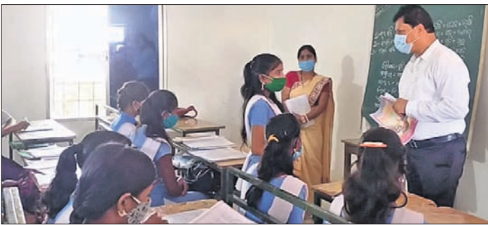
ନିଲାପାଳ ଶ୍ରେଣୀଗୁଡ଼ିରେ ପିଲାମାନଙ୍କୁ ପ୍ରଶ୍ନ ପଚାରିଛନ୍ତି।