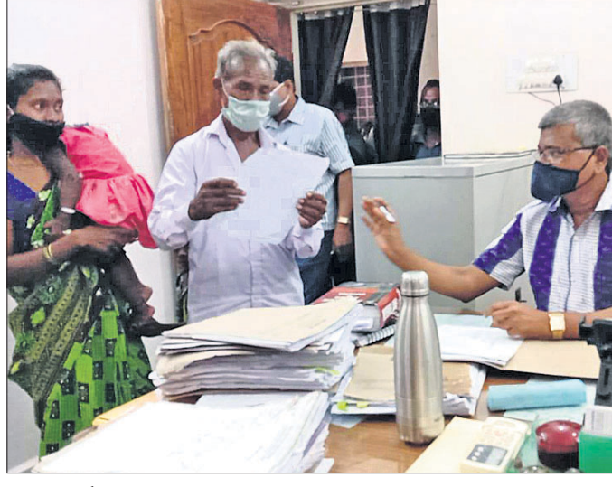
ସିପିଏମ୍‌ଆଇ ମୂର୍ତ୍ତି ଅତିରିକ୍ତ ଜିଲାପାଳଙ୍କୁ ଅଭିଯୋଗ ଜଣାଉଛନ୍ତି।

ଗୁଣିଗାରେଡ଼ି ସନ୍ଦେହରେ ମାଡ଼ ଓ ହତ୍ୟା ଉଦ୍ଦେଶ୍ୟ ସହ ଧମକ ଦିଆଯାଇଥିବା ଅଭିଯୋଗ ହୋଇଛି। ରାୟଗଡ଼ା ଜିଲା ଚାରିଦିଲି ଥାନା ତଥା ରାୟଗଡ଼ା ବ୍ଲକ୍ ପ୍ରଶାସନ ପଞ୍ଚାୟତର ଅଧ୍ୟକ୍ଷ ଲିଖିଲିକାନ୍ତ ଗ୍ରାମୀଣ ସିପିଏମ୍‌ଆଇ (୧୫୪) ଜିଲାପାଳଙ୍କ କାର୍ଯ୍ୟାଳୟକୁ ଯାଇ ଏକ ଦାବିପତ୍ର ପ୍ରଦାନ କରିଛନ୍ତି। ଏଥିରେ ସେ ପରିବାରର ପୁରୁଣା ଦାବି କରିଛନ୍ତି। ଅଭିଯୋଗ ଅନୁଯାୟୀ, କୁଳାଇ ୧୭ରେ ଗାଁର ସାଙ୍ଗନା ସିପିଏମ୍‌ଆଇ ପୁଅ ସିପିଏମ୍‌ଆଇ (୩୫)ଙ୍କ ଗାଁ ବାହାରେ କୌଣସି କାରଣରୁ ମୃତ୍ୟୁ ଘଟିଥିଲା। ପରିବାର ଲୋକେ ମୃତଦେହ ଆଣି ଗାଁରେ ସଜାଇ କରିଥିଲେ। କିନ୍ତୁ ମୃତକଙ୍କ ପରିବାର ଲୋକେ ସିପିଏମ୍‌ଆଇ କାମିଆଙ୍କ ମୃତ୍ୟୁ ପାଇଁ ସିପିଏମ୍‌ଆଇ ଗାଁରେ ସଜାଇ କରିଥିଲେ। ଏଥିରେ ଅସନ୍ତୋଷ ପରିବାର ଲୋକେ ଆରୋପ ଲଗାଇଛନ୍ତି। ଏହାକୁ ନେଇ କୁଳାଇ ୧୭ ରାତିରେ ମୃତକଙ୍କ ପରିବାରର ସିପିଏମ୍‌ଆଇ ଉପରେ, ସିପିଏମ୍‌ଆଇ ଲାଲ, ସିପିଏମ୍‌ଆଇ ସାତେଇ, ସିପିଏମ୍‌ଆଇ ଶ୍ରୀରାମ, ସିପିଏମ୍‌ଆଇ ସାତେଇ, ସିପିଏମ୍‌ଆଇ ସାତେଇ, ସିପିଏମ୍‌ଆଇ ସାତେଇ ହତ୍ୟା କରି ପ୍ରତିଶୋଧ ନେବେ ବୋଲି ଧମକ ଦେଇଥିଲେ। ଏହାପରେ ଗ୍ରାମରେ