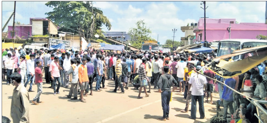
ସାର ନ ପାଇ ବୈପାରିଗୁଡ଼ା ଓ ଜୟପୁରରେ ଚାଷୀମାନେ ରାସ୍ତା ଅବରୋଧ କରିଛନ୍ତି।

ଅପରପାଲି, ୧୯୯(ଡି.ଏନ୍.ଏ.) ସୁବର୍ଣ୍ଣପୁର ଜିଲ୍ଲା ବାରମହାରାଜପୁର ବ୍ଲକ୍ ଅନ୍ତର୍ଗତ ବୁର୍ଜନପାଲି ପଞ୍ଚାୟତର ମଧ୍ୟପାଲି ସାହାଯ୍ୟ ଉପକେନ୍ଦ୍ରଠାରେ ବୁଧବାର ରୁଚିନି ଚିକାକରଣ ହୋଇପାରିନାହିଁ। ଫଳରେ ୪୦ରୁ ଉର୍ଦ୍ଧ୍ୱ ଶିଶୁ, ପ୍ରସୂତି ଓ ଗର୍ଭବତୀ ମହିଳା ଚିକାକରଣ ହୋଇପାରୁଥିଲେ। ଚିକାକରଣ ପାଇଁ ସାହାଯ୍ୟକର୍ମୀ ଅନୁପସ୍ଥିତ ରହିବାରୁ ଏଭଳି ପରିସ୍ଥିତି ସୃଷ୍ଟି ହୋଇଥିଲା। ଏହାକୁ କେନ୍ଦ୍ର କରି ଉତ୍ତରାଖଣ୍ଡ ପ୍ରକାଶ ପାଇଥିଲା। ଉକ୍ତ ସାହାଯ୍ୟ ଉପକେନ୍ଦ୍ରଠାରେ ଶିଶୁ ଓ ଅନ୍ୟମାନଙ୍କ ରୁଚିନି ଚିକାକରଣ ପାଇଁ କାର୍ଯ୍ୟକ୍ରମ ଥିଲା। ଏଥିପାଇଁ ସାହାଯ୍ୟକେନ୍ଦ୍ର ଅଧୀନରେ ଥିବା ପ୍ରାୟ ଯାତରିକା ଗରଜିବତୀ, ପ୍ରସୂତି ମହିଳା ଓ ଶିଶୁମାନଙ୍କ ଅଭିଭାବକଙ୍କୁ ପୂର୍ବରୁ ଖବର ଦିଆଯାଇଥିଲା। ସକାଳ ୯ଟା ସମୟରେ ଉପ ସାହାଯ୍ୟକେନ୍ଦ୍ରରେ ପହଞ୍ଚିଥିଲେ। ମାତ୍ର ମହିଳା ସାହାଯ୍ୟକର୍ମୀ କୌଣସି କାରଣରୁ ନ ଆସିବାରୁ