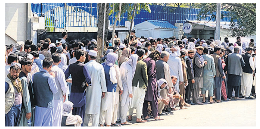
ବିଶ୍ୱବ୍ୟାପୀ ଏବଂ ଆଇଏମ୍‌ଏଫ୍ ଭଳି ଅନ୍ତର୍ଜାତୀୟ ଆର୍ଥିକ ପ୍ରତିଷ୍ଠାନଗୁଡ଼ିକଠାରୁ ଆମେରିକୀୟ ସୈନ୍ୟମାନଙ୍କୁ ହୋଇଯାଇଥିବାବେଳେ ଦେଶର ବ୍ୟାଙ୍କଗୁଡ଼ିକ ଖାଲି ପଡ଼ିଛି।

କାବୁଲ, ୧୯: ଆମେରିକୀୟ ସୈନ୍ୟମାନଙ୍କୁ ପଞ୍ଚାଶିର ଲଢ଼େଇ କରିବାକୁ ଉତ୍ସାହ ଦେବାକୁ ତାଲିବାନ ଲଢ଼ୁଆ ଏବଂ ଅହମ୍ମଦ ମାସୁଦଙ୍କ ନେତୃତ୍ୱାଧୀନ ଜାତୀୟ ପ୍ରତିରୋଧୀ ବଳ ମଧ୍ୟରେ ଲଢ଼େଇ ଚାଲି ଥିବା ଜଣାପଡ଼ିଛି।