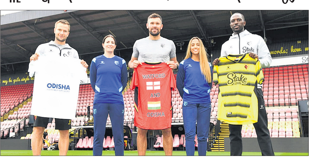
ଓଡ଼ିଶା ଏଫ୍ ସି ଓ ଡ୍ରାଫ୍ଟର ଏଫ୍ ସି ସହ ଅନ୍ତର୍ଜାତୀୟ କ୍ଲବ ପାର୍ଟନରଶିପ୍ ଚୁକ୍ତି ଅବସରରେ ଛବି ଉନ୍ମୋଚନ କରାଯାଇଛି ।

କୁବନେଶ୍ୱର, ୧।୯ (ସୋରଣ୍ଡ ଫୁଲ) ଓଡ଼ିଶା ଏଫ୍ ସି ଲକ୍ଷଣର ପ୍ରିମିୟର ଲିଗ୍ କ୍ଲବ ଡ୍ରାଫ୍ଟର ଏଫ୍ ସି ସହ ଇଷ୍ଟିନିଆର ନିକିଟ୍ କ୍ଲବ ପାର୍ଟନରଶିପ୍ ଚୁକ୍ତି କରିଛି।