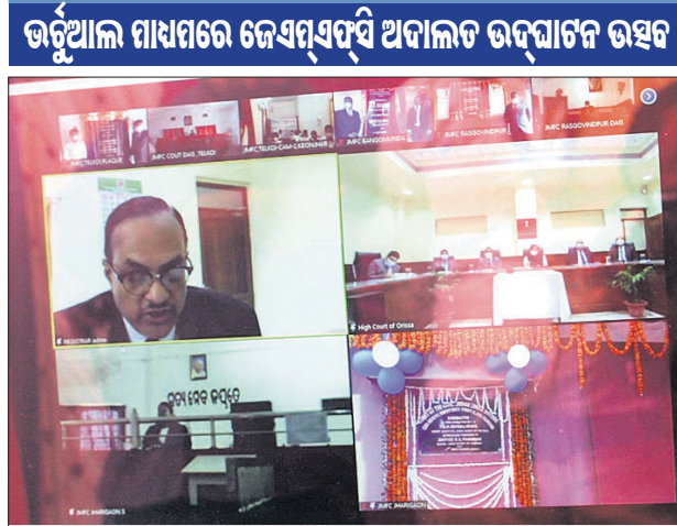
ଝରିଗାଁ, ୧୮ (ସ.ପ୍ର.)

ନବରଙ୍ଗପୁର ଜିଲ୍ଲା ଝରିଗାଁ ବ୍ଲକ୍ ସରକାରୀ ମହାସଭାରେ ହାଇକୋର୍ଟ ପୁଞ୍ଜୀ ବିଚାରପତି ଏସ୍.ପୁରୁଲିଧର ଭଟ୍ଟା ଆଧ୍ୟାୟରେ ପ୍ରଥମ ଶ୍ରେଣୀ ବିଚାର ବିଭାଗର ବ୍ୟବସ୍ଥାକୁ (ଜେଏମ୍ଏସ୍‌ସି) ଅଧିକତର ଭାବରେ କରାଯାଇଛି।