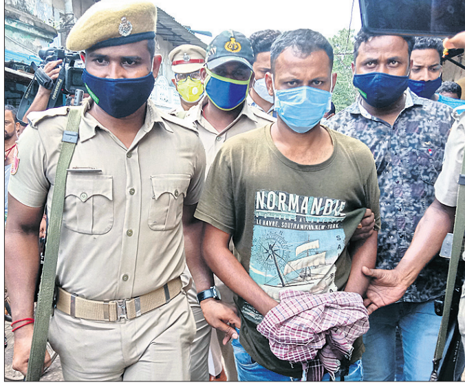
କ୍ରାଉନର୍ସ ରିଟ୍ରିଭିଣ୍ଡର ପାଇଁ ଅଭିଯୁକ୍ତଙ୍କୁ ପୋଲିସ୍ ଘଟଣାସ୍ଥଳକୁ ନେଇଛି।

ସମ୍ପର୍କିତାରେ ପୋଲିସ୍ କର୍ମଚାରୀ ଗୁଳି କରି ହତ୍ୟା କରିଥିଲେ। ତେବେ ଏହି ହତ୍ୟାକାଣ୍ଡରେ ଆଉ କାହାର ସମ୍ପର୍କ ରହିଛି, ଅଧିକ ତଦନ୍ତ ପାଇଁ ଖୁବ୍ ଶୀଘ୍ର ଶକ୍ତିକାଳ ରିମାଣ୍ଡରେ ଅଣାଯିବ ବୋଲି କଟକ ଡିସିପିଙ୍କ କାର୍ଯ୍ୟାଳୟରେ ବୁଧବାର ଆଇଡିଆଲିଟି ଖବରଦାତା