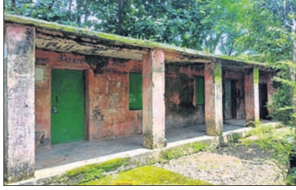
ରୁରୁଣା ଶ୍ରେଣୀଗୁଡ଼ି ସହ ବନ୍ୟା ଆଶ୍ରୟସ୍ଥଳୀରେ ପାଠପଢ଼ା ଚାଲିଛି।