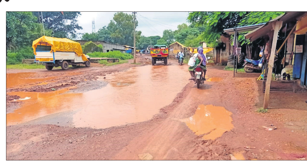
ଖାଲଖମା ଓ କାଠୁଅ ଭର୍ତ୍ତି ରାସ୍ତା।

ନବରଙ୍ଗପୁର ଜିଲା କୋଷାଗୁମୁକ୍ତା ବ୍ଲକ୍ ବରଗାଁ ଠାରୁ ବଡ଼ ଆନ୍ଧଡ଼ା ପର୍ଯ୍ୟନ୍ତ ରାସ୍ତା ବିପଜ୍ଜନକ ପାଲଟିଛି। ଗ୍ରାମ୍ୟ ଭଙ୍ଗାଝଙ୍ଗ ବିଭାଗ ପକ୍ଷରୁ ପ୍ରାଥମିକ ଗ୍ରାମ ସଡ଼କ ଯୋଜନାରେ ଏହି ରାସ୍ତା ନିର୍ମାଣ କରାଯାଇଥିଲା। ପ୍ରତ୍ୟେକ ବର୍ଷ ନାମକୁ ମାତ୍ର ମରାମତି କାର୍ଯ୍ୟ ହେଉଛି। ଖାଲଖମାଗୁଡ଼ିକୁ ଠିକ୍‌ଭାବେ ମରାମତି କରାଯାଉ ନ ଥିବାରୁ ସ୍ୱଚ୍ଛତା ମଧ୍ୟରେ ରାସ୍ତା ନଷ୍ଟ ହୋଇଛି। ଏହି ରାସ୍ତା ଛାଡ଼ିଗଡ଼ା ସାମାଜିକ ସଂଯୋଗ କରୁଥିବା ମୁଖ୍ୟ ରାସ୍ତା। ବିଭିନ୍ନ ସାମାଜିକ କାର୍ଯ୍ୟକ୍ରମ ପାଇଁ ଲୋକେ କରାବଳପୁର ସହର ଉପରେ ନିର୍ଭରଶୀଳ। ତେଣୁ ପ୍ରତ୍ୟେକ ଦିନ ଏହି ରାସ୍ତାଦେଇ ଶତାଧିକ ଯାନବାହନ ଯାତାୟତ କରିଥାଏ। ରାସ୍ତା ମଝିରେ ଖାଲ ଖମା ଯୋଗୁଁ ଅନେକ ସମୟରେ ଲୋକେ ବୁଲିବା ସମୟରେ ସୁରକ୍ଷା ନେବାକୁ ହେଉଛି। ବଡ଼