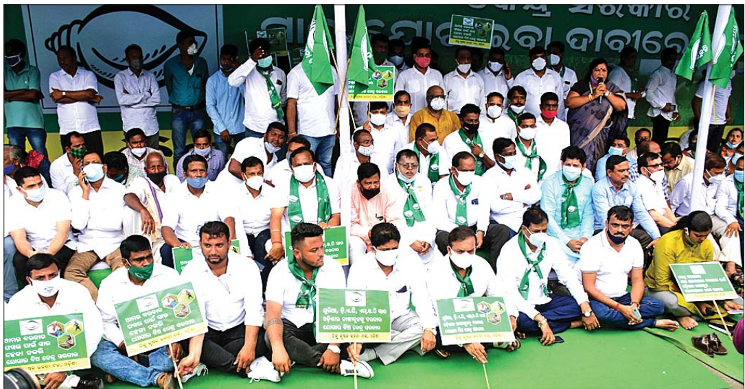
ରାଜଭବନ ସମ୍ମୁଖରେ ରୁଧିରୀ ବିଜୁ କୃଷକ ଜନତା ଦଳ ପକ୍ଷରୁ ଆରମ୍ଭ।