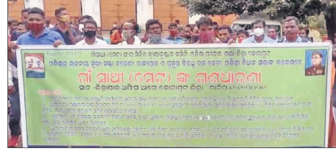
ଜିଲା ପ୍ରଶାସନକୁ ଦାବିପତ୍ର ଦେବାକୁ ଆସୁଥିବା ଗାଁସାଥୀମାନେ।

ଅଲୋ ୨୪ ଚାରିଖ ଦିନ ଜାତୀୟ ମନୁ ଫାଉଣ୍ଡେସନ୍ ଟ୍ରଷ୍ଟର ଅଧ୍ୟକ୍ଷତାରେ ନବରଙ୍ଗପୁର ଅଞ୍ଚଳରେ ଶ୍ରଦ୍ଧାପାଳନ କରାଯାଇଛି। ଏମିଡିଏ ସାର ୫ହଜାର ୯୬୭ ମେଡିକାଲ ଟର୍ମ ପରିବର୍ତ୍ତେ ୬ ହଜାର ୮୮୭.୨ ମେଡିକାଲ ଟର୍ମ ଅଧିକରାଇ ଚାଷୀଙ୍କୁ ସହାୟତା ଦେବାକୁ ଚାହୁଁଛନ୍ତି। ଚଳିତ ସେଇ ଟର୍ମ ଅଧିକରାଇ ଚାଷୀଙ୍କୁ ସହାୟତା ଦେବାକୁ ଚାହୁଁଛନ୍ତି। ନବରଙ୍ଗପୁର ଜିଲାକୁ ଚଳିତ ବର୍ଷ ୪୫ ହଜାର ମେଡିକାଲ ଟର୍ମ ସାର ଆବଶ୍ୟକ ରହିଥିବାବେଳେ ଏଯାବତ୍ ୨୫ ହଜାର ମେଡିକାଲ ଟର୍ମ ଫୁଲିଆ ସାର ଯୋଗାଣ ହୋଇ ଯାଇଛି। ଆହୁରି ୧୯ ହଜାର ମେଡିକାଲ