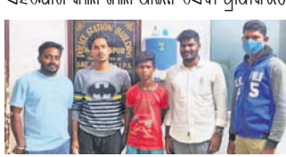
ନବରଙ୍ଗପୁର, ୧୮ (ସି.ପ୍ର.): ବାଟବଣା ହୋଇ ନବରଙ୍ଗପୁର ସହରକୁ ଚାଲି ଆସିଥିବା ଏକ ନାବାଳକଙ୍କୁ ଜିଲ୍ଲା ଆଇନ ସେବା ପ୍ରାଧିକାରୀ ସହଯୋଗରେ ଚାକ ଘରକୁ ପଠାଯାଇଛି।