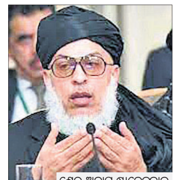
ଶେର ଅବାସ ସ୍ଥାନେକକାଲ

ବିଦେଶୀ ସୈନ୍ୟ ଆମେରିକୀୟ ସୈନ୍ୟମାନଙ୍କୁ ପଞ୍ଚମ ଦିନରେ ଉପସ୍ଥାପନ କରିବାକୁ ଆମେରିକୀୟ ସରକାରରେ କେଉଁମାନେ କି କି ପଦକ୍ଷେପ ଗ୍ରହଣ କରିବେ ତାହା ସ୍ପଷ୍ଟ ନୁହେଁ।