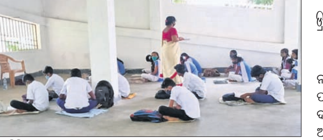
ବନ୍ୟା ଆଶ୍ରୟସ୍ଥଳୀରେ ପାଠପଢ଼ା ଚାଲିଛି।