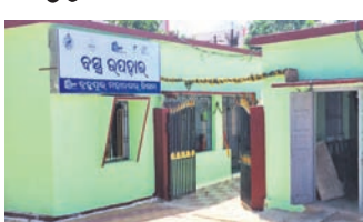
ବସ୍ତ୍ର ଉପହାର କେନ୍ଦ୍ର।

ବ୍ରହ୍ମପୁର ସହରରେ ଥିବା ଗରିବ ଓ ଅସହାୟଙ୍କୁ ସହାୟତାର ହାତ ବଢାଇବା ନିମନ୍ତେ ବ୍ରହ୍ମପୁର ମହାନଗର ନିଗମ ଅଭିନବ ଉପାୟ ଆରମ୍ଭ କରିଛି।