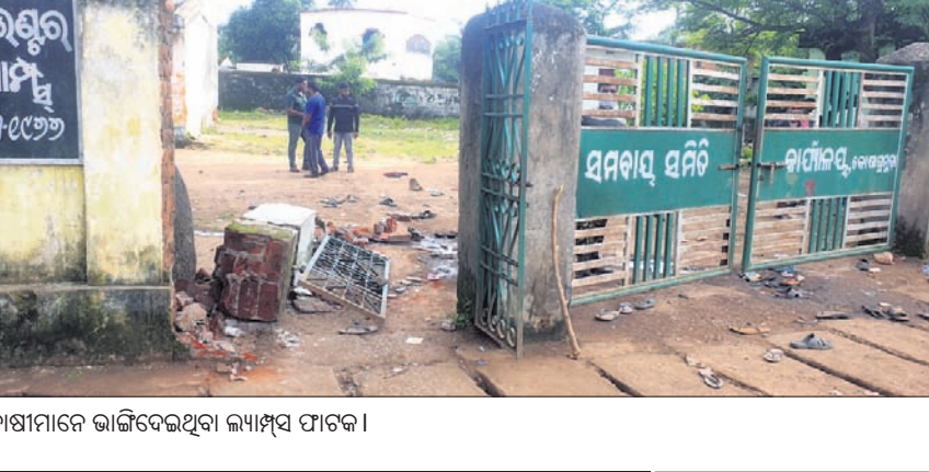
ଚାଷୀମାନେ ଭାଙ୍ଗିଦେଇଥିବା ଲ୍ୟାମ୍ପସ୍ତ ପାଟକ।