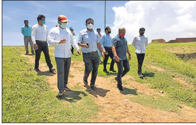
ସୋତାଗଡ଼ ପରିଦର୍ଶନ କରୁଛନ୍ତି ଜିଲ୍ଲାପାଳ ଓ ଅନ୍ୟ ଅଧିକାରୀ।

ଗଞ୍ଜାମ ସହରରେ ଥିବା ଐତିହାସିକ ସୋତାଗଡ଼ ଦୁର୍ଗ ଗୁରୁତ୍ଵାପୂର୍ଣ୍ଣ ବିକାଶ ପ୍ରକଳ୍ପ ପରିଦର୍ଶନ କରିଛନ୍ତି। ସୋତାଗଡ଼ ଦୁର୍ଗର ସୌନ୍ଦର୍ଯ୍ୟକରଣ କରାଯିବା ପାଇଁ ଆବଶ୍ୟକୀୟ ପର୍ଯ୍ୟଟନ କ୍ଷେତ୍ର ଭାବେ ପରିଗଣିତ କରିବା ନିମନ୍ତେ ଜିଲ୍ଲା ପ୍ରଶାସନ ଗୁରୁତ୍ଵ ଦେଇ ଆସୁଥିବା ବେଳେ କରୋନା ମହାମାରୀ ପାଇଁ କିଛି ମାସ ହେଲା କାମ ବନ୍ଦ ରହିଥିଲା। ପୂର୍ବରୁ ପ୍ରସ୍ତୁତ ହୋଇଥିବା କୁପ୍ରିଷ୍ଟ ଅନୁଯାୟୀ ଡିକାଲ ନିର୍ବାହୀ। ଏଥିସହ ଖୁବଶୀଘ୍ର କାମ ଆରମ୍ଭ କରିବାକୁ ଜିଲ୍ଲାପାଳ ପରାମର୍ଶ ଦେଇଛନ୍ତି। ଏଠାରେ ପୂର୍ତ୍ତ ପ୍ରାଣୀ, ପାର୍କ, ଆକର୍ଷଣୀୟ ପୁଖ୍ୟ ଦାଟକ, ବୋର୍ଡ଼ କ୍ଲବ ଆଦି ନିର୍ମାଣ କରାଯିବାକୁ ଲକ୍ଷ୍ୟ ରଖିଛି ଜିଲ୍ଲା ପ୍ରଶାସନ। ସୋତାଗଡ଼ ଦୁର୍ଗ ସୌନ୍ଦର୍ଯ୍ୟକରଣ କାର୍ଯ୍ୟ ଆରମ୍ଭ ହେବାକୁ ଥିବା ହେତୁ କୌଣସି ପର୍ଯ୍ୟଟକଙ୍କୁ