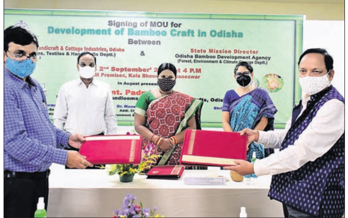
ମନ୍ତ୍ରୀ ପଦ୍ମନା ଦିଆନ ଓ ଅନ୍ୟମାନଙ୍କ ଉପସ୍ଥିତିରେ ବୁଝାମଣାପତ୍ର ସ୍ୱାକ୍ଷରଣ ହେଉଛି।