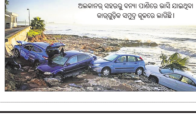
ଅଲକାନାର ସହରରୁ ବନ୍ୟା ପାଣିରେ ଭାସି ଯାଇଥିବା କାର୍ଗୁଡ଼ିକୁ ସମୁଦ୍ର କୁଳରେ ଲାଗିଛି।

ଅଲକାନାର, ୨୧: ସେନ୍‌ର ଉତ୍ତରପୂର୍ବ ସହର ଅଲକାନାରରେ ପ୍ରବଳ ବର୍ଷା ଯୋଗୁଁ ବନ୍ୟା ସ୍ଥିତି ଉତ୍ପତ୍ତି ହେବା ସହ କାରବାର ଠିକ୍ ହୋଇନାହିଁ। ମଙ୍ଗଳବାର ମଧ୍ୟ ଆବେଦନା ଭର୍ତ୍ତି ହୋଇଯାଇଛି। ସେନ୍‌ର ରାଜିରୁ ରୁଧିରା ସକାଳ ୬ଟା ପର୍ଯ୍ୟନ୍ତ ପ୍ରତି ବର୍ଷାପତନ ଜାଗାରେ ପ୍ରାୟ ୨୫୦ ଲିଟର ବର୍ଷା ପାଣି ଜମିରହିଛି। ଆକଳିକ ବନ୍ୟା ଯୋଗୁଁ ଅନେକ କାର୍ ଭୁଲି ସାଗରକୁ ଭାସିଯାଇଛି। ଉତ୍ତରପୂର୍ବରେ ପାଣି ସହ ଅଧିକ ଆବେଦନା ଭର୍ତ୍ତି ହୋଇଯାଇଛି। ସେନ୍‌ର ରାଜିରୁ ରୁଧିରା ସକାଳ ୬ଟା ପର୍ଯ୍ୟନ୍ତ ପ୍ରତି ବର୍ଷାପତନ ଜାଗାରେ ପ୍ରାୟ ୨୫୦ ଲିଟର ବର୍ଷା ପାଣି ଜମିରହିଛି। ଆକଳିକ ବନ୍ୟା ଯୋଗୁଁ ଅନେକ କାର୍ ଭୁଲି ସାଗରକୁ ଭାସିଯାଇଛି। ଉତ୍ତରପୂର୍ବରେ ପାଣି ସହ ଅଧିକ ଆବେଦନା ଭର୍ତ୍ତି ହୋଇଯାଇଛି। ସେନ୍‌ର ରାଜିରୁ ରୁଧିରା ସକାଳ ୬ଟା ପର୍ଯ୍ୟନ୍ତ ପ୍ରତି ବର୍ଷାପତନ ଜାଗାରେ ପ୍ରାୟ ୨୫୦ ଲିଟର ବର୍ଷା ପାଣି ଜମିରହିଛି। ଆକଳିକ ବନ୍ୟା ଯୋଗୁଁ ଅନେକ କାର୍ ଭୁଲି ସାଗରକୁ ଭାସିଯାଇଛି। ଉତ୍ତରପୂର୍ବରେ ପାଣି ସହ ଅଧିକ ଆବେଦନା ଭର୍ତ୍ତି ହୋଇଯାଇଛି। ସେନ୍‌ର ରାଜିରୁ ରୁଧିରା ସକାଳ ୬ଟା ପର୍ଯ୍ୟନ୍ତ ପ୍ରତି ବର୍ଷାପତନ ଜାଗାରେ ପ୍ରାୟ ୨୫୦ ଲିଟର ବର୍ଷା ପାଣି ଜମିରହିଛି। ଆକଳିକ ବନ୍ୟା ଯୋଗୁଁ ଅନେକ କାର୍ ଭୁଲି ସାଗରକୁ ଭାସିଯାଇଛି। ଉତ୍ତରପୂର୍ବରେ ପାଣି ସହ ଅଧିକ ଆବେଦନା ଭର୍ତ୍ତି ହୋଇଯାଇଛି। ସେନ୍‌ର ରାଜିରୁ ରୁଧିରା ସକାଳ ୬ଟା ପର୍ଯ୍ୟନ୍ତ ପ୍ରତି ବର୍ଷାପତନ ଜାଗାରେ ପ୍ରାୟ ୨୫୦ ଲିଟର ବର୍ଷା ପାଣି ଜମିରହିଛି। ଆକଳିକ ବନ୍ୟା ଯୋଗୁଁ ଅନେକ କାର୍ ଭୁଲି ସାଗରକୁ ଭାସିଯାଇଛି। ଉତ୍ତରପୂର୍ବରେ ପାଣି ସହ ଅଧିକ ଆବେଦନା ଭର୍ତ୍ତି ହୋଇଯାଇଛି। ସେନ୍‌ର ରାଜିରୁ ରୁଧିରା ସକାଳ ୬ଟା ପର୍ଯ୍ୟନ୍ତ ପ୍ରତି ବର୍ଷାପତନ ଜାଗାରେ ପ୍ରାୟ ୨୫୦ ଲିଟର ବର୍ଷା ପାଣି ଜମିରହିଛି।