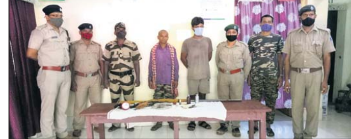
ଜବତ ବନ୍ଦୁକ ସହ ଗିରଫ ୨ ଅଭିଯୁକ୍ତ।