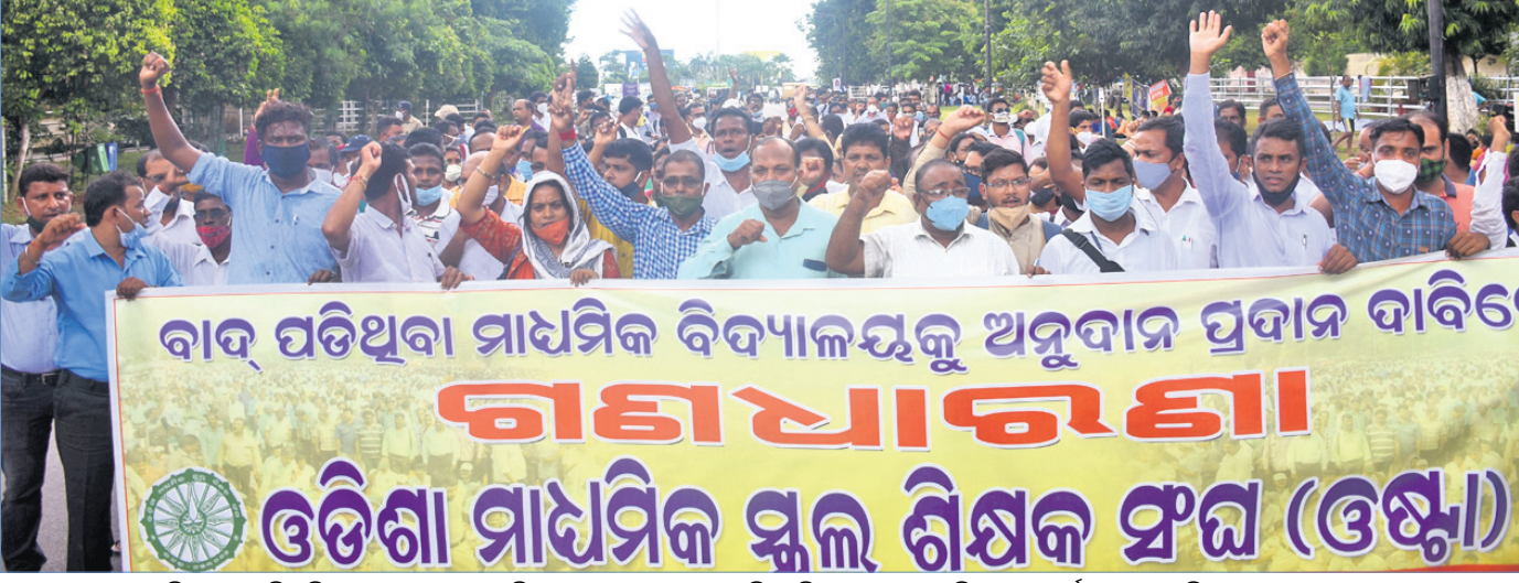
ଓଷା ପକ୍ଷରୁ ବାବ୍ ପଡ଼ିଥିବା ମାଧ୍ୟମିକ ବିଦ୍ୟାଳୟକୁ ଅନୁଦାନ ଦାବିରେ ଭୁବନେଶ୍ୱର ଲୋୟର ପିଏମ୍‌ଠାରେ ଗୁରୁବାର ବିଶୋଭ ପ୍ରଦର୍ଶନ କରାଯାଇଛି।

କରୁଛନ୍ତି। କେବଳ ରାଜ୍ୟରେ କ'ଣ ହୁଏତ ଆପତ୍ତିଗାର ପ୍ରସଙ୍ଗ ରହିଛି। ରାଜ୍ୟରେ ଆଉ କ'ଣ କିଛି ପ୍ରସଙ୍ଗ ନାହିଁ କି ବୋଲି ସେ ପ୍ରଶ୍ନ କରିଛନ୍ତି। ଅନ୍ୟପକ୍ଷରେ ବିରୋଧୀ ଦଳ ମୁଖ୍ୟ ସଚେତକ ମୋହନ ମାଝି କହିଛନ୍ତି, ରାଜ୍ୟରେ ଆଇନଶୃଙ୍ଖଳା ପରୀକ୍ଷିତ ବିପର୍ଯ୍ୟୟ ହୋଇପଡ଼ିଛି। ନିଜେ ଆଇନ ମନ୍ତ୍ରୀ ଆପତ୍ତିଗାର ମାମଲାରେ ଜଡ଼ିତ କୋର୍ଟ ଆଇନ ମନ୍ତ୍ରୀଙ୍କ ବିରୋଧରେ ତଦନ୍ତ ପାଇଁ ନିର୍ଦ୍ଦେଶ ଦେଇଛନ୍ତି। ଏହା କ'ଣ ପ୍ରସଙ୍ଗ ରୁହେଁ କି ବୋଲି ମୋହନ ପାଇତା ପ୍ରଶ୍ନ କରିଛନ୍ତି।