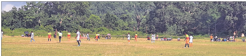
ଗୋଷ୍ଠୀ ଖେଳ ପଡ଼ିଆ।

କନ୍ୟପୁର, ୨୧ (ନି.ପ୍ର.): କନ୍ୟପୁର ନାବାଳିକାଙ୍କୁ ଅପହରଣ ଓ ବଳାଙ୍ଗୀର ମାମଲାରେ ଗଠନ ଥାନା ପୋଲିସ୍ ଜଣେ ଯୁବକଙ୍କୁ ଗିରଫ କରିଛି।