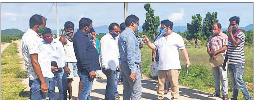
ଜଳସମ୍ପଦ ବିଭାଗ ଅଧିକାରୀଙ୍କ ସହ ଆଲୋଚନା କରୁଛନ୍ତି ଆର୍ଡିସି।

ପଦକ୍ଷେପ ନେଇ ନ ଥିବା ସମ୍ପର୍କରେ ବିସ୍ତାପିତ ପରିବାରର ମୁଖ୍ୟଆମାନେ ଆର୍ଡିସିଙ୍କ ଦୃଷ୍ଟି ଆକର୍ଷଣ କରିଥିଲେ।