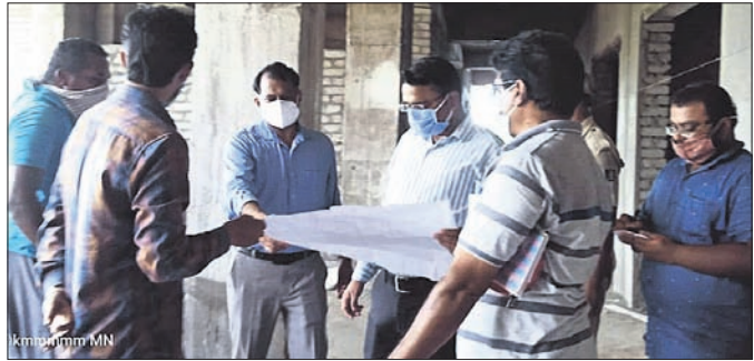
ମାର୍କେଟ କମ୍ପ୍ଲେକ୍ସ କାମ ଅନୁଧାନ କରୁଛନ୍ତି ବିଭିଏ ଉପାଧକ୍ଷ।

ଡକ୍ଟର ଭୁବନେଶ୍ୱରରେ ରହି ଏକ ଅନୁଷ୍ଠାନ ପକ୍ଷରୁ ପ୍ରଶିକ୍ଷଣ ପାଇ ଚୁନାମେଣ୍ଟ କରାଯାଇଥିଲେ ସୁଦ୍ଧା ତାହା କେବଳ କିଛି ମାଧ୍ୟମରେ ସୀମିତ ରହିଯାଇଛି।