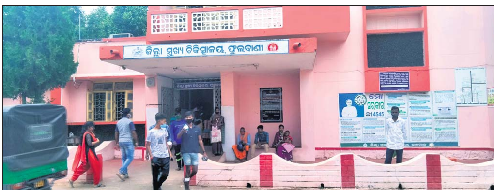
ଫୁଲବାଣୀ ଅଫିସ, ୨୧

କନ୍ଧମାଳ ଜିଲ୍ଲାରେ ରୋଗୀ ସେବା ବିପର୍ଯ୍ୟୟ। ଜିଲ୍ଲା ପୁଖ୍ୟ ଚିକିତ୍ସାଳୟ ଏବଂ ବାଲିଗୁଡ଼ା ଉପଖଣ୍ଡ ଚିକିତ୍ସାଳୟରେ ସବୁତରଳେ ଲାଗି ରହିଛି ଡାକ୍ତରଙ୍କ ଅଭାବ। ବାରମ୍ବାର ଦାବି ପରେ ସରକାର ନିମୁକ୍ତି ଦେଉଛନ୍ତି। ହେଲେ ଏହାର ଉଚିତ ରହସ୍ୟକୁ ଭେଦ କରି ହେଉନାହିଁ। ସରକାରଙ୍କ ଅଳ୍ପ ଡାକ୍ତରୀ ନିମୁକ୍ତିକୁ ନେଇ ଏବେ ଉଠିଛି ପ୍ରଶ୍ନ। କାରଣ କଲମରେ ପଦବୀ ପୂରଣ କରାଯାଉଛି, ମାତ୍ର ବାସ୍ତବ ଚିତ୍ର ଅଲଗା ନିମୁକ୍ତି ପାଉଥିବା ଡାକ୍ତର ଏଠାରେ ରହୁ ନାହାନ୍ତି। ଅନ୍ୟ ମେଡିକାଲରେ କାମ କରୁଛନ୍ତି ଫଳରେ ରୋଗୀ ସେବା ବିପର୍ଯ୍ୟୟ ହୋଇପାରୁଛି। ଗୋଟିଏ ସ୍ଥାନରେ ନିମୁକ୍ତି ଦେଇ, ରାତାରାତି ଅନ୍ୟ ସ୍ଥାନକୁ ଡେପୁଟେଶନରେ ପଠାଇ ଦେଉଛନ୍ତି। ୨୪ ଘଣ୍ଟା ମଧ୍ୟରେ ସରକାର ନିଷ୍ପତ୍ତି ଦେଲେ ଡାକ୍ତରୀ ପୁନଃ ଆବେଶକୁ କନ୍ଧମାଳାବାସୀ ସହଜରେ ଗ୍ରହଣ କରିପାରୁନାହାନ୍ତି। ସେହିପରି ସରକାରଙ୍କ ଏଭଳି ବ୍ୟବସ୍ଥା ନୀତି ଯୋଗୁ ମେଡିକାଲ ପ୍ରଶ୍ନାସନ ଖାଲି ଚିଠି ଲେଖି ବସିବାକୁ ବାଧ୍ୟ ହେଉଛନ୍ତି।