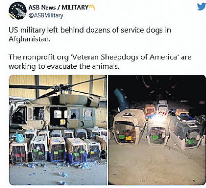
ASB News / MILITARY @ASBMilitary US military left behind dozens of service dogs in Afghanistan.