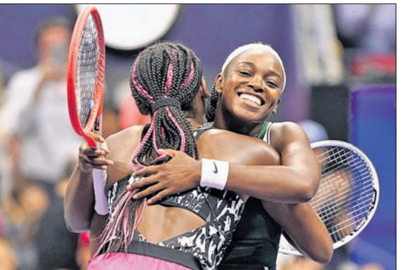
ବ୍ରହ୍ମପୁର ରାଉଣ୍ଡ ମ୍ୟାଚ ଜିତିବା ପରେ ନିଜ ଦେଶର ପ୍ରତିନିଧି ଭାବେ ଗର୍ବିତ ପରାସ୍ତ କରିବା ପରେ ତାଙ୍କୁ ଅଭିନନ୍ଦନ ପ୍ରଦାନ କରୁଥିବା ଅନେକଙ୍କର ଷ୍ଟୋଏନ୍ ବିହେଟ୍ଟି।

ବୋଟିକ୍ ଭାନ୍ କାଷ୍ଟସ୍‌କୃ ବିପର୍ଯ୍ୟୟ ପ୍ରତିଯୋଗିତାରେ ତାଙ୍କର ଦୃଷ୍ଟି କରିଛନ୍ତି। ଏକ ଗ୍ରାଣ୍ଡସ୍ଲାମ ଏହା ହେଉଛି ଶ୍ରେଷ୍ଠ ପ୍ରଦର୍ଶନ।