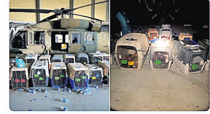
The nonprofit org 'Veteran Sheepdogs of America' are working to evacuate the animals.

କାବୁଲ, ୨।୯-ଆମେରିକା-ତାଲିବାନ୍ ମଧ୍ୟରେ ଚାଲିଥିବା ଦୀର୍ଘ ବୁଲ୍ ବନ୍ଧନର ଯୁଦ୍ଧରେ ପଡ଼ିଛି ଯବାନିକା। ତେଣୁ କାଉନ୍ ପୂର୍ବରୁ ଅଗଷ୍ଟ ୩୦ ବିଳମ୍ବିତ ରାତିରେ ଆଫଗାନୀସ୍ତାନରେ ବିଦାୟ କଣ୍ଠାକରି ଆମେରିକା। ବହୁ କୋଟି ଟଙ୍କାର ଅତ୍ୟାଧୁନିକ ଅସ୍ତ୍ରଶସ୍ତ୍ର, ଯୁଦ୍ଧ ବିମାନ ଫ୍ରେଟ୍ ଅଣ୍ଡିଆ ଥିବାବଦ୍ଧେ ସମସ୍ତ ପାଇଲାନି ପୁଅବାର କ୍ଷମତାଶାଳୀ ରାଷ୍ଟ୍ର, ସାହାର ଏବେ ସ୍ୱାଧୀନତା ପାଇବାକୁ ଚାଲିଯାଇଛି। ହେଲେ ଆମେରିକା ଫ୍ରେଟିବା ପୂର୍ବରୁ ସେନାରେ ସାମିଲ ବିଶ୍ୱସ୍ତ କୁକୁରମାନଙ୍କୁ ଉଦ୍ଧାର କରି ଆଣିବାକୁ ଉଚିତ ମଣିବା। ଫଳରେ ଯୁଦ୍ଧସମୟ ଆମେରିକାନ୍‌ଙ୍କୁ ବହୁ ଚାଲିମୁଣ୍ଡ କୁକୁର ପରିତ୍ୟକ୍ତ ହୋଇପଡ଼ିଛି। ସେମାନଙ୍କୁ ଉଦ୍ଧାର କରିବାକୁ ଆମେରିକାନ୍ ସ୍ୱେଚ୍ଛାସେବୀ ଅନୁଷ୍ଠାନ 'ଭେଟେରାନ