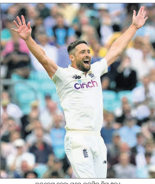
ଉଲ୍ଲେଖ ନେବା ପରେ ଉଲ୍ଲେଖିତ କ୍ରିସ୍ ଓହ୍ଲ।

ଲଣ୍ଡନ, ୨୧୯: ଓଭାଲ ଗ୍ରାଉଣ୍ଡରେ ଗୁରୁବାର ଆରମ୍ଭ ହୋଇଥିବା ଇଂଲଣ୍ଡ ବିପକ୍ଷ ୪ର୍ଥ ଜିଙ୍କେଟ ଟେଷ୍ଟରେ ଭାରତର ବ୍ୟାଟିଂ ବିପର୍ଯ୍ୟୟ ଘଟିଛି। ଚିନ୍ତା ଇଣ୍ଡିଆ ପ୍ରଥମ ଇନିଂସରେ ୧୯୧ ରନ କରି ଅଲଆଉଟ ହୋଇଛି। ୧୯୯ ରନ କରି ପ୍ରଥମେ ବ୍ୟାଟିଂ ଆମନ୍ତ୍ରଣ ପାଇଥିବା ଭାରତ ୨୮ ରନ ମଧ୍ୟରେ ଦୁଇ ଓପନରଙ୍କ ଉଲ୍ଲେଖ ହରାଇ ବ୍ୟାଟ୍‌ସ୍ମ୍ୟୁଟକୁ ଚାଲି ଯାଇଥିଲା। ରୋହିତ ଶର୍ମା ୧୧ ଓ କୋହେଶ ରାହୁଲ ୧୭ ରନ କରି ପ୍ୟାସିଲିୟନ ଫେରିଥିଲେ। ଚେଟେଶ୍ୱର ପୂଜାରୀ ମାତ୍ର ୪ ରନ କରିଥିଲେ। ଅଧିକାରୀଙ୍କ ବିରାଟ କୋହଲି ଅର୍ଦ୍ଧଶତକୀୟ ଇନିଂସ ଖେଳିଥିଲେ ହେଁ ଅନ୍ୟମାନଙ୍କ ବିଫଳତା ଯୋଗୁ ୧୨୭ ରନ ମଧ୍ୟରେ ଦଳ ୭ଟି ଉଲ୍ଲେଖ ହରାଇଥିଲା। କୋହଲି ୯୬ ବଲ୍‌କୁ ୮ ଚୋକା ସହାୟତାରେ ୫୦ ରନ କରିଥିବାବେଳେ ରବୀନ୍ଦ୍ର ଜାଡୋକା ୧୦, ଅଜିଙ୍କ୍ୟ ରାହାନେ ୧୪ ଓ ରିଷଭ ପଟ୍ଟ ୯ ରନ କରିବାକୁ ସମର୍ଥ ହୋଇଥିଲେ। ଶେଷଭାଗରେ ଶାର୍ଦ୍ଧୁଳ ଠାକୁର ଷ୍ଟ୍ରିକ୍‌ସ୍ ଇନିଂସ ଖେଳି ଅର୍ଦ୍ଧଶତକ ହାସଲ କରିଥିଲେ। ଇଂଲଣ୍ଡ ଭାରତ ୨୦୦ ରନ ସର୍ତ୍ତ କରିପାରି ନ ଥିଲା। ଶାର୍ଦ୍ଧୁଳ ୩୬ ବଲ୍‌କୁ ୬ ଚୋକା ଓ ୩ ଛକା ସହାୟତାରେ ସର୍ବାଧିକ