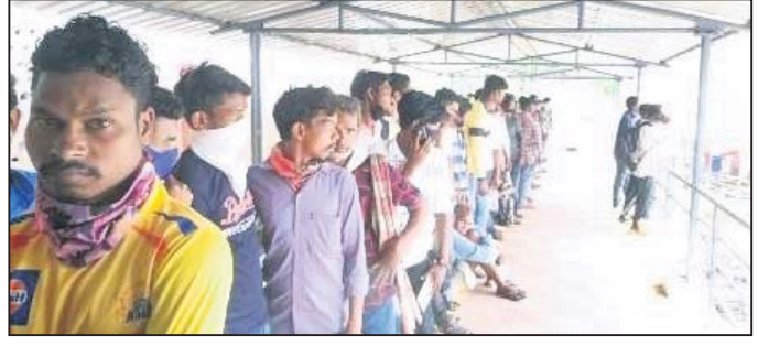
ଟିକା ପାଇଁ ଲମ୍ବା ଯାତ୍ରା।

ଲୋକଙ୍କୁ ଟିକା ନ ଦେବାକୁ କହିଥିଲେ। କାରଣ ସେମାନେ ପ୍ରଥମ ଡୋଜ ନେବା ପରେ ଦ୍ଵିତୀୟ ଡୋଜ ନେବାକୁ ଜିଲ୍ଲାକୁ ଆସୁନାହାନ୍ତି। ଏପରେ ମୋହନା ଅଞ୍ଚଳରେ ଲୋକେ ଟିକା ପାଇ ପାରୁନାହାନ୍ତି। ଟିକା ନ ପାଇବାରୁ ଗଞ୍ଜାମକୁ ଆସିଥିବା ଲୋକଙ୍କ ମଧ୍ୟରେ ଉତ୍ତେଜନା ବେଶୀପାଇଥିଲା। ସେମାନେ ବିଡ଼ଓଙ୍କୁ ଦେଖା କରିବାକୁ ଯାଇଥିଲେ। ଅନ୍ୟପକ୍ଷରେ ଏ ନେଇ