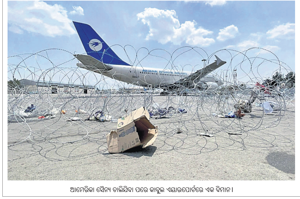
ଆମେରିକା ସୈନ୍ୟ ଚାଲିଯିବା ପରେ କାତାର ଏୟାରପୋର୍ଟରେ ଏକ ବିମାନ।

୨୦୨୦ ଫେବୃଆରୀ ୨୯ରେ ଆମେରିକାର ତତ୍କାଳୀନ ରୁଷ୍ଟ୍ର ପ୍ରଶାସନ ଓ ଆଫଗାନିସ୍ତାନର ଆତଙ୍କବାଦୀ ସଂଗଠନ ତାଲିବାନ୍ ମଧ୍ୟରେ ଦୋହାରେ ଏକ ଆତିଥାସିକ ରୁଚ୍ଛି ସାକ୍ଷରତ ହୋଇ ପରେ