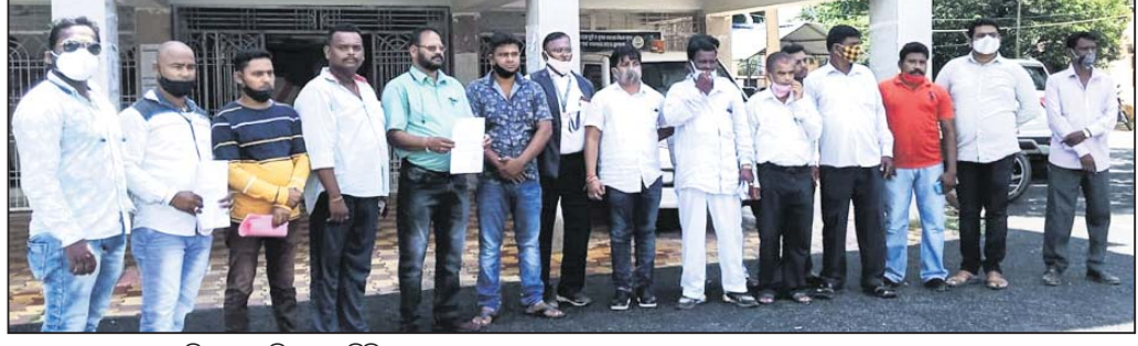
ସ୍ଵାସ୍ଥ୍ୟକେନ୍ଦ୍ର ପ୍ରଦାନ କରିବାକୁ ଆସିଥିବା ପ୍ରତିନିଧି ଦଳ।

ପର୍ଯ୍ୟନ୍ତ ଏହି ବ୍ୟବସ୍ଥା କରାଯାଇ ନ ଥିବାରୁ ଗଞ୍ଜାମବାସୀ ଯୋଗ ପ୍ରକାଶ କରିଛନ୍ତି। ଛତ୍ରପୁର କଲେଜ ଛକ ଏବଂ ତିଆରିତ୍ୟ ଛକ ଠାରେ ପ୍ରତିବର୍ଷ ବହୁ ସଂଖ୍ୟାରେ ଦୁର୍ଘଟଣା ଘଟୁଛି। ସରକାର ଓ ପ୍ରଶାସନ ଏ ଦିଗରେ ଏବେ ଓଡ଼ିଶାର ଖୋର୍ଦ୍ଧା ଜିଲ୍ଲାରୁ ଆରମ୍ଭ କରି ଗଞ୍ଜାମ ପୂର୍ବରୁ ପର୍ଯ୍ୟନ୍ତ ଏହା କରାଯାଉଛି। ପୂର୍ବରୁ ଠାରେ ଗଞ୍ଜାମ-ଆଜ୍ଞା ସାମାଜ