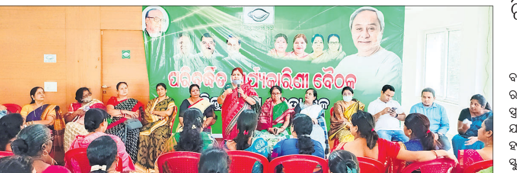
ବୈଠକରେ ବିଭିନ୍ନ ମହିଳା ଜନତା ଦଳର କର୍ମକର୍ତ୍ତା