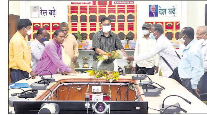
ଖଡ଼ଗପୁର ରେଳ ଷ୍ଟେସନ୍ ପ୍ରବନ୍ଧକଙ୍କୁ ଭେଟି ବୁଦ୍ଧିଜୀବୀମାନେ ଆଲୋଚନା କରୁଛନ୍ତି।