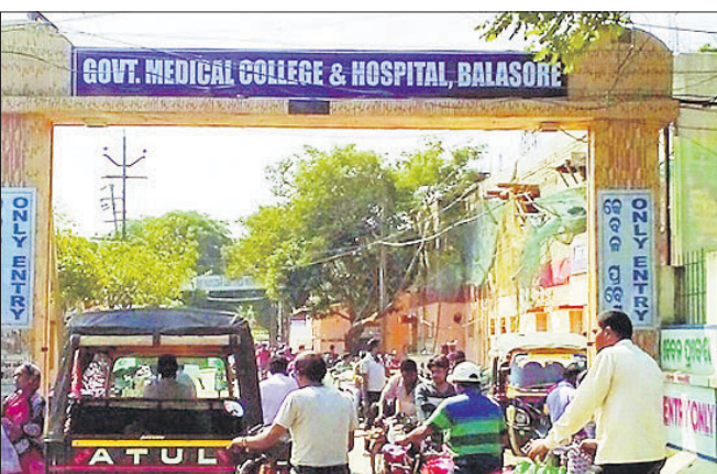
ବାଲେଶ୍ୱର ମେଡ଼ିକାଲ କଲେଜ ଆଶ୍ରୟ ପିଲା

ଜିଲ୍ଲାରେ ମୋଟ ବିଭିନ୍ନ ବିଭାଗ ପାଇଁ ୩୭୩ ଡାକ୍ତର ପଦ ରହିଛି। ଏବେ ୨୧୪ ଡାକ୍ତର କାର୍ଯ୍ୟରତ ଥିବା ବେଳେ ଆହୁରି ୧୫୯ ପଦ ଖାଲି ପଡ଼ିଛି। ଏଭଳି ସ୍ଥିତିରେ ଗୋଷ୍ଠୀ ସ୍ୱାସ୍ଥ୍ୟକେନ୍ଦ୍ର ଓ ଫଳରେ ଉଚ୍ଚତମ ସ୍ୱାସ୍ଥ୍ୟସେବା ପାଇବାକୁ ଫକୀରମୋହନ ଭେଷଜ ମହାବିଦ୍ୟାଳୟ ଚିକିତ୍ସାଳୟରେ ସ୍ୱାସ୍ଥ୍ୟସେବା ବିପର୍ଯ୍ୟସ୍ତ ହୋଇପାରିଛି। ଜିଲ୍ଲାରେ ଭେଷଜ ମହାବିଦ୍ୟାଳୟ ପ୍ରତିଷ୍ଠା ହେବାଠାରୁ ସଦୃଶ ଚିକିତ୍ସାଳୟରେ ରୋଗୀଙ୍କ ସଂଖ୍ୟା ବୃଦ୍ଧି ପାଇବାରେ ଲାଗିଛି। ଜିଲ୍ଲାର ବିଭିନ୍ନ ଅଞ୍ଚଳ ସମେତ ପଶ୍ଚିମବଙ୍ଗ ଓ ମୟୂରଭଞ୍ଜରୁ ପ୍ରତିଦିନ ଅହେକ ହଜାରରୁ ଅଧିକ ରୋଗୀ ମୁଖ୍ୟ ଚିକିତ୍ସାଳୟ ଦର୍ଶନପାଇଁ ଆସୁଛନ୍ତି। ଏଠାରେ ଥିବା ଡାକ୍ତରଙ୍କୁ ଦେଖାଇ ରୋଗୀମାନେ ଔଷଧ ଓ ଚିକିତ୍ସା ନେଉଛନ୍ତି। କଟକ ସ୍ଥିତିରେ ଥିବା ୪ ଶହରୁ ଅଧିକ ରୋଗୀ ଖର୍ଚ୍ଚରେ ଭର୍ତ୍ତି ହେଉଛନ୍ତି। ଗୁରୁତ୍ୱପୂର୍ଣ୍ଣ କଥା ହେଲା, ଓ ଭୁବନେଶ୍ୱରକୁ ସ୍ଥାନାନ୍ତର କରାଯାଇଛି। ମୁଖ୍ୟ ଚିକିତ୍ସାଳୟ ଏକପ୍ରକାର ରୋଗୀ ସ୍ଥାନାନ୍ତର କେନ୍ଦ୍ର ପାଲଟିଛି।