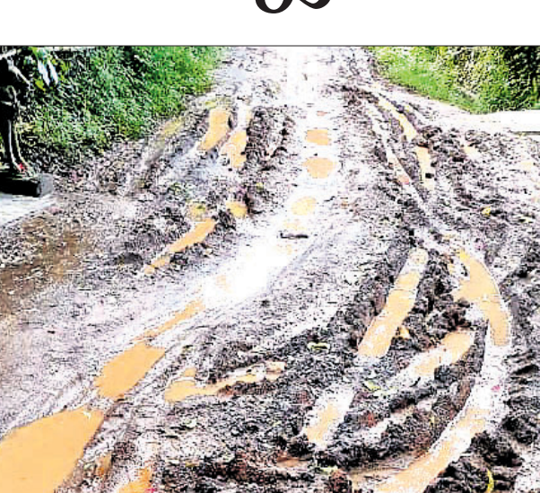
ପାଣି, କାଦୁଅରେ ଭରି ହୋଇଥିବା ରାସ୍ତା।

ଛୋଟ ପିଲାମାନେ ପାଣି କାଦୁଅ ରାସ୍ତାରେ କହି କଷ୍ଟରେ ଯାତାୟତ କରନ୍ତି। ଖର୍ଚ୍ଚ ବିଦ୍ୟାଳୟ ଓ ଅଜ୍ଞାନତା କେନ୍ଦ୍ରକୁ ଛୋଟ