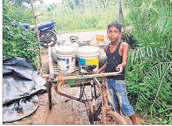
ଜଣେ ବାଳକ ଟ୍ରଲିରେ ପାନୀୟ ଜଳ ଆଣୁଛନ୍ତି।