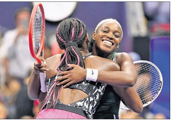
ଦ୍ଵିତୀୟ ରାଉଣ୍ଡ ମ୍ୟାଚ ଜିତିବା ପରେ ନିଜ ଦେଶର ପ୍ରତିଦ୍ଵନ୍ଦ୍ଵୀ କୋକୋ ଗାୟଙ୍କୁ ପରାସ୍ତ କରିବା ପରେ ତାଙ୍କୁ ଅଭିନନ୍ଦନ କରୁଛନ୍ତି ସୁନ୍ଦରାସ୍ତ୍ରୀ ଅନେକାର ଷ୍ଟ୍ରେକ୍ସ୍ ଷ୍ଟ୍ରେକ୍ସ୍ ।