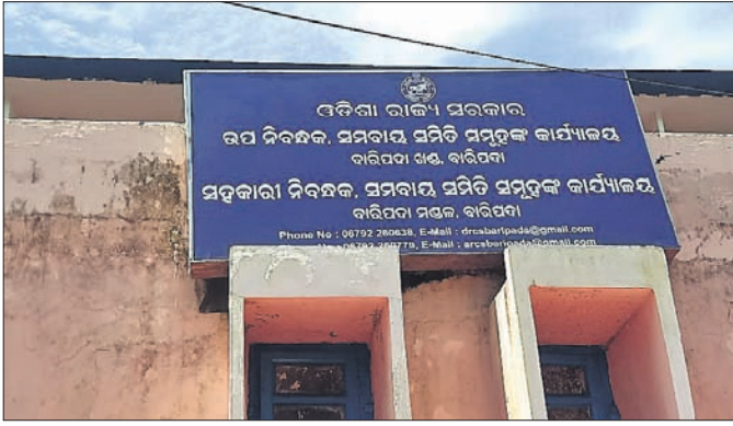
ସହକାରୀ ନିବନ୍ଧକ କାର୍ଯ୍ୟାଳୟ।

କିଲିରେ ରିହାତି ସାର ଉଦ୍ଦିଷ୍ଟ, ବାରିପଦା, ବାଙ୍ଗାରିପୋଷିରେ ଗୋଦାମ ଗୃହ ନିର୍ମାଣ ହାବି