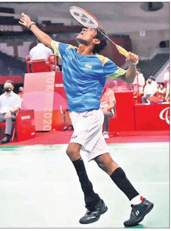
ଦ୍ଵିତୀୟ ରାଉଣ୍ଡ ମ୍ୟାଚ ଅବସରରେ ପ୍ରମୋଦ ଭଗତ ।