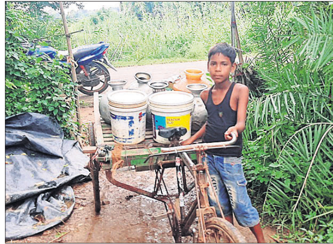
ଜଣେ ବାଳକ ଟ୍ରଲିରେ ପାନୀୟ ଜଳ ଆଣୁଛନ୍ତି।