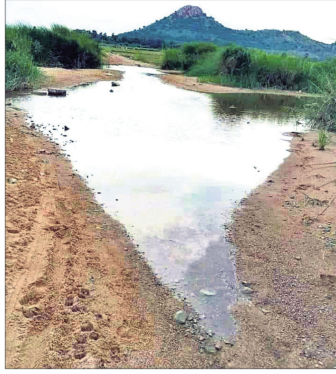
ରଷିକୁଲ୍ୟାରେ ଭାରତ ମାନଚିତ୍ର ଭ୍ରମ ସୃଷ୍ଟି କରୁଥିବା ଭାଲରାଲ ଫଟୋ।

ଖଣ୍ଡପୀଠରେ ଏହି ସମସ୍ତ ପ୍ରକ୍ରିୟାକୁ ସୁପ୍ରିମକୋର୍ଟକୁ ସ୍ଥାନାନ୍ତର ପାଇଁ କେନ୍ଦ୍ର ପକ୍ଷରୁ ଆବେଦନ କରାଯାଇଥିବା ସେ କହିବା ପରେ ୬ ସପ୍ତାହ ପରେ ଏହାର ଶୁଣାଣି ପାଇଁ ଖଣ୍ଡପୀଠ ରାଜି ହୋଇଛନ୍ତି। ଗତବର୍ଷ ନିଜାମୁଦିନ ମରଜକରେ ଧର୍ମାୟ ସମାବେଶକୁ ନେଇ ଫେଡ଼ ନ୍ୟୁଜ ପ୍ରକାଶ ପାଇଥିଲା। ଏଭଳି ମିଛ ଖବର ପ୍ରସାରଣ ବନ୍ଦ କରିବା ଏବଂ ଏଥିପାଇଁ ଯେଉଁମାନେ ଦାୟୀ, ସେମାନଙ୍କ ବିରୋଧରେ କାର୍ଯ୍ୟାନୁଷ୍ଠାନ ଗ୍ରହଣ ପାଇଁ କେନ୍ଦ୍ର ସରକାରଙ୍କୁ ନିର୍ଦ୍ଦେଶ ଦେବା ଲାଗି ଜାମିଆତ୍ ଉଲେମା-ଇ-ହଦ୍ ସମେତ ବିଭିନ୍ନ ସଂସ୍ଥା ଓ ବ୍ୟକ୍ତିଗଣଙ୍କୁ ପକ୍ଷରୁ ସର୍ବୋଚ୍ଚ ଅଦାଲତରେ ଆବେଦନ କରାଯାଇଥିଲା।