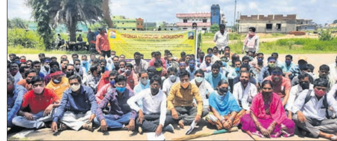
ଧାରଣାରେ ବସିଥିବା ଗାଁ ସାଥୀ ।