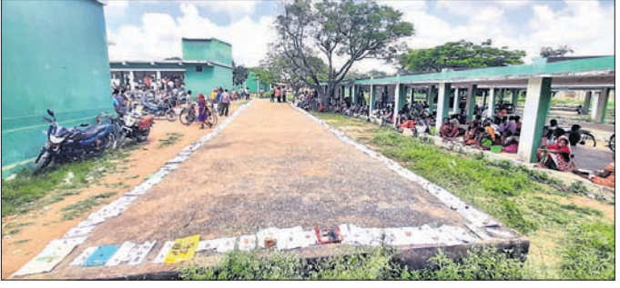
ନବରଙ୍ଗପୁର ନିୟନ୍ତ୍ରଣ କଳା କମିଟି ପରିଷଦରେ ରଣାଯାଇଥିବା ଆଧାର କାର୍ଡ ।

ଗୋଟିଏ ବସ୍ତା ଯୁରିଆ ପାଇଁ ଧାଡ଼ି କରିଛି ଆଧାର କାର୍ଡ । ଚପାପି ମିଳୁନି ଆବଶ୍ୟକ ଅନୁମୋଦନ ପାଇଁ । ୪ ବର୍ଷରୁ ଉର୍ଦ୍ଧ୍ୱ ଜମି ଥିବା ଚାଷୀଙ୍କୁ କେବଳ ଗୋଟିଏ ପ୍ୟାକେଟ ସାର ଦିଆଯାଇଛି ।