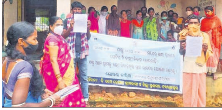
ନବରଙ୍ଗପୁର ଜିଲାପାଳ ସାକ୍ଷରତା ଓ ସଚେତନତା ଅଭାବକୁ ବାଲ୍ୟ ବିବାହ ଭଳି କଳକର ପ୍ରଥା ଆଦି ମଧ୍ୟ କାର୍ଯ୍ୟକାରୀ କରାଯାଇଛି।

ନବରଙ୍ଗପୁର ଜିଲାପାଳ ଅଧିକାରୀଙ୍କୁ ଗ୍ରାମବାସୀଙ୍କୁ ସଚେତନ କରିବା ପାଇଁ ପୋଡ଼ାପାଟାରେ ଜନସମ୍ପର୍କ ଶିବିର ଅନୁଷ୍ଠାନ କରାଯାଇଛି।