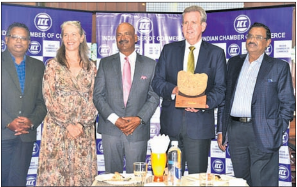
ଆରବି ପକ୍ଷରୁ ଅଷ୍ଟ୍ରେଲିଆ ଉଦ୍ଘାଟନୀୟ ସମ୍ମାନ

ଦ୍ଵିପାକ୍ଷିକ ସମ୍ପର୍କ ଦୃଢ଼ୀକରଣ ଲାଗି ଆହ୍ଵାନ... ଗୁଆଁଜିଆ, ୨୧