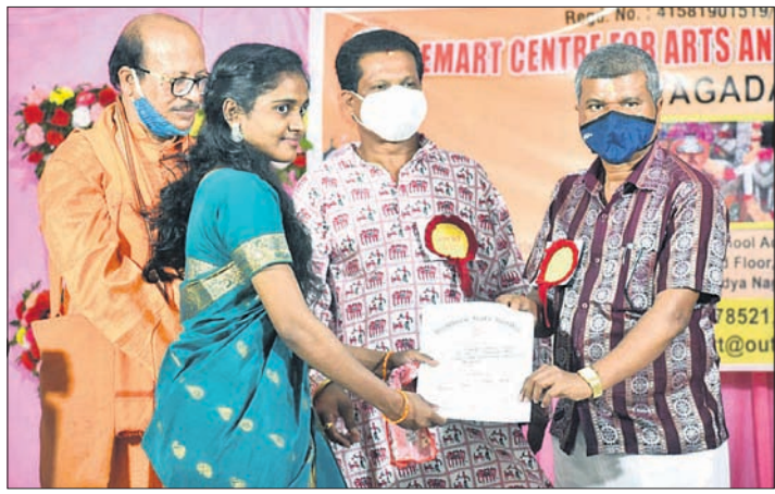
ଅତିରିକ୍ତ ଜିଲାପାଳ ଜଣେ କଳାକାରଙ୍କୁ ପ୍ରମାଣପତ୍ର ପ୍ରଦାନ କରୁଛନ୍ତି ।

କୋଭିଡ ପରିସ୍ଥିତିରେ ସାମାନ୍ୟ ସୁଧାର ଆସିବ ପରେ ଏମିତିକି ସେଥିରେ ଫଳାଫଳିତ ହେବ ଏହି କଳକର ଅଫ ଇଣ୍ଡିଆ (ଇସିଏସିଆଇ) ରାୟଗଡ଼ା ଶାଖା ଅନୁଷ୍ଠାନ ପୁଣି ଖୋଲିଛି।