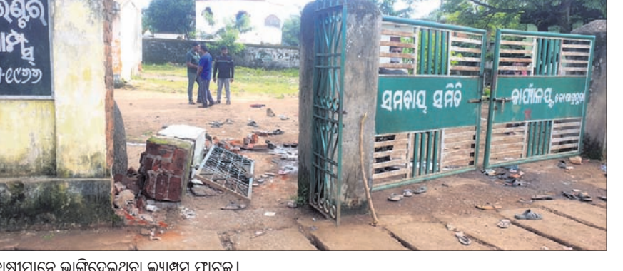
ଚାଷୀମାନେ ଭାଙ୍ଗିଦେଇଥିବା ଲ୍ୟାମ୍ପସ ପାଟକ।

ନବରଙ୍ଗପୁର ଜିଲ୍ଲା କୋଷାଗୁମୁଡ଼ା ସଦର ମହକୁମାସ୍ଥିତ ଲ୍ୟାମ୍ପସରେ ଗୁରୁବାର ସାର ନ ମିଳିବାରୁ ନେଇ ଚାଷୀ ଉତ୍ତେଜନା ଦେଖାଦେଇଛନ୍ତି। ସାର ନ ପାଇ ଚାଷୀମାନେ ଲ୍ୟାମ୍ପସ ପାଟକକୁ ଛଗାପଥର ମାରିବା ସହ ଚାଷୀକୁ ଭାଙ୍ଗିଦେଇଥିଲେ। ପୋଲିସ୍ ଉଭୟ ଚାଷୀଙ୍କୁ ଘରଢ଼ାଳିଛି। ଗୁରୁବାର ସକାଳୁ କୋଷାଗୁମୁଡ଼ା ଲ୍ୟାମ୍ପସରେ ସାର ପାଇଁ ଚାଷୀ ଭିଡ଼ ଜମାଇ ଥିଲେ। ଭୋର ଚାରିଟା ବେଳୁ ଆସି ଲ୍ୟାମ୍ପସ ଆଗରେ ଭିଡ଼ ଜମାଇଥିଲେ ମଧ୍ୟ ସେମାନଙ୍କୁ ଗୋଟିଏ ବସ୍ତା ସାର ମିଳି ନ ଥିଲା। କେତେଜଣ ଚାଷୀ ଲ୍ୟାମ୍ପସ କାଜି ଡେଇଁ ଭିତରକୁ ଯାଇଥିବା ବେଳେ ପୋଲିସ୍ ପକ୍ଷରୁ ମାଡ଼ ମରାଯାଇଥିଲା। ଏହାପରେ ଚାଷୀମାନେ ଉଭୟ ଛୋଇ ଲ୍ୟାମ୍ପସ ଉପରକୁ ଟେକା ପଥର ପିଲିଥିଲେ। ଚାଷୀମାନେ ଲ୍ୟାମ୍ପସ ଗେଟ କୁ ଭାଙ୍ଗି ଦେଇଛନ୍ତି। ଏହାପରେ ପରିସ୍ଥିତିଶାନ୍ତ ପଡ଼ିଥିବାବେଳେ ଲ୍ୟାମ୍ପସରେ ପୋଲିସ୍ ପୁରୁଷ ନ ଯାଇଛନ୍ତି। ଲ୍ୟାମ୍ପସକୁ ୧୨ଶହ ବସ୍ତା ସାର ଆସିଥିଲା। ମଙ୍ଗଳବାର ଓ ବୁଧବାର ଚାଷୀଙ୍କୁ ତାହା ଦିଆଯିବ ବୋଲି ଲ୍ୟାମ୍ପସ ଏପରି ବିନାୟକ ସଫଟ୍ଟା କହିଛନ୍ତି। ପ୍ରକାଶ ଯେ, ମଙ୍ଗଳବାର ଚାଷୀମାନେ ସାର ନ ମିଳିବାରୁ ଲ୍ୟାମ୍ପସରେ ତାଳା ଠୁଳିଥିଲେ। ଏଥିସହ ସେମାନେ ଗାୟାର କାଳି ପୁଣ୍ୟ ରାସ୍ତା ମଧ୍ୟ ବନ୍ଦ କରି ବିରୋଧ ପ୍ରଦର୍ଶନ କରିଥିଲେ।