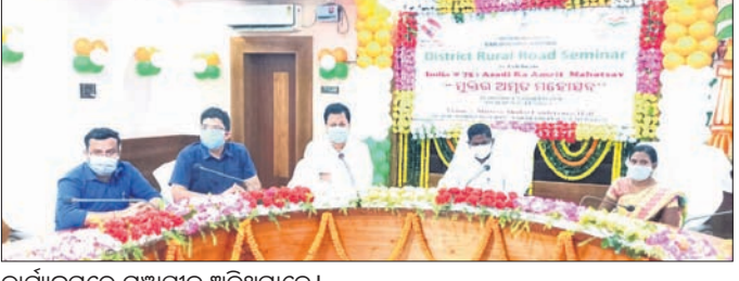
କାର୍ଯ୍ୟକ୍ରମରେ ମହାସାଧନ ଅତିଥିମାନେ ।

ନବରଙ୍ଗପୁର ମିଶନ ଶକ୍ତି ସମ୍ମିଳନୀରେ 'ଆଜାଦି କି ଅମୃତ ମହୋତ୍ସବ' କାର୍ଯ୍ୟକ୍ରମ କରାଯାଇଛି । ପ୍ରଧାନମନ୍ତ୍ରୀ ଗ୍ରାମ ସଦ୍‌ବଳ ଯୋଜନାରେ ଆଡ଼ି ବିଭାଗ ସମସ୍ତ ଗ୍ରାମକୁ ଚାନ୍ଦି ସଂଯୋଗ କରୁ, ଯେପରି ସବୁ ଗାଁକୁ ଆମୁଲାନୁ ଗଡ଼ିପାରିବ ବୋଲି କାର୍ଯ୍ୟକ୍ରମରେ ଯୋଗଦେଇ ଏମ୍ପି ରମେଶ ଚନ୍ଦ୍ର ମାଟି କହିଛନ୍ତି ।