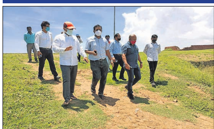
ପୋଡ଼ାପାଟା ପରିଦର୍ଶନ କରୁଛନ୍ତି ଜିଲାପାଳ ଓ ଅନ୍ୟ ଅଧିକାରୀ ।

ଖଜୁରିପୁଟ ପଞ୍ଚାୟତରାଜର ଅଧିକାରୀଙ୍କୁ ଗ୍ରାମବାସୀଙ୍କୁ ସଚେତନ କରିବା ପାଇଁ ପୋଡ଼ାପାଟାରେ ଜନସମ୍ପର୍କ ଶିବିର ଅନୁଷ୍ଠାନ କରାଯାଇଛି।