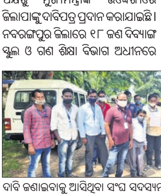
ଦାବି ଗଣାଉଥିବା ଅଧିକାରୀଙ୍କୁ ସଂଘ ସଦସ୍ୟମାନେ ।

ନବରଙ୍ଗପୁର ଜିଲାପାଳ ଅଧିକାରୀଙ୍କୁ ଗ୍ରାମବାସୀଙ୍କୁ ସଚେତନ କରିବା ପାଇଁ ପୋଡ଼ାପାଟାରେ ଜନସମ୍ପର୍କ ଶିବିର ଅନୁଷ୍ଠାନ କରାଯାଇଛି।