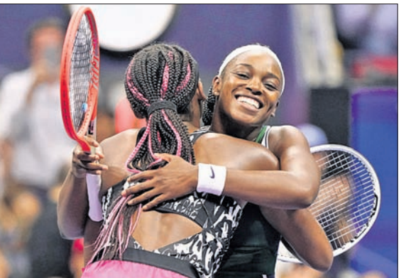
ବ୍ରତୀୟ ରାଉଣ୍ଡ ମ୍ୟାଚ ଚିତ୍ରଣ ପରେ ବିଶ୍ୱର ୨ ନମ୍ବର ମାନ୍ୟତାପ୍ରାପ୍ତ ଅନିସା ସାବାଲେଙ୍କା ସିତ୍ସିପାସ୍ ପରବର୍ତ୍ତୀ ରାଉଣ୍ଡରେ ସମ୍ପାଦନା କରିଛନ୍ତି।

ଲୁୟସ୍, ୨୧୯: ବିଶ୍ୱର ୨ ନମ୍ବର ମାନ୍ୟତାପ୍ରାପ୍ତ ଅନିସା ସାବାଲେଙ୍କା ସିତ୍ସିପାସ୍ ପରବର୍ତ୍ତୀ ରାଉଣ୍ଡରେ ସମ୍ପାଦନା କରିଛନ୍ତି। ସାବାଲେଙ୍କା ସିତ୍ସିପାସ୍ ପରବର୍ତ୍ତୀ ରାଉଣ୍ଡରେ ସମ୍ପାଦନା କରିଛନ୍ତି।