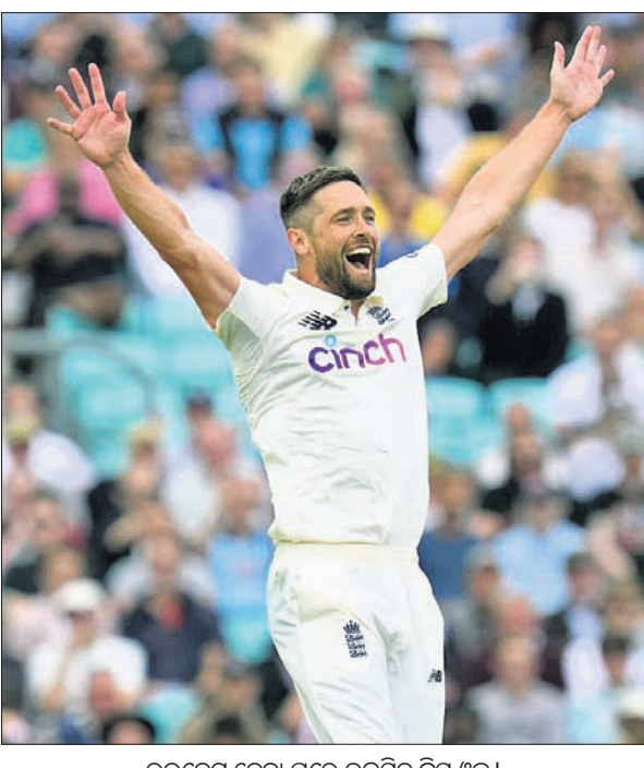
ଉଲଟସ୍ଟରରେ ଭାରତୀୟ ଦଳର ବିଜୟ ପର୍ବ।

ଲଣ୍ଡନ, ୨୧୯: ଓଭାର ଗ୍ରାଉଣ୍ଡରେ ଭାରତୀୟ ଅଲଆଉଟ୍ ଦଳ ୧୯୧ରେ ବିଜୟ ହାସଲ କରିଛି। ଓଭାର ଗ୍ରାଉଣ୍ଡରେ ଭାରତୀୟ ଅଲଆଉଟ୍ ଦଳ ୧୯୧ରେ ବିଜୟ ହାସଲ କରିଛି। ଓଭାର ଗ୍ରାଉଣ୍ଡରେ ଭାରତୀୟ ଅଲଆଉଟ୍ ଦଳ ୧୯୧ରେ ବିଜୟ ହାସଲ କରିଛି।