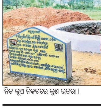
ନିଜ କୃଷି ନିକଟରେ କୁଣ୍ଡ ଭରତା ।

ନବରଙ୍ଗପୁର ଜିଲ୍ଲାରେ ଚଳିତ ବର୍ଷ ହୋଇଥିବା ଶୁଭ ଚୂଢ଼ିପାତ ଯୋଗୁଁ ଗଣତାଣ୍ଡ୍ରୀ ଏବେ ଚିତ୍ତାରେ। ଏକଲି ସ୍ଥଳେ ଅଣ ଜଳସେଚିତ ନବରଙ୍ଗପୁର ଜିଲ୍ଲାରେ ତର ସେଇ ଅନେକ ଗଣତାଣ୍ଡ୍ରୀ ସହାୟକ ହୋଇଛି।