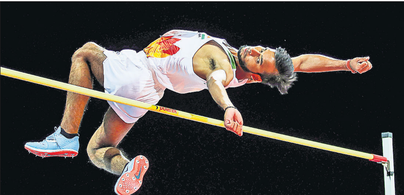
ଚୋକିଓ ପାରାଲିମ୍ପିକ୍ସର ଶୁକ୍ରବାର ଅନୁଷ୍ଠିତ ପୁରୁଷ ହାଇଜମ୍ପ ବିଶେଷ ଅବସରରେ ଭାରତର ରୌପ୍ୟ ପଦକ ବିଜୟୀ ପ୍ରମୋଦ ଭଗତ।

ବଲିଉଡ ଅଭିନେତ୍ରୀ କ୍ରିତି ସାନନ ଆଗକୁ ବାୟୋପିକ୍ସରେ କାମ କରିବାକୁ ଲକ୍ଷ୍ମୀ ରଖିଛନ୍ତି। ସୁଯୋଗ ମିଳିଲେ ଖୁସି ହେବେ ବୋଲି କହିଛନ୍ତି।