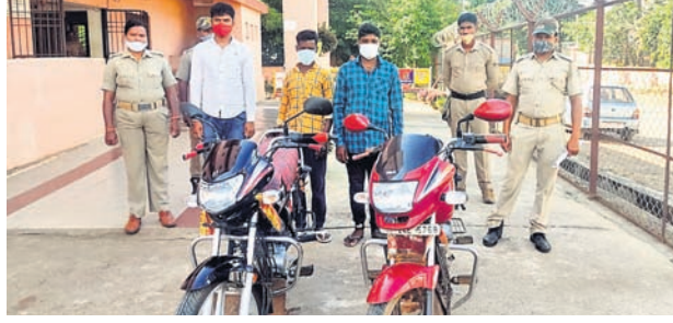
ଗିରଫ ଅଭିଯୁକ୍ତ କବଚ ବାଇକ୍ ।

ଉତ୍ତରକୋଟ, ୩।୯ (ସ.ପ୍ର.) ପୁଞ୍ଜର ଶକ୍ତ ଆପାତ ଲାଗିଥିବା ସେ ଗୁରୁତର ହୋଇଯାଇଥିଲେ।