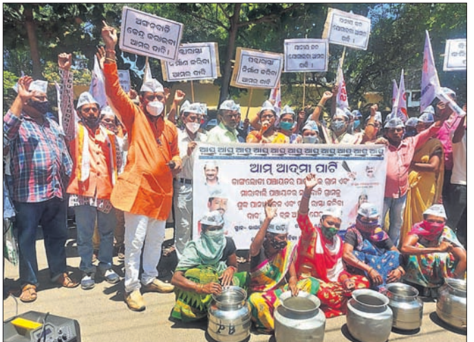
ଏଏପି କର୍ମକର୍ତ୍ତା ଓ ଗ୍ରାମବାସୀ ବିକ୍ଷୋଭ ପ୍ରଦର୍ଶନ କରୁଛନ୍ତି ।

ରାୟଗଡ଼ା ଜିଲ୍ଲା ଆର୍ଦ୍ଧସ ଆଦମା ପାର୍ଟି (ଏଏପି) ମହିଳା ମୋର୍ଚ୍ଚା ପକ୍ଷରୁ ପଞ୍ଚାମାସ ନିର୍ମାଣ ପାଇଁ ଦାବି କରାଯାଇଛି । ପଞ୍ଚାମାସ ନିର୍ମାଣ ପାଇଁ ଦାବି କରାଯାଇଛି । ପଞ୍ଚାମାସ ନିର୍ମାଣ ପାଇଁ ଦାବି କରାଯାଇଛି ।