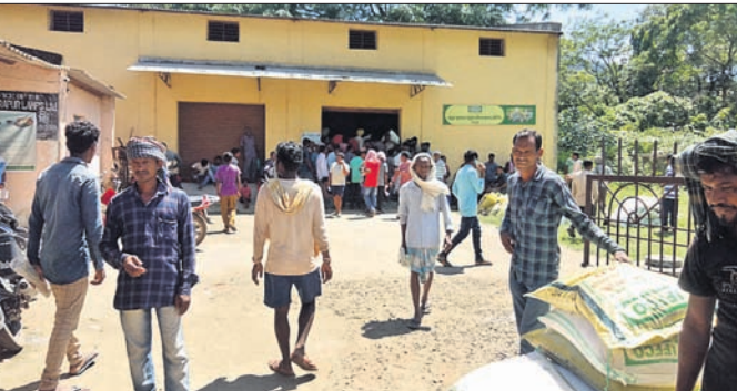
ଲ୍ୟାମ୍ପସ କାର୍ଯ୍ୟାଳୟ ନିକଟରେ ଚାଷୀ ଭିଡ଼ ଜମାଇଛନ୍ତି ।