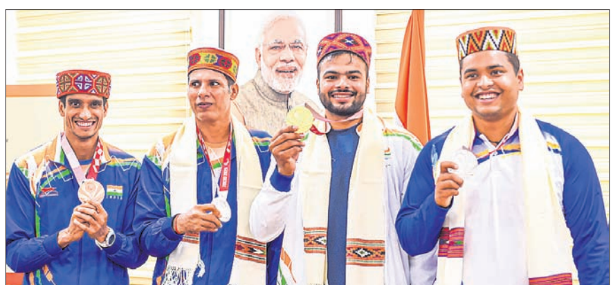
ସମର୍ଥନ ହେବା ଅବସରରେ ପଦକ ପ୍ରଦର୍ଶନ କରୁଛନ୍ତି ପାରାଲିମ୍ପିକ୍‌ରେ ପଦକ ହାସଲକାରୀ ୪ ଆଥଲେଟ।