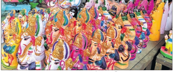
ସହରର କଳାନିକେତନ ଛକଠାରେ ଗଣେଶଙ୍କ ମୂର୍ତ୍ତି ବିକ୍ରି ପାଇଁ ଖୋଲିଥିବା ବୋକା ।

ଚଳିତ ମାସ ୧୦ ତାରିଖରେ ପଢ଼ୁଛି ଗଣେଶ ପୂଜା । ଏଥିପାଇଁ କୋରାପୁଟ ସହରରେ ବିଭିନ୍ନ ପୂଜା କର୍ମିତ ପକ୍ଷରୁ କୋଭିଡ ନିୟମ ଅନୁଯାୟୀ ପୂଜା କରିବାକୁ ପ୍ରସ୍ତୁତି ଆରମ୍ଭ କଲେଣି । ଆଗକୁ ଚୋରାପୁଟ ନିର୍ବାଚନ ସହର ପ୍ରତି ଖର୍ଚ୍ଚରେ ଗଣେଶ ପୂଜା କରିବାକୁ ପୂଜା କର୍ମିତଗୁଡ଼ିକ ଲକ୍ଷ୍ୟ ରଖୁଛନ୍ତି । ବ୍ୟବସାୟୀ ମାନେ ମଧ୍ୟ ରାୟପୁର, ନାଗପୁର, ବିଶାଖାପାଟଣା, ବିଜୟନଗର ଆଦି ସ୍ଥାନରୁ ଗଣେଶ ମୂର୍ତ୍ତି ଆଣି ସହରରେ କଳାନିକେତନ, ଅମଳାକୁଟିର ଲାଇନ, ବନଭାରତୀ କଲୋନା ବାଟମଙ୍ଗଳା ଅସ୍ଥାୟୀ ମଣ୍ଡପଠାରେ ବିକ୍ରି କରିବା ଆରମ୍ଭ କରିଦେଇଛନ୍ତି । ୧୦୦ ଟଙ୍କାରୁ ଆରମ୍ଭ କରି ୨୦ ହଜାର ପର୍ଯ୍ୟନ୍ତ ଗଣେଶ