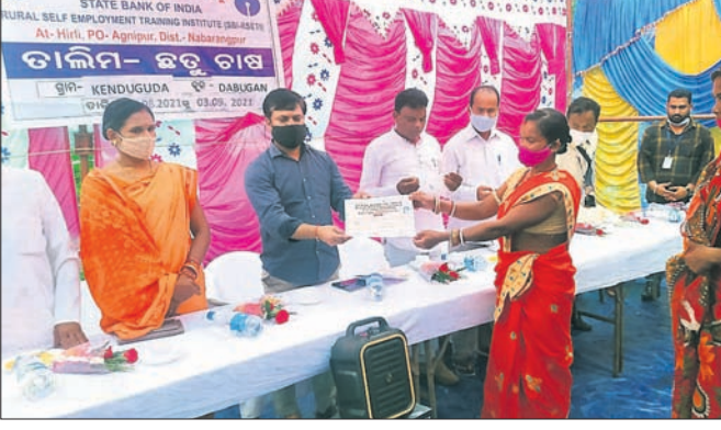
ଜଣେ ମହିଳାଙ୍କୁ ପ୍ରମାଣପତ୍ର ପ୍ରଦାନ କରାଯାଇଛି ।