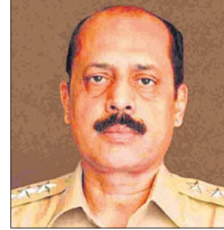
ସମୟସୀମାକୁ କୋର୍ଟ ଗତ ମାସରେ ୩୦ ଦିନ ବଦଳାଇଥିଲା । ଏହି ସମୟସୀମା