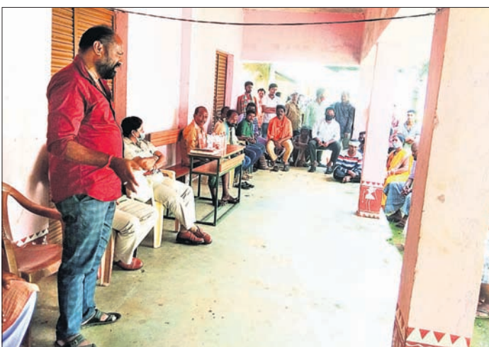
ଶାନ୍ତି କମିଟିର ସଭା କାର୍ଯ୍ୟକ୍ରମ