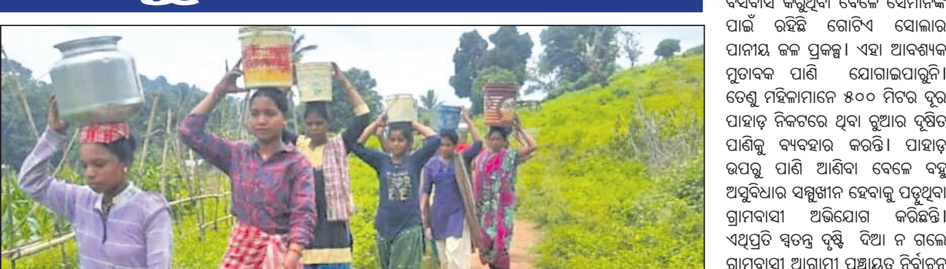
ପହାଡ଼ ନିକଟ ରୁଆରୁ ପାଣି ନେଉଛନ୍ତି ।