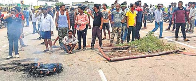
ଉଭୟଙ୍କ ଲୋକେ ରାସ୍ତା ଅବରୋଧ କରିଛନ୍ତି।

■ ପ୍ରେମ ପାଇଁ ହତ୍ୟା: ପରିବାରବର୍ଗ ■ ପୋଲିସ୍ ତଦନ୍ତରେ ସମେହ କରି ରାସ୍ତାରେକୋ