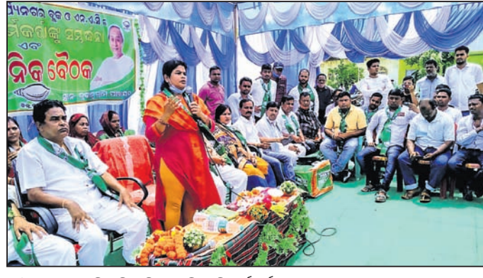
ବୈଠକରେ ଉପସ୍ଥିତ ବିଧାୟକ ଓ ବିଜେଡି କର୍ମକର୍ତ୍ତା ।