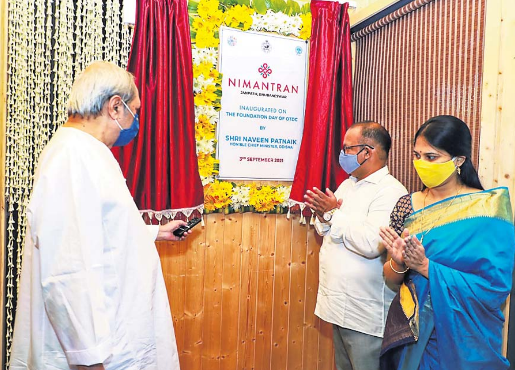
ମୁଖ୍ୟମନ୍ତ୍ରୀ ନବୀନ ପଟ୍ଟନାୟକ 'ନିମନ୍ତ୍ରଣ' ରୁ ଉଦ୍‌ଘାଟନ କରୁଛନ୍ତି। ନିକଟରେ ଅଛନ୍ତି ମନ୍ତ୍ରୀ ଜ୍ୟୋତିପ୍ରକାଶ ପାଣିଗ୍ରାହୀ ଓ ଓଡ଼ିଶା ଅଧିକାରୀ ଶ୍ରୀମତୀ ମିଶ୍ର।

ଓଡ଼ିଶା ପର୍ଯ୍ୟଟନ ଉନ୍ନୟନ ନିଗମ (ଓଡ଼ିଶା)ର ୪୨ତମ ପ୍ରତିଷ୍ଠା ଦିବସ ଅବସରରେ ଶୁକ୍ରବାର ମୁଖ୍ୟମନ୍ତ୍ରୀ ନବୀନ ପଟ୍ଟନାୟକ ଖାଣ୍ଡି ଓଡ଼ିଆ ବ୍ୟଞ୍ଜନ ରେଷ୍ଟୋରାଣ୍ଟ 'ନିମନ୍ତ୍ରଣ'ର ଶୁଭାରମ୍ଭ କରିଛନ୍ତି।