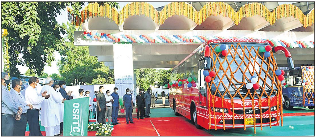
ମୁଖ୍ୟମନ୍ତ୍ରୀ ନବୀନ ପଟ୍ଟନାୟକ ଓଏସଆର୍ଟିସି ମୁଖ୍ୟ କାର୍ଯ୍ୟାଳୟରେ ନୂତନ ବସ୍ ଶୁଭାରମ୍ଭ କରୁଛନ୍ତି।