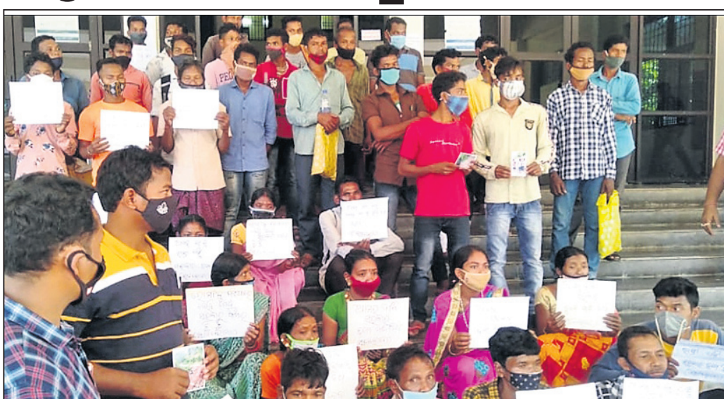
ଜିଲାପାଳଙ୍କ କାର୍ଯ୍ୟାଳୟ ଆଗରେ ଲୋକମାନେ ଧାରଣାରେ ବସିଛନ୍ତି ।

ପାରଳାଖେମୁଣ୍ଡି, ୩।୯ (ଡି.ଏନ.ଏ.): ରାୟଗଡ଼ ବ୍ଲକ୍ ଲାଇଲାଇ ପଞ୍ଚାୟତ ସାମଲୋଦା ଅନ୍ତର୍ଗତ କାର୍ଜୀ ସାହି ଗ୍ରାମକୁ ପଙ୍କା ରାସ୍ତା ନିର୍ମାଣ ଦାବିରେ ଗ୍ରାମବାସୀ ଶୁକ୍ରବାର ଗଜପତି ଜିଲାପାଳଙ୍କ କାର୍ଯ୍ୟାଳୟ ଆଗରେ ଧାରଣା ଦେଇଥିଲେ । ଦେଶ ସ୍ୱାଧୀନତା ପାଇ ୭୫ବର୍ଷ ବିତିଯାଇଥିଲେ ବୁଢ଼ା ଭକ୍ତ ଗ୍ରାମରେ ରାସ୍ତା ଆଦାଏ ନ ଥିବାରୁ ବିଭିନ୍ନ ସମସ୍ୟାର ସମ୍ମୁଖୀନ ହେଉଛନ୍ତି ଜନସାଧାରଣ । ବିଭିନ୍ନ ଉନ୍ନୟନ କାର୍ଯ୍ୟ କୋରସରରେ ଚାଲୁଥିବା କଥା ସରକାର କହୁଥିବା ବେଳେ ଜିଲାରେ ବହୁ ଗ୍ରାମାଞ୍ଚଳ ଦୁର୍ଗମ ପରିସ୍ଥିତିରେ ପଡ଼ି ରହିଛି । ଜରୁରୀ କାର୍ଯ୍ୟକ୍ରମରେ ଲୋକେ ନାହିଁ ନ ଥିବା ସମସ୍ୟାର ସମ୍ମୁଖୀନ ହେଉଛନ୍ତି । ଜଳୀୟ ସମସ୍ୟାର ପାଦଚଳା ରାସ୍ତାରେ ଜୀବନକୁ ବାଧି ଲଗାଇ ପ୍ରତିରୁଦ୍ଧରେ ବିପଦ ଗଣି ପାଇ ୭୫ବର୍ଷ ବିତିଯାଇଥିଲେ ବୁଢ଼ା ଭକ୍ତ ଗ୍ରାମରେ ରାସ୍ତା ଆଦାଏ ନ ଥିବାରୁ ବିଭିନ୍ନ ସମସ୍ୟାର ସମ୍ମୁଖୀନ ହେଉଛନ୍ତି ।