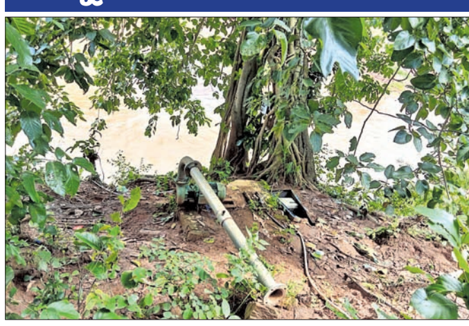
ପରିଚାଳନା ଅଭାବରୁ ଅଚଳ ହୋଇପଡ଼ିଥିବା ପଏଣ୍ଟ ।

ପ୍ରକଳ୍ପ ରହିଛି । ସେଥିମଧ୍ୟରୁ ୯୩ଟି ଅଚଳ ହୋଇପଡ଼ିଛି । ଫୁଲବାଣୀ ବ୍ଲକ୍ରେ ୫୫ଟି ପ୍ରକଳ୍ପରୁ ୧୧ଟି ଅଚଳ ଥିବା ବେଳେ ଗଣ୍ୟ ଜମିରେ ପାଣି ମାଡ଼ିବ । ଖଜୁରିପଡ଼ାରେ ୪୯୨ରୁ ୧୨, ଚକାପାଦରେ ୪୭୨ରୁ ୧୦, ରାଇକିଆ ବ୍ଲକ୍ରେ ନଦୀ ନ ଥିବାରୁ ଏବଂ ନାଳରେ ପାଣିର ଅଭାବ ଯୋଗୁ ପ୍ରକଳ୍ପ କାର୍ଯ୍ୟକ୍ରମରେ ଅକ୍ଷରାୟ ସୃଷ୍ଟି କରୁଛି । ବିଭାଗୀୟ ସୂଚନା ଅନୁସାରେ, କନ୍ଧମାଳରେ ୫୮୮ଟି ଊଠା ଜଳସେଚନ