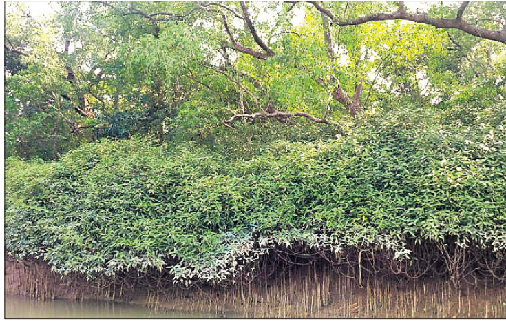
ଭିତରକନିକାରେ ଅବସ୍ଥାୟୀ ହେବାକାରଣ