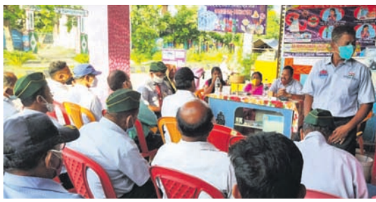
ବୈଠକରେ ଉପସ୍ଥିତ ଅବସର ସୈନିକ ସଂଘ କର୍ମକର୍ତ୍ତା ।