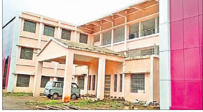
ନିର୍ମାଣ ହୋଇଥିବା କଲେଜ ।

କୋରାପୁଟ ଜିଲ୍ଲାର ସେମିଲିଗୁଡ଼ା ତହସିଲ ଅନ୍ତର୍ଗତ ତୋଳିଆମ୍ବ ନିକଟରେ କୋରାପୁଟ ମତେଇ ତିଗ୍ରୀ କଲେଜ ନିର୍ମାଣ କାର୍ଯ୍ୟ ଶେଷ ହୋଇ ଉଚ୍ଚଶିକ୍ଷା ବିଭାଗକୁ ହସ୍ତାନ୍ତର ହୋଇଛି।