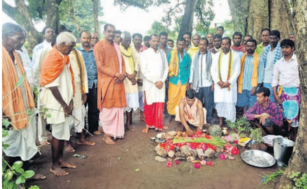
ମୁଖ୍ୟ କର୍ମକର୍ତ୍ତାଙ୍କୁ ଦ୍ୱାରା ଧାନକେଣା ମାଟି ଦେବତାଙ୍କୁ ସମର୍ପଣ କରାଯାଇଛି ।

ନିକଟେ ଏହି ବାଲୟାତ୍ରା ଅନୁଷ୍ଠିତ ହୁଏ । ଏହି ଦିନ ଅଞ୍ଚଳବାସୀ ଏକାଠି ହୋଇ ନିଜ ନିଜ ଜମିର ଧାନକୁ ମାଟି ଦେବତାଙ୍କୁ ସମର୍ପଣ କରିଥାନ୍ତି।