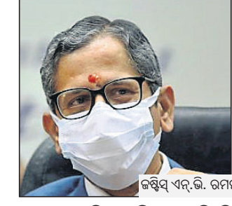
କୃଷ୍ଣ ଏନ୍.ଭି. ରମନା ରଖୁଥିଲେ। ବିଚାରପତିମାନଙ୍କ ନିୟୁକ୍ତି ପାଇଁ କଲେଜିୟମରୁ ସୁପାରିସକୁ କେନ୍ଦ୍ର ସରକାର ୬ ଦିନ ମଧ୍ୟରେ ମଞ୍ଜୁର କରିଥିବାରୁ ସେ ଧନ୍ୟବାଦ ଜଣାଇଥିଲେ।

ଆଇନ ଧର୍ମାଙ୍କ ପେସା ହୋଇ ରହିନାହିଁ ନୂଆଦିଲ୍ଲୀ, ୪।୯: ଆଇନ ବିଧିରାଜ୍ୟରେ ପହିଳାମାନଙ୍କ ସଂଖ୍ୟା ଯଥେଷ୍ଟ କମ୍। ବହୁ କ୍ଷେତ୍ରରେ ହୁମିଗ୍ରାଣ୍ଟସୁଦ୍ଧା ପ୍ରତିନିଧିତ୍ୱ ୧୧ ପ୍ରତିଶତକୁ ବୃଦ୍ଧିପାଇଁ ବୋଲି ବାର୍ କାର୍ଯ୍ୟକ୍ରମ ପକ୍ଷରୁ ଆୟୋଜିତ ଆଇନ ଏବେ ବି ପ୍ରଫୁଲ୍ଲ ଯୁବରାଜ୍ୟ ଏକ କାର୍ଯ୍ୟକ୍ରମରେ ଉଦ୍‌ବୋଧନ ଦେଇ ବିଜେଆଇ କହିଛନ୍ତି। ଶନିବାର ୩ ମହିଳାଙ୍କ ସମେତ ନବନିୟୁକ୍ତ ୯ ହୁମିଗ୍ରାଣ୍ଟସୁଦ୍ଧା ବିଚାରପତି (ସିଜେଆଇ) ଏନ୍.ଭି. ବିଚାରପତି ପଦ ପାଇଁ ନିଜୋଗାମରୁ ପ୍ରଥମ ମହିଳା କୁଡ଼ିସିଆଲ ଅଫିସର ଆଇନ ବିଧିରାଜ୍ୟରେ ପହିଳାମାନଙ୍କ ସଂଖ୍ୟା ଯଥେଷ୍ଟ କମ୍। ବହୁ କ୍ଷେତ୍ରରେ ହୁମିଗ୍ରାଣ୍ଟସୁଦ୍ଧା ପ୍ରତିନିଧିତ୍ୱ ୧୧ ପ୍ରତିଶତକୁ ବୃଦ୍ଧିପାଇଁ ବୋଲି ବାର୍ କାର୍ଯ୍ୟକ୍ରମ ପକ୍ଷରୁ ଆୟୋଜିତ ଆଇନ ଏବେ ବି ପ୍ରଫୁଲ୍ଲ ଯୁବରାଜ୍ୟ ଏକ କାର୍ଯ୍ୟକ୍ରମରେ ଉଦ୍‌ବୋଧନ ଦେଇ ବିଜେଆଇ କହିଛନ୍ତି। ଶନିବାର ୩ ମହିଳାଙ୍କ ସମେତ ନବନିୟୁକ୍ତ ୯ ହୁମିଗ୍ରାଣ୍ଟସୁଦ୍ଧା ବିଚାରପତି (ସିଜେଆଇ) ଏନ୍.ଭି. ବିଚାରପତି ପଦ ପାଇଁ ନିଜୋଗାମରୁ ପ୍ରଥମ ମହିଳା କୁଡ଼ିସିଆଲ ଅଫିସର