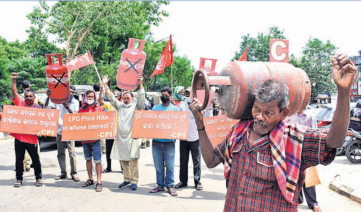
ରନ୍ଧନ ଗ୍ୟାସ୍ ଦର ବୃଦ୍ଧି ପ୍ରତିବାଦରେ ସିପିଆଇ ପକ୍ଷରୁ ଶନିବାର ଭୁବନେଶ୍ୱର ରାଜମହଲ ଛକରେ ଅନୁଷ୍ଠିତ ବିରୋଧ ଶୋଭାଯାତ୍ରା।

ଭୁବନେଶ୍ୱର, ୪।୯(ବୁଧବେ) ରାଜ୍ୟରେ ଆଉ ୨୪ଟି ନୂତନ ଆଇଟିଆଇ କେନ୍ଦ୍ର ଗଠନ ହେବ। ଏହା ପରେ ୨୪୦୦ ଜଣଙ୍କୁ ନିଯୁକ୍ତି ସୁଯୋଗ ମିଳିପାରିବ।