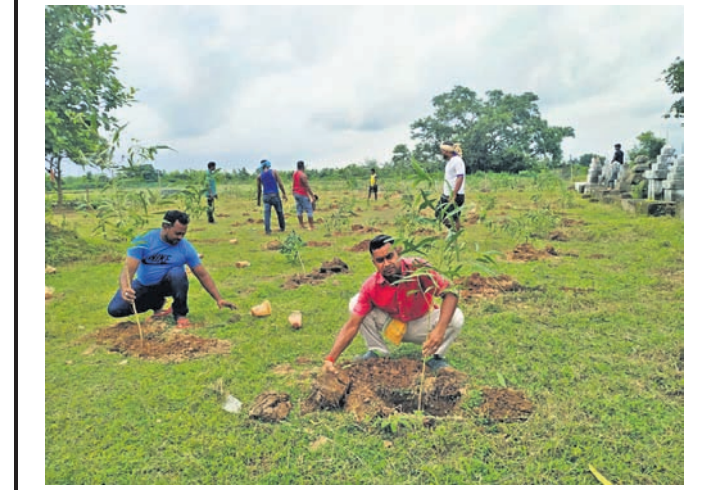
ମା' ଅଁକେଇ ଜନସେବା ଗ୍ରୁପର ସଦସ୍ୟଙ୍କ ଦ୍ୱାରା ତାରା ରୋପଣ ।