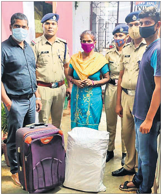
ଗଞ୍ଜେଇ ଚାଲାଣ ବେଳେ ଧରାପଡ଼ିଥିବା ମହିଳା।