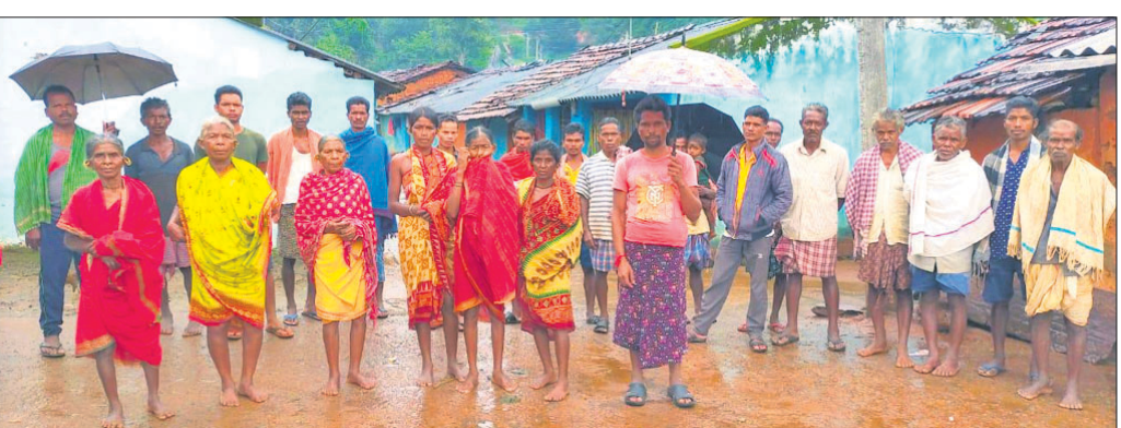
ଅଭିଯୋଗ କରୁଥିବା ପୁଞ୍ଜିସିଲ ଗ୍ରାମବାସୀ।

କୋରାପୁଟ ଜିଲାର ବଗମତପୁର ବ୍ଲକ ମୁକାଂ ପଞ୍ଚାୟତର ପୁଞ୍ଜିସିଲ ଗାଁ। ଏଠାରେ ବିକାଶ ହୋଇଛି ବାଟେନା।