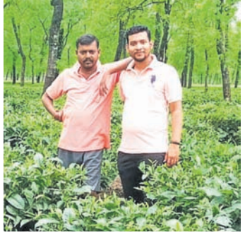
ନେପାଳ ରୁଟିରେ ଠକେଇ ସଂସ୍ଥା ମୁଖ୍ୟ ଓ ଅନ୍ୟ କର୍ମଚାରୀ ।

ବିଦେଶରେ ଚାକିରି ଦେବା ନାଁରେ ଗଞ୍ଜାମ ଜିଲ୍ଲା ହିଞ୍ଜିଳିକାଟୁ ପଟଣାସାହିରେ ଏକ ଠକେଇ ସଂସ୍ଥା ବନ୍ଦୁ ମୁଦ୍ରଣ ଓ ମୁଦ୍ରଣକାରୀଙ୍କୁ ଲକ୍ଷ୍ୟ କରିବାକୁ ହୁଏତ କରିଥିବା ଅଭିଯୋଗ ହୋଇଛି।