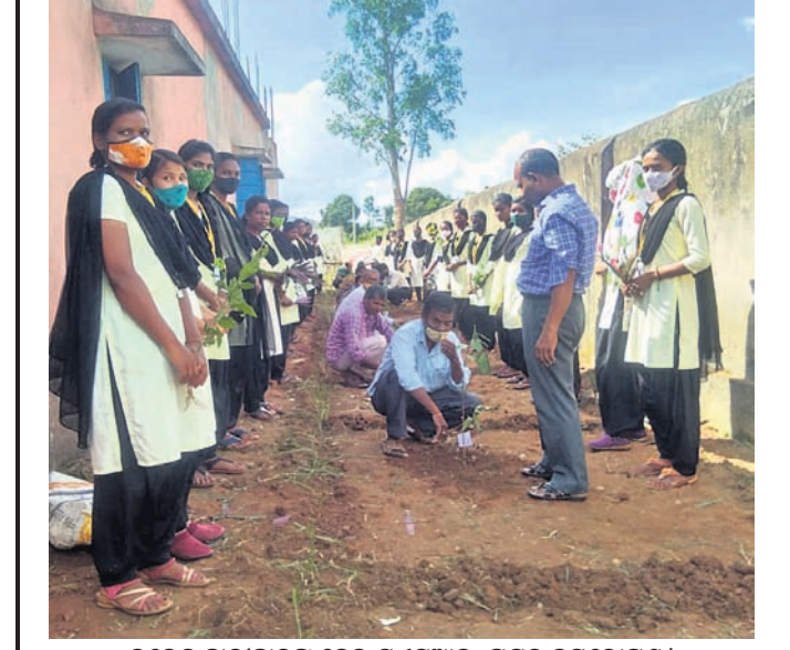
କଲେଜ ଛାତ୍ରଛାତ୍ରୀଙ୍କୁ ନେଇ ଯୁବସଂଘର ପକ୍ଷରୁ ବୃକ୍ଷରୋପଣ ।

ସବୁବେଳେ ମୋଧାକୁ ପାଠ୍ୟପୁସ୍ତକରେ ଉପହାର ଦେବାକୁ ଚାହୁଁଥିଲେ । ଆଉ ସେହି ପଇସାରେ ହିଁ ସେ ନିଜ ପଢ଼ାକୁ ଆଗକୁ ନେଉଥିଲେ ।