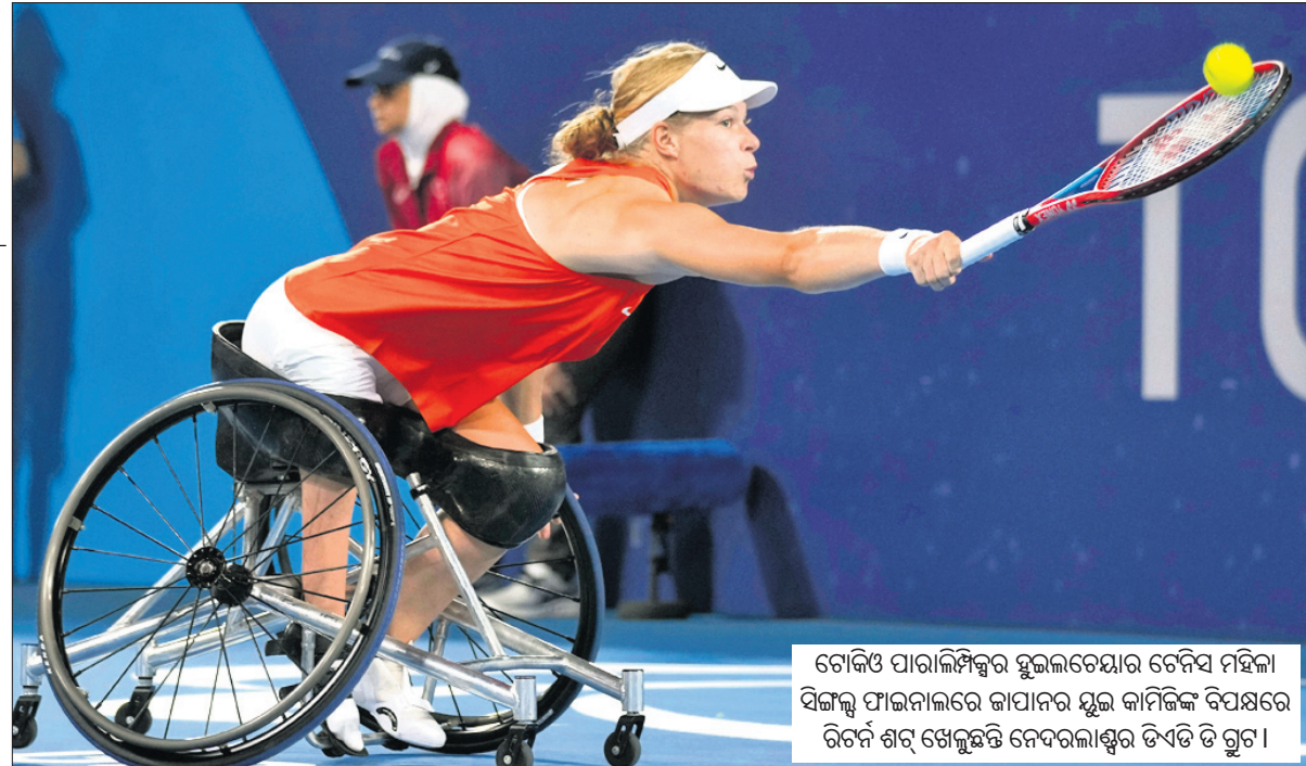
ଚୋକିଓ ପାରାଲିମ୍ପିକ୍ସର ହୁଇଲଚେୟାର ଟେନିସ ମହିଳା ସିଙ୍ଗଲ୍ ଫାଇନାଲରେ ଜାପାନର ଯୁଇ କାମିଜିକି ବିପକ୍ଷରେ ରିଟର୍ନ ଶର୍ଦ୍ଧ୍ୱ ଖେଳୁଛନ୍ତି ନେଦରଲାଣ୍ଡର ଡିଏଡି ଡି ଗୁଟା।