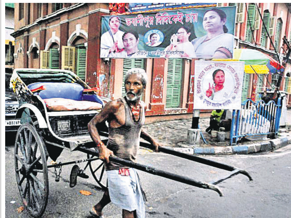
ଉପନିର୍ବାଚନ ପାଇଁ ଭବାନୀପୁର ନିର୍ବାଚନ ମଣ୍ଡଳରେ ଲଗାଯାଇଥିବା ମମତା ବାନାର୍ଜୀଙ୍କ ପୋଷ୍ଟର ନିକଟରେ ଜଣେ ଲଢ଼ିବାଳକ।

ମାନ୍ଦିଳା, ୪।୯: କୋଭିଡ୍-୧୯ ଯୋଗୁ ଫିଲିପାଇନ୍ସ ବିଭିନ୍ନ ଦେଶର ଲୋକଙ୍କ ଆଗମନ ଉପରେ ଲଗାଉଥିବା କଟକଣାକୁ ଭାରତ ଓ ଅନ୍ୟ ୯ଟି ଦେଶକୁ ବାଦ୍ ଦେଇଛି। ସେମାନଙ୍କର ଠାଉଛି ଭାରତୀୟମାନେ ଯାଇପାରିବେ ବୋଲି ଫିଲିପାଇନ୍ସ ରାଷ୍ଟ୍ରପତି ଭବନ ପକ୍ଷରୁ ଘୋଷଣା କରାଯାଇଛି। ଭାରତ ଉପରୁ ଭ୍ରମଣ କଟକଣା ଠାଉଛା ପାଇଁ ଆତ୍ମ ସୁରକ୍ଷା ଟୀକାଦ୍ରୋଗା ବ୍ୟତୀତ ଅନ୍ୟାନ୍ୟ ଦେଶକୁ ବାଦ୍ ଦେଇଛି। ଅନ୍ୟ ଯେଉଁ ଦେଶଗୁଡ଼ିକକୁ କଟକଣା ଉଠିଛି ସେମାନେ ହେଲେ ପାକିସ୍ତାନ, ବାଲ୍ୟାଦେଶ, ଶ୍ରୀଲଙ୍କା, ନେପାଳ, ଯୁନାଇଟେଡ୍ ଆରବ ଏମିରେଟ୍ସ, ଓମାନ, ଆଇଲ୍ୟାଣ୍ଡ, ମାଲେସିଆ ଏବଂ ଇଣ୍ଡୋନେସିଆ।