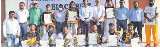
ଅତିଥିଙ୍କ ସହ ସମ୍ପର୍କିତ ଗ୍ୟାସକୋଷ୍ଠୋ ଖୋଲିମାନେ ।