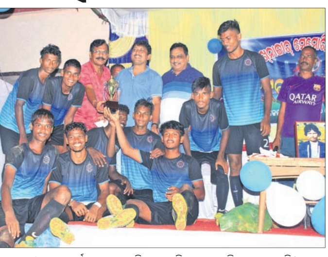
ନୀଳଚକ୍ର ସ୍ପୋର୍ଟ୍ସ୍ କ୍ଲବ୍‌ର ଖେଳାଳିମାନେ ଅତିଥିମାନଙ୍କୁ ଚୁପ୍ ଗ୍ରହଣ କରୁଛନ୍ତି ।

ଖୋର୍ଦ୍ଧା ଅଫିସ୍, ୫।୯ ଖୋର୍ଦ୍ଧା ଉପକଣ୍ଠ କେରଳ ଅହମ୍‌ଦିୟା ମୁସଲିମ୍ ମୁଚ୍‌ବଲ୍ ପତିଆରେ ଏକଦିବସୀୟ ସେକ୍ ନଜିର ମେମୋରିଆଲ୍ ମୁଚ୍‌ବଲ୍ ଟୁର୍ନାମେଣ୍ଟ ଅନୁଷ୍ଠିତ ହୋଇଛି । ଫାଇନାଲରେ ପୁରୀର ନୀଳଚକ୍ର ସ୍ପୋର୍ଟ୍ସ୍ କ୍ଲବ୍ ଚାମ୍ପିୟନ ହେବ । ୫-୪ ଗୋଲରେ ଭୁବନେଶ୍ୱରର ଶିବଶକ୍ତି କ୍ଲବ୍‌କୁ ହରାଇ ଚାମ୍ପିୟନ ହୋଇଛି । ନିର୍ଦ୍ଧାରିତ ସମୟ ଖେଳ ଗୋଲଶୂନ୍ୟ ରହିବାକୁ ଚାଲିଗଲେ ସହାୟତା ନିଆଯାଇଥିଲା । ପ୍ରତିଯୋଗିତାରେ ମୋଟ ୮୮ ଦଳ (ଅହମ୍‌ଦିୟା ଏଫ୍.ସି. କେରଳ, ନୀଳଚକ୍ର ସ୍ପୋର୍ଟ୍ସ୍ କ୍ଲବ୍ ପୁରୀ, ସାରଳା କ୍ଲବ୍ ଡେଜାନାଲ୍, ଆରିଆର୍ କ୍ଲବ୍ ଖୋର୍ଦ୍ଧା, ଶିବଶକ୍ତି ସ୍ପୋର୍ଟ୍ସ୍ କ୍ଲବ୍ ଭୁବନେଶ୍ୱର, ପତିତପାବନ କ୍ଲବ୍ ବ୍ରହ୍ମପୁର ଏବଂ ମିଳନ କ୍ଲବ୍ ମୁକୁନ୍ଦ ପ୍ରସାଦ ଖୋର୍ଦ୍ଧା) ଭାଗ ନେଇଥିଲେ । ପ୍ରଥମ ମ୍ୟାଚ୍‌ରେ ନୀଳଚକ୍ର କ୍ଲବ୍, ଦ୍ୱିତୀୟ ମ୍ୟାଚ୍‌ରେ ସାରଳା କ୍ଲବ୍, ତୃତୀୟ ମ୍ୟାଚ୍‌ରେ ଶିବଶକ୍ତି ସ୍ପୋର୍ଟ୍ସ୍, ଚତୁର୍ଥ ମ୍ୟାଚ୍‌ରେ ମିଳନ