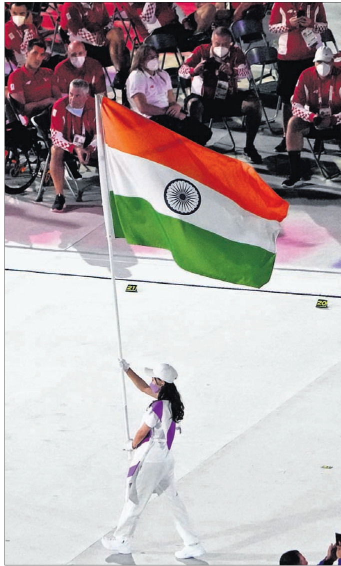
ଉଦ୍‌ଯାପନା ଉତ୍ସବରେ ଭାରତୀୟା ଭାରତର ଅବନୀ ଲେଖରା ।

ଭାରତର ପଦକ ବିଜେତା ସ୍ୱର୍ଣ୍ଣ ପଦକ ଅବନୀ ଲେଖରା (ଶୁଚି) ସୁମିତ ଆଖିଲ (ଜାଭେଲିନ ପ୍ରୋ) ମନୀଷ ନରଡ଼ାଲ (ଶୁଚି) ପ୍ରମୋଦ ଭଗତ (ବ୍ୟାଡ୍ମିଣ୍ଟନ) କ୍ରିଷ୍ଣା ନାଗର (ବ୍ୟାଡ୍ମିଣ୍ଟନ) ରୌପ୍ୟ ପଦକ ଭାବିନୀ ପଟେଲ (ଟେବୁଲ୍ ଟେନିସ) ନିଷାଦ କୁମାର (ହାଲଜମ୍) ଦେବେନ୍ଦ୍ର ଝାଝାରିଆ (ଜାଭେଲିନ ପ୍ରୋ) ଯୋଗେଶ କୁମାର (ଡିସ୍କସ୍ ପ୍ରୋ) ମାରିୟାପ୍ପାନ ଅଜାଭେଲୁ (ହାଲଜମ୍) ପ୍ରବୀଣ କୁମାର (ହାଲଜମ୍) ସିଂହରାଜ ଆଡାନା (ଶୁଚି) ସୁହାସ ଯଥୁରାଜ (ବ୍ୟାଡ୍ମିଣ୍ଟନ) ବ୍ରୋଞ୍ଜ୍ ପଦକ ସୁନ୍ଦର ସିଂ ଗୁର୍ଜର (ଜାଭେଲିନ ପ୍ରୋ) ସିଂହରାଜ ଆଡାନା (ଶୁଚି) ଶରଦ କୁମାର (ହାଲଜମ୍) ଅବନୀ ଲେଖରା (ଶୁଚି) ହରବିନ୍ଦର ସିଂ (ଆର୍ଚେରୀ) ମନୋଜ ସରକାର (ବ୍ୟାଡ୍ମିଣ୍ଟନ)