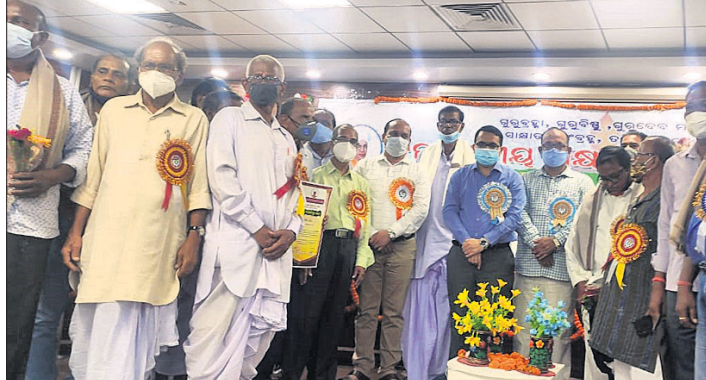
ଜିଲ୍ଲା ସ୍ତରୀୟ ଗୁରୁଦିବସ ପାଳନ ଉତ୍ସବରେ ଉପସ୍ଥିତ ଅତିଥି ଓ ପୁରସ୍କୃତ ଶିକ୍ଷୟିତ୍ରୀ ଶିକ୍ଷକ ।