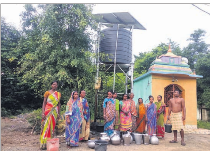
ଅବକ ପାନୀୟଜଳ ପ୍ରକଳ୍ପ ନିକଟରେ ଗ୍ରାମବାସୀ ।

ମୟୂରଭଞ୍ଜ ଜିଲ୍ଲା କୁଳିଆ ବ୍ଲକ୍ ଅଧୀନ ବାଲିଗଣବାଡ଼ିଆ ପଞ୍ଚାୟତର ଭୁଲଗଡ଼ିଆ ଗ୍ରାମରେ ପାନୀୟ ଜଳ ସଙ୍କଟ ଦେଖାଦେଇଛି । ଓରେଡା ପକ୍ଷରୁ ଏହି ଗାଁରେ ନିର୍ମାଣ କରାଯାଇଥିବା ସୋଲାର ପାନୀୟ ଜଳ ବ୍ୟବସ୍ଥା ସମ୍ପୂର୍ଣ୍ଣ ବନ୍ଦ ହୋଇପଡ଼ିଛି । ଫଳରେ ଗ୍ରାମବାସୀ ବିଶୁଦ୍ଧ ପାନୀୟ ଜଳ ପାଇବାକୁ ଦୃଷ୍ଟିତ ହୋଇଛନ୍ତି । ବାରମ୍ବାର ଅଭିଯୋଗ ପରେ ମଧ୍ୟ କୌଣସି ପଦକ୍ଷେପ ଗ୍ରହଣ କରାଯାଇ ନ ଥିବାରୁ ଅସନ୍ତୋଷ ବୃଦ୍ଧି ପାଇବାରେ ଲାଗିଛି । ସୂଚନା ଅନୁଯାୟୀ, କେନ୍ଦ୍ର ସରକାରଙ୍କ ଯୋଜନା ଅନୁଯାୟୀ ପାନୀୟ ଜଳ ଓ ପରିମଳ ମନୁଶ୍ୟାଳୟ ପକ୍ଷରୁ ଏକ କମ୍ପାନୀ ନାୟଗରେ ସୋଲାର ପାଣି ଚାଳି ବ୍ୟବସ୍ଥା କରାଯାଇଥିଲା । ସୌର ଚାଳିତ