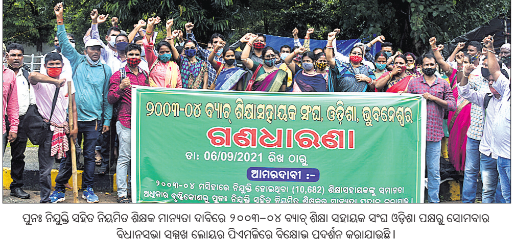
ପୁନଃ ନିଯୁକ୍ତି ସହିତ ନିୟମିତ ଶିକ୍ଷକ ମାନ୍ୟତା ଦାବିରେ ୨୦୦୩-୦୪ ବ୍ୟାଚ୍ ଶିକ୍ଷା ସହାୟକ ସଂଘ ଓଡ଼ିଶା ପକ୍ଷରୁ ସୋମବାର ବିଧାନସଭା ସମ୍ମୁଖେ କୋଭିଡ୍ ପିଏସ୍‌କିରେ ବିକ୍ଷୋଭ ପ୍ରଦର୍ଶନ କରାଯାଇଛି।

୨୨ ଆର୍ଥିକ ବର୍ଷର ଜୁଲାଇ ଶେଷ ପୂର୍ଣ୍ଣ ଲାଭିଆର୍ପି ଯୋଜନାରେ ୨୫୮ କୋଟି ୫୯ ଲକ୍ଷ ଟଙ୍କା ପ୍ରଦାନ କରିଛନ୍ତି। ରାଜ୍ୟ ସରକାର ନିଜସ୍ୱ ସମ୍ପଦ ବିନିଯୋଗ କରି ଅନେକ ପଦକ୍ଷେପ ନେଇ ସମାଜିକ ସହକାରି କୋଭିଡ୍-୧୯ ଜନିତ ସମସ୍ୟାର ମୁକାବିଲା କରିପାରିଛନ୍ତି। ଏଥିସହ କେନ୍ଦ୍ର ପ୍ରବର୍ତ୍ତନ ଯୋଜନା ତଥା ରାଜ୍ୟ ବିପର୍ଯ୍ୟୟ ମୁକାବିଲା ପାଣ୍ଠି କ୍ଷତିପୂରଣ ଉଦ୍ଦେଶ୍ୟରେ କେନ୍ଦ୍ର ଭାବରେ ରାଷ୍ଟ୍ରୀୟ ସ୍ତରୀୟ ମିଶନ ଯୋଜନା ଅଧୀନରେ ୧୪୬ କୋଟି ୪୪ ଲକ୍ଷ ଟଙ୍କା ଦେଇଥିଲେ। ସେହିପରି ୨୦୨୧-