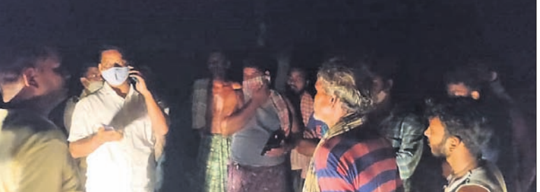
ବିଦ୍ୟୁତ୍ ବିଭାଗ ପ୍ରତିବାଦରେ ରାସ୍ତାରୋକ୍ତ

ବିଦ୍ୟୁତ୍ ବିଭାଗ ପ୍ରତିବାଦରେ ରାସ୍ତାରୋକ୍ତ ହେଉଛି।