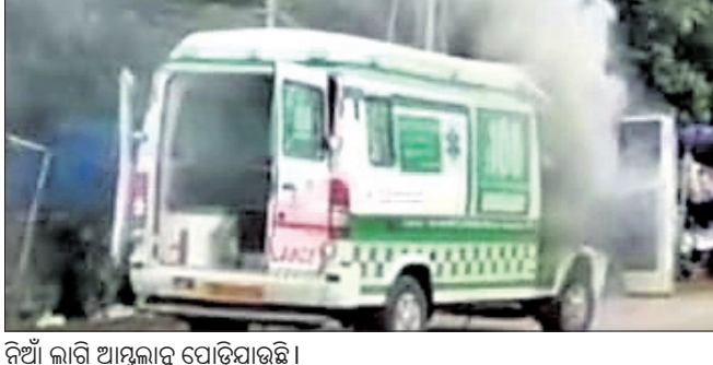
ନିଆଁ ଲାଗି ଆୟୁଲାଟୁ ଦୋଡ଼ିଯାଉଛି।