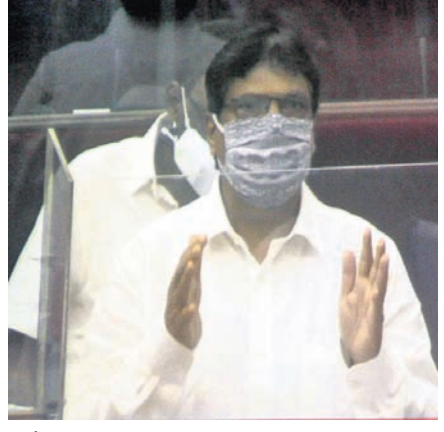
ଅର୍ଥମନ୍ତ୍ରୀ ନିରଞ୍ଜନ ପୂଜାରୀ ବିଧାନସଭାରେ ଉତ୍ତର ରଖୁଛନ୍ତି।

୨୦୧୫-୧୬ ଆର୍ଥିକ ବର୍ଷର ସଂଗୃହୀତ ଚିକିତ୍ସା ପରିମାଣକୁ ମୂଳ ବର୍ଷର ଚିକିତ୍ସା ରୁପେ ଗ୍ରହଣ କରାଯାଇଛି। ୧୪ ପ୍ରତିଶତ ବାର୍ଷିକ ଅଭିବୃଦ୍ଧି ହାର ନିଆଯାଇଛି। ୨୦୧୫-୧୬ ଆର୍ଥିକ ବର୍ଷରେ ରାଜ୍ୟ ସରକାର ଜିଏସ୍‌ଟିରେ ମିଶ୍ରଣ ଘଟିଥିବା ଚିକିତ୍ସା ବାବଦକୁ ୧୧୦୪୯.୩୪ କୋଟି ଟଙ୍କା ପାଇଥିଲେ। ସୁନିଶ୍ଚିତ ରାଜସ୍ୱକୁ ବାସ୍ତବରେ ସଂଗୃହୀତ ରାଜସ୍ୱକୁ ବିୟୋଗ କରି ଅବଶିଷ୍ଟ ପରିମାଣକୁ କ୍ଷତିପୂରଣ ଓ ତାହା ରାଜ୍ୟକୁ ମିଳିଯାଉଛି। ୨୦୨୦-୨୧ ଆର୍ଥିକ ବର୍ଷ ପାଇଁ ୨୧୨୭୪.୫୭ କୋଟି ଟଙ୍କା ସୁନିଶ୍ଚିତ