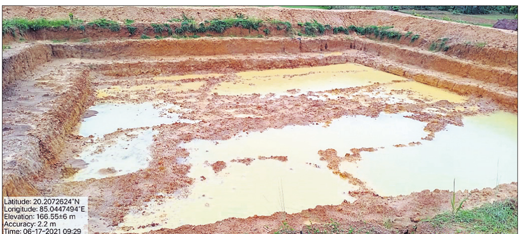
ପୋଖରୀ ନ ଖୋଳି, ଅନୁଦାନ ଲୁଚାଇ ଦିଆଯାଇ ପରେ ମାମୁ ଗିରଫ

ମୂଳିକା ସଂରକ୍ଷଣ, ଜଳ ବିଭାଜନା ବିଭାଗରେ ଦୁର୍ନୀତି ସଫେଦ କରାଯାଇଛି।