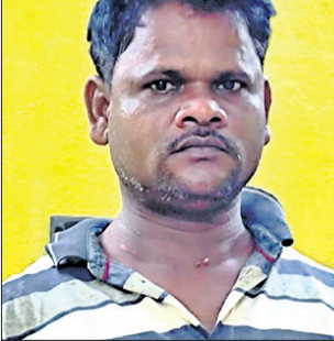
ଛତିଶଗଡ଼ର ଏକ ଆଲୁମିନିୟମ କମ୍ପାନୀରେ ୧୫.୧୧ କୋଟି ଠକେଇ ଘଟଣାରେ ଗ୍ରାଜ୍ଠିକ୍ ରିମାଣ୍ଡରେ ନେଇ ଛତିଶଗଡ଼ ପୋଲିସ୍