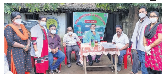
ସଚେତନତା କାର୍ଯ୍ୟକ୍ରମରେ ପ୍ରାଣୀ ସମ୍ପଦ ବିଭାଗ ଅଧିକାରୀମାନେ।