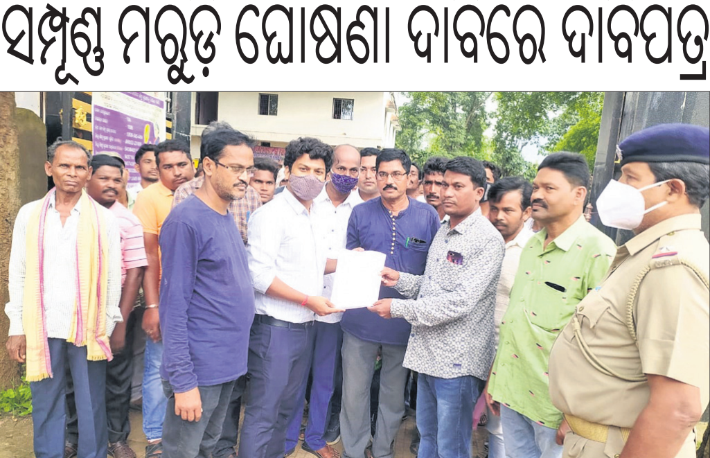
ବିଡ଼ିଓକୁ ଦାବିପତ୍ର ପ୍ରଦାନ କରାଯାଇଛି।

ଖମ୍ବୁଗୋଲ, ୬।୯.୧୯.୧୯.୧୯: ବଲାଙ୍ଗୀର ଜିଲ୍ଲା ଖମ୍ବୁଗୋଲ ବ୍ଲକରୁ ସମ୍ପୂର୍ଣ୍ଣ ମରୁଡ଼ି ଘୋଷଣା ଦାବିରେ କୃଷକ ସଂଘ ଚରଫତୁ ଯୋଗଦାନ ପୁଖ୍ୟମନ୍ତ୍ରୀଙ୍କ ଉଦ୍ଦେଶ୍ୟରେ ଚାରିଦିନୀ ପଦକ୍ଷେପ ଏକ ଦାବିପତ୍ର ବିଡ଼ିଓ ରଖିରଖିନ ରାଉତକୁ ପ୍ରଦାନ କରାଯାଇଛି।