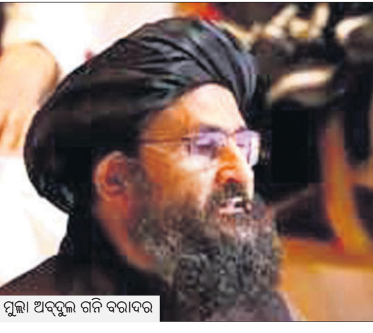
ମୁଲ୍ଲା ଅବଦୁଲ୍ ଗନି ବରାଦର