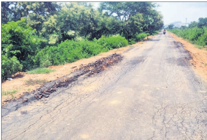
ନିମ୍ନମାନର କାମ ଯୋଗୁ ରାସ୍ତା ଅବସ୍ଥା ଶୋଚନୀୟ ହୋଇପଡ଼ିଛି।

ପାଟଣାଗଡ଼ ଗ୍ରାମ୍ୟ ଉନ୍ନୟନ ବିଭାଗ ପକ୍ଷରୁ ବେଲପଡ଼ା ବ୍ଲକ ଏମ୍.ଆଇ.ପି ରୋଡ଼କୁ ପୁରୁଣା ରାସ୍ତା ମାଲିମୁଣ୍ଡା ଛକରୁ ବାଲିଖମାର ପର୍ଯ୍ୟନ୍ତ ପ୍ରାୟ ୧ କିଲୋମିଟର ରାସ୍ତା କାମ ପାଇଁ ଗତ ଫେବୃଆରୀରେ ଟେଣ୍ଡର ଆହ୍ୱାନ କରାଯାଇଥିଲା।