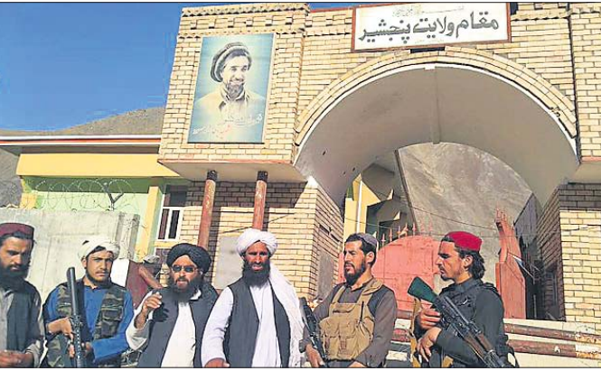
ପଞ୍ଜାବୀ ରାଜ୍ୟପାଳ ଅପିସ୍ ସମ୍ମୁଖରେ ତାଲିବାନୀ ଘୋଷଣା କରୁଥିବା ପୂର୍ବ ପର୍ଯ୍ୟନ୍ତ ତାଲିବାନ୍ ବିରୋଧରେ ଲଢ଼େଇ ଲାଗି ରହିବ ବୋଲି ଏନ୍‌ଆର୍‌ଏଫ୍ ନେତୃତ୍ୱ ନେଉଥିବା ପଞ୍ଜାବୀର ସିଂହ ଅହମ୍ମଦ ମାସୁଦ୍ ଏକ ଫୋଟୋକୁ ଦେଖି

ତାଲିବାନ୍ ପାଇଁ ଅଭେଦ୍ୟ ଦୁର୍ଗ ପାଲଟିଥିବା ଆଫଗାନିସ୍ତାନର ପଞ୍ଜାବୀ ଉପତ୍ୟକା ସମ୍ପୂର୍ଣ୍ଣ ଭାବେ ନିୟନ୍ତ୍ରଣକୁ ନିଆଯାଇଥିବା ଘୋଷଣା କରିଛି ତାଲିବାନ୍। ଏହି ପ୍ରବେଶ ଉପରେ ବିଜୟ ହାସଲ ହୋଇଥିବା ତାଲିବାନ୍ ପୁଞ୍ଜପାତ୍ର କାବୁଲକୁ ମୁକ୍ତ ହିସାବେ ସୋମବାର ଦାବି କରିବା ସହ ଆଫଗାନିସ୍ତାନରେ ଯୁଦ୍ଧ ଶେଷ ହେଲା ବୋଲି କହିଛନ୍ତି। ପଞ୍ଜାବୀ ରାଜ୍ୟପାଳ ଅପିସ୍‌ରେ ତାଲିବାନୀ ନେତା ସୋମବାର ପତାକା ଉଡ଼ାଇଛନ୍ତି। ଏହାର ଭିତ୍ତି ଏବଂ ଫତ୍ତୋ ସୋପିଆଲ ନିତିଆରେ ଲାଗି ହୋଇଛି। ଅନୁପସରେ ତାଲିବାନ୍ ଏହି ଦାବିକୁ ପୁଣି ଖଣ୍ଡନ କରିଛି ନ୍ୟାଶନାଲ ରେଜିଷ୍ଟ୍ର ଫୋର୍ସ (ଏନ୍‌ଆର୍‌ଏଫ୍)। ପ୍ରତିରୋଧୀ ବଳ ଅପରାଜେୟ ଏବଂ ଶେଷ