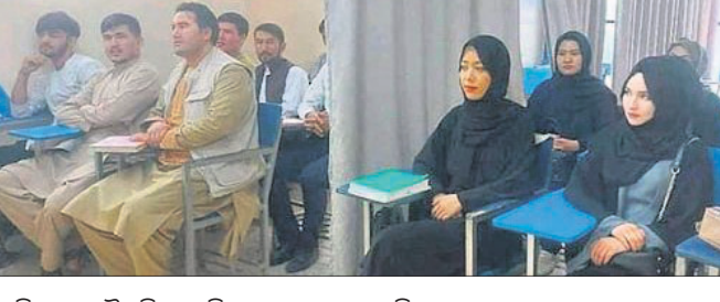
ଯଦି କୌଣସି ଶିକ୍ଷାନୁଷ୍ଠାନରେ ଶିକ୍ଷୟିତ୍ରୀ ନ ଥାନ୍ତି ତେବେ ଭଲ ଚରିତ୍ର ଥିବା ବୟସ୍କ ବ୍ୟକ୍ତି ସେମାନଙ୍କୁ ପାଠ ପଢ଼ାଇବେ। ସେହିପରି ଯୁନିଭର୍ସିଟିଗୁଡ଼ିକ ଛାତ୍ରୀମାନଙ୍କ ପାଇଁ ଶିକ୍ଷୟିତ୍ରୀ ନିଯୁକ୍ତ କରିବେ। ଯଦି ତାହା ନ ହୁଏ ତେବେ

ଆଫଗାନିସ୍ତାନର ଯରୋଲ୍ଲ ହନିଭର୍ତ୍ତୀରେ ପାଠ ପଢୁଥିବା ମହିଳାମାନେ ନିକାଦ ପିନ୍ଧିବା ସହ ପୂର୍ଣ୍ଣ ଲୁଚାଇବା ବାଧ୍ୟତାମୂଳକ। ଏଥିସହ ଶ୍ରେଣୀଗୁଡ଼ିକ ଲିଙ୍ଗଗତ ଅନୁସାରେ ବିଭାଜନ ହେବ ଅଥବା ଛାତ୍ରା ଓ ଛାତ୍ରୀଙ୍କ ମଧ୍ୟରେ ପରଦା ରହିବ ବୋଲି ତାଲିବାନ ନିର୍ଦ୍ଦେଶନାମା ଜାରି ହୋଇଛି। ତାଲିବାନର ଶିକ୍ଷା ବିଭାଗ ପକ୍ଷରୁ ଜାରି ଏହି ନୋଟିସ୍‌ରେ କୁହାଯାଇଛି, ଛାତ୍ରୀମାନଙ୍କୁ କେବଳ ଶିକ୍ଷୟିତ୍ରୀ ପାଠ ପଢ଼ାଇ ଦାରିବେ।