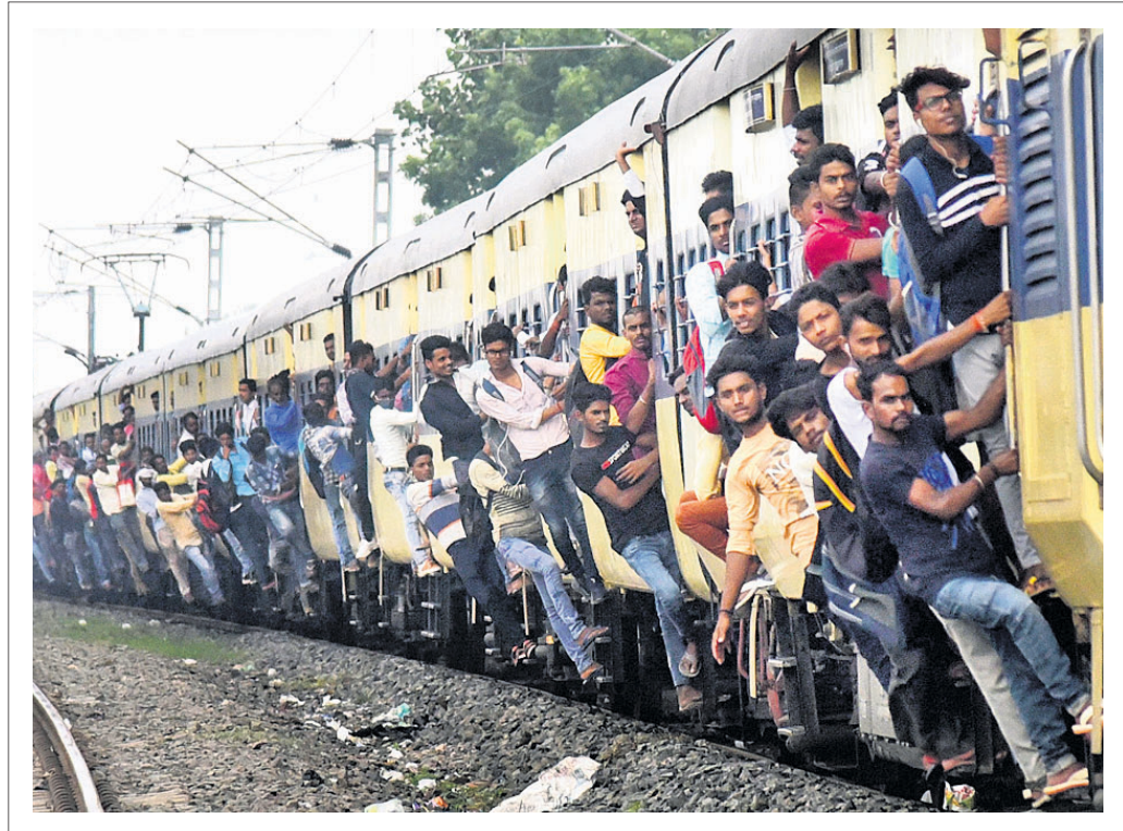
କୋଭିଡ଼ି ନିୟମ ଉଲ୍ଲଙ୍ଘନ ସହ ଜୀବନକୁ ବାଜି ଲଗାଇ ସୋମବାର ବିହାରର ପାଟନାରେ ଏକ ଟ୍ରେନ୍‌ରେ ଯାତ୍ରୀମାନେ ଓହ୍ଲାଇ ଯାଇଛନ୍ତି।