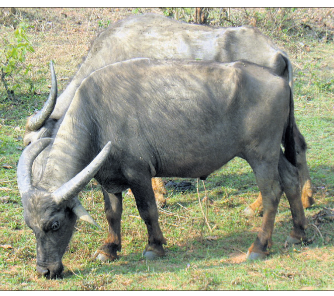
ଜାତୀୟ ମାନ୍ୟତା ପାଇଥିବା 'ମନ୍ଦା' ମଇଁଷି।