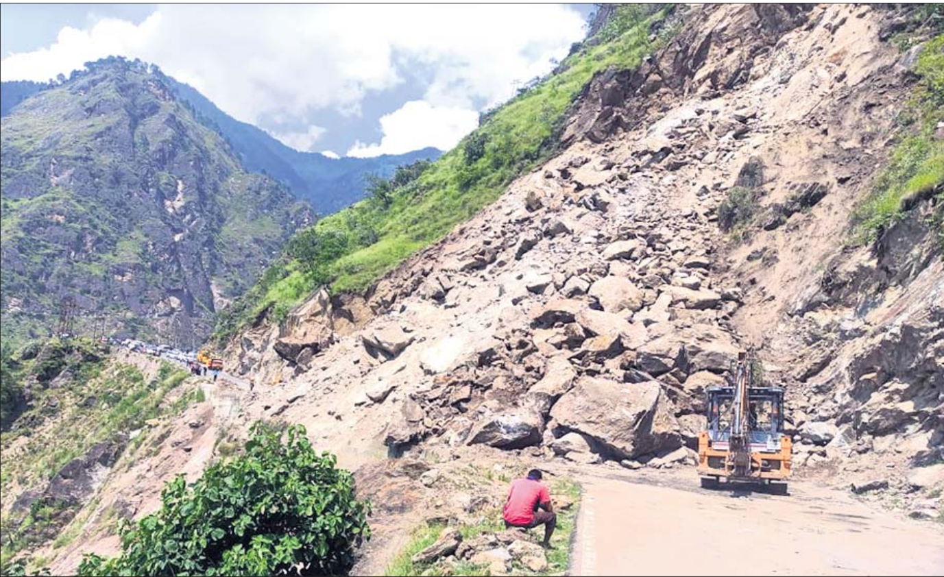
ପାହାଡ଼ରୁ ଅତଡ଼ା ଖସିବା ଯୋଗୁଁ ସୋମବାର ସିମ୍ଲାର ରାମପୁର ୫ନଂ. ଜାତୀୟ ରାଜପଥ ଅବରୋଧ ହେବା ସହ ଚଳାଚଳ ବ୍ୟାହତ ହୋଇଛି।