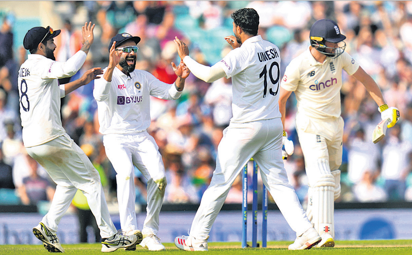
ଇଂଲଣ୍ଡର କ୍ରିକେଟ ଉଇକେଟ ପତନ ପରେ ଖୁସି ପୂର୍ଣ୍ଣରେ ଭାରତୀୟ ଖେଳାଳିମାନେ ।

ଲଣ୍ଡନ, ୬/୯ ଇଂଲଣ୍ଡ ମାଟିରେ ଭାରତୀୟ କ୍ରିକେଟ ଦଳ ଇତିହାସ ସୃଷ୍ଟି କରିଛି । ୫୦ ବର୍ଷ ପରେ ଭାରତ ଗ୍ଲାନାୟ କେମ୍ବ୍ରିଜ୍ ଓ ଓଭାଲ ଗ୍ରାଉଣ୍ଡରେ ଟେଷ୍ଟ ମ୍ୟାଚ୍ ଜିତିବାର ଗୌରବ ଅର୍ଜନ କରିଛି । ଇଂଲଣ୍ଡ ବିପକ୍ଷ ଚତୁର୍ଥ ଟେଷ୍ଟ ମ୍ୟାଚ୍ରେ ଭାରତୀୟ ଦଳ ଭାରତ ଯୋଗଦାନ ୧୫୭ ରନରେ ବିଜୟ ହାସଲ କରିଛି । ଏଥିପାଇଁ ୫ ମ୍ୟାଚ୍ ବିପକ୍ଷରେ ଭାରତ ୨-୧ରେ ଅଗ୍ରଣୀ ହାସଲ କରିଛି । ପଞ୍ଚମ ତଥା ଅନ୍ତିମ ଟେଷ୍ଟ ମ୍ୟାଚ୍ରେ ଭାରତ ଆସନ୍ତା ୧୦ ତାରିଖରୁ ଆରମ୍ଭ ହେବ । ଏହି ମ୍ୟାଚ୍ ଜିତିବା ପରେ ଭାରତ ଅତିକମରେ ଚଳିତ ସିରିଜରେ ଆଉ ପରାଜୟବରଣ ନ କରିବା ସ୍ୱପ୍ନ ହୋଇଛି ।