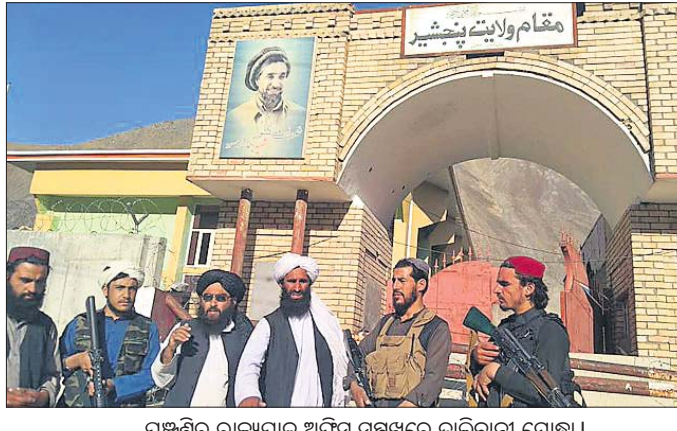
ପଞ୍ଜାବୀ ରାଜ୍ୟପାଳ ଅପିସ୍ ସମ୍ମୁଖରେ ତାଲିବାନୀ ଘୋଷଣା।

ତାଲିବାନ୍ ପାଇଁ ଅଭେଦ୍ୟ ଦୁର୍ଗ ପାଲଟିଥିବା ଆଫଗାନିସ୍ତାନର ପଞ୍ଜାବୀ ଉପତ୍ୟକା ସମ୍ପୂର୍ଣ୍ଣ ଭାବେ ନିୟନ୍ତ୍ରଣକୁ ନିଆଯାଇଥିବା ଘୋଷଣା କରିଛି ତାଲିବାନ୍। ଏହି ପ୍ରବେଶ ଉପରେ ବିଜୟ ହାସଲ ହୋଇଥିବା ତାଲିବାନ୍ ମୁଖପାତ୍ର କାବିହୁଲ୍ଲା ମୁଜାହିଦ୍ ସୋମବାର ଦାବି କରିବା ସହ ଆଫଗାନିସ୍ତାନରେ ଯୁଦ୍ଧ ଶେଷ ହେଲା ବୋଲି କହିଛନ୍ତି। ପଞ୍ଜାବୀ ରାଜ୍ୟପାଳ ଅପିସ୍‌ରେ ତାଲିବାନୀ ନେତା ସୋମବାର ପତାକା ଉଡ଼ାଇଛନ୍ତି। ଏହାର ଭିତ୍ତି ଏବଂ ଫଗୋ ସୋସିଆଲ ମିଡ଼ିଆରେ ଜାରି ହୋଇଛି। ଅନୁପସରେ ତାଲିବାନ୍ ଏହି ଦାବିକୁ ପୁଣି ଖଣ୍ଡନ କରିଛି ନ୍ୟାଶନାଲ ରେଜିଷ୍ଟ୍ର ଫୋର୍ସ (ଏନ୍‌ଆର୍‌ଏଫ୍)। ପ୍ରତିରୋଧୀ ବଳ ଅପରାଜେୟ ଏବଂ ଶେଷ