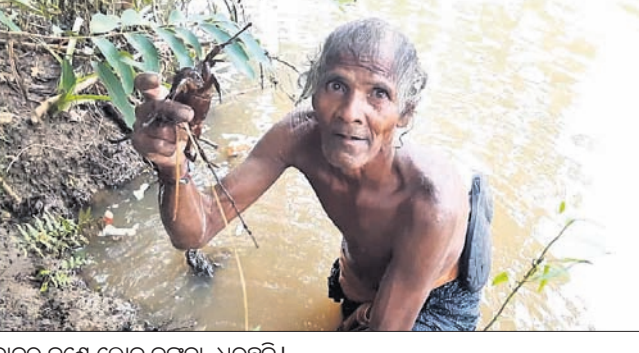
ନାଲକୁ ଜଣେ ଲୋକ କଳ୍ପା ଧରୁଛନ୍ତି।

ସମ୍ବଲପୁର ଜିଲା ମୁରୁମୁରା ବୁକ୍ ଅଞ୍ଚଳ ଗ୍ରାମର ମୁଦକମାନେ ଏକତାର ବାଣି ଦେଇଛନ୍ତି। ଗତ ରବିବାର ସେମାନେ ଗ୍ରାମର ମୁଦକମାନେ ଏକତାର ବାଣି ଦେଇଛନ୍ତି।