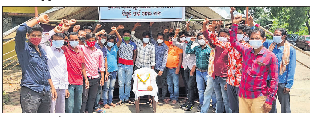
ଲଖନପୁର ପ୍ରୋଜେକ୍ଟ ଅଫିସ୍ ସମ୍ମୁଖରେ ଧାରଣା ଦେଇଥିବା ମୁଦକମାନେ।

ଝାରସୁଗୁଡ଼ା ଅଫିସ୍, ୭୯ (ବୁଧବାର): ଝାରସୁଗୁଡ଼ା ଅଫିସ୍ ସମ୍ମୁଖରେ ଧାରଣା ଦେଇଥିବା ମୁଦକମାନେ।