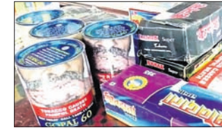
ଦେଢ଼ ଜୁଇଣ୍ଡାଲୁ ଉର୍ଦ୍ଧ୍ୱ ନକଲି ଜର୍ଦ୍ଦୀ ଜବତ।

ଭଦ୍ରକ ଜିଲ୍ଲା ପୁରୁଣାବାଦା ପୋଲିସ ମଙ୍ଗଳବାର ଦେଢ଼ ଜୁଇଣ୍ଡାଲୁ ଉର୍ଦ୍ଧ୍ୱ ନକଲି ଜର୍ଦ୍ଦୀ ସହ ଅଟୋ ଜବତ କରିଛି।