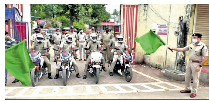
ବରଗଡ଼ ଏସ୍‌ପି ରାହୁଲ ଜେନା ପିସିଆର ବାଇକ୍ ଶୁଭାରମ୍ଭ କରୁଛନ୍ତି।

ବରଗଡ଼ରେ ଅପରାଧ ନିୟନ୍ତ୍ରଣ ତଥା ଅପରାଧୀଙ୍କୁ ଧରିବା ପାଇଁ ମଙ୍ଗଳବାରଠାରୁ ପିସିଆର ବାଇକ୍ ଗଡ଼ିବା ଆରମ୍ଭ କରିଛି।