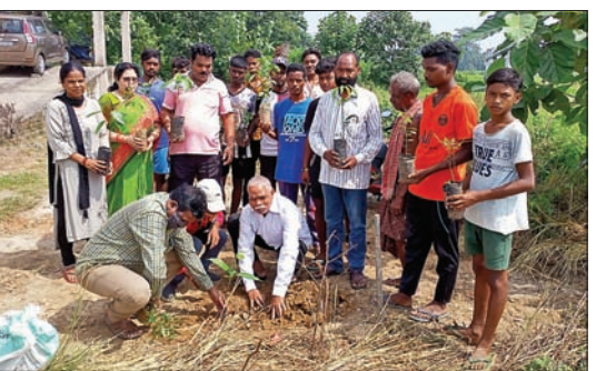
ଚାରା ରୋପଣ କରାଯାଇଛି।

ବଡ଼ଗାଁ,୭୧(ଡି.ଏନ.ଏ.): ସୁନ୍ଦରଗଡ଼ ଜିଲ୍ଲା ବଡ଼ଗାଁର ଜୟହିନ୍ଦ୍ କ୍ଳବ ଓ ମହାବୀର ବିକାଶ ପରିଷଦର ମିଳିତ ଆନୁକୁଲ୍ୟରେ ରବିବାର ରାବଲୋଗଡ଼ ଏବଂ ଲିଡିପଡ଼ା କ୍ଳବ ସମ୍ମୁଖରେ ବୃକ୍ଷରୋପଣ ରୋପଣ କାର୍ଯ୍ୟକ୍ରମ ହୋଇଯାଇଛି।