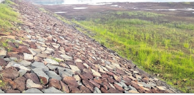
ବର୍ଷା ଅଭାବକୁ ବାକଶାଳ ଡ୍ୟାମ୍ ଶୁଖିଲା ପଡ଼ିଛି। ଜମନକିରା, ୭୯ (ଡି.ଏନ.ଏ.)

ବର୍ଷା ଅଭାବକୁ ଜମନକିରା ବୁକ୍ ପୁସ୍ତକଖାନା ପଞ୍ଚାୟତ ବାକଶାଳ ଡ୍ୟାମ୍ ଶୁଖିଲା ପଡ଼ିଛି। ଫଳରେ ଡ୍ୟାମ୍ ନିକଟ ଓ ପୋଲିସ୍ ସମ୍ପର୍କ ଘଟଣାର ତଦନ୍ତ କାରି ରହିଛି।