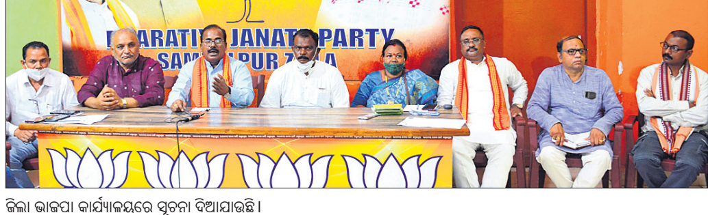
ଜିଲା ଭାକପା କାର୍ଯ୍ୟାଳୟରେ ସୂଚନା ଦିଆଯାଇଛି।

ସମ୍ବଲପୁର, ୭୯ (ବୁଧବାର): ରାଜ୍ୟ ସରକାର ଓଡ଼ିଶା ଅଣବେଶା କରୁଛନ୍ତି। ଫଳରେ ସେମାନେ ଶିକ୍ଷା, ନିଯୁକ୍ତି, ରାଜନୀତି ଆଦି କ୍ଷେତ୍ରରେ ଅବହେଳିତ ହେଉଛନ୍ତି।