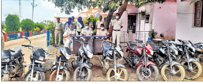
ଜବତ ହୋଇଥିବା ବାଇକ୍।

ସୁନ୍ଦରଗଡ଼ ଜିଲ୍ଲା କ୍ରମା ପୋଲିସ ଥାନାରେ ଦୁଇ ଜଣ ବାଇକ୍ ଚୋରଙ୍କୁ ଧରିବା ସହ ୧୧ଟି ଚୋରୀ ବାଇକ୍ ଜବତ କରିଛି।