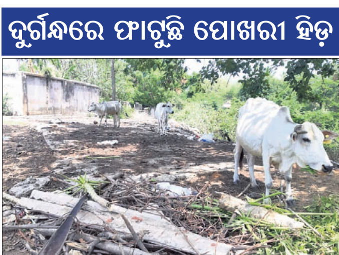
ଆବର୍ତ୍ତନା ସ୍ଥଳ। ଭଙ୍ଗାଯାଇଥିବା ସିମେଣ୍ଟ ରୋଡ଼କୁ ପୁନଃ ୨୪ଘଣ୍ଟିଆ ଖୋଲା ଶୈତାଳୟ ପାଲଟିଛି। ନିର୍ମାଣ କରାଗଲା। ବର୍ତ୍ତମାନ ଏହି ରାସ୍ତା ଏହାକୁ ଲାଗି ରହିଥିବା ଦୁଇ ଯୋଖରୀ

କବିସୂର୍ଯ୍ୟନଗର, ୮୯ (ଡି.ଏନ.ଏ.): କେନ୍ଦ୍ର ସରକାର ୨୦୧୪ ମସିହାଠାରୁ ସ୍ୱଳ୍ପ ଭାରତ ଅଭିଯାନ ଆରମ୍ଭ କରିଛି। କବିସୂର୍ଯ୍ୟନଗରରେ ଏହି ଅଭିଯାନ କାର୍ଯ୍ୟକ୍ରମ କଳମରେ ସିମିତ ରହିଥିବା ଦେଖାଦେଇଛି। ସ୍ଥାନୀୟ ଉପକଣ୍ଠରେ ଅବସ୍ଥିତ ଗୋଦାବରୀ ଯୋଖରୀ ହିଡ଼ ଓ ମର୍ଦ୍ଦରାଜ ସାହିର ଉତ୍ତର ପାର୍ଶ୍ୱ ଅନୁଧ୍ୟାବୀ ଅଞ୍ଚଳକୁ ମିଶାଇ ଏକ ଶିଶୁ ପାର୍କ ନିର୍ମାଣ ଲାଗି ରାଜ୍ୟ ସରକାରଙ୍କ ପକ୍ଷରୁ ଦଶ ଲକ୍ଷରୁ ଊର୍ଦ୍ଧ୍ୱ ଟଙ୍କା ମଞ୍ଜୁର ହୋଇଥିଲା। ଗୋଦାବରୀ ଯୋଖରୀର ଦକ୍ଷିଣ ପାର୍ଶ୍ୱ ସିମେଣ୍ଟ ରୋଡ଼ ଭଙ୍ଗାଯାଇ ପାର୍କ ନିର୍ମାଣ ଲାଗି କାର୍ଯ୍ୟ ଆରମ୍ଭ ହେଲା। କିନ୍ତୁ ମର୍ଦ୍ଦରାଜ ସାହିର କିଛି ସ୍ୱାଧିପତ୍ୟ ବ୍ୟକ୍ତି ନିଜ ଅନୁଧ୍ୟାବୀ କାର୍ଯ୍ୟ ଚାଲିଯିବା ଭୟରେ ଅଭିଯୋଗ କଲେ। ଯଦ୍ୱାରା ଅଧିକାରୀ କାମ ରହିଗଲା। ପୁଣି ଲକ୍ଷାଧିକ ବ୍ୟୟରେ