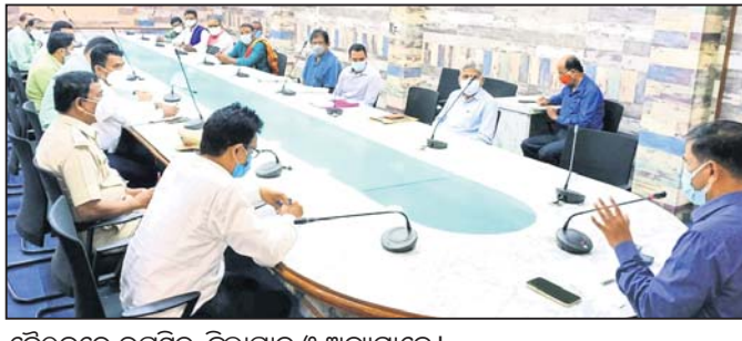
ବୈଠକରେ ଉପସ୍ଥିତ ଜିଲ୍ଲାପାଳ ଓ ଅନ୍ୟମାନେ ।

ମନ୍ଦିର ପର୍ଯ୍ୟଟନ ସୋଲାର ଲାଇଟ୍ ଲଗାଇବା, ପର୍ଯ୍ୟଟକଙ୍କୁ ଆକର୍ଷିତ କରିବା ପାଇଁ ଭୁବନେଶ୍ୱର ଠାରୁ ବିଭିନ୍ନ ଦିଗରୁ ପର୍ଯ୍ୟଟକ ଛାଡ଼ି କରିବା, ବେଢ଼ାରେ ଦଶ ମହାବିଦ୍ୟା ପ୍ରତିମୂର୍ତ୍ତି ସ୍ଥାପନ ପାଇଁ ସେବାୟତମାନେ ମନ୍ଦିର ଗ୍ରନ୍ଥ ବୋର୍ଡ଼ର ଅଧ୍ୟକ୍ଷ ତଥା ଜିଲ୍ଲାପାଳଙ୍କୁ ଜଣାଇଥିଲେ ।