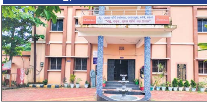
ରଞ୍ଜେଇଲୁଣ୍ଡା ପଞ୍ଚାୟତ ସମିତି କାର୍ଯ୍ୟାଳୟ ।

ବିଭାଗରେ ବୁଲି କନିଷ୍ଠ ଯନ୍ତ୍ରୀ ପଦବୀ ମଧ୍ୟରୁ ଅଧିକାରୀ ପଦବୀ ଖାଲି ପଡ଼ିଛି । ଜଣେ ଗ୍ରାମପଞ୍ଚାୟତ କାର୍ଯ୍ୟ ନିର୍ବାହୀ ଅଧିକାରୀ ଏହି ଦାୟିତ୍ୱ ଭୁଲାଇଛନ୍ତି ।