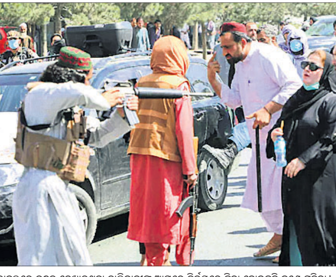
କାବୁଲରେ ବନ୍ଧୁକ ଦେଖାଇଥିବା ତାଲିବାନୀଙ୍କ ଆଗରେ ନିର୍ଭୟରେ ଛିଡ଼ା ହୋଇଛନ୍ତି ଜଣେ ମହିଳା।

କାବୁଲ, ଟି.ଏ. ସରକାର ଗଢ଼ିଲେ ମହିଳାଙ୍କ ସମେତ ସବୁ ବର୍ଗର ଲୋକଙ୍କୁ ସାମିଲ କରିବୁ। ଇସ୍ଲାମୀୟ ଆଇନ ଅନୁଯାୟୀ ମହିଳାମାନେ ଅଧିକାର ଓ ସ୍ୱାଧୀନତା ଉପଭୋଗ କରିବେ ବୋଲି କଥା ଦେଇଥିଲା ତାଲିବାନ୍। ହେଲେ ଆତଙ୍କବାଦୀ ସଙ୍ଘଠନ ସେପ୍ଟେମ୍ବର ୭ରେ କାମଚଳା ସରକାର ଗଠନ କରିବା ପରେ ନିଜ ପ୍ରତିଷ୍ଠିତକୁ ଓହ୍ଲାଇ ଯାଇଥିବା ମନେହେଉଛି। ନୂଆ କ୍ୟାବିନେଟ୍‌ରେ ଜଣେ ବି ମହିଳାଙ୍କୁ ସ୍ଥାନ ନ ଦେବା କଠୋରପକ୍ଷାକ ମହିଳା ବିରୋଧୀ ଚରିତ୍ରକୁ ପଦାରେ ପକାଇଛି। କେବଳ ସେତିକି ନୁହେଁ ସରକାର ଗଠୁ ଗଠୁ ମହିଳା ବିରୋଧୀ କଠୋର ନୀତି ପ୍ରଣୟନ ମଧ୍ୟ ଆରମ୍ଭ କରିଛି। ମହିଳାଙ୍କ ଅଧିକାର ଛଡ଼ାଇଦେଉଥିବା 'ଶରିଆ' ଆଇନକୁ ରୁଦ୍ଧ ଦେଖିବାକୁ ଲାଗୁ କରିବାକୁ ଯାଉଛି ତାଲିବାନ୍। କ୍ରିକେଟ୍ ସମେତ କୌଣସି କ୍ରୀଡ଼ା ଖେଳିବା ଅଧିକାର ମହିଳାଙ୍କ ନାହିଁ ବୋଲି ନିର୍ଦ୍ଦେଶ ଦେଇଛି। ହେଲେ ଏ ସବୁକୁ ରୁଦ୍ଧପାଦୁ ଦେଖି ସହିଯିବା ଏବଂ ଅଧିକାର ପାଇଁ ଲଢ଼େଇ ନ କରିବା ଉଚିତ୍ ମାନସିକତାକୁ ବହୁ ଉତ୍ସୁକ ଉଠିଛନ୍ତି ସାହସୀ ଆଫଗାନ ମହିଳା। ରାସ୍ତା ଉପରେ ଖୋଲାଖୋଲି ଭାବେ ସେମାନେ ଏହି କଠୋରପକ୍ଷା ଶାସକ ଗୋଷ୍ଠୀକୁ ବିରୋଧ କରୁଛନ୍ତି। ଆତଙ୍କବାଦୀଙ୍କ ବନ୍ଧୁକ ସାମନାରେ ସେମାନେ ବିରୋଧର ସ୍ୱରକୁ ଶାଣିତ କରିଛନ୍ତି।