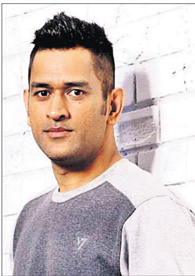
ମହେନ୍ଦ୍ର ସିଂ ଧୋନୀ