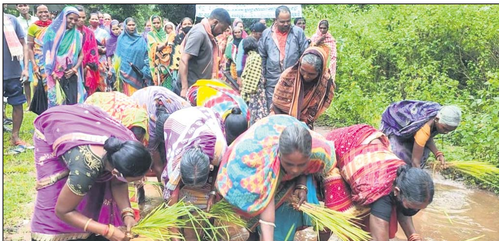
ରାସ୍ତାରେ ଲୋକେ ଧାନ ଚଳି ରୋଇଲେ ।

କନ୍ଧମାଳ ଜିଲ୍ଲା ବାଲିଗୁଡ଼ା ବ୍ଲକ୍ ବନ୍ଧୁଗୁଡ଼ା ପଞ୍ଚାୟତ ବିଳାସତ ରାଜ୍ୟ ଗ୍ରାମର ଚଞ୍ଚଳାସିଦ୍ଧି ପଞ୍ଚାୟତ ଅଧିକ ପର୍ଯ୍ୟଟନ ଦାମ୍ ୩ କି.ମି. ରାସ୍ତା କାମ କାମ ହେଉଛି । ବର୍ଷା ହେବାରୁ ଏହି କଳା ରାସ୍ତା ପାଣି କାନ୍ଥୁଥିବେ ଭାରି ହୋଇଛି ।