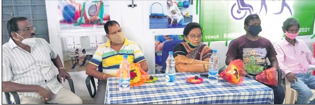
ମହାସୀନ ଅତିଥି ।