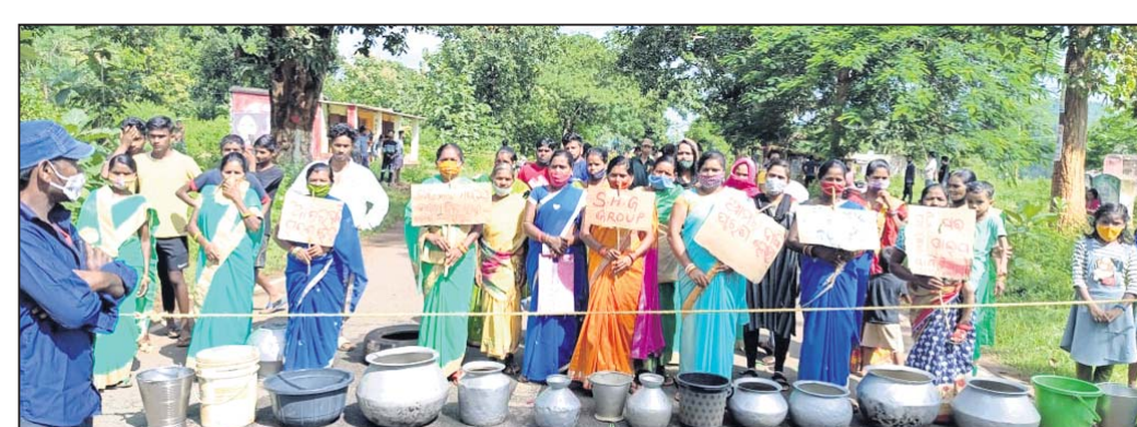
ଗ୍ରାମବାସୀ ରାସ୍ତା ରୋକେଇ କରିଛନ୍ତି ।

ଖଜୁରିପଡ଼ା ବ୍ଲକ୍ ପୁଲଗୁଡ଼ା ଗ୍ରାମବାସୀମାନେ ବୁଧବାର ପାନୀୟ ଜଳ ସମସ୍ୟା ନେଇ ଫୁଲବାଣୀଠାରୁ ଭୁବନେଶ୍ୱରକୁ ସଂଯୋଗ କରୁଥିବା ୫୭ ନମ୍ବର ଜାତୀୟ ରାଜପଥରେ ହାଣ୍ଡି ମାଠିଆ ରଖି ରାସ୍ତା ଅବରୋଧ କରିଥିଲେ ।