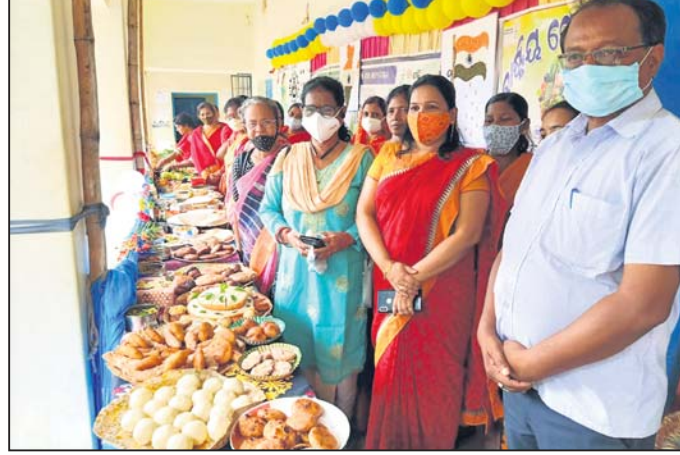
ପୃଷ୍ଠକର ଖାଦ୍ୟ ପ୍ରଦର୍ଶନୀ ।