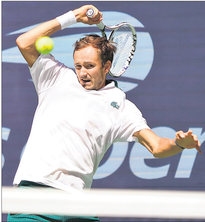
ରିଟର୍ଣ୍ଣ ଶର୍ତ୍ତ ଖେଳିବା ଅବସରରେ ଡାନିଲ ମେଡଭେଡେଭ।

ବର୍ଷର ଚତୁର୍ଥ ତଥା ଅନ୍ତିମ ଗ୍ରାଣ୍ଡସ୍ଲାମ ଟୁର୍ନାମେଣ୍ଟ ଫ୍ଲୋରିଡା ଓପେନ୍ ଟେନିସ ଟୁର୍ଣ୍ଣାମେଣ୍ଟର ଚତୁର୍ଥ ଦିନରେ ପହଞ୍ଚିଛି। ପୁରୁଷ ସିଙ୍ଗଲ ଲଭେଷ୍ଟରେ ଟ୍ରିଟାୟ ସିଡ୍ ମାନ୍ୟତା ପାଇଥିବା ରୁଷିଆର ଡାନିଲ ମେଡଭେଡେଭ ସେମିଫାଇନାଲରେ ପ୍ରବେଶ କରିଛନ୍ତି। ସେମିଫାଇନାଲରେ ସେ ବିଶ୍ୱର ୧୫ ନମ୍ବର ଖେଳାଳି କାନାଡାର ଫେଲିକ୍ସ ଅଗୋର ଆଲିଆଜିଫିଙ୍କୁ ଭେଟିବେ। ସେହିପରି ମହିଳା ସିଙ୍ଗଲରେ ଟ୍ରିଟାୟ ସିଡ୍ ମାନ୍ୟତା ପାଇଥିବା