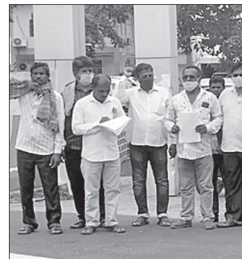
ସରକାରୀ ପୁଲ୍ୟରେ ସାର ଯୋଗାଇ ଦିଆଯାଉ