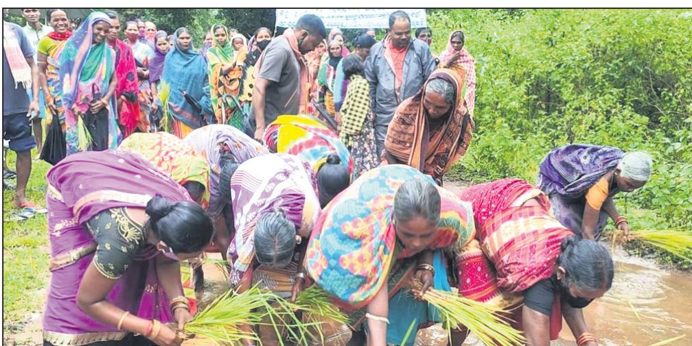
ରାସ୍ତାରେ ଲୋକେ ଧାନ ଚଳି ରୋଇଲେ ।

କନ୍ଧମାଳ ଜିଲ୍ଲା ବାଲିଗୁଡ଼ା ବ୍ଲକ୍ ବନ୍ଧୁଗୁଡ଼ା ପଞ୍ଚାୟତ ବିଳାସିନୀ ରାଜ୍ୟ ଗ୍ରାମର ପଞ୍ଚାୟତ ସଭାରେ ପଞ୍ଚାୟତ ଅଧିକ ପର୍ଯ୍ୟାୟ ଦାବୀ ୩ କି.ମି. ରାସ୍ତା କାମ କାର୍ଯ୍ୟ ହେଉଛି । ବର୍ଷା ହେବାରୁ ଏହି କମା ରାସ୍ତା ପାଣି କାନ୍ଥୁରେ ଭରି ହୋଇଛି ।