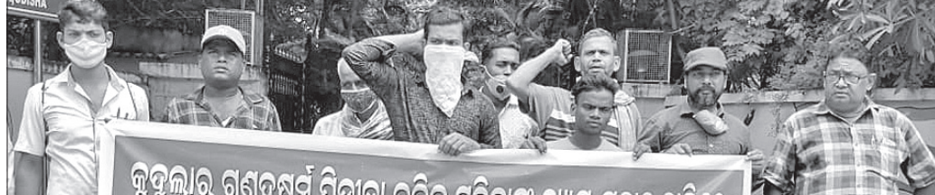
କୃଷିକର ଗଣତନ୍ତ୍ର ପ୍ରତିରୋଧକୁ ନ୍ୟାୟ ଦାବିରେ ଆରମ୍ଭ କରାଯାଇଛି