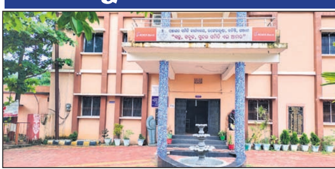
ରଞ୍ଜେଇଲୁଣ୍ଡା ପଞ୍ଚାୟତ ସମିତି କାର୍ଯ୍ୟାଳୟ ।

ବିଭାଗରେ ବୁକ୍ କନିଷ୍ଠ ଯନ୍ତ୍ରା ପଦବୀ ମଧ୍ୟରୁ ଅଧିକାରୀ ପଦବୀ ଖାଲି ପଡ଼ିଛି । ଜଣେ ଗ୍ରାମପଞ୍ଚାୟତ କାର୍ଯ୍ୟ ନିର୍ବାହୀ ଅଧିକାରୀ ଏହି ଦାୟିତ୍ୱ ତୁଲାଇଛନ୍ତି ।