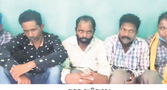
ଅଟକ ବ୍ୟକ୍ତିମାନେ ହୋଇ ପୁଜାପାଠ କରିବା ସହ ସେଠାରେ ଥିବା ଏକ ଶିଳିଳି ଗଛ ତଳେ ଗୁଣିଆ ସମେତ ୧୧ ଜଣଙ୍କୁ ଗ୍ରାମବାସୀ ସେମାନଙ୍କୁ କାରୁକରି ଗାଁ ବାହାରେ କେନ୍ଦ୍ରରେ ଅଟକ ରଖିଥିବା ଜଣାପଡ଼ିଛି। ସେହିପରି ସମ୍ପୂର୍ଣ୍ଣ ବ୍ୟକ୍ତିମାନେ