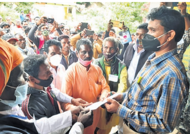
ଶୁଣି ଅଭିଯୋଗ କରାଯାଇଥିବା ପାଇଁ