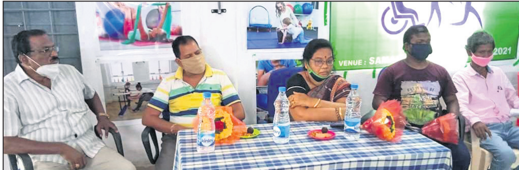
ବୈଠକରେ ଉପସ୍ଥିତ ଜିଲ୍ଲାପାଳ ଓ ଅନ୍ୟମାନେ ।

ପାରଳାଖେମୁଣ୍ଡି, ୮୮(ଡି.ଏନ.ଏ.): ଗଜପତି ଜିଲ୍ଲାର ଅଗ୍ରଣୀ ସ୍ୱେଚ୍ଛାସେବୀ ଅନୁଷ୍ଠାନ ସିସିଡି ଦ୍ୱାରା ବୁଧବାର ବିଶ୍ୱ ଫିଜିଓଥେରାପି ଦିବସ ପାଳନ କରାଯାଇଛି । ଏହି ଅବସରରେ ଫିଜିଓଥେରାପି ଦ୍ୱାରା ୩୦ ଜଣଙ୍କୁ ଆବଶ୍ୟକ ସଚେତନ କରାଯାଇ କେବଳ ଥେରାପି ମାଧ୍ୟମରେ ସେବା