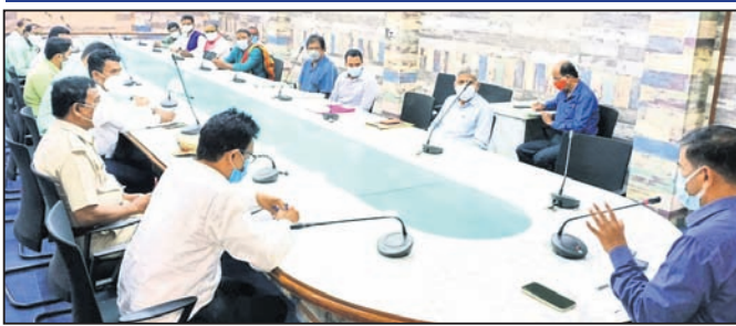
ବୈଠକରେ ଉପସ୍ଥିତ ଜିଲ୍ଲାପାଳ ଓ ଅନ୍ୟମାନେ ।

ମନ୍ଦିର ପର୍ଯ୍ୟନ୍ତ ଯୋଗାଣ ଲାଭ ଲାଭବା, ପର୍ଯ୍ୟଟକଙ୍କୁ ଆକର୍ଷିତ କରିବା ପାଇଁ ଭୂତଳମାଲ ନଗର ବିଜ୍ଞାନ ଆଲୋଚନା ବ୍ୟବସ୍ଥା କରିବାକୁ ସାଧ୍ୟତାକୁ ଧ୍ୟାନ ଦେଇ ପାଳିବା ନିର୍ଦ୍ଦେଶ ଦେଇଥିଲେ । ମନ୍ଦିରରେ ଅଧ୍ୟକ୍ଷ ତଥା ଜିଲ୍ଲାପାଳଙ୍କୁ ଜଣାଇଥିଲେ ।