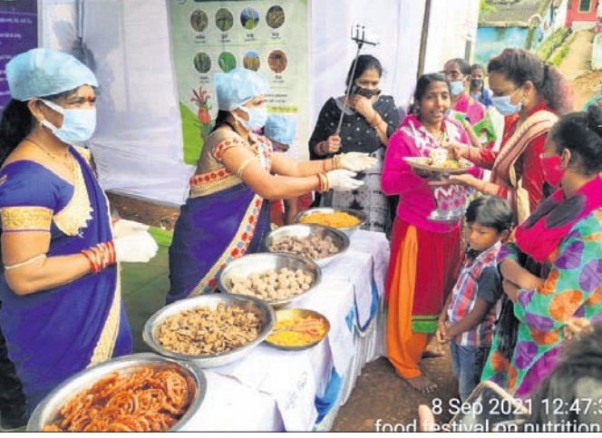
ଖାଇବା ଖୁଲରେ ଯୁବତୀଙ୍କ ଭିଡ଼।