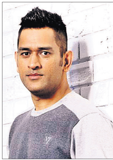
ମହେନ୍ଦ୍ର ସିଂ ଧୋନୀ