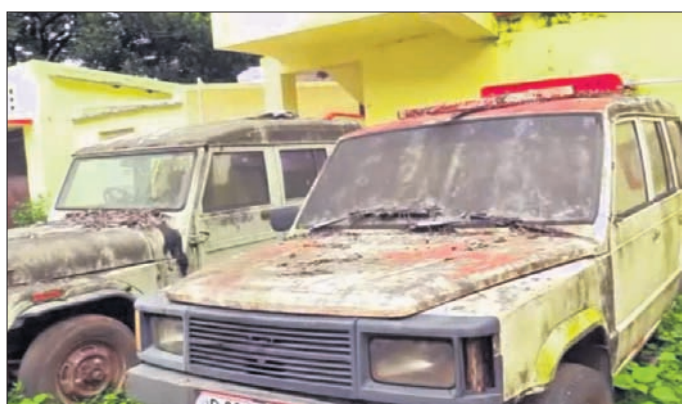
ସ୍ଵାସ୍ଥ୍ୟ ବିଭାଗର ଅଚଳ ଗାଡ଼ି