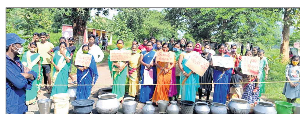
ଗ୍ରାମବାସୀ ରାସ୍ତା ରୋକେ କରିଛନ୍ତି ।

ପୁଲଗୁଡ଼ା ଗ୍ରାମବାସୀମାନେ ବୁଧବାର ପାନୀୟ ଜଳ ସମସ୍ୟା ନେଇ ଫୁଲବାଣୀଠାରୁ ଭୁବନେଶ୍ୱରକୁ ସଂଯୋଗ କରୁଥିବା ୫୭ ନମ୍ବର ଜାତୀୟ ରାଜପଥରେ ହାଣ୍ଡି ମାଠିଆ ରଖି ରାସ୍ତା ଅବରୋଧ କରିଥିଲେ ।