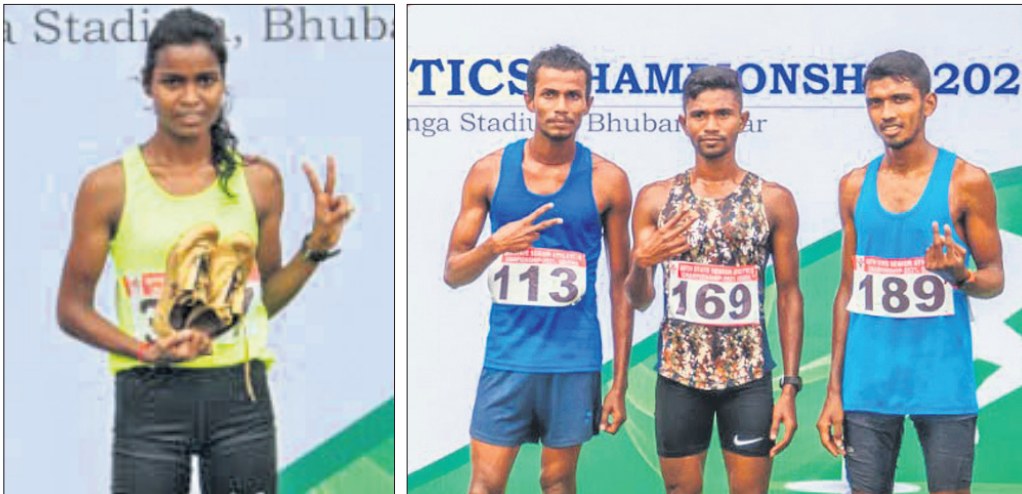
ରାଜ୍ୟ ଆଥଲେଟିକ୍ ମିର୍ କୃତୀ ପ୍ରତିଯୋଗୀମାନେ।

କରିଥିଲେ। ମେଡଭେଡେଭ ଚଳିତ ବର୍ଷ ଅଷ୍ଟ୍ରେଲିଆର ଓପେନ୍ ଫାଇନାଲରେ ନୋଭାକ ଡେକୋଭିଚ୍ଙ୍କଠାରୁ ପରାସ୍ତ ହୋଇଥିଲେ। ସେହିପରି ସେ ୨୦୧୯ ଓପେନ୍ ଫାଇନାଲରେ ରାଫାଲ ନାଡାଲଙ୍କଠାରୁ ପରାସ୍ତ ହୋଇଥିଲେ। ଅନ୍ୟପଟେ ମହିଳା ସିଙ୍ଗଲରେ ସାବାଲେଙ୍କା ଓ ଫର୍ନାଣ୍ଡୋ ପରସ୍ପରକୁ ଭେଟିବା ସମ୍ଭବ ହୋଇଛି। ସାବାଲେଙ୍କା କ୍ୱାର୍ଟର ଫାଇନାଲରେ ଚେକ୍ ଗଣରାଜ୍ୟର ଅଷ୍ଟିନ ସିଡ୍ ଖେଳାଳି ତଥା ଫ୍ରେଞ୍ଚ୍ ଓପେନ୍ ଚାମ୍ପିୟନ ବାରବୋରା କ୍ରେକିକୋଭାଙ୍କୁ ୬-୧, ୬-୪ ସେଟ୍ରେ ହରାଇ ସେମିଫିନାଲ ଉଠିବେ। ଏଥିପାଇଁ ସାବାଲେଙ୍କା କ୍ରମାଗତ ଚାରିଟା ଟୁର୍ଣ୍ଣାମେଣ୍ଟ ସେମିଫିନାଲରେ ପ୍ରବେଶ କରିଛନ୍ତି। ଏହାପୂର୍ବରୁ ସେ ଗତ ଫ୍ରେଞ୍ଚ୍ ଓପେନ୍ ଟୁର୍ଣ୍ଣାମେଣ୍ଟରେ ମଧ୍ୟ ସେମିଫାଇନାଲରେ ପ୍ରବେଶ କରିଥିଲେ। ୨ ଘଣ୍ଟା ୨୨ ମିନିଟ୍ରେ ସାବାଲେଙ୍କା ବିଜୟ ହାସଲ କରିଥିଲେ। ସେହିପରି ୧୯ ବର୍ଷୀୟା ଫର୍ନାଣ୍ଡୋ କୋଲିଓ ଅଲିମ୍ପିକ୍ ଟ୍ରୋଫି ପଦକ ବିଜୟିନୀ ବିଶ୍ୱର ୫ ନମ୍ବର ମହିଳା ଖେଳାଳି ଯୁକ୍ତେନର ଏଲିନା ଭିଗୋଲିନାଙ୍କୁ ୬-୩, ୩-୨, ୬-୨ ସେଟ୍ରେ ହରାଇ ବିପର୍ଯ୍ୟୟ ଘଟାଇବା ସହ ସେମିଫିନାଲରେ ପ୍ରବେଶ କରିଛନ୍ତି। ଏହାପୂର୍ବରୁ ସେ ଏକାଧିକ ଖେଳାଳିଙ୍କୁ ପରାସ୍ତ କରିଥିଲେ। ସେ ଜାପାନର ନାଓଫି ଓସାକା, ଆଷ୍ଟ୍ରେଲିଆର କର୍ବରଙ୍କୁ ହରାଇଥିଲେ।