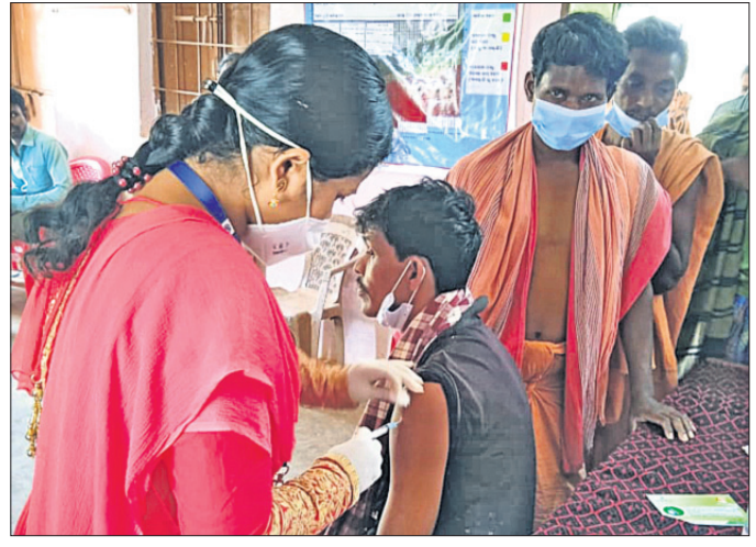
ଜଣେ ବ୍ୟକ୍ତିଙ୍କୁ ଚିକା ଦିଆଯାଉଛି।

ଡାକୁଗାଁ ବ୍ଲକ୍ କୋଇଲାର ପଞ୍ଚାୟତରେ ଶତ ପ୍ରତିଶତ କରୋନା ଚିକାକରଣ କରାଯାଇଛି। ଆଦିବାସୀ ଅଞ୍ଚଳରେ