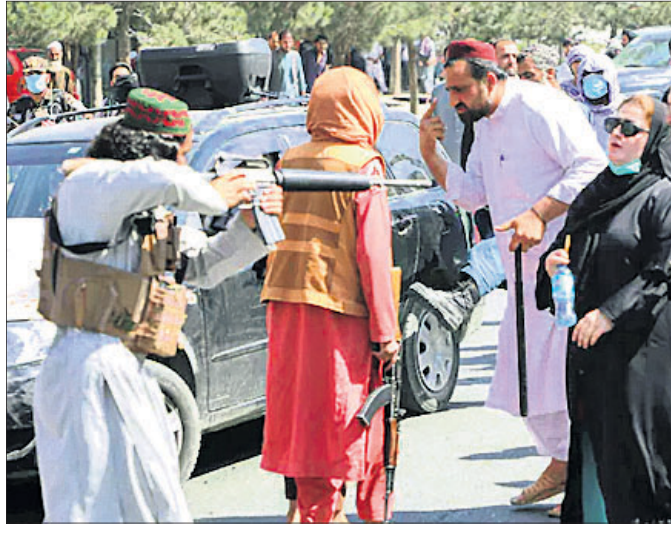
କାବୁଲରେ ବନ୍ଧୁକ ଦେଖାଇଥିବା ତାଲିବାନମାନଙ୍କ ଆଗରେ ନିର୍ଦ୍ଦୟରେ ଛିଡ଼ା ହୋଇଛନ୍ତି ଜଣେ ମହିଳା।

ସରକାର ଗଢ଼ିଲେ ମହିଳାଙ୍କ ସମେତ ସବୁ ବର୍ଗର ଲୋକଙ୍କୁ ସାମିଲ କରିବୁ। ଇସ୍ଲାମୀୟ ଆଇନ ଅନୁଯାୟୀ ମହିଳାମାନେ ଅଧିକାର ଓ ସ୍ୱାଧୀନତା ଉପଭୋଗ କରିବେ ବୋଲି କଥା ଦେଇଥିଲା ତାଲିବାନ୍।