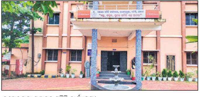
ରଞ୍ଜେଇଲୁଣ୍ଡା ପଞ୍ଚାୟତ ସମିତି କାର୍ଯ୍ୟାଳୟ।

ବିଭାଗରେ ବୁଲି କନିଷ୍ଠ ଯନ୍ତ୍ରୀ ପଦବୀ ମଧ୍ୟରୁ ଅଧିକାରୀ ପଦବୀ ଖାଲି ପଡ଼ିଛି। ଗଞ୍ଜାମ ଗ୍ରାମପଞ୍ଚାୟତ କାର୍ଯ୍ୟ ନିର୍ବାହୀ ଅଧିକାରୀ ଏହି ଦାୟିତ୍ୱ ତୁଲାଇଛନ୍ତି।