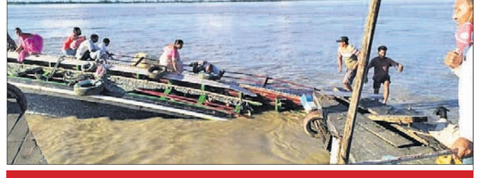
ବ୍ରହ୍ମପୁତ୍ରରେ ୨ ବୋର୍ ଧକ୍କା: ଜଣେ ମୃତ

ଭର୍ତ୍ତି କରାଯାଇଛି। ବୋର୍ଟି ଅପରାହ୍ନ ପ୍ରାୟ ସାଢ଼େ ୪ଟା ବେଳେ କୋରୁଆର ନିମିତ୍ତ ଘାଟରୁ ମାଲୁଲି ନଦୀ ବ୍ରାପ ଅଭିମୁଖେ ଯାଉଥିବାବେଳେ ବିପରୀତ ଦିଗରୁ ଆସୁଥିବା ଅନ୍ୟ ଏକ ବୋର୍ ସହ ଧକ୍କା ହୋଇଥିଲା।