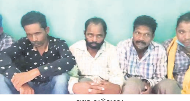
ଅଟକ ବ୍ୟକ୍ତିମାନେ ହୋଇ ପୂଜାପାଠ କରିବା ସହ ସେଠାରେ ଥିବା ଏକ ଶିଳିଳ ଗଛ ତଳେ ଗୁପ୍ତଧନ ଥିବା ଆଶାରେ ଖୋଜୁଥିଲେ।

ବିଷମକଟକ, ଟି.ଏ.ଏ. (ବି.ଏନ.ଏ.) ଅନ୍ଧବିଶ୍ୱାସର ବଶବର୍ତ୍ତୀ ହୋଇ ଅମାତ୍ୟ ଗୀତରେ ଗୁପ୍ତଧନ ଖୋଜିବାକୁ ଯାଇଥିଲେ।