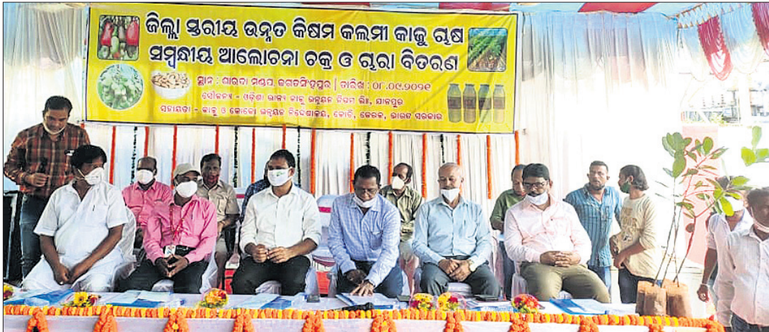
ଜରଦାୟିକ ପ୍ରକଳ୍ପର ଉଦ୍ଦେଶ୍ୟ ଉପରେ ଆଲୋଚନା କରୁଥିବା ଉପସ୍ଥିତ ଅତିଥିମାନେ।