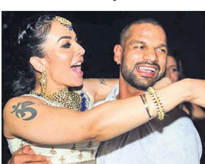
ଆୟୋଗୀ ମୁଖ୍ୟାର୍ଚ୍ଚା ଓ ଶିଖର ଧାଡ଼ୁନ ।