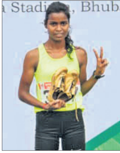
ରାଜ୍ୟ ଅଥଲେଟିକ୍ ମିର୍ କ୍ରୀଡ଼ା ପ୍ରତିଯୋଗୀମାନେ ।

ସେମିରେ ମେଡ଼ାଟେଭ, ସାବାଲେଙ୍କା ସାହିଲ, ସମ୍ମିତାଙ୍କ ନୂଆ ମିର୍ ରେକର୍ଡ