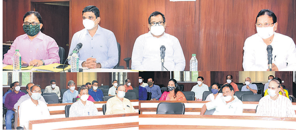
ବିଭାଗର ପ୍ରମୁଖ ଶାସନ ସଚିବ ବିଷୁପଦ ସେଠା ଓ ଅନ୍ୟ ଅଧିକାରୀମାନେ କାର୍ଯ୍ୟକ୍ରମ ସମ୍ପର୍କରେ ସୂଚନା ଦେଉଛନ୍ତି।

'ଆଜାଦି କା ଅମ୍ବିତ ମହୋତ୍ସବ' ପାଇଁ ଆମ ସମସ୍ତଙ୍କ ପାଇଁ ଗର୍ବ ଓ ଗୌରବର ବିଷୟ। ନୂଆ ଆଭିଯୋଗ ଓ ସଂକଳ୍ପ ନେଇ ଏହି ମହୋତ୍ସବ ପାଳନରେ ବିଭାଗୀୟ କାର୍ଯ୍ୟକ୍ରମ ନିର୍ଦ୍ଧାରଣ କରିବାକୁ ସୂଚନା ଓ ଲୋକସମ୍ପର୍କ ବିଭାଗର ପ୍ରମୁଖ ଶାସନ ସଚିବ ବିଷୁପଦ ସେଠା ବିଭାଗୀୟ ଅଧିକାରୀଙ୍କୁ ପରାମର୍ଶ ଦେଇଛନ୍ତି।