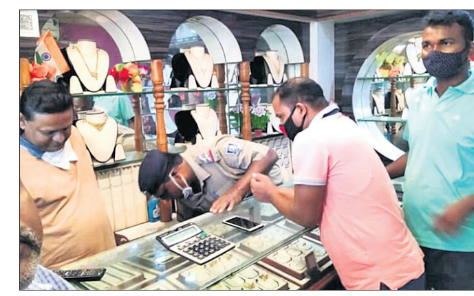
ପୋଲିସ ବୋକାନ୍‌ରେ ପହଞ୍ଚି ଦେଖି କରୁଛି। ନୟାଗଡ଼ ଅଫିସ/ ରମାପୁର, ୮୯ (ସ.ପ୍ର.)

ନୟାଗଡ଼ ଜିଲ୍ଲା ରମାପୁର ଥାନା ଅଧୀନ ଗୋପାଳପୁର ପାଲ ଛୁଙ୍କଲୀରୁ ଖୁରୁ ମାଗିବା ଆଳରେ ଜଣେ ଲୁଚେରା ୪ ପୁନା ପୁତି ଓ ୩ ହଜାର ଟଙ୍କା ନେଇ ଫେରାର ହୋଇଯାଇଛନ୍ତି।