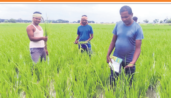
ଚାଷୀମାନେ ଧାନ ଗଛରେ ହୋଇଥିବା ଥୋଡ଼କୁ ଦେଖାଉଛନ୍ତି।

ବିକ୍ରୟ କରିଥିବା ଦୋକାନୀ କହିଥିଲେ। ବିହନ କୁଟରଣରେ ସ୍ୱଳ୍ପ ପର୍ଯ୍ୟନ୍ତ ବାଉଁଶର ବ୍ୟବହାର ହୋଇଥିବାରୁ ଚାଷୀମାନଙ୍କୁ ହତାଶ କରିଛି। ଉପରେ ଲୋଣା ରହିଛି ଉଣା ବିହନ କ୍ରୟ ସମୟରେ ଦୋକାନୀଙ୍କ ପକ୍ଷରୁ ଚାଷୀଙ୍କୁ କୌଣସି ରାଶି ପ୍ରଦାନ କରାଯାଇ ନାହିଁ।