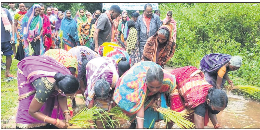
ରାସ୍ତାରେ ଲୋକେ ଧାନ ଚଳି ରୋଇଲେ।

କନ୍ଧମାଳ ଜିଲ୍ଲା ବାଲିଗୁଡ଼ା ବ୍ଲକ ବନ୍ଧୁଗୁଡ଼ା ପଞ୍ଚାୟତ ବିଳାସତୀ ରାଜ୍ୟ ଗ୍ରାମର ଚଞ୍ଚଳାସିଦ୍ଧି ପଞ୍ଚାୟତ ଅଧିକ ପର୍ଯ୍ୟନ୍ତ ଦୀର୍ଘ ୩ କି.ମି. ରାସ୍ତା କାମ ହେଉଛି।