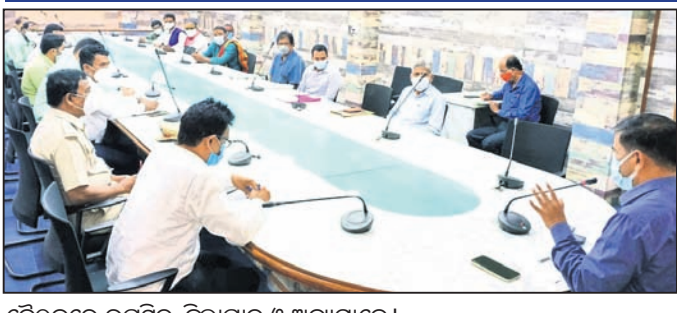
ବୈଠକରେ ଉପସ୍ଥିତ ଜିଲ୍ଲାପାଳ ଓ ଅନ୍ୟମାନେ।

ମନ୍ଦିର ପର୍ଯ୍ୟନ୍ତ ଯୋଗାଣ ଲାଭ ଲାଭକାରୀ, ପର୍ଯ୍ୟଟକଙ୍କୁ ଆକର୍ଷିତ କରିବା ପାଇଁ ଭୂତଳମାଲ ନଗର ବିଜ୍ଞାନ ଆଲୋଚନା ବ୍ୟବସ୍ଥା କରିବାକୁ ସାଧନାବୋଧକୁ ଲୋଚନା ନିର୍ଦ୍ଦେଶ ଦେଇଥିଲେ।