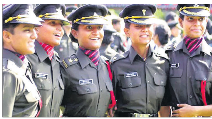
କୌଲି ଏବଂ ଏନ୍.ଏନ୍. ସୁନ୍ଦରଗଣ୍ଡୁ ନେଇ ଗଠିତ ଖଣ୍ଡପାଠ ଏହାର ଶୁଣାଣି କରି କହିଛନ୍ତି, ସଶସ୍ତ୍ର ବଳ ଏକ ଗୁରୁତ୍ୱପୂର୍ଣ୍ଣ ଭୂମିକା ନେଇଥାଆନ୍ତି।

ସୁପ୍ରିମକୋର୍ଟ ନିର୍ଦ୍ଦେଶ ଦେଇଛନ୍ତି। ଏନ୍ଡିଏ ପ୍ରବେଶିକା ପରୀକ୍ଷାରେ ମହିଳାମାନେ ବସିପାରିବେ ବୋଲି ସୁପ୍ରିମକୋର୍ଟ ଏକ ଅନ୍ତରାଣ ଐତିହାସିକ ରାୟ ଦେବାର ମାସକ ଭିତରେ ସଦ୍ୟ ଶୁଣାଣି ହୋଇଛି।