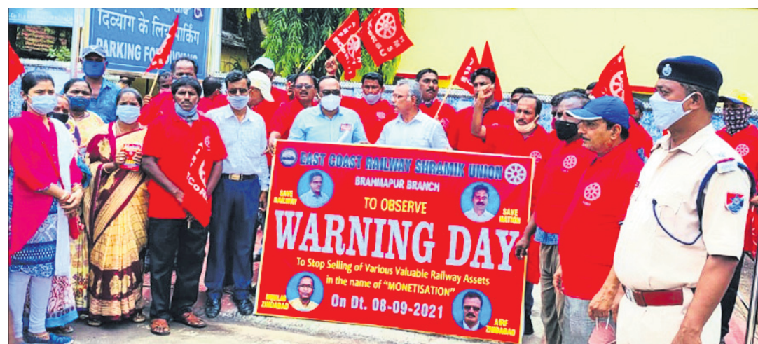
ଚେତାବନୀ ଦିବସରେ ସଂଘର କର୍ମକର୍ମୀ। ବ୍ରହ୍ମପୁର ଅଫିସ, ୮୯

କେନ୍ଦ୍ର ସରକାରଙ୍କ ବିପ୍ରଦାନ ଓ ଭାରତୀୟ ରେଳବାଇକୁ ଘରୋଇ ସଂସ୍ଥାକୁ ହସ୍ତାନ୍ତର କରିବା ପଦକ୍ଷେପକୁ ଉତ୍ତରାଞ୍ଚଳ ରେଳଠାରେ ଶ୍ରମିକ ସଂଘରୁ ପ୍ରତିରୋଧ ଗଣାଯାଇଛି।