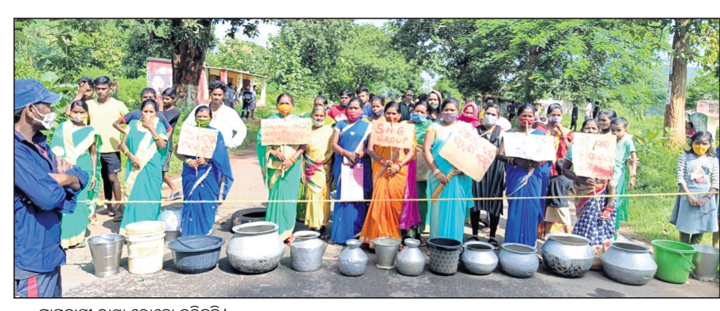
ଗ୍ରାମବାସୀ ରାସ୍ତା ରୋକେ କରିଛନ୍ତି।

ଖଜୁରିପଡ଼ା ବ୍ଲକ ଫୁଲବାଣୀ ଗ୍ରାମବାସୀମାନେ ବୁଧବାର ପାନୀୟ ଜଳ ସମସ୍ୟା ନେଇ ଫୁଲବାଣୀଠାରୁ ଭୁବନେଶ୍ୱରକୁ ସଂଯୋଗ କରୁଥିବା ୫୭ ନମ୍ବର ଜାତୀୟ ରାଜପଥରେ ହାଣ୍ଡି ମାଠିଆ ରଖି ରାସ୍ତା ଅବରୋଧ କରିଥିଲେ।