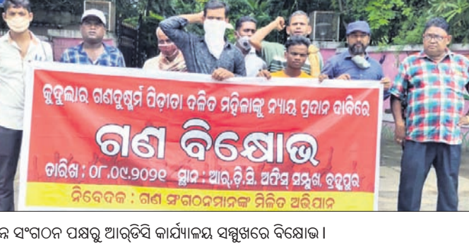
ବିଭିନ୍ନ ସଂଗଠନ ପକ୍ଷରୁ ଆର୍ଡ଼ିସି କାର୍ଯ୍ୟାଳୟ ସମ୍ମୁଖରେ ବିରୋଧ।

କୁଟୁମ୍ଭା ଗଣବଳାହାର ପାଡ଼ିତାଙ୍କୁ ନ୍ୟାୟ ପ୍ରଦାନ ଦାବିରେ ରୁଧିରା ଗଣ ସଂଗଠନମାନଙ୍କର ମିଳିତ ଅଭିଯାନ ପକ୍ଷରୁ ରୁଧିରା ପୁଞ୍ଜି ଶାସନରୁ ଉଦ୍ଧାରଣ ପଦକ୍ଷେପ ନେବାକୁ ନିମନ୍ତରଣ (ଆର୍ଡ଼ିସି)କୁ ଏକ ଦାବିପତ୍ର ପ୍ରଦାନ କରାଯାଇଛି।