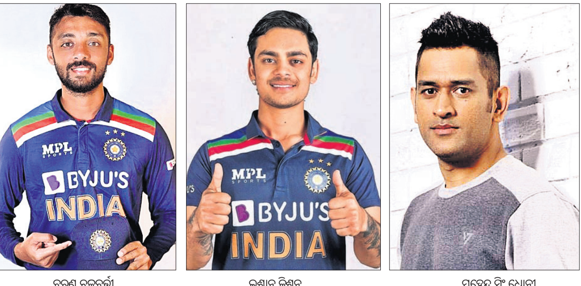
ବରୁଣ ଚକ୍ରବର୍ତ୍ତୀ, ଇଶାନ କିଶନ, ମହେନ୍ଦ୍ର ସିଂ ଧୋନୀ