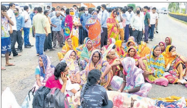
ଠିକା ବିଶୋଧନାଗାର ଗେଟ୍ ଆଗରେ ମୃତଦେହ ରଖି ଧାରଣା।

ପାରାଦୀପ ଠିକା ବିଶୋଧନାଗାର ପ୍ରକଳ୍ପ ୨ ନଂ. ଗେଟ୍ ସମ୍ମୁଖରେ ରୁଧିରାଶ୍ରମ ଶ୍ରମିକମାନଙ୍କ ଦ୍ୱାରା ମୃତଦେହ ରଖି ଧାରଣା ଦିଆଯାଇଛି। ମୃତକଙ୍କ ପରିବାରକୁ ୨୦ ଲକ୍ଷ ଟଙ୍କା ଓ ପରିବାରର ଜଣଙ୍କୁ ନିୟୁତ ଦାବି କରାଯାଇଛି।