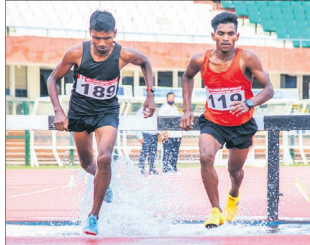
ରାଜ୍ୟ ଆଥଲେଟିକ୍ ମିର୍ଚ୍ଚ ଅନ୍ତିମ ଦିବସରେ ଅଂଶଗ୍ରହଣ କରିଥିବା ପ୍ରତିଯୋଗୀମାନେ।