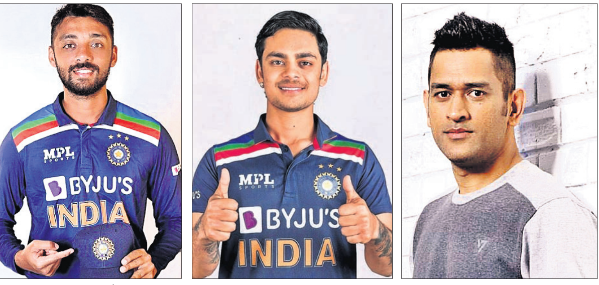
ବରୁଣ ଚକ୍ରବର୍ତ୍ତୀ ଜଶାନ କିଶନ ମହେନ୍ଦ୍ର ସିଂ ଧୋନୀ

ନୂଆଦିଲ୍ଲୀ, ୮।୯ ଯୁଦ୍ଧଭାଙ୍ଗି ଆରବ ଏମିରେଟ୍ସ (ୟୁଏଇ) ଓ ଓମାନରେ ଆସବା ଅକ୍ଟୋବର ୧୭ରୁ ନଭେମ୍ବର ୧୪ ମଧ୍ୟରେ ହେବାକୁ ଥିବା ଚିନ୍ତା କ୍ରମେ ବିଶ୍ୱକପ୍ ପାଇଁ ଭାରତୀୟ ଦଳ ଯୋଗ୍ୟତା କରାଯାଇଛି। ରୁଧିରା ଦୋଷି ୧୫ ଜଣିଆ ଦଳକୁ ଅଭିଜ୍ଞ ଶିଳ୍ପୀ ଅଲରାଉଡ଼ର ରବିଚନ୍ଦ୍ରନ ଅଶ୍ୱିନ ପ୍ରତ୍ୟାବର୍ତ୍ତନ କରିଥିବା ବେଳେ ରିଷ୍ଟି ଶିଳ୍ପୀ ଯୁଜବେନ୍ଦ୍ର ଚନ୍ଦ୍ରକ ଓ ଭେଟେରାନ ଓପନର ଶିଖର ଧାଞ୍ଜଲୁ ବାଦ୍ ଦିଆଯାଇଛି। ଆଶ୍ଚର୍ଯ୍ୟଜନକ ଭାବେ ପୂର୍ବତନ ଅଧିନାୟକ ମହେନ୍ଦ୍ର ସିଂ ଧୋନୀଙ୍କୁ ଦଳରେ ମେଣ୍ଡର ଦାୟିତ୍ୱ ପ୍ରଦାନ କରାଯାଇଛି। ସେ ତୁର୍କିମେଣ୍ଡରେ ମୁଖ୍ୟ କୋର୍ ଚିନ୍ତା ଶାସ୍ତ୍ରୀଙ୍କୁ ସହଯୋଗ କରିବେ ବୋଲି ଭାରତୀୟ କ୍ରିକେଟ କଣ୍ଟ୍ରୋଲ ବୋର୍ଡ (ବିସିଆଇ) ସମ୍ପାଦକ ଜୟ ଶାହା