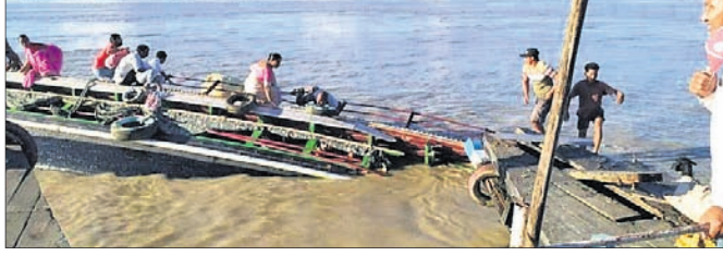
ବ୍ରହ୍ମପୁତ୍ରରେ ୨ ବୋଟ୍ ଧକ୍କା: ଜଣେ ମୃତ

ଗୁଆହାଟୀ, ୮ ଡି: ଆସାମରେ ବ୍ରହ୍ମପୁତ୍ର ନଦୀରେ ବୁଧବାର ବୁଡ଼ି ଚାଲିଯିବାର ମୁହାଁ ମୁହାଁ ଧକ୍କା ହୋଇଛି। ଏଥିରେ ଜଣକର ମୃତ୍ୟୁ ଘଟିଥିବାବେଳେ ୫୦ରୁ ଊର୍ଦ୍ଧ୍ୱ ଯାତ୍ରୀ ନିଖୋଜ ହୋଇଯାଇଛନ୍ତି। ବୁଲି ବୋଟ୍‌ରେ ୧୨୦ ଯାତ୍ରୀ ଥିଲେ। ଉଦ୍ଧାର କାର୍ଯ୍ୟରେ ଜାତୀୟ ବିପର୍ଯ୍ୟୟ ପ୍ରଶମନ ବଳ (ଏନ୍‌ଡିଆର୍‌ଏଫ୍) ଏବଂ ରାଜ୍ୟ ବିପର୍ଯ୍ୟୟ ପ୍ରଶମନ ବଳ (ଏସ୍‌ଡିଆର୍‌ଏଫ୍)ର ଯବାନମାନେ ନିଯୋଜିତ ହୋଇଛନ୍ତି। ଉଦ୍ଧାର ହୋଇଥିବା ଜଣେ ଶିଶୁ ସମେତ ଅନ୍ୟ କେତେଜଣଙ୍କୁ ନିକଟସ୍ଥ ହସ୍ପିଟାଲରେ