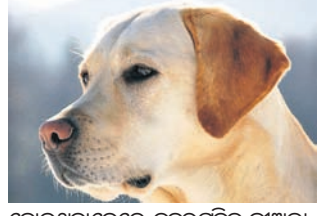
ଶିବାମୋହୀ, ୮ ଡି: (ଅଧିକ ସଂସ୍କରଣ)

ଶିବାମୋହୀ, ୮ ଡି: (ଅଧିକ ସଂସ୍କରଣ) କର୍ମଚାରୀଙ୍କୁ ଶିବାମୋହୀ ଜିଲ୍ଲାରେ କେତେକ କୁକୁର ୧୫୦ କୁକୁରଙ୍କୁ ଜିଅନ୍ତା ପୋଡ଼ିଦେଲେ। ସେପ୍ଟେମ୍ବର ୪ରେ ଭଦ୍ରାବତୀ ସହର ନିକଟ ରଜନୀଥପୁରୀରେ ଏଭଳି ଅପରାଧୀୟ ଘଟଣା ଘଟିଥିବା ପୋଲିସ୍ କହିଛି। ଜଣାଲେ କୁକୁରଙ୍କ ଭୋକିବା ଶବ୍ଦ ଶୁଣୁଥିବାବେଳେ ହଠାତ୍ ବନ୍ଦ ହୋଇଥିବାରୁ ସ୍ଥାନୀୟ ଲୋକେ ସନ୍ଦେହ କରି ପ୍ରାଣୀ ଅଧିକାର କର୍ମୀଙ୍କୁ ଜଣାଇଥିଲେ। ସେମାନେ ଘଟଣାସ୍ଥଳରେ ପହଞ୍ଚିବା ପରେ କୁକୁରଗୁଡ଼ିକୁ ପୋଡ଼ାଯାଇଥିବା ଜଣାପଡ଼ି ପାଇଥିଲେ। ଭଦ୍ରାବତୀ ଗ୍ରାମାଞ୍ଚଳ ଆନରେ ଏନେଇ ମାମଲା ରୁଟ୍