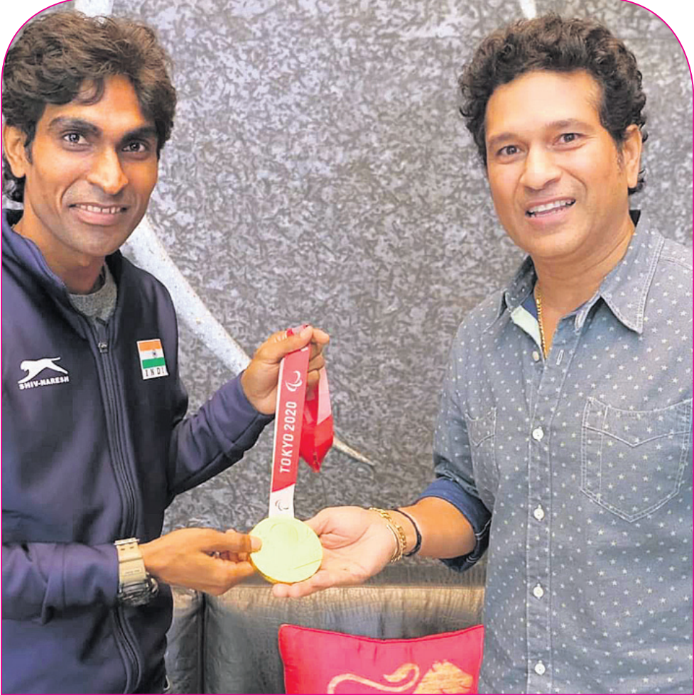
ପ୍ରତିଷ୍ଠିତ କ୍ରିକେଟର ସଚିନ ଚେନ୍ନାଇଙ୍କୁ ପୁରସ୍କାର ପାଇଁ ପୁରସ୍କାର ପ୍ରଦାନ କରୁଥିବା ସ୍ୱପ୍ନ ସାକାର ହୋଇଛି ବୋଲି ପ୍ରମୋଦ କହିଛନ୍ତି।