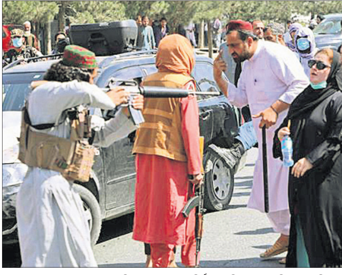
କାବୁଲରେ ବନ୍ଧୁକ ଦେଖାଇଥିବା ତାଲିବାନୀଙ୍କ ଆଗରେ ନିର୍ଦ୍ଦୟରେ ଛିଡ଼ା ହୋଇଛନ୍ତି ଜଣେ ମହିଳା।

କାବୁଲ, ୮ ଡି: ସରକାର ଗତକାଳ ମହିଳାଙ୍କ ସମେତ ସବୁ ବର୍ଗର ଲୋକଙ୍କୁ ସାମିଲ କରିବୁ। ଇସ୍ଲାମୀୟ ଆଇନ ଅନୁଯାୟୀ ମହିଳାମାନେ ଅଧିକାର ଓ ସ୍ୱାଧୀନତା ଉପସାଧନ କରିବେ ବୋଲି କଥା ଦେଇଥିଲେ। ତାଲିବାନ୍‌ ହେଲେ ଆତଙ୍କବାଦୀ ସଙ୍ଘଠନ ସେପ୍ଟେମ୍ବର ୭ରେ କାମେରା ସରକାର ଗଠନ କରିବା ପରେ ନିଜ ପ୍ରତିଷ୍ଠିତକୁ ଓହ୍ଲାଇ ଯାଇଥିବା ମନେହୋଇଛି। ନୂଆ କ୍ୟାବିନେଟ୍‌ରେ ଜଣେ ବି ମହିଳାଙ୍କୁ ସ୍ଥାନ ନ ଦେବା କଠୋରପନ୍ଥା ମହିଳା ବିରୋଧୀ ଚରିତ୍ରକୁ ପଦାରେ ପକାଇଛି। କେବଳ ସେତିକି ନୁହେଁ ସରକାର ଗତକାଳ ମହିଳା ବିରୋଧୀ କଠୋର ନୀତି ପ୍ରଣୟନ ମଧ୍ୟ ଆରମ୍ଭ କରିଛନ୍ତି। ମହିଳାଙ୍କ ଅଧିକାର ଛଡ଼ାଇଦେଉଥିବା 'ଶରିଆ' ଆଇନକୁ ରୁଜୁତ କରିବାକୁ ଶୀଘ୍ର ନିଆଁ ଲାଗିଲା ବୋଲି ଚେତନା ଦେଇଛି। ହେଲେ ଏ ସବୁକୁ ରୁପଚାପ୍ ସହିଯିବା ଭଳି ମାନସିକତାରୁ ବହୁ ଆଫଗାନ ମହିଳାଙ୍କ