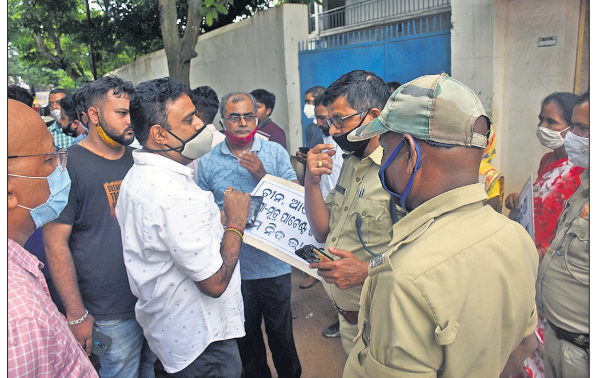
ଧରତ୍ରୀରେ ଗତ ୨୪ଘଣ୍ଟାରେ ପ୍ରକାଶିତ ସମ୍ପାଦକାୟକୁ ବିରୋଧ କରି ମିଳିତ ଗୋରକ୍ଷା ମହାସମାବେଶ ପକ୍ଷରୁ ରୁପ୍ୟାରେ ଭୁବନେଶ୍ୱର ଧରତ୍ରୀ କାର୍ଯ୍ୟାଳୟ ସମ୍ମୁଖରେ ବିରୋଧ ପ୍ରଦର୍ଶନ।

୧୦,୧୩,୫୬୭ରେ ପହଞ୍ଚିଛି। ସେହିପରି ରାଜ୍ୟରେ ପୁଣି ୮ଜଣଙ୍କ କାବନ ନେଇଛି ଏହି ମହାମାରୀ। ମୃତକଙ୍କ ମଧ୍ୟରେ ଭୁବନେଶ୍ୱର ଓ ତେଜନାଳକୁ ୨ଜଣ ଲେଖାଏଁ ଥିବାବେଳେ ଅନୁଗୋଳ, ବାଲେଶ୍ୱର, କେନ୍ଦୁଝର ଓ କୋରାପୁଟକୁ ଜଣେ ଲେଖାଏଁ ମୃତକ ରହିଛନ୍ତି। ଏମାନଙ୍କୁ ନିଶାଳ ରାଜ୍ୟରେ କରୋନାଜନିତ ମୃତ୍ୟୁ ୮,୦୬୦କୁ ବୃଦ୍ଧି ପାଇଛି। ରୁପ୍ୟାରେ ଆଉ ୫୭୪ଜଣ ଆକ୍ରାନ୍ତ କରୋନାକୁ ସୁସ୍ଥ ହୋଇଥିବା ଆରୋଗ୍ୟ ସଂଖ୍ୟା ୯,୯୯,୧୭୫କୁ ବୃଦ୍ଧି ପାଇଛି। ବର୍ତ୍ତମାନ ୬,୨୭୯ଜଣ ସକ୍ରିୟ ରୋଗୀ ରହିଛନ୍ତି।