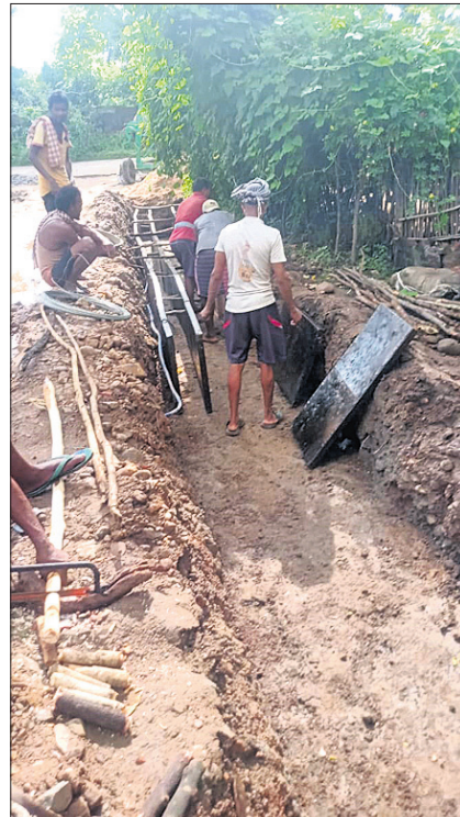
ଡ୍ୱାର୍ଡ ଚାର୍ଜ କଲୋନୀରେ ଡ୍ରେନ୍ କାର୍ଯ୍ୟ ।