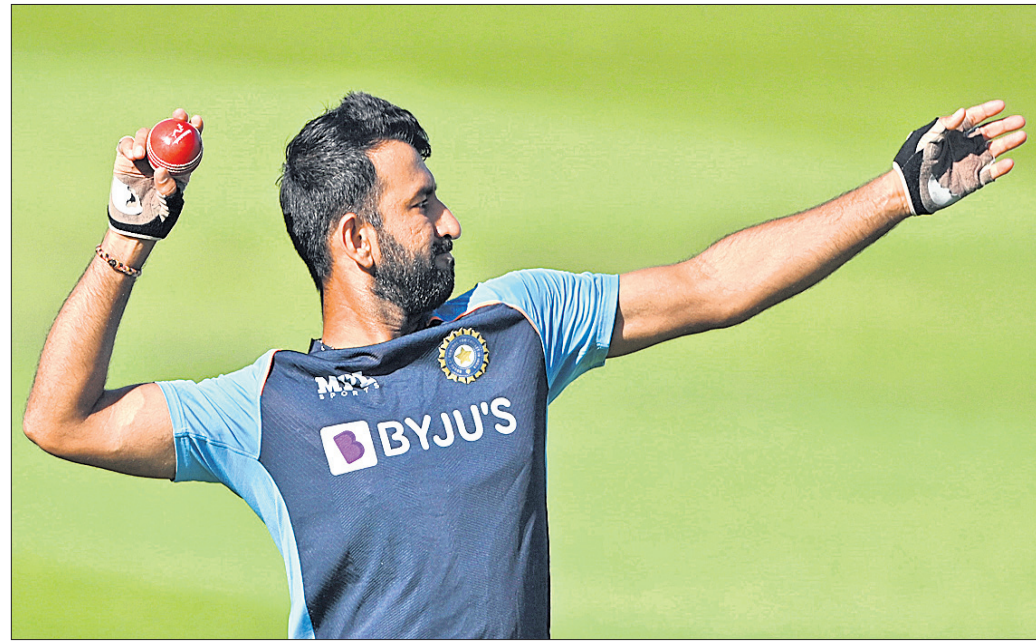
ଅଭ୍ୟାସ ଅବସରରେ ଚେଷ୍ଟାରେ ପୂଜାରୀ ।