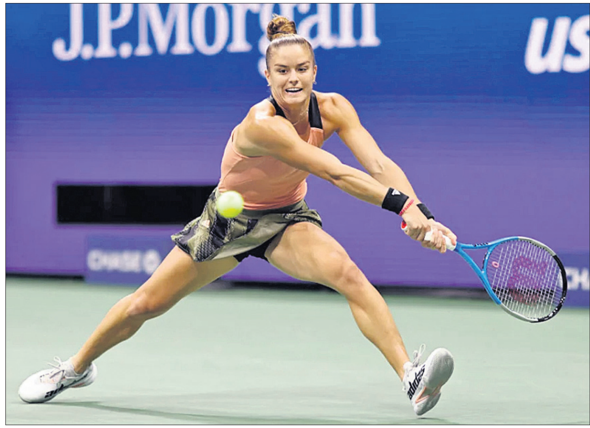
ସୁଧାଂଶୁ ଓପନ ଗ୍ରାଣ୍ଡସ୍ଲ୍ୟାମ୍ ଟେନିସ୍ ମହିଳା ବିଜେତା କ୍ୱାର୍ଟର ଫାଇନାଲ ଅବସରରେ ଗ୍ରୀସର ମାରିଆ ସାକାରି।