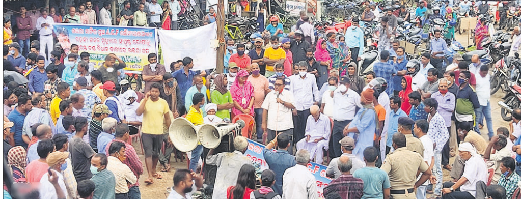
ଖଇରା ବୁକ୍ ଛକରେ ଉତ୍ତ୍ୟକ୍ତ ଲୋକଙ୍କ ପଥପ୍ରାଚ ସଭା।

ଭୁବନେଶ୍ୱର, ୯।୯ (ବ୍ୟୁରୋ) ଅନୁଗୋଳ ୧୬, ଭଦ୍ରକ ୧୫, କୋରାପୁଟ ୧୪, ଡେକାନାଲ ୧୨, କୋରାପୁଟ, ନୟାଗଡ଼ ଓ ରାୟଗଡ଼ା ୧୧ଜଣ ଲେଖାଏ, ଝାରସୁଗୁଡ଼ା ୯, ଦେବଗଡ଼ ଓ କେନ୍ଦୁଝରରୁ ୫ଜଣ ଲେଖାଏ, ଗଞ୍ଜାମ ୪, ମାଲକାନଗିରି, ନବରଙ୍ଗପୁର ଓ ଭଦ୍ରକରୁ ୩ଜଣ ଲେଖାଏ, ବଲାଙ୍ଗୀର ୨, ନୂଆପଡ଼ା ଓ କଳାହାଣ୍ଡିରୁ ଜଣେ ଲେଖାଏ ଏବଂ ସେତୁ ପୁଲରୁ ୭୬ଜଣ ନୂଆ ପଜିଟିଭ୍ ଚିହ୍ନଟ ହୋଇଛନ୍ତି। ଏପଟେ କରୋନାରେ ଆଉ ୮ଜଣଙ୍କ ମୃତ୍ୟୁ ହୋଇଛି। ଅନୁଗୋଳ ଜିଲ୍ଲାରୁ ୩ଜଣ, ଖୋର୍ଦ୍ଧାରୁ ୨ଜଣ, ଯାଜପୁର, ମୟୂରଭଞ୍ଜ ଓ ନବରଙ୍ଗପୁରରୁ ଜଣେ ଲେଖାଏ ଆକ୍ରାନ୍ତ ଆଖି ବୁଜିଛନ୍ତି। ଫଳରେ କରୋନାଜନିତ ମୃତ୍ୟୁ ୮,୦୭୮କୁ ବୃଦ୍ଧି ପାଇଛି।