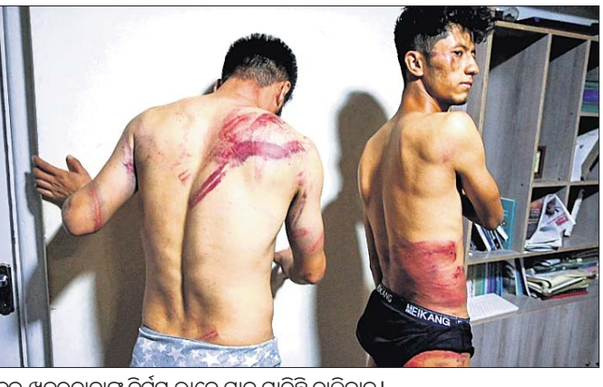
ଭଲ ଖବରଦାତାଙ୍କୁ ନିର୍ମମ ଭାବେ ମାଡ଼ ମାରିଛି ତାଲିବାନ୍। ତାଲିବାନ୍ କଟକଣା ଲାଗି କରିଛି। କିନ୍ତୁ ଶିକ୍ଷା ଓ କାମ କରିବା ନେଇ ନିଜ ଅଧିକାର ଓ ସ୍ଵାଧୀନତା ଦାବିରେ ଶତାଧିକ ବିଷୋଭକାରୀ ବିଶେଷକରି ମହିଳାମାନେ ପୃଷ୍ଠା-୪

କାକୁଳ, ୯/୯: ଆପଗାନ୍ନିସ୍ତାନରେ ତାଲିବାନ୍ ୨.୦ ସରକାର ଗଠନ ପରେ ଆତଙ୍କବାଦୀ ସଙ୍ଗଠନର ଅଧିକ ଚେହେରା ପୁଣିଥରେ ସାମ୍ନାକୁ ଆସିଛି। 'ଏତିଲାଦ ରୋକ୍' ଖବରଦାତା ତାଙ୍କ ଦରୟାଦି ଏବଂ ଫଟୋଗ୍ରାଫର ନେମାଡ଼ୁଲ୍ ନାକ୍‌ଦି ନାକ୍‌ଦି ଗଣମାଧ୍ୟମ ଆଗରେ ଏଭଳି ବଖାଣିଛନ୍ତି କଠୋରପକ୍ଷୀଙ୍କ ବର୍ବରତାର ଅନୁଭୂତି ବିଷୋଭସ୍ଥଳରୁ 'ଏତିଲାଦ ରୋକ୍' ଖବରଦାତା ତାଙ୍କ ଦରୟାଦି ଏବଂ ଫଟୋଗ୍ରାଫର ନେମାଡ଼ୁଲ୍ ନାକ୍‌ଦି ନାକ୍‌ଦି ଉଠାଇ ନେଇ ପୁଣିକି ଉପରେ କରାଯାଇଥିବା ଅନୁଭୂତି ଆକ୍ରମଣକୁ ଅନ୍ତର୍ଜାତୀୟ ସମ୍ପ୍ରଦାୟ ନିନ୍ଦା କରିଛି। ସୋସିଆଲ ମିଡ଼ିଆରେ ସେମାନଙ୍କ ଫଟୋ ଭାଇବାଲ ହେବାରେ ଲାଗିଛି।