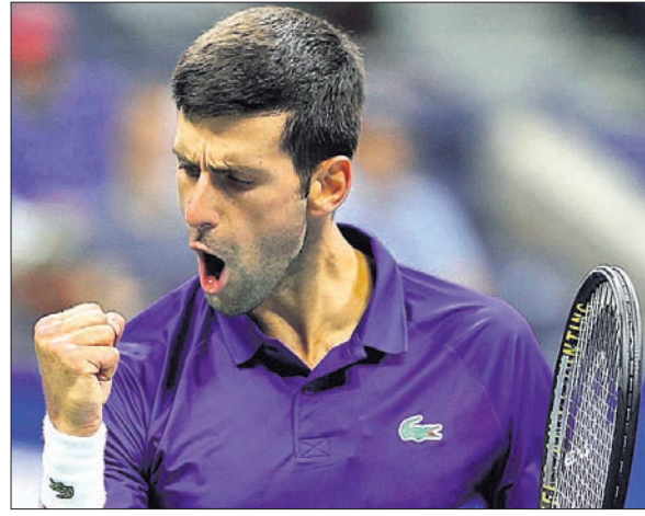
ମ୍ୟାଚ୍ ଜିତିବା ପରେ ନୋଭାକ ଜୋକୋଭିଚ୍।

ସୁଧାଂଶୁ ଓପନ ଗ୍ରାଣ୍ଡସ୍ଲ୍ୟାମ୍ ବିଜେତା ସେମି ଫୁଲ୍‌ବିଲ୍ ସଫ୍ଟ ହୋଇଛି। ଟପ୍ ସିଡ୍ ସର୍ବିୟା ଖେଳାଳି ନୋଭାକ ଜୋକୋଭିଚ୍ ସେମିଫାଇନାଲରେ ପ୍ରବେଶ କରିଛନ୍ତି। ଗୁରୁବାର ଅନୁଷ୍ଠିତ କ୍ୱାର୍ଟର ଫାଇନାଲ ମ୍ୟାଚ୍‌ରେ ସେ ଜର୍ମାନୀର ଷଷ୍ଠ ସିଡ୍ ଖେଳାଳି ମାଟେଓ ବେରେଟିନିଙ୍କୁ ୫-୭, ୬-୭, ୬-୭, ୬-୭ ସେଟ୍‌ରେ ପରାସ୍ତ କରି ସେମିରେ ପ୍ରବେଶ କରିଛନ୍ତି। ସେମିରେ ସେ ଟପ୍ ସିଡ୍ ଖେଳାଳି କର୍ମାମୀର ଆଲେକ୍ସାଣ୍ଡର ଜେଭେରେଭଙ୍କୁ ଭେଟିବେ। ଜେଭେରେଭ ଅନ୍ୟ ଏକ କ୍ୱାର୍ଟର ଫୁଲ୍‌ବିଲ୍‌ରେ ଦକ୍ଷିଣ ଆଫ୍ରିକାର ଲୟଡ ହାଡ୍‌ସନ୍‌ଙ୍କୁ ୭-୬, ୬-୭, ୬-୭, ୬-୪ ସେଟ୍‌ରେ ପରାସ୍ତ କରି ସେମିକୁ ଉଠିଛନ୍ତି। ଆଉ ଦୁଇଟି ବିଜୟ ହାସଲ କଲେ ଜୋକୋଭିଚ୍ ସୁଧାଂଶୁ ଓପନ ଟାଇଟଲ ଜିତବା ସହ ଜିଟିହାସ ସୃଷ୍ଟି କରିବେ। ଗତ ୫୨ ବର୍ଷ ମଧ୍ୟରେ ସେ