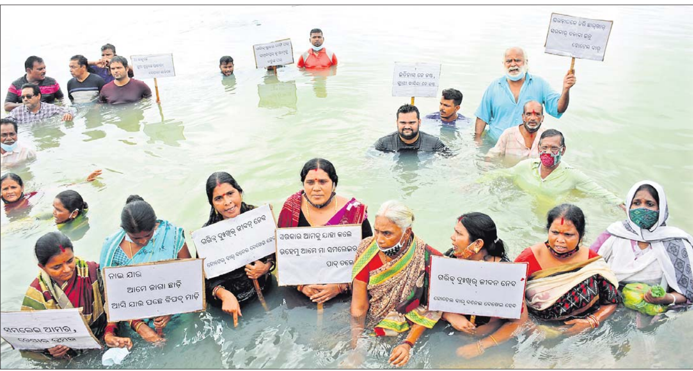
ସମ୍ବଲପୁର ସମଲେଇ ଯୋଜନାରେ ବିପ୍ଳାପିତ ହେବାକୁ ଥିବା ପରିବାର ସଦସ୍ୟ ଗୁରୁବାର ମହାନଦୀର ବାଲିବନ୍ଧା ଘାଟରେ ଜଳ ସତ୍ୟାଗ୍ରହ କରି ପ୍ରତିବାଦ କରୁଛନ୍ତି। (ଅଧିକ ବିବରଣୀ: ପୃଷ୍ଠା-୫)

ନୂଆଦିଲ୍ଲୀ, ୯/୯: ଆର୍ଥିକ ବର୍ଷ ୨୦୨୦-୨୧ ଲାଗି ଆୟକର ରିଟର୍ନ (ଆଇଟିଆର୍) ଫାଇଲିଂ ସମୟ ସୀମାକୁ ଗୁରୁବାର ଡିସେମ୍ବର ୩୧ ଯାଏ ବୃଦ୍ଧି କରାଯାଇଛି। ଏଥିଲାଗି ସାମା ସେପ୍ଟେମ୍ବର ୩୦ ତାରିଖ ରହିଥିଲା। ଆଇଟିଆର୍-୧ ଏବଂ ଆଇଟିଆର୍-୪ ଫର୍ମ ବ୍ୟବହାର କରୁଥିବା ବ୍ୟକ୍ତି ବିଶେଷ ଏହା ଦ୍ଵାରା ଆଶ୍ଚର୍ଯ୍ୟ ଲାଭ କରିବେ। ସେହିଭଳି ଯେଉଁ ବ୍ୟକ୍ତି ବିଶେଷଙ୍କ ଆକାରଖର୍ଚ୍ଚ ଅତିର୍ଣ୍ଣ ଆବଶ୍ୟକ ନାହିଁ ସେମାନେ ନୂଆ ନିୟମର ପରିସରକୁ ହେବେ ବୋଲି ବିଭାଗ ପକ୍ଷରୁ ସୂଚନା ଦିଆଯାଇଛି। ଆୟକର ଫାଇଲିଂର ସାଧାରଣ ସମୟ ସାମା ଡିଲ୍ଲୀର ୩୧ ରହିଥିବା ବେଳେ ଏଥିରେ ବୃଦ୍ଧି କରାଯାଇଥିଲା। ପୃଷ୍ଠା-୪