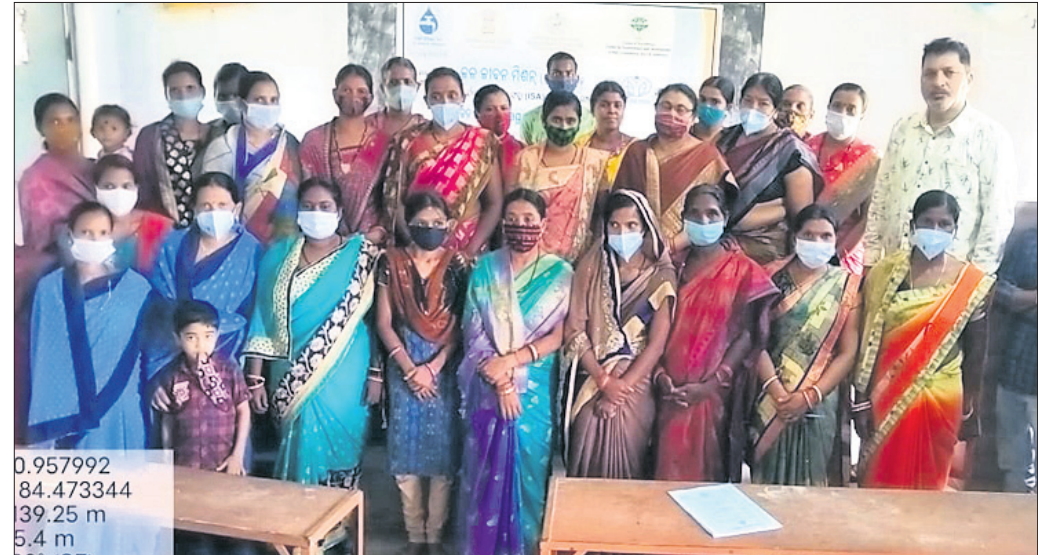
ଜଳ ସାଧୁ ତାଲିମ ଶିବିର କାର୍ଯ୍ୟକ୍ରମରେ ଯୋଗ ଦେଇଥିବା ଗ୍ରାମସାଥୀମାନେ ।

କିଶୋରନଗର ରୁକ୍ ବିଶ୍ୱ ମୁବକେନ୍ଦ୍ର ଓ କିଶୋରନଗର ଡିପାର୍ଟମେଣ୍ଟର କର୍ମଚାରୀମାନେ ଗ୍ରାମସାଥୀମାନଙ୍କୁ ଜଳ ସାଧୁ ତାଲିମ ଶିବିର କାର୍ଯ୍ୟକ୍ରମରେ ଯୋଗ ଦେଇଥିବା ଗ୍ରାମସାଥୀମାନେ ।