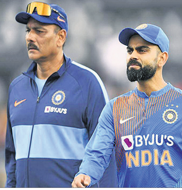
କୋର୍ ରବି ଶାସ୍ତ୍ରୀ ଓ ଅଧିନାୟକ ବିରାଟ କୋହଲି।

ମ୍ୟାଚ୍ ବାତିଲ ହେବା ପରେ ଇସିସି ଖେଳପ୍ରେମୀ ଓ ଅଂଶଦାରମାନଙ୍କ ନିକଟରେ କ୍ଷମାଭିକ୍ଷା କରିଛି। ୫ ମ୍ୟାଚ୍ ବିଶିଷ୍ଟ ସିରିଜରେ ଭାରତ ୨-୧ରେ ଅଗ୍ରଣୀ ଲାଭ କରିଛି। ହେଲେ ବିଧିବଦ୍ଧ ଭାବେ ବିଜେତାଙ୍କ ଦଳର ନାମ ଘୋଷଣା କରାଯାଇ ନାହିଁ। ବାତିଲ ହୋଇଥିବା ୫ମ ଟେଷ୍ଟ ମ୍ୟାଚ୍ ଆସନ୍ତାବର୍ଷ ଜୁଲାଇରେ ଖେଳାଯାଇ ପାରିବ, ଯେତେବେଳେ ଦଳ ୬ ମ୍ୟାଚ୍ ବିଶିଷ୍ଟ ସୀମିତ ଓଭର ସିରିଜ ଖେଳିବା ଲାଗି ଆସିବ। ଗୁରୁବାର କୋଭିଡ୍ ଟେଷ୍ଟ ଫଳାଫଳ ନେତେବିଜ ସତ୍ତ୍ୱେ ଭାରତୀୟ ଖେଳାଳିମାନେ ମ୍ୟାଚ୍ ଖେଳିବା ଲାଗି ରାଜି ନ ହେବା ପରେ ବିସିଆଇ ଓ ଇସିସି ମଧ୍ୟରେ ବହୁ ପର୍ଯ୍ୟାୟ ଆଲୋଚନା ହୋଇଥିଲା। ଶେଷରେ ଭାରତୀୟ ଦଳରେ କୋଭିଡ୍ ଦେଖା ଦେବା କାରଣରୁ ମ୍ୟାଚ୍ ବାତିଲ କରିବା ଲାଗି ଉଭୟ ବୋର୍ଡ ନିଷ୍ପତ୍ତି ନେଇଥିଲେ।