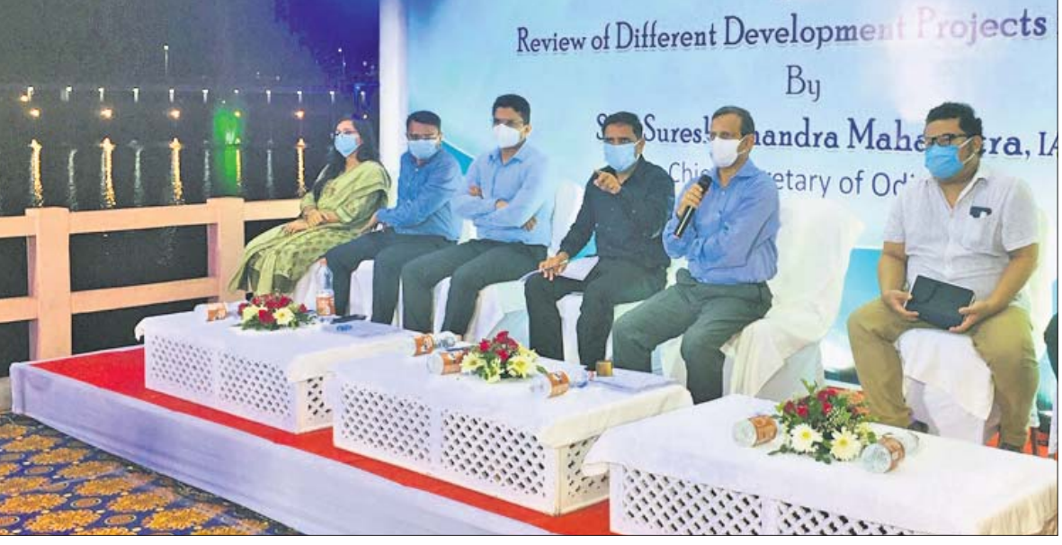
ରାମଲିଙ୍ଗମ ପାର୍କ ପରିସରରେ ଅନୁଷ୍ଠିତ ସମୀକ୍ଷା ବୈଠକରେ ମୁଖ୍ୟ ଶାସନ ସଚିବ ଓ ଅନ୍ୟ ଅଧିକାରୀମାନେ ।

ଭୁବନେଶ୍ୱର(ବୁଧବୋ)/ବ୍ରହ୍ମପୁର ଅତିସ/ ସୁଷ୍ମାଭାଗପୁର/ହିଂସିକାଗୁଡ଼ି(ଏ.ଏ.ଏ)୧୦।୯