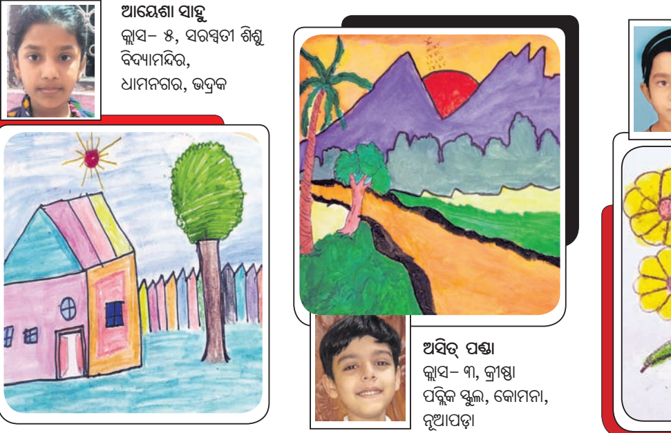
ଆୟୋଗା ସାହୁ କ୍ଲାସ୍-୪, ସରସ୍ୱତୀ ଶିଶୁ ବିଦ୍ୟାଳୟ, ଧାମନଗର, ଭଦ୍ରକ