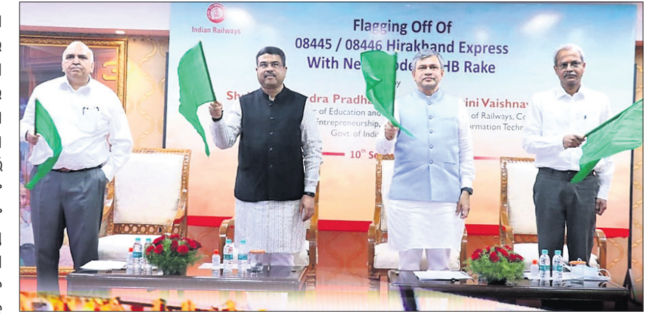
ରେଳମନ୍ତ୍ରୀ ଅଶ୍ୱିନୀ ଦେବସିଂହ, ଶିକ୍ଷାମନ୍ତ୍ରୀ ଧର୍ମେନ୍ଦ୍ର ପ୍ରଧାନ ଓ ବରିଷ୍ଠ ରେଳ ଅଧିକାରୀ ପତାକା ଦେଖାଇ ଶୁଭାରମ୍ଭ କରୁଛନ୍ତି।

ଏହା ବ୍ୟତୀତ ପୂର୍ବତର ରେଳପଥ ପରିସୀମା ମଧ୍ୟରେ ହୀରାଖଣ୍ଡ ଏକ୍ସପ୍ରେସ୍ ଭୁବନେଶ୍ୱରକୁ ଜଗଦଲପୁର ପର୍ଯ୍ୟନ୍ତ ଶ୍ରୀଘଟ କିଲୋମିଟର ଯାତ୍ରା କରୁଥିବା ବେଳେ ଏହା ଓଡ଼ିଶା, ଆନ୍ଧ୍ରପ୍ରଦେଶ ଏବଂ ଛତିଶଗଡ଼ର ୨୧ଟି ମଧ୍ୟବର୍ତ୍ତୀ ଷ୍ଟେସନରେ ରହିବାର ବ୍ୟବସ୍ଥା କରାଯାଇଛି।