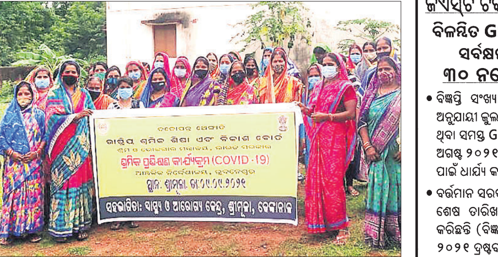
ଶ୍ରମିକ ପ୍ରଶିକ୍ଷଣ କାର୍ଯ୍ୟକ୍ରମରେ ମହିଳାମାନେ।