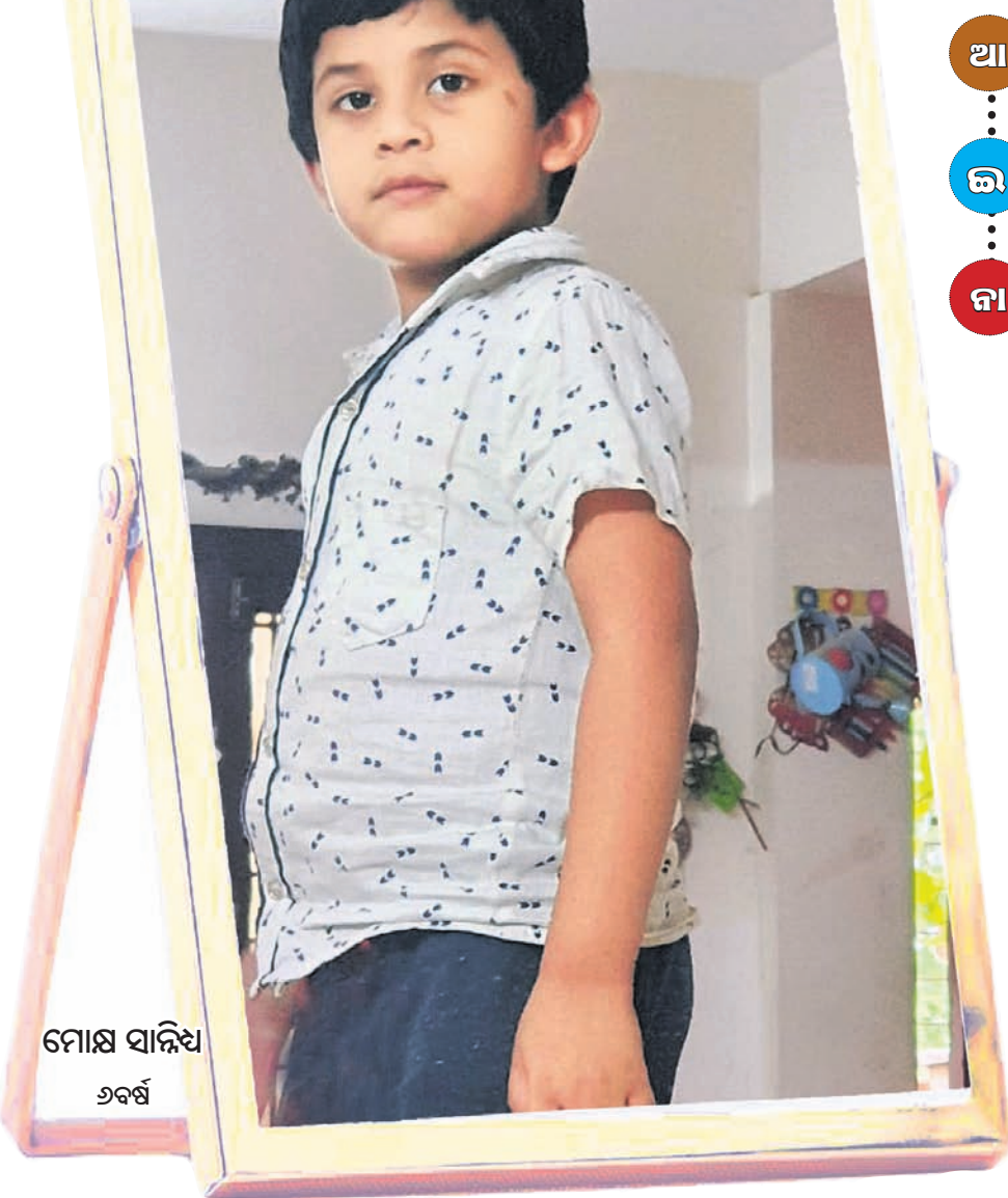
ମୋଶ ସାନ୍ଧ୍ୟ ୬ବର୍ଷ

ବାପା ତମ ମୁଣ୍ଡରେ ଦୁଇଟା ଚୁଟି ଧରି କ'ଣ ପାରି ହେଉଛି ? ଯେଉଁ ପିଲାମାନେ ଚାନ୍ଦ ବାପାଙ୍କୁ ଯେତେ ବଜାଉଛନ୍ତି ତାହାର ଚୁଟି ସେତେ ଧରି ହେଉଛି ଯାଏ।