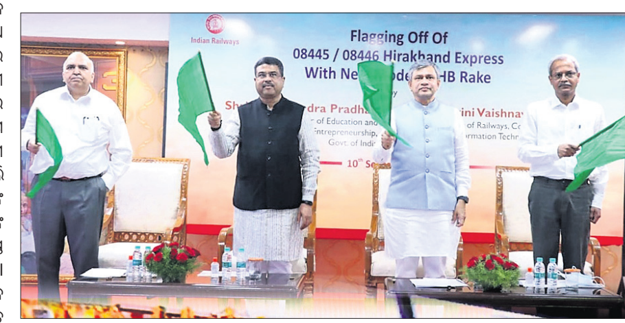
ଭୁବନେଶ୍ୱର ଉତ୍ତର ରେଳ ସଂଯୋଗ ସହ ଯାତ୍ରାମାନଙ୍କୁ ଅତ୍ୟଧୁନିକ ସୁବିଧା ଯୋଗାଇବାକୁ ଉଦ୍ଦେଶ୍ୟରେ ରେଳପଥରେ ସଂଯୋଗ ଆଣିବା ଆବଶ୍ୟକତା ସମ୍ବନ୍ଧରେ ପ୍ରଧାନମନ୍ତ୍ରୀ ଗୁରୁତ୍ୱପୂର୍ଣ୍ଣ ଭାବେ ଧ୍ୟାନ ଦେଇଛନ୍ତି।