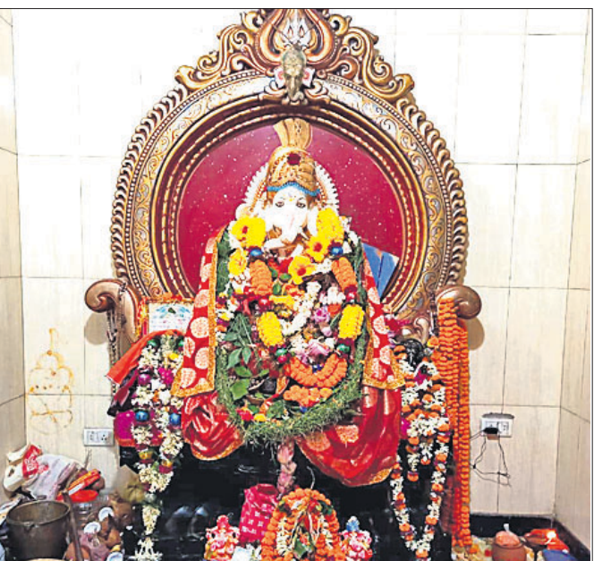
କୃତ୍ରିମ ସ୍ଥଳରେ ମନ୍ଦିରରେ ଗଜାନନ ପୂଜା ପାଉଛି।