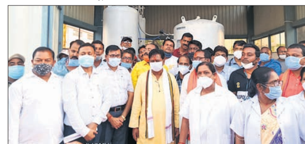
ଲୋକାର୍ପଣ କାର୍ଯ୍ୟକ୍ରମରେ କେନ୍ଦୁଝର ଜିଲ୍ଲା ସ୍ଵଚ୍ଛତା ସହ ଅନ୍ୟ ଅଭିଯାନ।

ନିର୍ଦ୍ଦିଷ୍ଟ ଗାଧାରୀମାନଙ୍କୁ ଗୁରୁତ୍ଵ ଦିଆଯାଇଛି।