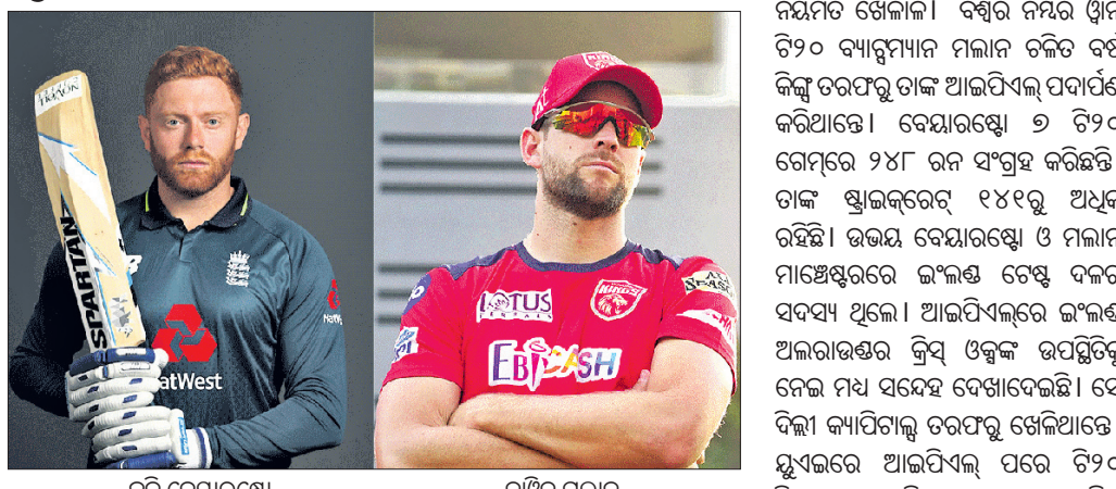
ଜନ ବେୟାର୍ଣ୍ଟୋ ବାସ୍କିଏ ମଲାନ