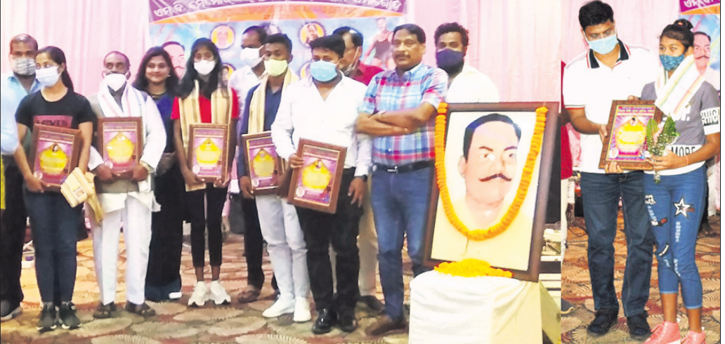
ଖେଳାଳିମାନଙ୍କୁ ସମର୍ଥନ କରାଯାଇଛି ।