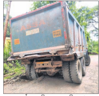
ରାସ୍ତା ପାର୍ଶ୍ୱରେ ଦବି ଯାଇଥିବା ଟିସ୍ତର।

ମାଲକାନଗିରି ଜିଲ୍ଲା ବାଲିମେଳା ଏନ୍ଏସିରୁ ଲାଗି ରହିଛି ଏପି-୫୧ ଗ୍ରାମର କ୍ରସର। ପ୍ରତ୍ୟେକ ଦିନ କ୍ରସରରୁ ଭାରିଯାନକୁ ଲୋକେ ବାଲିମେଳା-ଡିଗାପାରି ବ୍ରିଜ୍ ଦେଇ ଯୁକ୍ତଦଳର ସ୍କୁଲ ଛକରୁ ଋଷ ଛକକୁ ବାହାରି ମୁଖ୍ୟରାସ୍ତା ଦେଇ ଯାତାୟାତ କରେ। ଡିଗାପାରି ବ୍ରିଜ୍ ନିର୍ମାଣ ହୋଇ ନ ଥିବା ବେଳେ କ୍ରସରର ଭାରିଯାନକୁ ଯୋଗୁ ଲୋକେ ବାଲିମେଳା ବ୍ରିଜ୍ ଦେଇ ଯାତାୟାତ କରୁଥିଲେ। ଫଳରେ ବ୍ରିଜ୍ ପଲିଗରେ ଫଟୁ ସୃଷ୍ଟି ହେବାରୁ ଲରିଗେସନ ବିଭାଗ ବ୍ରିଜ୍ ଉପରେ ଭାରିଯାନ ଚଳାଇ ନିଷେଧ କରି ଏକ ଫଳକ ମାରିଦେଲା। ଗତ କିଛି ମାସ ଧରି ଏହି କ୍ରସର ବନ୍ଦ ରହିବାରୁ ଉକ୍ତ ରାସ୍ତାରେ ଭାରିଯାନ ଯାତାୟାତ ବନ୍ଦ ରହିଥିଲା।