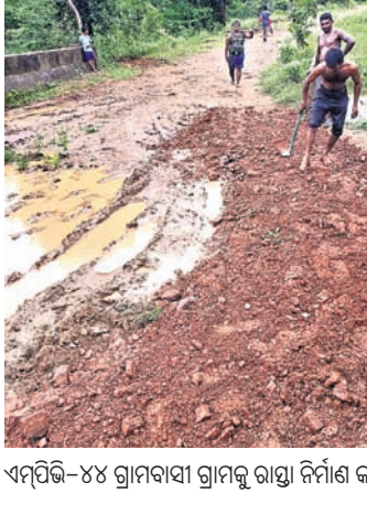
ଏମ୍ପି-୪୪ ଗ୍ରାମବାସୀ ଗ୍ରାମକୁ ରାସ୍ତା ନିର୍ମାଣ କରୁଛନ୍ତି।

ନିଜ ଗାଁକୁ ନିଜେ ରାସ୍ତା ତିଆରି କରି ଅନ୍ୟ ପାଇଁ ଉଦାହରଣ ସାଜିଛନ୍ତି ଏମ୍ପି-୭୯-୪୪ ଗ୍ରାମବାସୀ। ଗ୍ରାମ ରାସ୍ତା ଖରାପ ହୋଇପଡ଼ିବାରୁ ଏହାର ନିର୍ମାଣ ଲାଗି ପ୍ରଶାସନକୁ ବାରମ୍ବାର ଜଣାଇ କିଛି ସୁଫଳ ନ ମିଳିବାରୁ ଶେଷରେ ଗ୍ରାମବାସୀ ଶୁକ୍ରବାର ତିଆରି କଲେ ଗାଁ ରାସ୍ତା। ଏପରି ଦେଖିବାକୁ ମିଳିଛି ମାଲକାନଗିରି ଜିଲ୍ଲା ବାଲିମେଳା ବ୍ଲକ ଭୁବନପାଲି ପଞ୍ଚାୟତର ଏମ୍ପି-୪୪ରେ। ଭୁବନପାଲି ପଞ୍ଚାୟତରଠାରୁ ମାତ୍ର ୫୦୦ ମିଟର ଦୂରରେ ରହିଛି ଏମ୍ପି-୪୪ ଗ୍ରାମ। ପ୍ରତ୍ୟକ୍