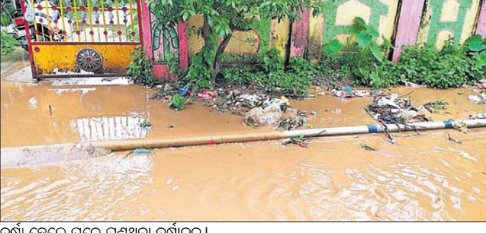
ବର୍ଷା ହେଲେ ଘରେ ପଶୁଥିବା ବର୍ଷାକାଳ।

ମାତ୍ର ୫୦୦ ମିଟର ଦୂରରେ ରହିଛି ଏହି ଗ୍ରାମ। ନିକଟରେ ଧରିଚୋରେ କାଳିଆକାଦଠାରୁ ବିଲୁ ପକ୍ଷୀମଧ୍ୟ ମହାବିଦ୍ୟାଳୟ ପର୍ଯ୍ୟନ୍ତ ରାସ୍ତା ଅବସ୍ଥା ଦୟନୀୟ ହୋଇପଡ଼ିଥିବା ନେଇ ଖବର ପ୍ରକାଶ ପରେ ଗ୍ରାମ୍ୟ ଉନ୍ନୟନ ବିଭାଗ ତରଫରୁ ଭାବେ ରାସ୍ତା ନିର୍ମାଣ କରିଥିଲା। ମାତ୍ର କାଳିଆକାଦ ଗ୍ରାମରେ ତ୍ରେନ ନିର୍ମାଣକୁ ପ୍ରଶାସନ ଭୁଲିଯାଇଛି। ଗ୍ରାମରେ ବିନିଷ୍ଠ କର୍ମଚାରୀ ରାସ୍ତା ଥିବାବେଳେ ତ୍ରେନ ନ ଥିବାରୁ ବର୍ଷା ହେଲେ ଘର ଭିତରେ ପାଣି ପଶୁଛି। ଯୋଜନାବଦ୍ଧ ଭାବେ ରାସ୍ତା ନିର୍ମାଣ ହେଉ ନ ଥିବାରୁ ଏପରି ସମସ୍ୟା ଉପସ୍ଥୁଥିବା ଅଭିଯୋଗ କରିଛନ୍ତି ଗ୍ରାମବାସୀ। ଏଥିପ୍ରତି ଦୃଷ୍ଟି ଦେଇ ତ୍ରେନ ପ୍ରଶାସନ ଗ୍ରାମରେ ତ୍ରେନ ନିର୍ମାଣ କରିବାକୁ ସାଧାରଣରେ ଦାବି ହେଉଛି।