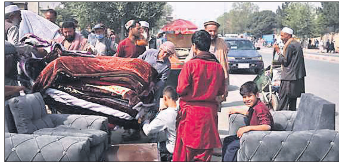
କାବୁଲ ରାସ୍ତାରେ ଘରର ଅସାଧାରଣତଃ ବିକ୍ରି କରିଦେଉଛନ୍ତି ସ୍ଥାନୀୟ ଲୋକେ।

ଆଫଗାନିସ୍ତାନ ସରକାରକୁ କ୍ଷମତାହୀନ କରି ତାଲିବାନ୍ ଦେଶ ଦଖଲ କରିବା ପରେ ସେଠାକାର ଅର୍ଥନୀତି ବ୍ୟାପକ ପ୍ରଭାବିତ ହୋଇଛି। ବିଶ୍ୱ ବ୍ୟାଙ୍କ, ଆଇଏମ୍ଏଫ୍, ଆମେରିକା ସେଣ୍ଟ୍ରାଲ ବ୍ୟାଙ୍କ କିଛି ସପ୍ତାହ ତଳେ ଅନ୍ତର୍ଜାତୀୟ ଫଣ୍ଡ ପର୍ଯ୍ୟନ୍ତ ପହଞ୍ଚିବା ପାଇଁ ତାଲିବାନ୍ ସବୁ ରାସ୍ତା ବନ୍ଦ କରିଦେଇଛନ୍ତି। ଆଫଗାନ ସରକାର କର୍ମଚାରୀଙ୍କ ଦରମା ମିଳିନି। ଅଧିକାଂଶ ବ୍ୟାଙ୍କ ବନ୍ଦ ରହିବା ଏବଂ ଏଟିଏମ୍ ନଗଦ ଉଠାଣ ଉପରେ କଟକଣା ଜାରି ହୋଇଛି। ଏପରି ସ୍ଥିତିରେ ଦୈନିକ କାରବାର ପାଇଁ ଆଫଗାନ ମାର୍କେଟରେ ନଗଦ ଅର୍ଥ ଅଭାବ ଦେଖାଦେଇଛି। ଲୋକେ ଖାଦ୍ୟ ପଦାର୍ଥ, ଔଷଧ ଆଦି ଅତ୍ୟାବଶ୍ୟକ ଚିନିଷିକିଣିବାପାଇଁ ରାସ୍ତାରେ ନିଜ ଘର ସାମଗ୍ରୀ କମ୍ ଦରରେ ବିକ୍ରି କରିଦେଉଥିବା ଦେଖିବାକୁ ମିଳିଛି। କାବୁଲର ବିଭିନ୍ନ ସ୍ଥାନରେ ଲୋକେ ନିଜ ରେପୁଜରେଟର, ଫ୍ୟାନ୍, ରାଇ, ଚକିଆ, ଖଟ, କମ୍ପଲ, ରୋଷେଇ ସାମଗ୍ରୀ, ପରଦା, ଚେୟାର, ଚେରୁଲ, ଆକ ଆଦି ରାସ୍ତାରେ ଗଦା କରି ବିକ୍ରି କରୁଛନ୍ତି। ଘର ତଳାଇବା ପାଇଁ କରୁଥିବା ସାମଗ୍ରୀ ସେହି ଅର୍ଥରେ କିଣୁଛନ୍ତି। ଆଫଗାନିସ୍ତାନ ବ୍ୟାଙ୍କଗୁଡ଼ିକ ସପ୍ତାହକୁ ୨୦ ହଜାର ଆଫଗାନିସ୍ (ପ୍ରାୟ ୧୭ ହଜାର ଟଙ୍କା)ରୁ ଅଧିକ ଅର୍ଥ ଉଠାଣ ଉପରେ କଟକଣା ଲଗାଇଛନ୍ତି। ଏଟିଏମ୍ ରୁଟି ଉଠାଇବାକୁ ଦିନ ତମାମ ଶହ ଶହ ସଂଖ୍ୟାରେ ଲୋକ ଲାଇନରେ ଛିଡ଼ା ହେଉଛନ୍ତି। ତାଲିବାନ୍ ଆଫଗାନିସ୍ତାନକୁ ଦଖଲକୁ ନେବା ପୂର୍ବରୁ ମଧ୍ୟ ଦେଶର ଅର୍ଥନୀତି ଦୁର୍ବଳ ହୋଇପଡ଼ିଥିଲା। ବିଦେଶୀ ସହାୟତା ଉପରେ ଦେଶ ଅନେକାଂଶରେ ନିର୍ଭରଶୀଳ