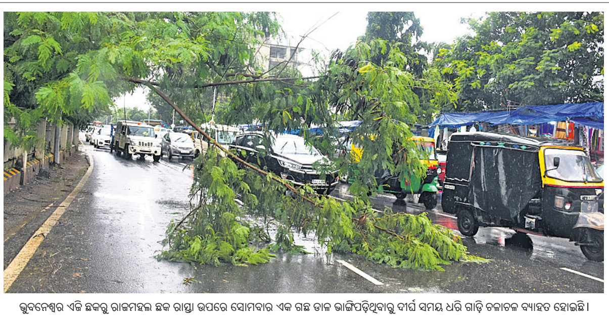
ଭୁବନେଶ୍ଵର ଏକ ଛକକୁ ରାଜମହଲ ଛକ ରାସ୍ତା ଉପରେ ସୋମବାର ଏକ ଗଛ ଡାଳ ଲାଗିପଡ଼ିଥିବାରୁ ଦୀର୍ଘ ସମୟ ଧରି ଗାଡ଼ି ଚଳାକଟ ବ୍ୟାହତ ହୋଇଛି।

ଭୁବନେଶ୍ଵର, ୧୩।୯ (ବ୍ୟୁରୋ): କୋଭିଡ୍-୧୯ ମହାମାରୀରେ ମାତାପିତାଙ୍କୁ ହରାଇ ଅନାଥ ହୋଇଥିବା ଶିଶୁମାନଙ୍କୁ ସହାୟତା ଯୋଗାଇ ଦେବାକୁ ରାଜ୍ୟ ସରକାର 'ଆଶୀର୍ବାଦ' ଯୋଜନା ଆରମ୍ଭ କରିଛନ୍ତି। ଏହି ଯୋଜନାରେ ଅନାଥ ଶିଶୁମାନଙ୍କୁ ମାସିକ ଆର୍ଥିକ ସହାୟତା ସହ ଅନ୍ୟାନ୍ୟ ସୁବିଧା ସଯୋଗ ଯୋଗାଇ ଦେବାକୁ ବ୍ୟବସ୍ଥା ରହିଛି। ତେବେ ଏହି ଯୋଜନାର ସୁବିଧା ସେପ୍ଟେମ୍ବର ୧୫ ତାରିଖ ପରେ ଆରମ୍ଭ ମିଳିବ ନାହିଁ। ରାଜ୍ୟରେ କରୋନା ସଂକ୍ରମଣ ହ୍ରାସ ପାଇଥିବାରୁ ସରକାର ଏହି ଯୋଜନାକୁ ଆଉ ଆଗକୁ ନେବେ ନାହିଁ। ସେପ୍ଟେମ୍ବର ୧୫ ପରେ ଯଦି କୋଭିଡ୍ ପିଲି ଯେମାନଙ୍କର ମାତାପିତା କିମ୍ବା ଭଉଣସପାଶ୍ଵରୀ କରୁଥିବା ବ୍ୟକ୍ତିଙ୍କର ମୃତ୍ୟୁ ହୁଏ ତେବେ ସେହି ପିଲାମାନଙ୍କୁ ଶିଶୁ ସୁରକ୍ଷା ଯୋଜନାରେ ସହାୟତା ଯୋଗାଇ ଦିଆଯିବ। ସେମାନଙ୍କୁ ଆଉ ଆଶୀର୍ବାଦ ଯୋଜନାରେ ସାମିଲ କରାଯିବ ନାହିଁ। ଏ ନେଇ ମହିଳା ଓ ଶିଶୁ ବିକାଶ ବିଭାଗ ପକ୍ଷରୁ ସମସ୍ତ ଜିଲ୍ଲାପାଳଙ୍କୁ ଠିକି ଲେଖାଯାଇଛି। ସରକାରଙ୍କ ନିର୍ଦ୍ଦେଶ ମୁତାବକ କାର୍ଯ୍ୟାନୁଷ୍ଠାନ ଗ୍ରହଣ କରିବାକୁ କୁହାଯାଇଛି।