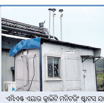
ଏସିଏସ୍ ଏୟାର କ୍ଵାଲିଟି ମନିଟରିଂ ସ୍ଵାଚ୍ୟ ଯନ୍ତ୍ର।