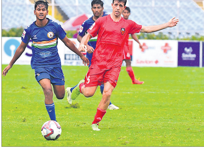
କୋଲକାତାରେ ସୋମବାର ଏସ୍ପି ଗୋଆ ଓ ସୁବେଦା ଦିଲ୍ଲୀ ଏସ୍ପି ମଧ୍ୟରେ ଅନୁଷ୍ଠିତ ଡୁରାଣ୍ଡ କପ୍ ଫୁଟବଲ ମ୍ୟାଚ୍।

ଭୁବନେଶ୍ୱର, ୧୩ (କ୍ରୀଡ଼ା ପ୍ରତିନିଧି): ଭାରତୀୟ କ୍ରିକେଟ୍ କଣ୍ଠେଲ୍ ବୋର୍ଡ୍ (ବିସିଆଇ) ଦ୍ୱାରା ହେବାକୁ ଥିବା ସାମିତ ଓଭର କ୍ରିକେଟ୍ ଟୁର୍ନାମେଣ୍ଟ ପାଇଁ ପ୍ରସ୍ତୁତ ହେବାକୁ ୧୯ ବର୍ଷରୁ କମ୍ ଓଡ଼ିଶା କ୍ରିକେଟ୍ ଦଳ ୨ଟି ଖର୍ଚ୍ଚାଧିକ ମ୍ୟାଚ୍ ଖେଳିବ। ୨ଟି ଯାକ ବନ୍ଧୁତ୍ୱ ଖର୍ଚ୍ଚାଧିକ ମ୍ୟାଚ୍ ଖେଳିବ ୧୯ ବର୍ଷରୁ କମ୍ ଦଳ ସହ ହେବ। ମ୍ୟାଚ୍ ୨ଟି ଚଳିତ ମାସ ୧୫ ଓ ୧୬ ତାରିଖରେ ରାଞ୍ଚିରେ ଲେବ୍ ସିସିଏ ଅକ୍ଟୋବର ଶ୍ୱାସିକ୍ସ କମ୍ପ୍ଲେକ୍ସରେ ଖେଳାଯିବ ବୋଲି ସୋମବାର ଓଡ଼ିଶା କ୍ରିକେଟ୍ ଆସୋସିଏଟେଡ୍ ପକ୍ଷରୁ ସୂଚନା ଦିଆଯାଇଛି।