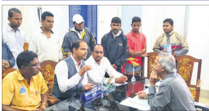
କ୍ଲବପଠକ ସହ ଆଲୋଚନା କରୁଥିବା ଆଲୋଚନାକାରୀ ।

ଖଲ୍ଲିକୋଟ ଏକ ବିଶ୍ୱବିଦ୍ୟାଳୟ, ମୁଖ୍ୟ ଫାଟକ ଆଗରେ ସୋମବାର ପୁରାତନ ଛାତ୍ର ଓ ସଚେତନ ନାଗରିକଙ୍କ ପକ୍ଷରୁ ବିକ୍ଷୋଭ କରାଯାଇଥିଲା। ୧୪୩ ବର୍ଷର ପୁରାତନ ଖଲ୍ଲିକୋଟ ମହାବିଦ୍ୟାଳୟ ଫଳକକୁ ଲିଭାଇ ବିଶ୍ୱବିଦ୍ୟାଳୟ ଲେଖାଯାଇଥିବା ଏବଂ ଶତାଧିକ ବର୍ଷର ଐତିହ୍ୟ ଧରାକୋଟ ବିଜ୍ଞାନାଗାର ଧୂଳିଆତ କରାଯାଇଥିବା ପ୍ରତିବାଦରେ ଏହି ଆଲୋଚନା ହୋଇଥିଲା। ୧୫ ଦିନ ମଧ୍ୟରେ ପୁରୁଣା ଫଳକ ଲାଗାଇବା ପାଇଁ ଦାବି ହୋଇଛି। ନଚେତ୍ ବୁଦ୍ଧ ଆଲୋଚନା ସୂତ୍ରପାତର ଚେତାବନୀ ଦିଆଯାଇଛି। ଏକ ବିଶ୍ୱବିଦ୍ୟାଳୟ କ୍ଲବପଠକ ଏହି ମର୍ମରେ ସ୍ମାରକପତ୍ର ପ୍ରଦାନ କରାଯାଇଥିଲା।