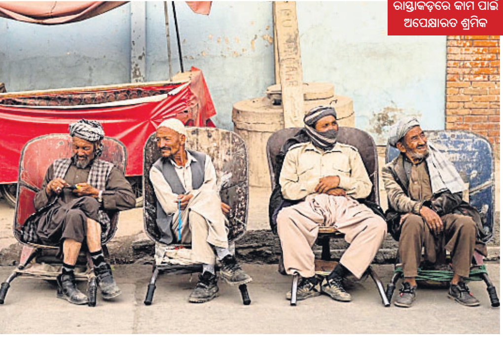
ରାସ୍ତାକଡ଼ରେ କାମ ପାଇଁ ଅପେକ୍ଷାରତ ଶ୍ରମିକ

ପୂର୍ବ କଷ୍ଟପାଇଁ ଅର୍ଥ ବ୍ୟାଙ୍କରେ ପଢ଼ିଛି ତାଲିକାନ୍ତ ପୁଅକୁ ଦେଖି ଅନ୍ତର୍ଜାତୀୟ ସଙ୍ଗଠନଗୁଡ଼ିକ ଆଫଗାନିସ୍ତାନକୁ ପାଣି ଦେବାକୁ ମନା କରିଦେବା ପରେ ଲୋକଙ୍କ ମୁଖ ଉପରେ ପଡ଼ିଛି ଅକାଳ ଚତୁକା। କାହା ହାତରେ ଖାଇବାକୁ ଅର୍ଥ ନାହିଁ ତ ପୁଣି କିଏ ଜୀବନ ବଞ୍ଚାଇବା ଲାଗି ଔଷଧ କିଣିବାକୁ ନଗଦ ପୁଣି ଖୋଜୁଛନ୍ତି। ଅଗତ୍ୟା ନିଜ ଘରର ମୂଲ୍ୟବାନ ଆସବାବପତ୍ର ଶାଗମାଛ ଦରରେ ବିକି ଦେଉଛନ୍ତି ଆଫଗାନମାନେ। ରାଜଧାନୀ କାରୁଲ ରାଜରାଷ୍ଟ୍ରରେ ଦେଖିବାକୁ ମିଳୁଥିବା ଏହି ବିକଳ ଚିତ୍ର ସାମ୍ପ୍ରତିକ ସ୍ଥିତିର ସ୍ପଷ୍ଟ ସମ୍ପର୍କ ସୂଚୀ।