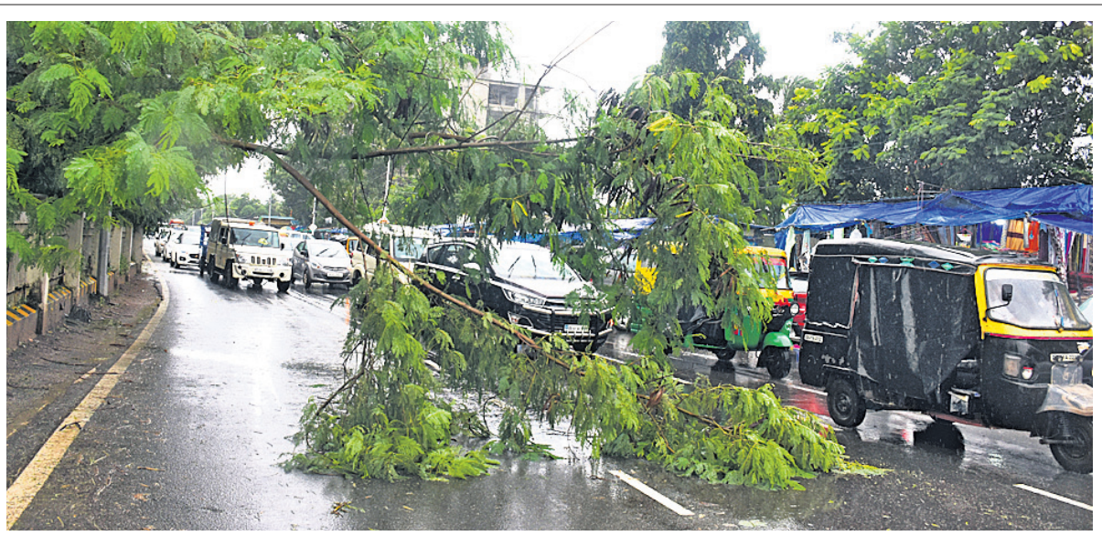
ଭୁବନେଶ୍ଵର ଏକ ଛକକୁ ରାଜମହଲ ଛକ ରାସ୍ତା ଉପରେ ସୋମବାର ଏକ ଗଛ ଡାଳ ଲାଗିପଡ଼ିଥିବାରୁ ଦୀର୍ଘ ସମୟ ଧରି ଗାଡ଼ି ଚଳାକଟ ବ୍ୟାହତ ହୋଇଛି।

ଭୁବନେଶ୍ଵର, ୧୩।୯ (ବ୍ୟୁରୋ): କୋଭିଡ୍-୧୯ ମହାମାରୀରେ ମାତାପିତାଙ୍କୁ ହରାଇ ଅନାଥ ହୋଇଥିବା ଶିଶୁମାନଙ୍କୁ ସହାୟତା ଯୋଗାଇ ଦେବାକୁ ରାଜ୍ୟ ସରକାର 'ଆଶୀର୍ବାଦ' ଯୋଜନା ଆରମ୍ଭ କରିଛନ୍ତି। ଏହି ଯୋଜନାରେ ଅନାଥ ଶିଶୁମାନଙ୍କୁ ମାସିକ ଆର୍ଥିକ ସହାୟତା ସହ ଅନ୍ୟାନ୍ୟ ସୁବିଧା ସଯୋଗ ଯୋଗାଇ ଦେବାକୁ ବ୍ୟବସ୍ଥା ରହିଛି। ତେବେ ଏହି ଯୋଜନାର ସୁବିଧା ସେପ୍ଟେମ୍ବର ୧୫ ତାରିଖ ପରେ ଆଉ ମିଳିବ ନାହିଁ। ରାଜ୍ୟରେ କରୋନା ସଂକ୍ରମଣ ହ୍ରାସ ପାଇଥିବାରୁ ସରକାର ଏହି ଯୋଜନାକୁ ଆଉ ଆଗକୁ ନେବେ ନାହିଁ। ସେପ୍ଟେମ୍ବର ୧୫ ପରେ ଯଦି କୋଭିଡ୍ ପିଲା ସେମାନଙ୍କର ମାତାପିତା କିମ୍ବା ଭଉଣସପାଖଣ କରୁଥିବା ବ୍ୟକ୍ତିଙ୍କର ମୃତ୍ୟୁ ହୁଏ ତେବେ ସେହି ପିଲାମାନଙ୍କୁ ଶିଶୁ ପୁରଣା ଯୋଜନାରେ ସହାୟତା ଯୋଗାଇ ଦିଆଯିବ। ସେମାନଙ୍କୁ ଆଉ ଆଶୀର୍ବାଦ ଯୋଜନାରେ ସାମିଲ କରାଯିବ ନାହିଁ। ଏ ନେଇ ମହିଳା ଓ ଶିଶୁ ବିକାଶ ବିଭାଗ ପକ୍ଷରୁ ସମସ୍ତ ଜିଲ୍ଲାପାଳଙ୍କୁ ଚିଠି ଲେଖାଯାଇଛି। ସରକାରଙ୍କ ନିର୍ଦ୍ଦେଶ ମୁତାବକ କାର୍ଯ୍ୟାନୁଷ୍ଠାନ ଗ୍ରହଣ କରିବାକୁ କୁହାଯାଇଛି।