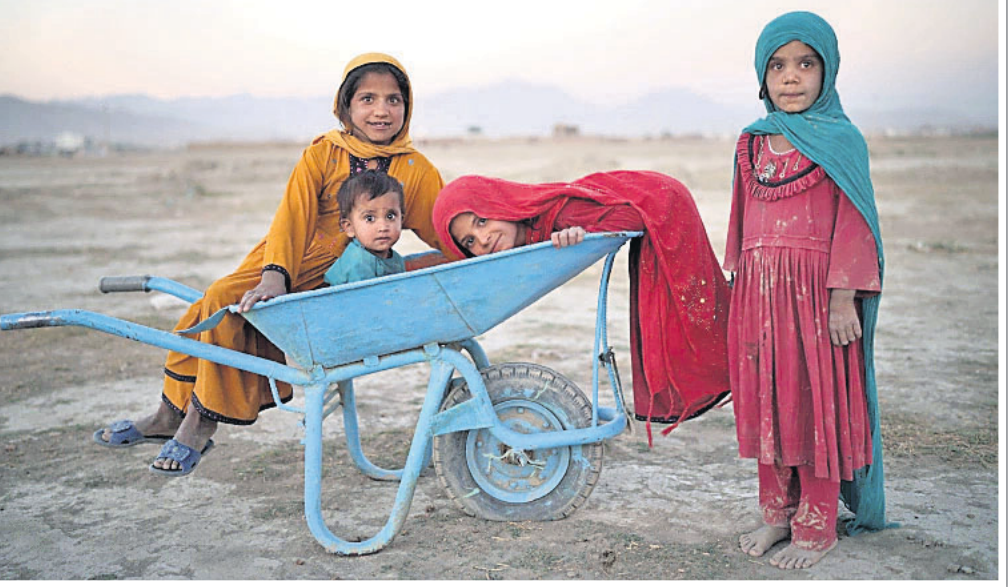
କାରୁଲସ୍ଥିତ ଏକ ଶିବିରରେ ବିସ୍ତାପିତ ଶିଶୁ

ପୂର୍ବ କଷ୍ଟପାଇଁ ଅର୍ଥ ବ୍ୟାଙ୍କରେ ପଢ଼ିଛି ତାଲିକାନ୍ତ ପୁଅକୁ ଦେଖି ଅନ୍ତର୍ଜାତୀୟ ସଙ୍ଗଠନଗୁଡ଼ିକ ଆଫଗାନିସ୍ତାନକୁ ପାଣି ଦେବାକୁ ମନା କରିଦେବା ପରେ ଲୋକଙ୍କ ମୁଖ ଉପରେ ପଡ଼ିଛି ଅକାଳ ଚତୁକା। କାହା ହାତରେ ଖାଇବାକୁ ଅର୍ଥ ନାହିଁ ତ ପୁଣି କିଏ ଜୀବନ ବଞ୍ଚାଇବା ଲାଗି ଔଷଧ କିଣିବାକୁ ନଗଦ ପୁଣି ଖୋଜୁଛନ୍ତି। ଅଗତ୍ୟା ନିଜ ଘରର ମୂଲ୍ୟବାନ ଆସବାବପତ୍ର ଶାଗମାଛ ଦରରେ ବିକି ଦେଉଛନ୍ତି ଆଫଗାନମାନେ। ରାଜଧାନୀ କାରୁଲ ରାଜରାଷ୍ଟ୍ରରେ ଦେଖିବାକୁ ମିଳୁଥିବା ଏହି ବିକଳ ଚିତ୍ର ସାମ୍ପ୍ରତିକ ସ୍ଥିତିର ସ୍ପଷ୍ଟ ସମ୍ପର୍କ ସୂଚୀ।