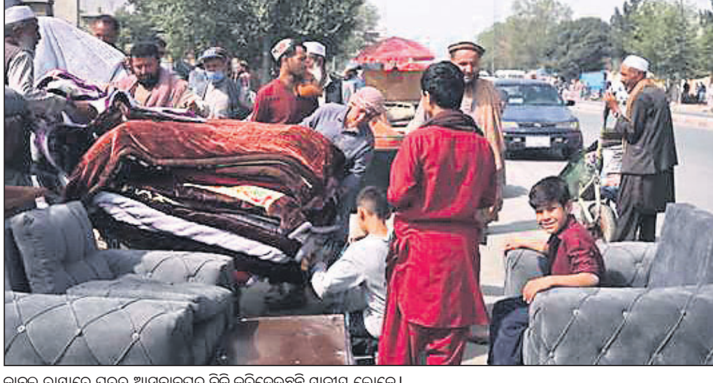
କାରୁଲ ରାସ୍ତାରେ ଘରର ଆସବାବପତ୍ର ବିକ୍ରି କରିଦେଉଛନ୍ତି ଗ୍ରାମୀଣ ଲୋକେ।

ଆଫଗାନିସ୍ତାନ ସରକାରକୁ କ୍ଷମତାହୀନ କରି ତାଲିକାନ୍ତ ଦେଶ ବ୍ୟାଙ୍କରେ ପରେ ସେଠାକାର ଅର୍ଥନୀତି ବ୍ୟାପକ ପ୍ରଭାବିତ ହୋଇଛି। ବିଶ୍ୱ ବ୍ୟାଙ୍କ, ଆଇଏମ୍ଏଫ୍, ଆମେରିକା ସେଣ୍ଟ୍ରାଲ ବ୍ୟାଙ୍କ କିଛି ସପ୍ତାହ ତଳେ ଅନ୍ତର୍ଜାତୀୟ ଫଣ୍ଡ ପର୍ଯ୍ୟନ୍ତ ପହଞ୍ଚିବା ପାଇଁ ତାଲିକାନ୍ତ ସବୁ ରାସ୍ତା ବନ୍ଦ କରିଦେଇଛନ୍ତି। ଆଫଗାନ ସରକାରୀ କର୍ମଚାରୀଙ୍କ ଦରମା ମିଳିନା। ଅଧିକାଂଶ ବ୍ୟାଙ୍କ ବନ୍ଦ ରହିବା ଏବଂ ଏଟିଏମ୍ ଗରଦ ଉଠାଇ ଉପରେ କଟକଣା ଲାଗି ହୋଇଛି। ଏପରି ସ୍ଥିତିରେ ଦୈନିକ କାରବାର ପାଇଁ ଆଫଗାନ ମାର୍କେଟରେ ନଗଦ ଅର୍ଥ ଆଭାବ ଦେଖାଦେଇଛି। ଲୋକେ ଖାଦ୍ୟ ପଦାର୍ଥ, ଔଷଧ ଆଦି ଅତ୍ୟାବଶ୍ୟକ ଜିନିଷ କିଣିବା ପାଇଁ ରାସ୍ତାରେ ନିଜ ଘର ସାମଗ୍ରୀ କମ୍ ଦରରେ ବିକ୍ରି କରିଦେଉଥିବା ଦେଖିବାକୁ ମିଳିଛି।