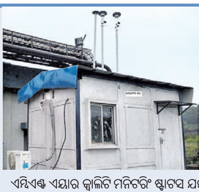
ଏସିଏସ୍ ଏୟାର କ୍ଵାଲିଟି ମନିଟରିଂ ସ୍ଵାଚସ ଯନ୍ତ୍ର।