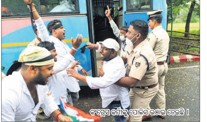
କଂଗ୍ରେସ କର୍ମୀଙ୍କୁ ପୋଲିସ୍ ଉତ୍ତର ଦେଇଛି ।

ସାମିଲ କରାଯିବ ସେ ନେଇ ରାଜ୍ୟ ସରକାର କୌଣସି ଚରଫ ନ ଦେଖାଇ ବିରୋଧ କରିଥିଲେ । ମୁଖ୍ୟମନ୍ତ୍ରୀଙ୍କ ସ୍ୱାସ୍ଥ୍ୟ କାର୍ତ୍ତ ବନ୍ଧନ ଜନସାଧାରଣଙ୍କ ପାଇଁ ଧୂଆଁବାଣୀ କେନ୍ଦ୍ର ସରକାରଙ୍କ ଆହ୍ୱାନ ଯୋଜନାରେ କିଛି ଲୋକଙ୍କୁ