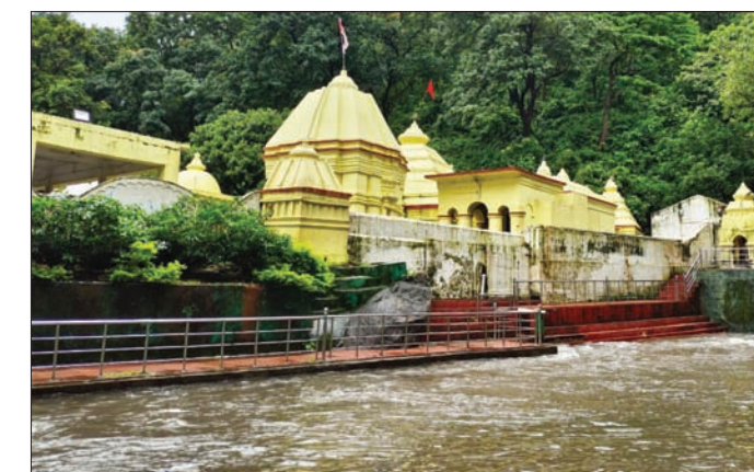
ପାପନାଶିନୀ ଝରଣା ପାଣି ହରିଶଙ୍କର ସାଂସ୍କୃତିକ ମଣ୍ଡପ ଉପରେ ପ୍ରବାହିତ ହେଉଛି ।

ଝରଣା, ୧୫୮୯ (ଡି.ଏନ.ଏ.) ରେଲିଂ ତେଜ ପାଣି ମାଡ଼ିଯାଇଥିଲା । ଏପରିକି ତଳେ ଥିବା ଉତ୍କଳିକା ହରିଶଙ୍କର ଝରଣାରେ ବୋଉଣ ବେଇ ବାହାରିଥିଲା । ୨୦୧୯ ମସିହାରେ ମଧ୍ୟ ଝରଣାକୁ ଏକିକି ପ୍ରବଳ ବେଗରେ ପାଣି ଆସିବା ଉଠିଥିଲା । ଝରଣା ପଥର (ସେଇ ପଥର)ଠାରେ ପାଣି ପ୍ରବଳ ମାତ୍ରାରେ ପଡ଼ୁଥିବାବେଳେ ତଳେ ଝରଣା ବୁଜି ପାଖ