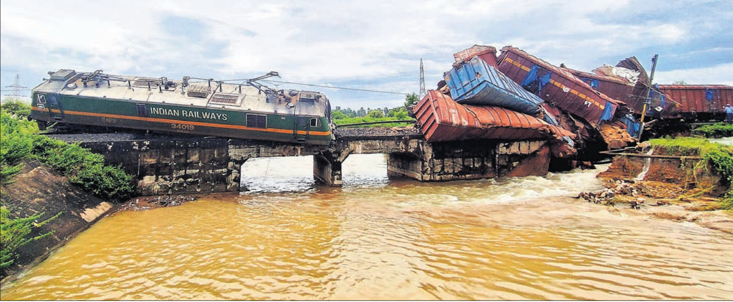
ଦେଲାନାଳ-ସମ୍ବଲପୁର ରେଳ ସେକ୍ଟରର ତାଳବେର ରୋଡ୍ ସ୍ୱେଶନ ନିକଟ ଭୋଗବେରେଣା ପୋଲଠାରେ ସୋମବାର ବିକଳ ରାତିରେ ଏକ ମାଲବାହୀ ଟ୍ରେନ୍ ଲାଇନରୁ ଡେଇଁ ଯାଇଛି । (ବିପାଟ୍ଟ: ପୃଷ୍ଠା-୩)