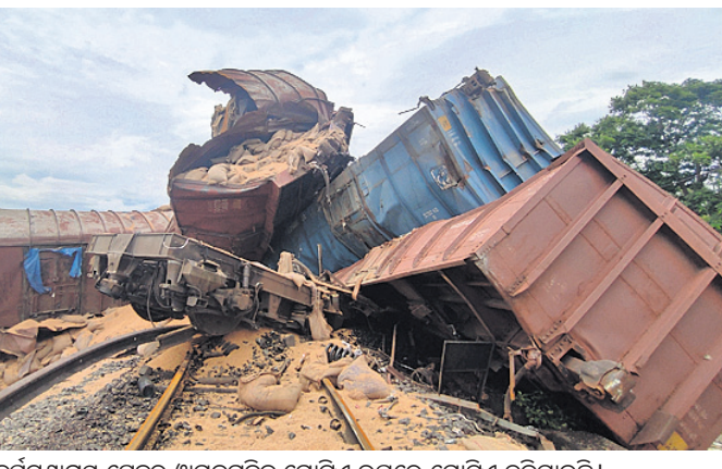
ଦୁର୍ଘଟଣାଗ୍ରସ୍ତ ଟ୍ରେନ୍‌ର ଖାଗନଗୁଡ଼ିକ ଗୋଟିଏ ଉପରେ ଗୋଟିଏ ଚଢ଼ିଯାଇଛି।

ଅନୁଗୋଳ ଅଫିସ୍, ୧୫୯ ଡେକାନାଲ-ସମ୍ବଲପୁର ରେଳସେକ୍ଟର ଡାକ୍ତରୀ ରୋଡ୍ ଷ୍ଟେଶନ ନିକଟ ଭୋରବେରେଣୀଠାରେ ସୋମବାର ବିକସିତ ରାତିରେ ଏକ ମାଲବାହୀ ଟ୍ରେନ୍ ଲାଲନରୁ୍ୟତ ହୋଇଛି। ଏକ ଛୋଟ ପୋଲ ଅତିକ୍ରମ କରୁଥିବାବେଳେ ଗହମ ବୋହେଇ ଏହି ଟ୍ରେନ୍‌ର ଲଞ୍ଜିନ ସହ ୧୨ଟି ଖାଗନ ଧାରଣାରୁ ବାହାରିଯାଇଛି। ତେବେ ଲୋକୋ ପାଇଲଟ ଏବଂ ଅନ୍ୟ କର୍ମଚାରୀମାନେ ସୁରକ୍ଷିତ ଅଛନ୍ତି। ଖବରପାଇ ପୂର୍ବତନ ରେଳପଥର ଚେକିକାଲ ଟିମ୍ ମଙ୍ଗଳବାର ସକାଳୁ ଉଦ୍ଧାର କାର୍ଯ୍ୟ ଜାରି ରଖିଛି। ଧାରଣା ଉପରୁ ଲଞ୍ଜିନ ଓ ଚକ୍ରାଚଳି ହୋଇ ରହିଥିବା ଖାଗନଗୁଡ଼ିକୁ ହଟାଯାଇପାରି ନ ଥିବାରୁ ଏହି ରୁଟ୍‌ରେ ଯିବାକୁ ଥିବା ୬ଟି ଟ୍ରେନ୍‌କୁ ବାଟିଲ କରିଦିଆଯାଇଛି। ଟିଏସ୍ ଗଡ଼ିଏସ୍ ବଦଳାଯାଇଛି। ଟ୍ରାକ୍ ସମ୍ପୂର୍ଣ୍ଣ ଠିକ୍ କରିବା ପାଇଁ ଆହୁରି ୨୪ ଘଣ୍ଟାରୁ