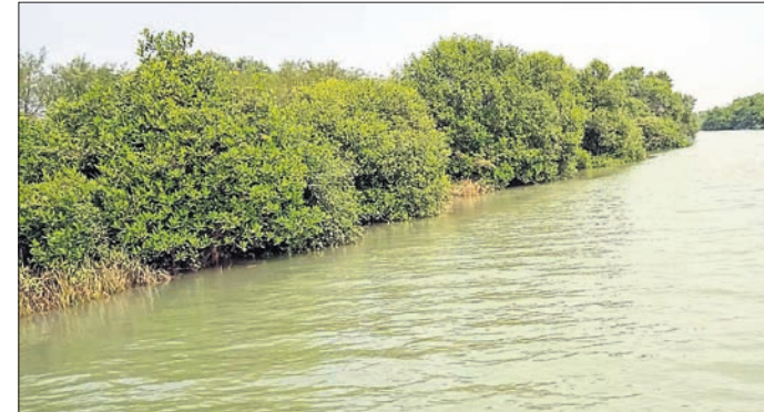
ଭିତରକନିକାରେ ହେଡ଼କାଳବଣ ।