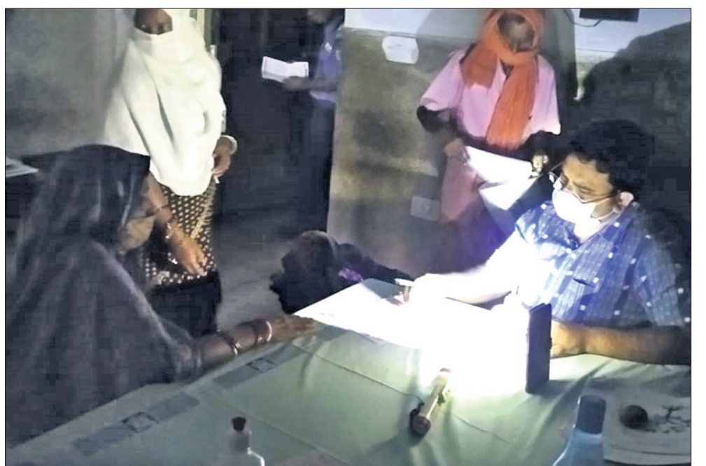
ମୋବାଇଲ ଲାଇଟ୍‌ରେ ଡାକ୍ତର ରୋଗୀ ଦେଖୁଛନ୍ତି ।