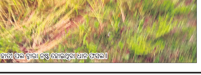
ହାତୀ ପଲ ଦ୍ୱାରା ନଷ୍ଟ ହୋଇଥିବା ଧାନ ଫସଲ ।

କରୁଥିଲେ ହେଁ ହାତୀପଲ ଯିବାର ନା ଧରୁନାହାନ୍ତି । ସେହିପରି ବିରତୋଲା ଗ୍ରାମରେ ୧୯ଟି ହାତୀ ପଶି ଫସଲ ନଷ୍ଟ କରୁଛନ୍ତି । ଗ୍ରାମବାସୀ ରାତି ଅନିଦ୍ରା ହୋଇ ହାତୀ ଘଉଡ଼ାଉ ଥିଲେ ମଧ୍ୟ ହାତୀ ପଲ ଯାଉନାହାନ୍ତି । ଅନ୍ୟପକ୍ଷରେ ବନବିଭାଗ କର୍ମଚାରୀ ସବୁ ଜାଣି ସୁଦ୍ଧା ନୀରବତ୍ୱ ସାଧିଛନ୍ତି । ଫଳରେ ଉଭୟ ଗ୍ରାମବାସୀ ଭୟଭୀତ ଅବସ୍ଥାରେ ଦିନ କାଟୁଛନ୍ତି । ବିଭାଗୀୟ ଉଚ୍ଚ କର୍ତ୍ତୃପକ୍ଷ ଏଥିପ୍ରତି ଦୃଷ୍ଟି ଦେଇ ଯଥାଶୀଘ୍ର ବିଚ୍ଛିତ ବ୍ୟବସ୍ଥା କରିବାକୁ ସାଧାରଣରେ ଦାବି ହେଉଛି ।