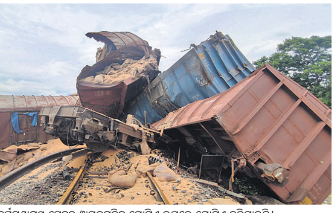
ଦୁର୍ଘଟଣାଗ୍ରସ୍ତ ଟ୍ରେନ୍‌ର ଓଗନଗୁଡ଼ିକ ଗୋଟିଏ ଉପରେ ଗୋଟିଏ ଚଢ଼ିଯାଇଛି।

ଅନୁଗୋଳ ଅଫିସ୍, ୧୫୯ ଡେକାନାଲ-ସମ୍ବଲପୁର ରେଳସେକ୍ଟର ଡାକ୍ତରୀ ରୋଡ୍ ଷ୍ଟେଶନ ନିକଟ ଭୋରବେରେଣୀଠାରେ ଯୋଗଦାନ ବିକସିତ ରାତିରେ ଏକ ମାଲବାହୀ ଟ୍ରେନ୍ ଲାଲନରୁ୍ୟତ ହୋଇଛି। ଏକ ଛୋଟ ପୋଲ ଅତିକ୍ରମ କରୁଥିବାବେଳେ ଗହମ ବୋହେଇ ଏହି ଟ୍ରେନ୍‌ର ଲଞ୍ଜିନ ସହ ୧୨ଟି ଓଗନ ଧାରଣାରୁ ବାହାରିଯାଇଛି। ତେବେ ଲୋକୋ ପାଇଲଟ ଏବଂ ଅନ୍ୟ କର୍ମଚାରୀମାନେ ସୁରକ୍ଷିତ ଅଛନ୍ତି। ଖବରପାଇ ପୂର୍ବତର ରେଳପଥର ଚେକିକାଲ ଟିମ୍ ମଙ୍ଗଳବାର ସକାଳୁ ଉଦ୍ଧାର କାର୍ଯ୍ୟ ଜାରି ରଖିଛି। ଧାରଣା ଉପରୁ ଲଞ୍ଜିନ ଓ ଚକ୍ରାଚଳ ହୋଇ ରହିଥିବା ଓଗନଗୁଡ଼ିକୁ ହଟାଯାଇପାରି ନ ଥିବାରୁ ଏହି ରୁଟ୍‌ରେ ଯିବାକୁ ଥିବା ୬ଟି ଟ୍ରେନ୍‌କୁ ବାଟିଲ କରିଦିଆଯାଇଛି। ୮ଟି ଗତିପଥ ବଦଳାଯାଇଛି। ଟ୍ରାକ୍ ସମ୍ପୂର୍ଣ୍ଣ ଠିକ୍ କରିବା ପାଇଁ ଆହୁରି ୨୪ ଘଣ୍ଟାରୁ