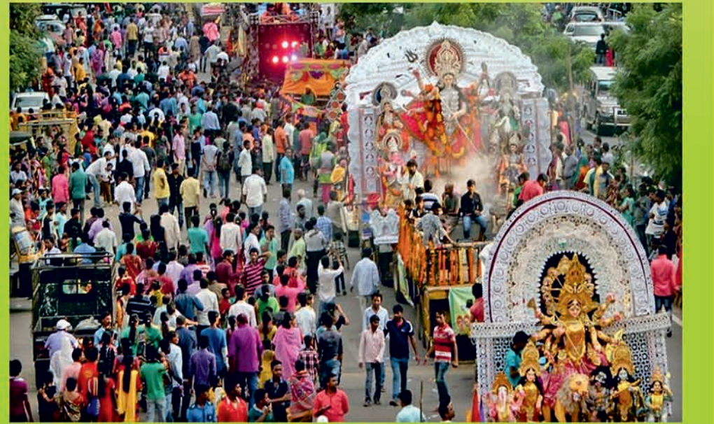
ଏପରି ବିପଦପୂର୍ଣ୍ଣ ଜନଗହଳି ହେବାକୁ ଦିଅନ୍ତୁ ନାହିଁ

କୋଭିଡ୍ ନିୟମ ପାଳନ ଆମର ନୈତିକ ଓ ମାନବିକ ଦାୟିତ୍ୱ ।