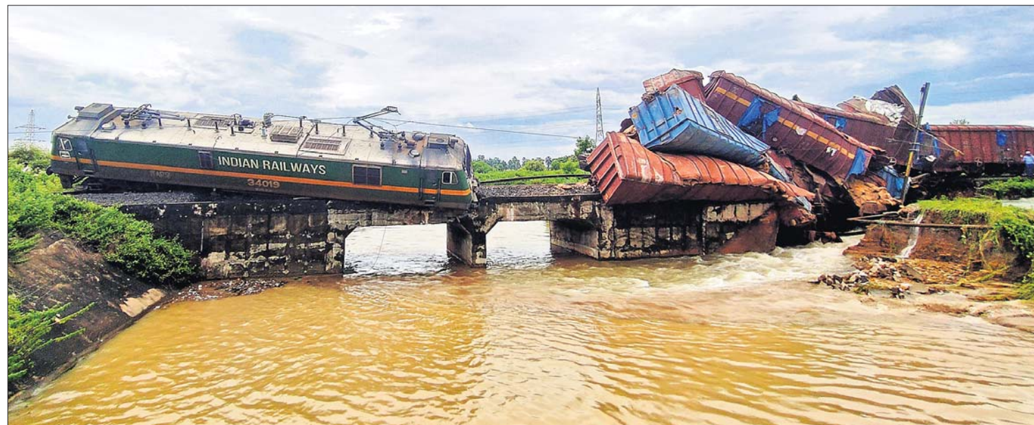
ଦେଲାନାଳ-ସମ୍ବଲପୁର ରେଳ ସେକ୍ଟରର ଚାକଟେର ରୋଡ୍ ସ୍ୱେଶନ ନିକଟ ଭୋଗବେରେଣା ପୋଲଠାରେ ସୋମବାର ବିକଳ ରାତିରେ ଏକ ମାଲବାହୀ ଟ୍ରେନ୍ ଲାଜନୁହତ ହୋଇଛି । (ବିପୋର୍ଟ: ପୃଷ୍ଠା-୩)