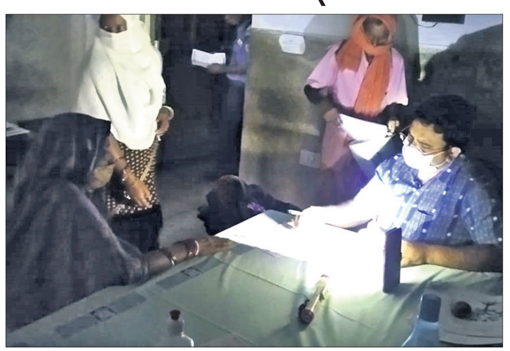
ମୋବାଇଲ ଲାଇଟ୍‌ରେ ଡାକ୍ତର ରୋଗୀ ଦେଖୁଛନ୍ତି।