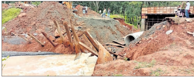
ଧୋଇ ଯାଇଥିବା ରାସ୍ତା ଏବଂ ପୋଲ।

ଓ କଲେଜକୁ ଯାଇ ପାଉନାହୁଁଛି। ଠିକା ସଂସ୍ଥା ପକ୍ଷରୁ ଉଚ୍ଚ ଅସୁଯାମୀ ପୋଲକୁ ମରାମତି କରାଯାଇଥିଲେ ମଧ୍ୟ ତାହା ବାରମ୍ବାର ଧୋଇଯିବାରୁ ଠିକା ବଦଳାଇଛି।