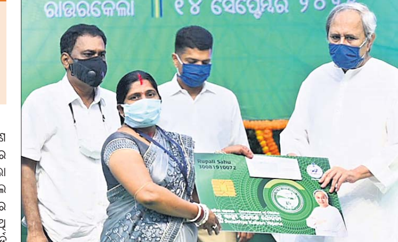
ମୁଖ୍ୟମନ୍ତ୍ରୀ ନବୀନ ପଟ୍ଟନାୟକ ହିରାଧିକାରୀଙ୍କୁ ସ୍ମାର୍ଟ ହେଲ୍ଥ କାର୍ଡ ବ୍ୟବହାର କରୁଛନ୍ତି।

ସୁନ୍ଦରଗଡ଼ ଜିଲ୍ଲାବାସୀଙ୍କ ପାଇଁ ବିକୃଷ୍ଣାସ୍ୱାସ୍ୟ କଲ୍ୟାଣ ଯୋଜନାରେ ସ୍ମାର୍ଟ ହେଲ୍ଥ କାର୍ଡ ବ୍ୟବହାର ଶୁଭାରମ୍ଭ ହୋଇଛି। ମଙ୍ଗଳବାର ରାଉରକେଲା ଆଇଡିଏସ୍ ସ୍ତର ସ୍ୱେଶଲିଟି ହସ୍ପିଟାଲ ସମ୍ମିଳନୀ କକ୍ଷରେ ଆୟୋଜିତ କାର୍ଯ୍ୟକ୍ରମରେ ମୁଖ୍ୟମନ୍ତ୍ରୀ ନବୀନ ପଟ୍ଟନାୟକ ମୁଖ୍ୟ ଅତିଥି ଭାବେ ଯୋଗଦେଇ ହିରାଧିକାରୀଙ୍କୁ ଏହି କାର୍ଡ ବ୍ୟବହାର କରିଥିଲେ। ଏଥିସହ ସେ ୫୮୦.୮୨ କୋଟି ଟଙ୍କା ବ୍ୟୟ ଅଟକଳରେ ବିଭିନ୍ନ ପ୍ରକଳ୍ପର ଉଦ୍‌ଘାଟନ ଓ ଭିଜିପ୍ରସ୍ତର ସ୍ଥାପନ କରିଥିଲେ। ମୁଖ୍ୟମନ୍ତ୍ରୀ ପୂର୍ବାହ୍ନ ୧୧ଟାରେ ରାଉରକେଲା