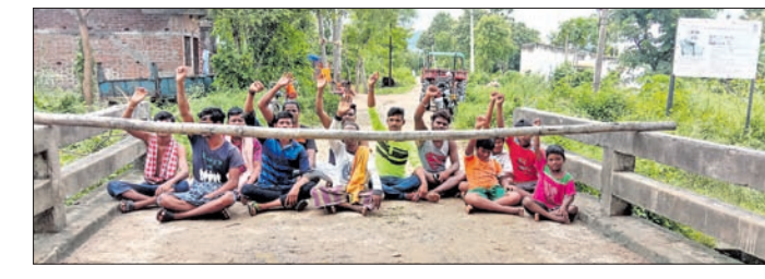
ଗ୍ରାମବାସୀଙ୍କ ରାସ୍ତା ଅବରୋଧ କରିଛନ୍ତି।

ଅଭିଯୋଗ ସତ୍ତ୍ୱେ କୌଣସି ପୁଞ୍ଜି ନ ମିଳିବାରୁ ଗାଁ ଲୋକେ ରାସ୍ତା ଅବରୋଧ କରିଥିବା କହିଛନ୍ତି।