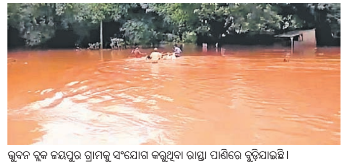
ଭୁବନ ବ୍ଲକ୍ ଜୟପୁର ଗ୍ରାମକୁ ସଂଯୋଗ କରୁଥିବା ରାସ୍ତା ପାଣିରେ ବୁଡ଼ିଯାଇଛି।

ବଢ଼ିବାରେ ଲାଗିଛି, ଯାହା ନଦୀକୂଳ ଆଞ୍ଚଳିକ ସମାଜର ପକ୍ଷରୁ ଅନୁଭବ କରାଯାଇଛି।