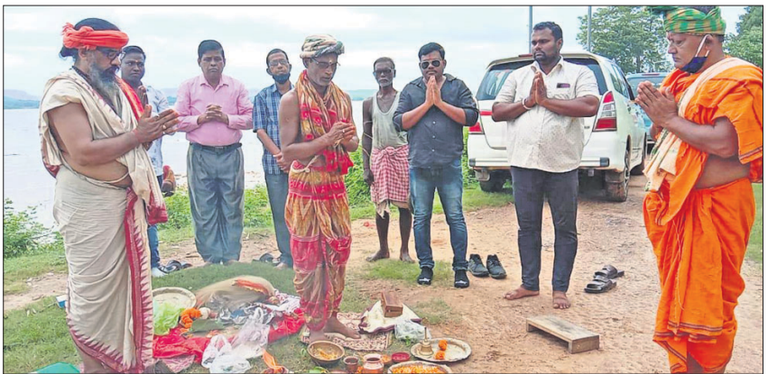
ଗଣେଶ ବଜାର ପୂଜା କମିଟି ପକ୍ଷରୁ ମାଟି ଅନୁକୁଳ ଉପଲକ୍ଷେ ପୂଜାର୍ଚ୍ଚନା କରାଯାଇଛି।

ଡେକାନାଲ ଅଫିସ୍, ୧୪୮୯: ଡେକାନାଲ ଜିଲ୍ଲା ପୋଲିସ୍ ପ୍ରଶାସନରେ ଛୋଟ ଧରଣର ଅପରାଧର ବିଚାରଣା କରାଯାଇଛି।