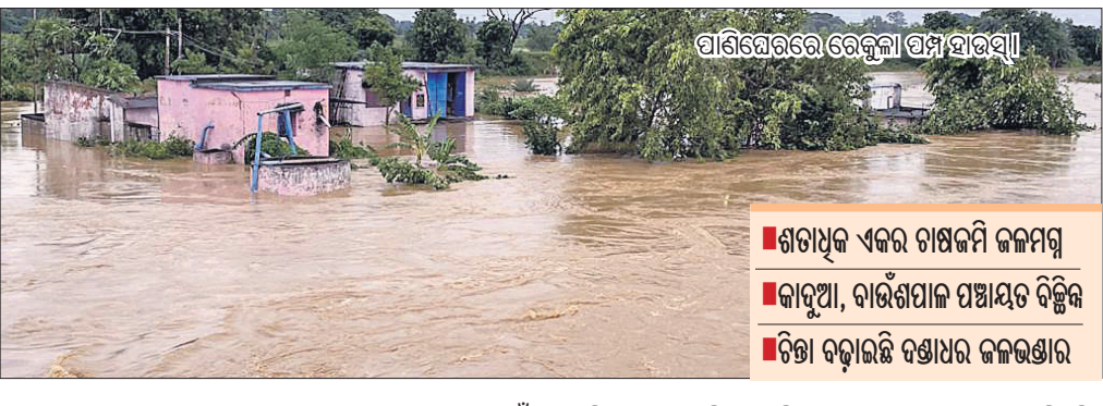
ପାଣିସେରରେ ରେକ୍ୟୁଲେସନ୍ ହେଉଛି।

କାମାକ୍ଷାନଗର, ୧୪୮୯(ଡି.ଏନ୍.ଏ.) ବନ୍ଧୋପସାଗରରେ ସୃଷ୍ଟି ହୋଇଥିବା ଜଳାଶୟ ବିକ୍ରି ପାଇଁ ଗ୍ରାମବାସୀଙ୍କୁ ସଚ୍ଚିତ କରାଯାଇଛି।