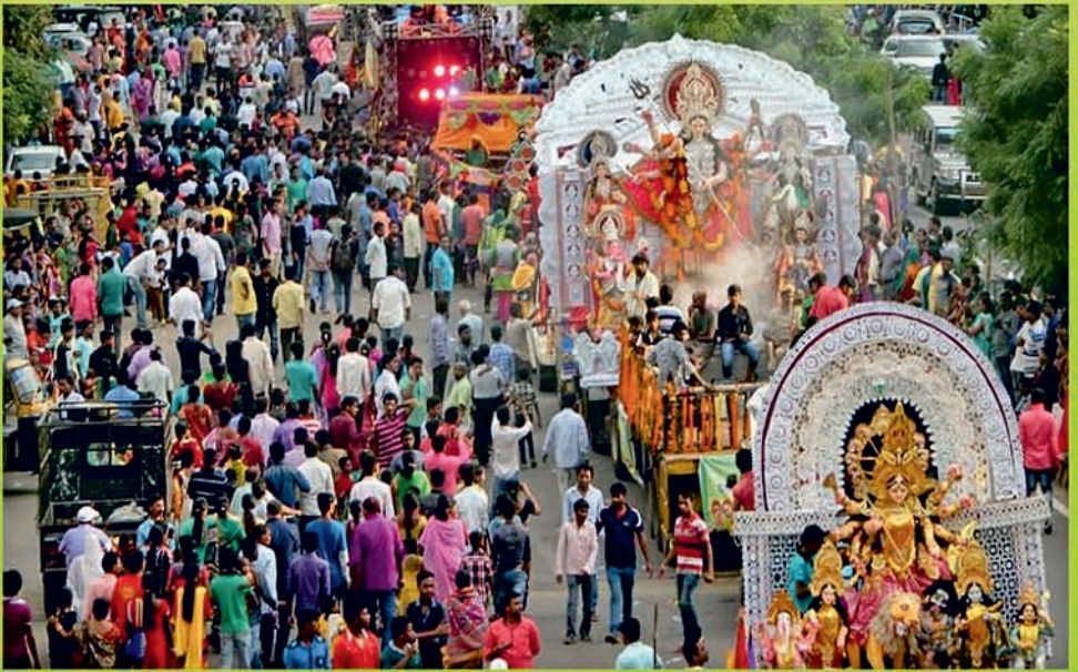
ଏପରି ବିପଦପୂର୍ଣ୍ଣ ଜନଗହଳି ହେବାକୁ ଦିଅନ୍ତୁ ନାହିଁ

କୋଭିଡ଼ ନିୟମ ପାଳନ ଆମର ନୈତିକ ଓ ମାନବିକ ଦାୟିତ୍ୱ ।