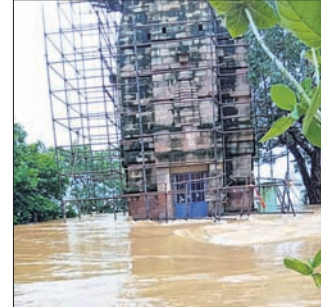
ଡେକାନାଲ ଅଫିସ୍/ଗଠିଆ, ୧୪୮୯

ଲଗାଏତରେ ଡେକାନାଲ ଜିଲ୍ଲା ଗଠିଆ ବ୍ଲକ୍ କରମ୍ଭୁଜ ଅଞ୍ଚଳରେ ବନ୍ୟା ପରିସ୍ଥିତି ସୃଷ୍ଟି ହୋଇଛି।