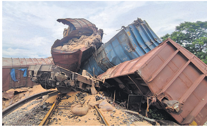
ଭୁବନେଶ୍ୱର ଟ୍ରେନ୍ର ଓଗନଗୁଡ଼ିକ ଗୋଟିଏ ଉପରେ ଗୋଟିଏ ଚଢ଼ିଯାଇଛି ।

ଡେକାନାଲ-ସମ୍ବଲପୁର ରେଳ ସେକ୍ଟର ଡାକ୍ତରୀରେ ରୋଡ୍ ଷ୍ଟେଶନ ନିକଟ କୋରବେରେଣାଠାରେ ସୋମବାର ବିକଳିତ ରାତିରେ ଏକ ମାଲବାହୀ ଟ୍ରେନ୍ ଲାଇନରୁ୍ୟତ ହୋଇଛି । ଏକ ଛୋଟ ପୋଲ ଅତିକ୍ରମ କରୁଥିବାବେଳେ ଗହମ ବୋହେଇ ଏହି ଟ୍ରେନ୍ର ଇଞ୍ଜିନ ସହ ୧୨ଟି ଓଗନ ଧାରଣାକୁ ବାହାରିଯାଇଛି । ତେବେ ଲୋକୋ ପାଇଲଟ ଏବଂ ଅନ୍ୟ କର୍ମଚାରୀମାନେ ପୁରୁଣା ଅଛନ୍ତି । ଖବରପାଇ ପୂର୍ବତର ରେଳପଥର ଚେକିକାଲ ଚିମ୍ ମଙ୍ଗଳବାର ସକାଳୁ ଉଦ୍ଧାର କାର୍ଯ୍ୟ ଜାରି ରଖିଛି । ଧାରଣା ଉପରୁ ଇଞ୍ଜିନ ଓ ଚଳାଚଳିତ ହୋଇ ରହିଥିବା ଓଗନଗୁଡ଼ିକୁ ହଟାଯାଇପାରି ନ ଥିବାରୁ ଏହି ଟ୍ରେନ୍ରେ ଯିବାକୁ ଥିବା ୨୦ରୁ ଅଧିକ ଟ୍ରେନ୍କୁ ବାତିଲ କରିଦିଆଯାଇଛି । ୮ଟିର ଗତିପଥ ବଦଳାଯାଇଛି । ଟ୍ରାକ୍ ସମ୍ପୂର୍ଣ୍ଣ ଠିକ୍ କରିବା ପାଇଁ ଆହୁରି ୨୪