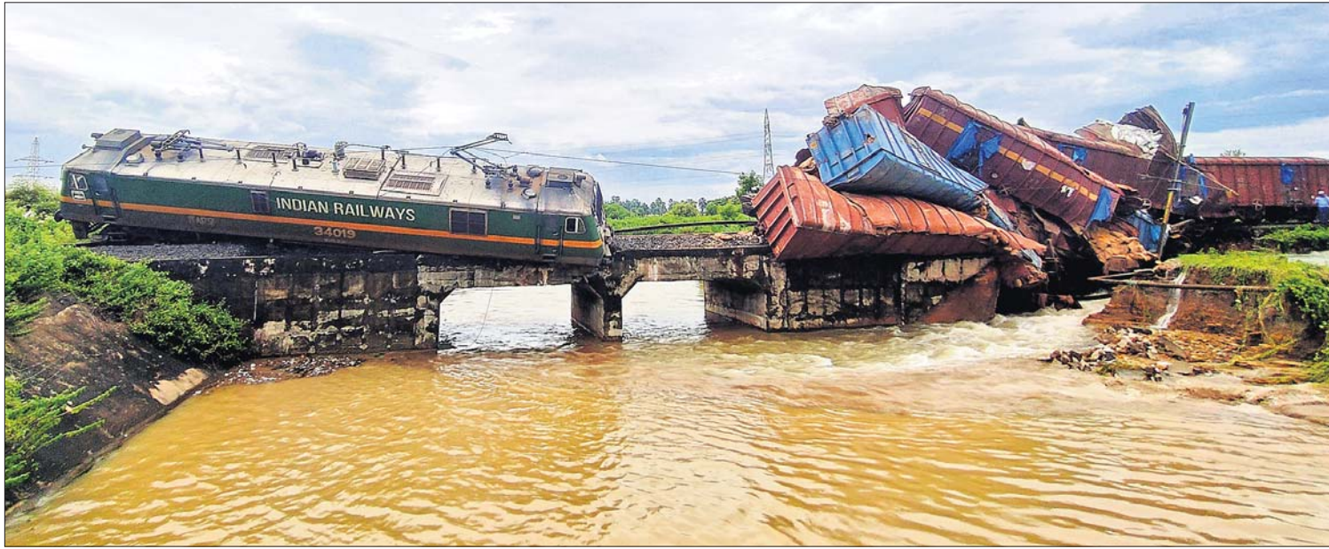
ଡେକାନାଲ-ସମ୍ବଲପୁର ରେଳ ସେକ୍ଟରର ଡେକାନାଲ ରୋଡ୍ ଷ୍ଟେସନ ନିକଟ ଭୋଗବେରେଣା ପୋଲଠାରେ ଯୋମବାର ବିକଳତା ରାତିରେ ଏକ ମାଲବାହୀ ଟ୍ରେନ୍ ଲାଇନରୁ ଡେଇଁଛି । (ବିପୋର୍ତ୍ତ: ପୃଷ୍ଠା-୩)