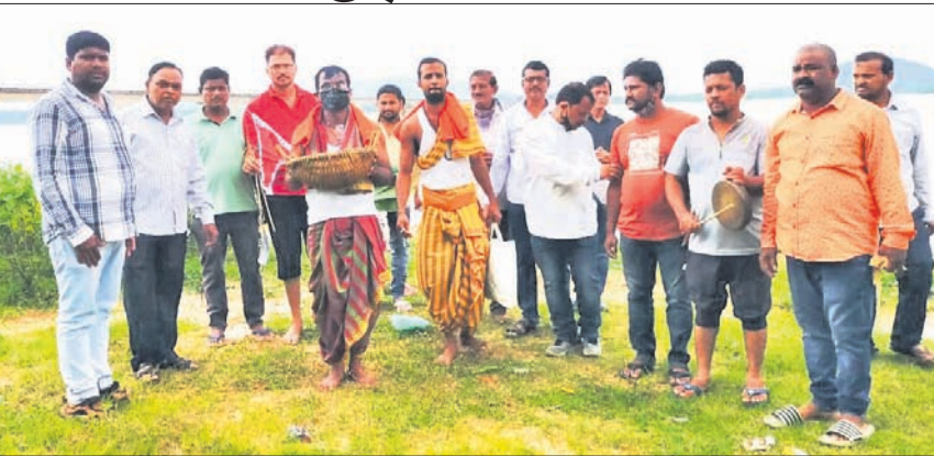
ମିନାବଜାର ପୂଜା ପ୍ରତିଷ୍ଠାନ ପକ୍ଷରୁ ଲକ୍ଷ୍ମୀପୂଜା ପାଇଁ ମାଟି ଅନୁକୁଳ କରାଯାଇଛି।