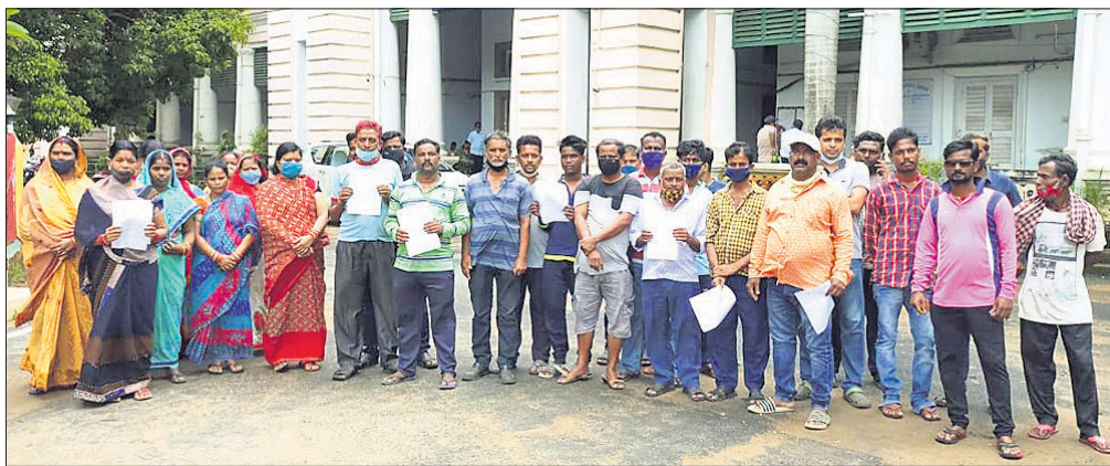
ଜିଲ୍ଲାପାଳଙ୍କ ଦ୍ୱାରା ଉଦ୍ଘାଟିତ ଅଞ୍ଚଳବାସୀ।

ଡେକାନାଲ ସଦର ବ୍ଲକ୍ ସାମାଜିକ ସେବା ସମିତି ଦ୍ୱାରା ଜଳାଶୟ ବିକ୍ରି ପାଇଁ ଗ୍ରାମବାସୀଙ୍କୁ ସଚ୍ଚିତ କରାଯାଇଛି। ଏହା ମଧ୍ୟରେ ଉଚ୍ଚ ଶ୍ରେଣୀର ଜଳାଶୟ ବିକ୍ରି କରାଯାଇଥିବା ସହିତ ନିମ୍ନ ଶ୍ରେଣୀର ଜଳାଶୟ ବିକ୍ରି କରାଯାଇଥିବା ସହିତ ସମସ୍ତ ଗ୍ରାମବାସୀଙ୍କୁ ସଚ୍ଚିତ କରାଯାଇଛି।