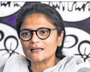
ନୂଆଦିଲ୍ଲୀ, ୧୪୮୯: କଂଗ୍ରେସ ଛାଡ଼ି ଚୁଣ୍ଟାମୂଳ କଂଗ୍ରେସ(ଟିଏମ୍‌ସି)ରେ ଯୋଗଦେବାର ମାସେ ଭିତରର ସୁସ୍ମିତା ଦେବଙ୍କୁ ରାଜ୍ୟ ସଭା ପଠାଇବାକୁ ମମତା ବାନାର୍ଜୀ ମନୋନୀତ କରିଛନ୍ତି। ଏ ନେଇ ଟିଏମ୍‌ସି ପକ୍ଷରୁ ମଙ୍ଗଳବାର ଏକ ଟୁରନ୍ତ୍ କରାଯାଇଛି। ମହିଳାମାନଙ୍କୁ ସଶକ୍ତ କରିବା ଏବଂ ରାଜନୀତିରେ ସେମାନଙ୍କର ସର୍ବାଧିକ ଭାଗାଦାର ସୁନିଶ୍ଚିତ କରିବା ମମତାଙ୍କ ଭିଜନ ବୋଲି ଏଥିରେ କୁହାଯାଇଛି। ସୁସ୍ମିତା ଏ ନେଇ ମମତାଙ୍କୁ ଧନ୍ୟବାଦ ଜଣାଇଛନ୍ତି। ଟିଏମ୍‌ସି ଏମ୍‌ପି ମାନସ ରଞ୍ଜନ ଭୂୟାଁ ରାଜ୍ୟ ସଭାକୁ ଉପସ୍ଥାପନ ଦେବାପରେ ସେହି ପଦ ଖାଲିରହିଛି। ଭୂୟାଁଙ୍କୁ ମମତା ତାଙ୍କ ବ୍ୟାପାରିନେଟରେ ମନ୍ତ୍ରୀ କରିଥିଲେ। ତାମିଲନାଡୁରେ ୨, ପଶ୍ଚିମବଙ୍ଗ, ଆସାମ, ମହାରାଷ୍ଟ୍ର, ମଧ୍ୟପ୍ରଦେଶ ଏବଂ ପୁଡୁଚେରୀରେ ଗୋଟିଏ ଲେଖାଏଁ ରାଜ୍ୟ ସଭା ଆସନ ଖାଲିପଡ଼ିଛି। ଅକ୍ଟୋବର ୪ରେ ସମସ୍ତ ୬ ପଦ ପାଇଁ ଉପ-ନିର୍ବାଚନ ହେବ ବୋଲି ଭାରତର ନିର୍ବାଚନ କମିଶନ ବିକ୍ଷେପ୍ତ ଭାବି କରିଛନ୍ତି।