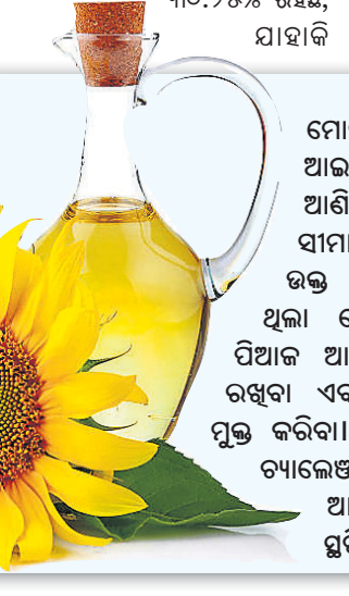
ମୋଦି ସରକାର ଅତ୍ୟାବଶ୍ୟକ ସାମଗ୍ରୀ ଆଇନ, ୧୯୫୫ରେ ସଂଶୋଧନ ଆଣିବାର ବର୍ଷକ ପରେ ମହଜୁଦ ସାମା କଟକଣା ଜାରି କରାଯାଇଛି। ଉକ୍ତ ସଂଶୋଧନ ପଛର ଉଦ୍ଦେଶ୍ୟ ଥିଲା ଟିକିବାଜ, ତାଲିକାତୀୟ ଶାସ୍ୟ, ପିଆଜ ଆଦିକୁ ଆଇନ ପରିସର ବାହାରେ ରଖିବା ଏବଂ ସେସବୁକୁ ସାମା କଟକଣାକୁ ମୂଳ୍ କରିବା। ତେବେ ଏହାକୁ ସୁପ୍ରିମକୋର୍ଟରେ ଚ୍ୟାଲେଞ୍ଜି କରାଯାଇଥିବାରୁ ଉକ୍ତ ଆଇନର କାର୍ଯ୍ୟକାରୀତା ଉପରେ ସ୍ଥଗିତାଦେଶ ଜାରି କରାଯାଇଛି।

ହେଉଛି। ସୁପ୍ରିମକୋର୍ଟ ଉକ୍ତ ଆଇନର କାର୍ଯ୍ୟକାରୀତା ଉପରେ ସ୍ଥଗିତାଦେଶ ଜାରି କରିଥିବାରୁ ସରକାର ଏବେ ଏହାକୁ ଆକ କରି ତେଲ ଦର ନିୟନ୍ତ୍ରଣ ଉଦ୍ଦେଶ୍ୟରେ ଷ୍ଟକ୍ ସାମା ନେଇ କଟକଣା ଜାରି କରିଛନ୍ତି। ଏନେଇ ସରକାର ଆମଦାନୀ ଶୁଳ୍କ ହ୍ରାସ କରିଛନ୍ତି। ଏହାସତ୍ତ୍ୱେ ଖାଇବା ତେଲ ଦରଦାମ୍ ହ୍ରାସ ପାଇନାହିଁ। ଏଥିପାଇଁ ଖାଦ୍ୟ, ସାଧାରଣ ବନ୍ଧନ ଏବଂ ଉପଭୋକ୍ତା ବ୍ୟାପାର ମନ୍ତ୍ରାଳୟ ମହଜୁଦକାରୀଙ୍କୁ ଦାୟୀ କରି ଷ୍ଟକ୍ ଲିମିଟ୍ ଉପରେ ଅକ୍ଷମ ଲାଗାଇଛି। ଅତ୍ୟାବଶ୍ୟକ ସାମଗ୍ରୀ ଆଇନ, ୧୯୫୫ ଅନୁସାରେ ଲୋକଙ୍କ ପାଇଁ ଉଚିତ ମୂଲ୍ୟରେ କରୁନା ସାମଗ୍ରୀଗୁଡ଼ିକର ଉପଲବ୍ଧତା ସୁନିଶ୍ଚିତ କରିବାକୁ ରାଜ୍ୟ ସରକାରମାନଙ୍କୁ ପତ୍ର ଲେଖି ନିର୍ଦ୍ଦେଶ ଦିଆଯାଇଛି। ଉଲ୍ଲେଖଯୋଗ୍ୟ, ମୋଦି ସରକାର ଗତ ଜୁନ୍ ୫ରେ ଅତ୍ୟାବଶ୍ୟକ ସାମଗ୍ରୀ (ଏଂବିଶାଧନ) ଅଧାଦେଶ ଆଣିଥିଲେ। ସେତେବେଳେ ଟିକିବାଜ, ତାଲିକାତୀୟ ଶାସ୍ୟ, ପିଆଜ ଆଦିକୁ ଉକ୍ତ ଆଇନ ପରିସର ବାହାରେ ରଖାଯାଇଥିଲା। ଉଦ୍ଦେଶ୍ୟ ଥିଲା ସେସବୁକୁ ମହଜୁଦ ରଖିବା ପାଇଁ କଟକଣା ମୂଳ୍ କରିବା। ତେବେ ଏହାକୁ ସୁପ୍ରିମକୋର୍ଟରେ ଚ୍ୟାଲେଞ୍ଜି କରାଯାଇଥିବାରୁ ଉକ୍ତ ଆଇନର କାର୍ଯ୍ୟକାରୀତା ଉପରେ ସ୍ଥଗିତାଦେଶ ଜାରି କରାଯାଇଛି।