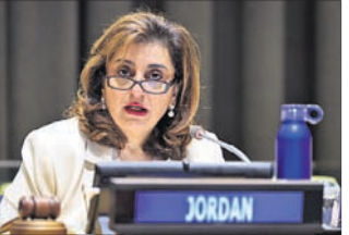
ରିଜିଷ୍ଟ୍ରାଲ ଗ୍ଲାୟା ପର୍ ଆରବ ଷ୍ଟେଟ୍ସ ପାଇଁ ଅତିରିକ୍ତ ପ୍ରଶାସକ ଏବଂ ନିର୍ଦ୍ଦେଶକ ଦାୟିତ୍ୱ ଗ୍ରହଣ କରିଛନ୍ତି। ୨୦୦୮ରୁ ୨୦୧୨ ପର୍ଯ୍ୟନ୍ତ ସେ ଲିବ୍ ଆରବ ଷ୍ଟେଟ୍ସର ସାମାଜିକ ବିକାଶ ବିଭାଗ ମୁଖ୍ୟ ଏବଂ ସହକାରୀ ମହାସଚିବ ରହିଛନ୍ତି।