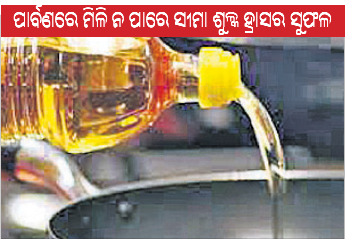
ପାର୍ବଣରେ ମିଳି ନ ପାରେ ସାମା ଶୁଳ୍କ ହ୍ରାସର ସୁଫଳ

ପୁଷ୍ଟ ଉପରେ ଭୋଗ ଥିଲେ କରୁନା ସାମଗ୍ରୀଗୁଡ଼ିକର ଆକାଶକୁ ଆଁ ଦରଦାମ୍ ଶାସକ ଦଳର ବିଜୟ ଆଶାକୁ ମଳିନ କରିଦିଏ। ଉତ୍ତର ପ୍ରଦେଶ ସମେତ ୫ ଗୁରୁତ୍ୱପୂର୍ଣ୍ଣ ରାଜ୍ୟରେ ବିଧାନସଭା ନିର୍ବାଚନକୁ ଆଉ ମାତ୍ର କେଳମାସ ବାକି ଥିବାବେଳେ ଦରଦାମ୍ ନିୟନ୍ତ୍ରଣକୁ ଆଣିବା କେନ୍ଦ୍ର ସରକାରଙ୍କ ଆଗରେ ବଡ଼ ଚ୍ୟାଲେଞ୍ଜି ଭାବେ ଉଭା ହୋଇଛି। ଉଚିତ ଅନୁପାତରେ ମୌସୁମୀ ବର୍ଷା ନ ହେବାକୁ ଖରାପ ଅମଳକୁ ନେଇ ଅନିଶ୍ଚିତତା ଦେଖାଦେଇଛି, ଯାହାକି ଆଗାମୀ ଦିନରେ କରୁନା ସାମଗ୍ରୀ ମୂଲ୍ୟକୁ ଆହୁରି ବଢ଼ାଇଦେଇପାରେ। ତେଣୁ ଖାଦ୍ୟ ସାମଗ୍ରୀଗୁଡ଼ିକର ମୂଲ୍ୟ ବୃଦ୍ଧି ବିଶେଷକରି ତାଲିକାତୀୟ ଓ ତେଲ ଦର ଉପରେ ଲାଗାମ ଲାଗାଇବା ପାଇଁ କେନ୍ଦ୍ର ବିଭିନ୍ନ ପଦକ୍ଷେପ ନେବା ଆରମ୍ଭ କରିଛି। ଏହା ସତ୍ତ୍ୱେ ପାର୍ବଣରେ ସୁଫଳ ମିଳିବା ଆଶା ବିଶ୍ୱାସୀ।