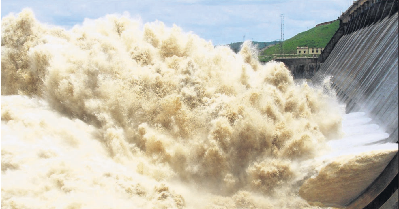
ଝରିଗଡ଼ରେ ଲଗାଣ ବର୍ଷା ଯୋଗୁ ହାରାହାରି ତ୍ୟାମ୍ରେ କଳସ୍ତର ବଢ଼ିଛି । ରୁଧିର ରାତି ୯ଟା ପୁଞ୍ଜା ତ୍ୟାମ୍ରେ ୨୪ ଗେଜ୍ ଦେଇ କଳ ନିଷ୍ପାଦନ ହେଉଛି ।

କମ୍ପାନୀଗୁଡ଼ିକ ୪ ବର୍ଷ ଯାଏ ସେମାନଙ୍କ ଦେଇ ଚାଲିପାରିବେ । ମାତ୍ର ବକେୟା ଉପରେ ସେମାନଙ୍କୁ ସୁଧ ଦେବାକୁ ପଡ଼ିବ । ନୂଆ ନିୟମ ବର୍ତ୍ତମାନଠାରୁ ଲାଗୁ ହେବ । ଏହାବାଦ ଗ୍ରାହକଙ୍କ ଲାଗି ସବୁ ଫର୍ମକୁ ବର୍ତ୍ତମାନ ଡିଜିଟାଲାଇଜେସନ୍ କରାଯିବ । ନୂଆ ସିମ୍ କାର୍ଡ ସମୟରେ ବାରମ୍ବାର କେଉଁଭାବେ ଫର୍ମ ଭରିବାକୁ ପଡ଼ିବ ନାହିଁ । ପ୍ରପେଡ଼ରୁ ପୋଷ୍ଟ ପେଡ଼ କିମ୍ବା ପୋଷ୍ଟ ପେଡ଼ରୁ ପ୍ରପେଡ଼ କରିବା ଲାଗି କେବଳ ଡିଜିଟାଲ କେଉଁଭାବେ ଦେବାକୁ ପଡ଼ିବ ବୋଲି ସେ କ୍ଷମ୍ଭ କରିଛନ୍ତି । ଆହୁରି କେତେକ ଗ୍ରାହକଙ୍କୁ (ଏକ୍ସପ୍ରେସ୍) ଏବଂ ଅନ୍ୟ ବୈଧାନିକ ଦେଇ ପଲ୍ଡ କମ୍ପାନୀଙ୍କ ଲାଗି ମୁକ୍ତବିକା ହୋଇ ରହିଥିଲା । ଦେଇ ପ୍ରଦାନର ସମୟ ସୀମା କୋହଳ ହୋଇଥିବାରୁ