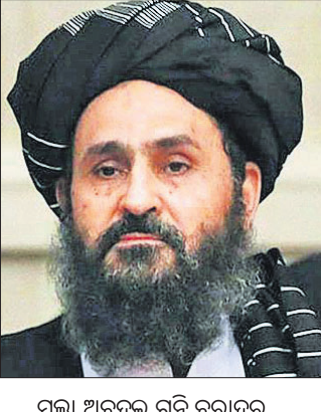
ମୁଲ୍ଲା ଅବଦୁଲ ଗନି ବରାଦର

କାବୁଲ, ୧୫।୯ ଆଫଗାନିସ୍ତାନ ବିଜୟକୁ ନେଇ ଡାକ୍ତରୀ ୨.୦ରେ ଫାଟ ପୁଷ୍ଟି ହୋଇଛି । କ୍ଷମତା କନ୍ଦ ଯୋଗୁ ନିକଟରେ ହକ୍କାନି ନେତୃତ୍ୱ ଦ୍ୱାରା ରୁଜିର ଶିକାର ହୋଇଥିବା ଉପ-ପ୍ରଧାନମନ୍ତ୍ରୀ ମୁଲ୍ଲା ଅବଦୁଲ ଗନି ବରାଦର ଆଫଗାନିସ୍ତାନ ବିଜୟର ଶ୍ରେୟ ନିଜକୁ ଦେଇଥିବାବେଳେ ହକ୍କାନି ଗୋଷ୍ଠୀ ତାହାକୁ ସ୍ୱୀକାର କରିପାରୁନି । ଏହାକୁ ନେଇ ଡାକ୍ତରୀ ଅନ୍ତରାଣ ସରକାରରେ ପୁଣି ମତଭେଦ ଓ କନ୍ଦ ମୁଣ୍ଡ ଚେଳିଛି । କାବୁଲସ୍ଥିତ ରାଷ୍ଟ୍ରପତି ଭବନରେ ଗତ ସପ୍ତାହରେ ବରାଦର ଓ କ୍ୟାବିନେଟ୍ ସଦସ୍ୟ ଖଲିଲ୍ ଉର୍-ରେହମାନ୍ ହକ୍କାନୀଙ୍କ