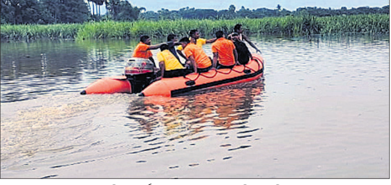
ଅଗ୍ନିଶମ କର୍ମଚାରୀମାନେ ଖୋଜାଖୋଜି କରୁଛନ୍ତି।

ଆଗକୁ ଯାଇ ନ ପାରି ଭାସି ଯାଇଥିଲେ। ପୁଅ ଏତେ ପ୍ରଖର ଥିଲା ଯେ, କେଲମା ମିନିଟରେ ସେମାନେ ନିରୁଦ୍ଧିଷ୍ଟ ହୋଇ ଯାଇଥିଲେ।