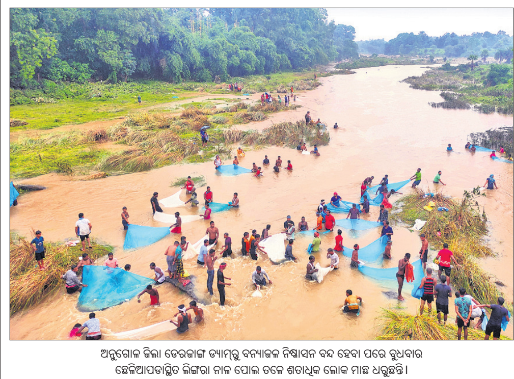
ଅରୁଗୋକ ଜିଲା ତେରକାଙ୍ଗ ଡାମ୍ପୁର ବନ୍ୟାଜଳ ନିଷାସନ ବନ୍ଦ ହେବା ପରେ ରୁଧିବାର ହେଲିଆପତାସ୍ଥିତ ଲିଙ୍ଗା ନାଳ ପୋଲ ତଳେ ଶତାଧିକ ଲୋକ ମାଛ ଧରୁଛନ୍ତି।

ଭୁବନେଶ୍ୱର, ୧୫୯(ବୁଧବେଳା): ମିଲେଟ(ମାଣିଆ, ମକା, ବାଜରା, ଯଅ ଭଳି ଶସ୍ୟ) ଚାଷକୁ ପ୍ରୋତ୍ସାହନ ଦେଇଥିବା ଦେଶର ରାଜ୍ୟଗୁଡ଼ିକ ମଧ୍ୟରେ ଓଡ଼ିଶା ଶ୍ରେଷ୍ଠ ବିବେଚିତ ହୋଇଛି। ଓଡ଼ିଶା ମିଲେଟ ମିଶନକୁ ପୂର୍ବରୁ ନାତି ପୁଣ୍ୟାୟତନୀ ଶୁଭେଚ୍ଛା ଆୟୋଗ ପ୍ରଶଂସା କରିଛି।