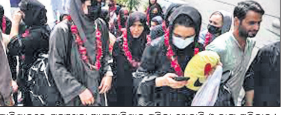
ପାକିସ୍ତାନରେ ପହଞ୍ଚିଥିବା ଆଫଗାନିସ୍ତାନ ମହିଳା ଖେଳାଳି ଓ ତାଙ୍କ ପରିବାର।

ଉଇକେଟିପର ବ୍ୟାଟ୍ମ୍ୟାନ କ୍ଲିନ୍ସନ ଡି'କକ୍ ର୍ୟାଙ୍କିଂ ତାଲିକାର ୮ମ ସ୍ଥାନରେ ରହିଥିବାବେଳେ ଫ୍ରେଣ୍ଡ୍‌ସ୍ ଖେଳି ଏଭିଏ ଟାଲିକାର ୯ମ ସ୍ଥାନରେ ଅଧିନାୟକ ବିରାଟ କୋହଲି ଓ ଗାନ୍ତେକ୍ ସାମ୍ବି ଏବେ ଦୁଇ ପ୍ରଥମ ସ୍ଥାନରେ ରହିଛନ୍ତି। ତାଙ୍କ ପଛରୁ ପଛ ଓ୍ବିନିଷ୍ଟ ହସବେନା ଓ ରଶିଦ୍ ଖାଁ ରହିଛନ୍ତି। ଚ୍ୟୁ ୨୦ ତାଲିକାରେ ଭାରତର ଶୀର୍ଷ ର୍ୟାଙ୍କିଂପ୍ରାପ୍ତ ବୋଲର ଭୁବନେଶ୍ୱର କୁମାର ୧୨ତମ ସ୍ଥାନରେ ରହିଥିବାବେଳେ ଓ୍ବିନିଷ୍ଟନ ସୁହର ୧୮ତମ ସ୍ଥାନରେ