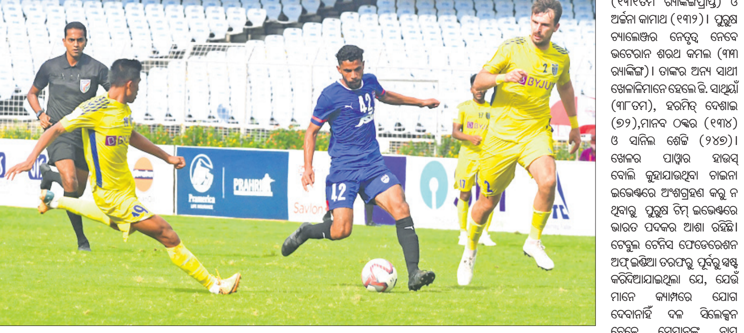
କୋଲକାତାରେ ଚାଲିଥିବା ଭୁରାଣ୍ଡ କପ୍ ପ୍ରତିଯୋଗିତାରେ ବୁଧବାର ବେଙ୍ଗାଲୁରୁ ଏପ୍ରିଲ ଓ କେରଳ ଗ୍ଲାସ୍‌ସର୍ସ ମଧ୍ୟରେ ଅନୁଷ୍ଠିତ ମ୍ୟାଚ।