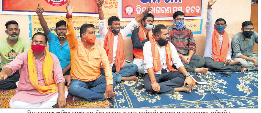
ଜିଲାପାଳଙ୍କ ଅଫିସ୍ ସମ୍ମୁଖରେ ହିନ୍ଦୁ କାଗରଣ ମଞ୍ଚ କର୍ମକର୍ତ୍ତା ଆମରଣ ଅନଶନରେ ବସିଛନ୍ତି।