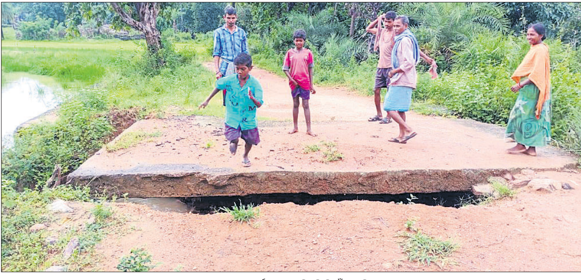
ଭଙ୍ଗା କଲଭର୍ଟ ଉପରେ ଶିଶୁ ଡିଆଁ ମାଉଛି।

ମାଲକାନଗିରି ଜିଲ୍ଲାରେ ଆଦିବାସୀଙ୍କ ବିକାଶ ପାଇଁ କେନ୍ଦ୍ର ଏବଂ ରାଜ୍ୟ ସରକାର ବିଭିନ୍ନ ଯୋଜନା କାର୍ଯ୍ୟକାରୀ କରିଛନ୍ତି।