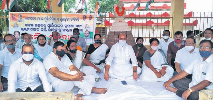
କଟକ ପୁରୀଯାତ୍ରଣା ପହାଠା ଗାନ୍ଧୀଙ୍କ ପ୍ରତିମୂର୍ତ୍ତି ତଳେ କଂଗ୍ରେସ କର୍ମକର୍ତ୍ତାଙ୍କ ନୀରବ ପ୍ରତିବାଦ।

ପାର୍ବଣ ପାଖେଇ ଆସୁଛି। ତେବେ ଦୁର୍ଗାପୂଜା ଯେତେ ପାଖେଇ ଆସୁଛି ମୂର୍ତ୍ତି ବିବାଦ ସେତେ ତୀବ୍ର ହେବାରେ ଲାଗିଛି।