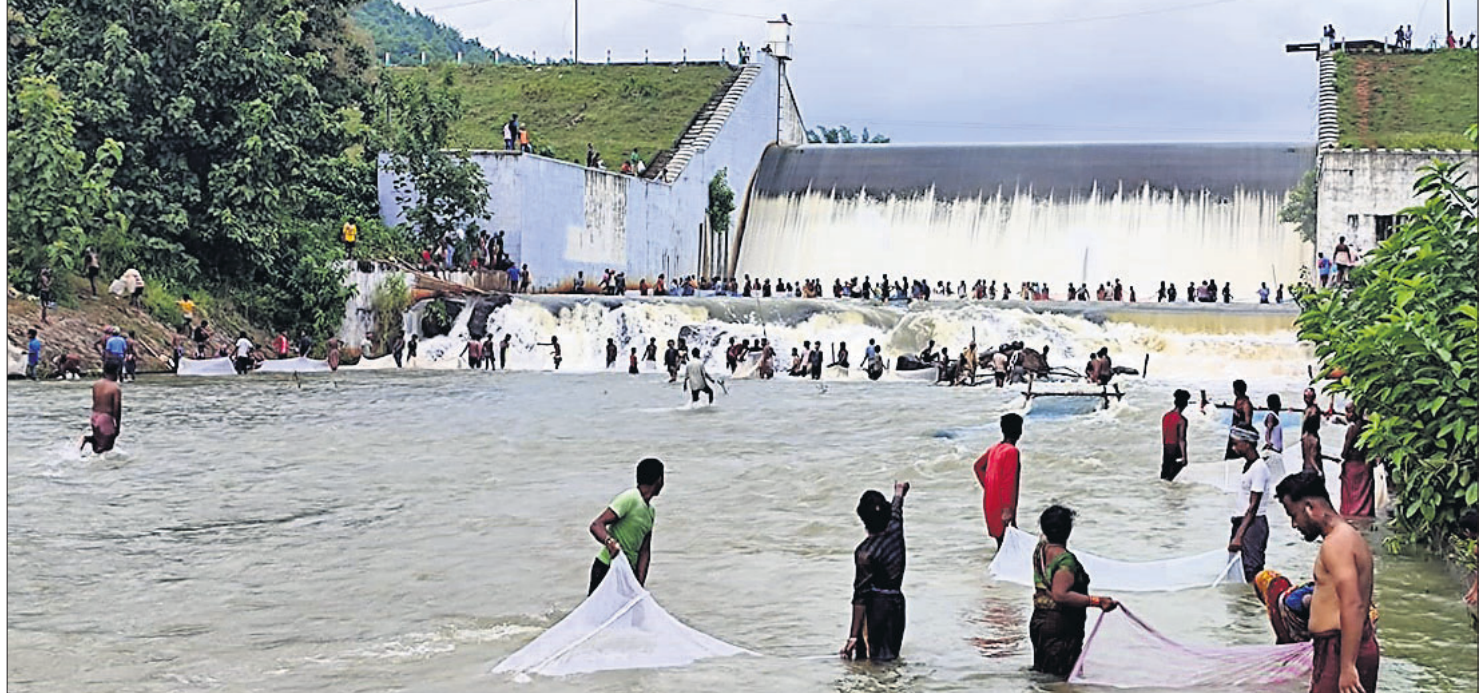
ଗଞ୍ଜାମ ଜିଲ୍ଲା ପୋଲିସରାଠାରୁ ପ୍ରାୟ ୧୨ କି.ମି. ଦୂର ଧନେଇ ଜଳଭଣ୍ଡାର ଶିଳ୍ପ କ୍ଷେତ୍ର ନିକଟରେ ବିପଜ୍ଜନକ ଅବସ୍ଥାରେ ଶତାଧିକ ଲୋକ ଗୁରୁବାର ମାଛ ଧରୁଛନ୍ତି।

ସେଥିରୁ ଦୂରରେ ରହିଥିଲେ। ତେଣୁ ଏହାର ଉପଯୁକ୍ତ ଭାବେ ନିରାପେକ୍ଷ ତଦନ୍ତ କରିବାକୁ ସେ ସିପିସିବିକୁ ଅନୁରୋଧ କରିଥିଲେ। ଏହି ଅଭିଯୋଗକୁ ରେଜିଷ୍ଟ୍ରିଭୁକ୍ତ କରାଯାଇ ସିପିସିବିର ଡିପ୍ୟୁ-ପିଆର୍-ଡିଭିଜନ ପକ୍ଷରୁ ଏମ୍.କେ. ଚୌଧୁରୀ ତାଙ୍କ ପତ୍ରସଂଖ୍ୟା ସିପି/ପିଆର୍/ପିଡି/୨୦୨୧-୨୨/୧୩।୭।୨୦୨୧ରେ ଏସ୍ପିସିବିର ସଦସ୍ୟ ସଚିବଙ୍କୁ ଉକ୍ତ ମାମଲା ସଂଗ୍ରହରେ କବାଟ ଚଳାଏ କରିଥିଲେ। ତେବେ ସିପିସିବିର ଏହି କବାଟ ଚଳାଏ ଏସ୍ପିସିବି କର୍ତ୍ତୃପକ୍ଷକୁ କୌଣସି ପ୍ରତାପ ପକାଇ ନ ଥିଲା। ଦୀର୍ଘ ୨ମାସ ଅତିକ୍ରମ ହୋଇଯାଉଥିଲେ ହେଁ ସିପିସିବିର ପତ୍ର ଅନୁସାରେ କୌଣସି ଉତ୍ତର ଏଯାବତ୍ ମିଳିନାହିଁ ବୋଲି ଅଭିଯୋଗକାରୀ ସିଂ ଅଭିଯୋଗ କରିଥିଲେ। ଏଥିରୁ କେବଳ ରାଜ୍ୟ ସୁପ୍ରିମ, କେନ୍ଦ୍ରସ୍ତରୀୟ ପ୍ରଶାସନିକ