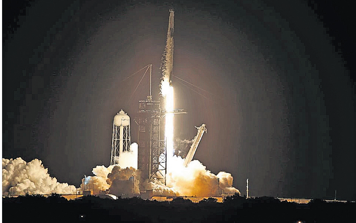
ଆମେରିକାର ପ୍ୟୋରିଡା ସ୍ଥିତ କେନେଡି ସ୍ପେସ୍ ସେଣ୍ଟରରୁ ମିଶନରେ ବାହାରିଛି ସ୍ପେସ୍‌ଏକ୍ସ ମହାକାଶ ଯାନ ।

ନୂଆଦିଲ୍ଲୀ, ୧୬/୧୧: ଏକ ମନି ଲଣ୍ଡର୍ ତରଫରୁ ସହ ସମ୍ପୃକ୍ତ ଅଭିଯୋଗରେ ପ୍ରବର୍ତ୍ତନ ନିର୍ଦ୍ଦେଶାଳୟ (ଇଡି) ଗୁରୁବାର ମାନବାଧିକାର କର୍ମୀ ତଥା ଅବସରପ୍ରାପ୍ତ ଆଇଏଏସ୍ ଅର୍ପିଏଚ୍ ହର୍ଷ ମନରଙ୍କ ଘରେ ଚଢ଼ାଉ କରିଛି । ମନରଙ୍କ ବାସଭବନ, ଦକ୍ଷିଣ ଦିଲ୍ଲୀରେ ଥିବା ଏହି ଏକକିଏ କାର୍ଯ୍ୟାଳୟ ଉପରେ ଏକସଙ୍ଘେ ଚଢ଼ାଉ କରାଯାଇଛି । ସେ ସମ୍ପୃକ୍ତ ଥିବା ଭୁକ୍ତି ଏକକିଏର ଅର୍ଥ କାରବାର ଓ ବ୍ୟାଙ୍କ କାରଗତପତ୍ତ ନେଇ ଇଡି ଟିଏମ୍ ଖୋଜତାଡ଼ କରିଥିଲା । ଚଢ଼ାଉର କିଛି ସମୟ ପୂର୍ବରୁ ଗୁରୁବାର ସକାଳେ ମନର ଓ ତାଙ୍କ ସ୍ତ୍ରୀ ଜର୍ମିନା ପଳାଇଛନ୍ତି । ଦିଲ୍ଲୀ ପୋଲିସର ଆର୍ଡିଏ ଅପରାଧ ଶାଖା (ଇଡିଏସ୍)ର ଫେଡ଼ରାଲ ମାସର ଏଡିଆ ଥିଆରେ ଭୁକ୍ତି ଏକକିଏ ଚଳାଉଥିବା ସେକ୍ସ ଫର୍ ଇଲୁସିଭ୍ ଷ୍ଟିକ୍ (ସିଏସ୍‌ଇ) ବିରୋଧରେ ଇଡି ମାମଲା ଗଠୁ କରିଥିଲା । ମନର ଉକ୍ତ ସଂସ୍ଥା ନିର୍ଦ୍ଦେଶକ ଅଛନ୍ତି । ତେବେ ଇଡି ଚଢ଼ାଉକୁ ଅନେକ କର୍ମୀ ଓ ବୁକ୍ତିକାରୀ ନିନ୍ଦା କରିଛନ୍ତି । ସମାଲୋଚକମାନଙ୍କ ମୁହଁ ବନ୍ଦ କରିବା ଲାଗି ଏହା ଏକ ଚଢ଼ାଉ ବୋଲି ସେମାନେ କହିଛନ୍ତି । ସାମାଜିକ କର୍ମୀ ଅନୁଶା ରାୟ, ପୂର୍ବତନ ଯୋଜନା କମିଶନ ସଦସ୍ୟ ସୟେଦ୍ ହମିଦ୍ ପ୍ରମୁଖ ୨୯ ଜଣଙ୍କ ସ୍ଵାକ୍ଷରରେ ମିଳିତ ବିକୃତି ପ୍ରକାଶ ପାଇଛି ।