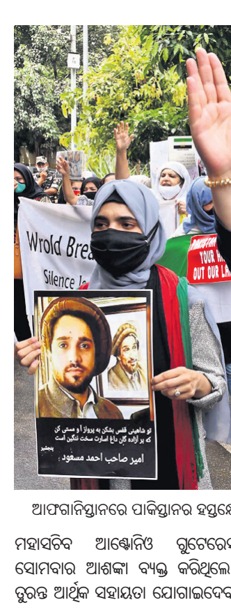
ଆଫଗାନିସ୍ତାନରେ ପାକିସ୍ତାନର ହସ୍ତକ୍ଷେପ ବୃଦ୍ଧି ପ୍ରତିବାଦରେ ନୂଆଦିଲ୍ଲୀରେ ଆଫଗାନ ଶରଣାର୍ଥୀମାନେ ଗୁରୁବାର ବିକ୍ଷୋଭ କରୁଛନ୍ତି ।

କାବୁଲ, ୧୬/୧୧ (ଆଇଏସଏନଏସ୍): ଆଫଗାନିସ୍ତାନରେ ସଂଘର୍ଷ ଯୋଗୁ ଚଳିତ ବର୍ଷ ସେପ୍ଟେମ୍ବର ୧୨ ପୁଞ୍ଜା ୬,୩୪,୦୦୦ରୁ ଊର୍ଦ୍ଧ୍ଵ ନାଗରିକ ବିସ୍ଫାପିତ ହେଲେଣି । କାଚିଂସର ମାନବୀୟ ସହଯୋଗ ବ୍ୟାପାର କାର୍ଯ୍ୟାଳୟ (ଏସିଏସଏସଏ) ପକ୍ଷରୁ ଏହି ସୂଚନା ଦିଆଯାଇଛି । ମୋଟ ବିସ୍ଫାପିତଙ୍କ ମଧ୍ୟରୁ ୨,୮୨,୨୪୬ ଜଣଙ୍କୁ ସହାୟତା ମିଳିଥିବା ମଧ୍ୟଭାଗରେ ତାଲିବାନ ଆଫଗାନିସ୍ତାନକୁ ଦଖଲ କରିବା ପରେ ସେଠାର ସୁରକ୍ଷା ସ୍ଥିତି ସ୍ଥିର ରହିଛି । ତେବେ ଘରଘାରି ଛାଡ଼ି ପଳାଇଯାଇଥିବା ପରିବାରକୁ ଚିକିତ୍ସା ଦେବା ପାଇଁ ଆଫଗାନ ଅଧିକାରୀ ଏବଂ ମାନବୀୟ ସଂଗ୍ରହକର୍ତ୍ତା ପ୍ରକଳ୍ପ କରିଛନ୍ତି । ସ୍ଵାସ୍ଥ୍ୟସେବା ଓ ଶିକ୍ଷା ସୁବିଧା ନ ପାଇଁ ମହିଳା ଓ ଶିଶୁମାନେ ସର୍ବୁ ଅଧିକ ପ୍ରଭାବିତ ହୋଇଛନ୍ତି । ଏହା ବ୍ୟତୀତ ପ୍ରାକୃତିକ ବିପର୍ଯ୍ୟୟ ଯୋଗୁ ଦେଶର ୨୮,୦୦୦ରୁ ଅଧିକ ଲୋକ ପ୍ରଭାବିତ ହୋଇଥିବା ଏସିଏସଏ ରିପୋର୍ଟରେ କୁହାଯାଇଛି । ଆଫଗାନିସ୍ତାନ ଅର୍ଥବ୍ୟବସ୍ଥା ସମ୍ପୂର୍ଣ୍ଣ ଭୁଗ୍ରାସିକରେ ବୋଲି କାଚିଂସ