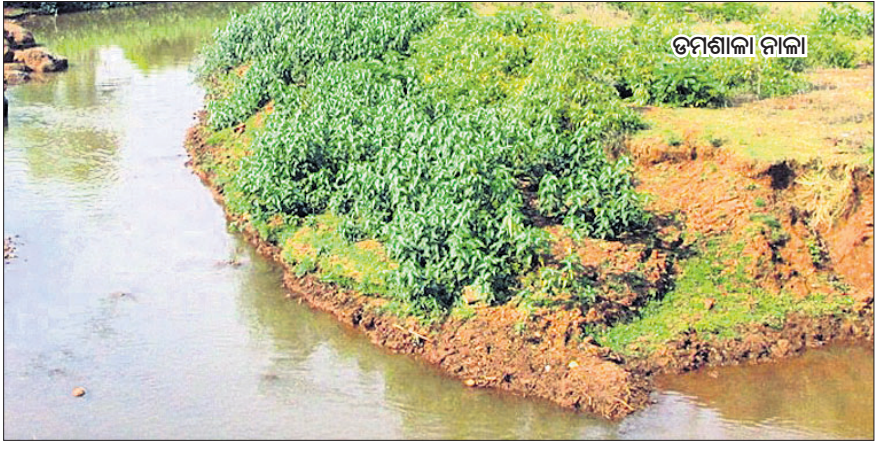
ତମଶାଳା ନାଳାରେ ବର୍ଜ୍ୟଜଳ ଛାଡ଼ିବା ମାମଲା ଲୁଗାଛପା ତଦନ୍ତକୁ ନେଇ ସନ୍ଦେହ

ଯାଜପୁର ଅଫିସ, ୧୬/୯ ବେଦାନ୍ତ ଫାକର ଓସ୍ତପାଳ କ୍ରୋମାଲଟ ଖଣିରୁ ପ୍ରାୟ ୧୫ ଲକ୍ଷ ଘନମିଟର ବର୍ଜ୍ୟଜଳ ତମଶାଳା ନାଳାକୁ ବିନା ଟ୍ରିଟମେଣ୍ଟରେ ଛାଡ଼ିବା ମାମଲାରେ ସିପିସିବି(ସେଣ୍ଟ୍ରାଲ ପଲ୍ୟୁଶନ କଣ୍ଟ୍ରୋଲ ବୋର୍ଡ) ତଦନ୍ତ ଆରମ୍ଭ କରିଛି।