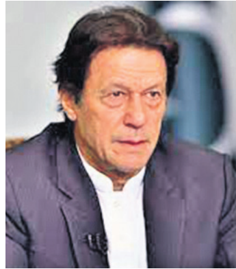
କଟାକ୍ଷ କଲେ ଇସ୍ତାନ୍ ଖାନ୍