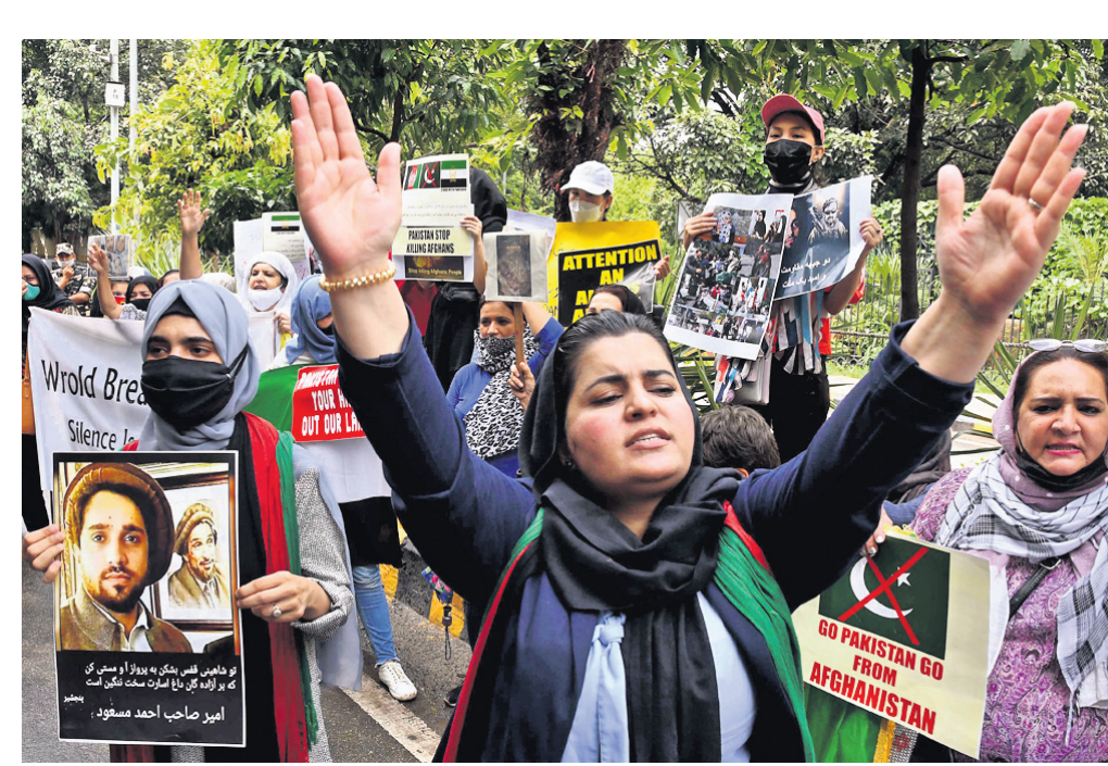
ଆଫଗାନିସ୍ତାନରେ ପାକିସ୍ତାନୀୟ ସମ୍ପ୍ରଦେଶ ପୂର୍ଣ୍ଣ ପ୍ରତିବାଦରେ ନୂଆଦିଲ୍ଲୀରେ ଆଫଗାନ ଶରଣାର୍ଥୀମାନେ ଗୁରୁବାର ବିକ୍ଷୋଭ କରୁଛନ୍ତି ।

କାବୁଲ, ୧୬/୯ (ଆଇଏଏନଏସ୍): ଆଫଗାନିସ୍ତାନରେ ସଂଘର୍ଷ ଯୋଗୁ ଚଳିତ ବର୍ଷ ସେପ୍ଟେମ୍ବର ୧୨ ସୁଦ୍ଧା ୨,୩୪,୦୦୦ରୁ ଊର୍ଦ୍ଧ୍ଵ ନାଗରିକ ବିସ୍ଫାପିତ ହେଲେଣି । କାଚିଂସର ମାନବୀୟ ସହଯୋଗ ବ୍ୟାପାର କାର୍ଯ୍ୟାଳୟ (ଏସିଏଏସ୍) ପକ୍ଷରୁ ଏହି ସୂଚନା ଦିଆଯାଇଛି । ମୋଟ ବିସ୍ଫାପିତଙ୍କ ମଧ୍ୟରୁ ୨,୮୨,୨୪୫ ଜଣଙ୍କୁ ସହାୟତା ମିଳିଥିବା ମଧ୍ୟଭାଗରେ ତାଲିବାନ ଆଫଗାନିସ୍ତାନକୁ ବନ୍ଦୀ କରିବା ପରେ ସେଠାର ସୁରକ୍ଷା ସ୍ଥିତି ସ୍ଥିର ରହିଛି । ତେବେ ଘରଘାରି ଛାଡ଼ି ପଳାଇଯାଇଥିବା ପରିବାରଗୁଡ଼ିକର ଦୁରବସ୍ଥାକୁ ନେଇ ଆଫଗାନ ଅଧିକାରୀ ଏବଂ ମାନବୀୟ ସଂଗ୍ରହକର୍ତ୍ତା ପ୍ରକଳ୍ପ କରିଛନ୍ତି । ସାମ୍ବନ୍ଧସେବା ଓ ଶିକ୍ଷା ସୁବିଧା ନ ପାଇଁ ମହିଳା ଓ ଶିଶୁମାନେ ସବୁ ଅଧିକ ପ୍ରଭାବିତ ହୋଇଛନ୍ତି । ଏହା ବ୍ୟତୀତ ପ୍ରାକୃତିକ ବିପର୍ଯ୍ୟୟ ଯୋଗୁ ଦେଶର ୨୮,୦୦୦ରୁ ଅଧିକ ଲୋକ ପ୍ରଭାବିତ ହୋଇଥିବା ଏସିଏଏସ୍ ରିପୋର୍ଟରେ କୁହାଯାଇଛି । ଆଫଗାନିସ୍ତାନ ଅର୍ଥବ୍ୟବସ୍ଥା ସମ୍ପୂର୍ଣ୍ଣ ଭୁଗ୍ରାସିତ ହୋଇଛି ବୋଲି କାଚିଂସ