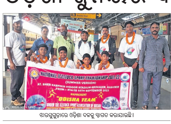
ଖାରସିଗୁଡ଼ାରେ ଓଡ଼ିଶା ଦଳକୁ ସ୍ୱାଗତ କରାଯାଇଛି।

ଜାତୀୟ ଆଇସସ୍କୋକ୍ ଚାମ୍ପିୟନଶିପ୍ ଭୁବନେଶ୍ୱର, ୧୬.୯.୨୧ (ଗ୍ରାହ୍ୟ ପ୍ରତିନିଧି) ଜଳ-କଣ୍ଠାରର ଶେର ଇ କଣ୍ଠାର ଇନ୍ଦ୍ରପାଣି ଷ୍ଟାଡ଼ିୟମରେ ଜାତୀୟ ଆଇସସ୍କୋକ୍ ଷ୍ଟୋର୍ଟ୍ସ ଚାମ୍ପିୟନଶିପ୍ ଅନୁଷ୍ଠିତ ହୋଇଯାଇଛି। ଏଥିରେ ଓଡ଼ିଶା ସିନିୟର ଦଳରେ ୪ ଓ ଜୁନିୟର ଦଳରେ ୪ ଜଣ ଖେଳାଳି ଭାଗ ନେଇଥିଲେ। ଓଡ଼ିଶା ଜୁନିୟର ଦଳ ଭଲ ପ୍ରଦର୍ଶନ କରି ତିନି ଚାମ୍ପିୟନ ଇଭେଣ୍ଟରେ