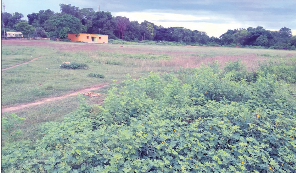
ଅନାବନା ଗଛଭାଗରେ ପରିପୂର୍ଣ୍ଣ ପଲଟନ ପଡ଼ିଆ ।

ଗ୍ରାମାଞ୍ଚଳରେ କ୍ରୀଡ଼ାର ବିକାଶ ପାଇଁ ୨୦୧୬ ଡିସେମ୍ବର ୧୩ରେ ନୟାଗଡ଼ ଜିଲ୍ଲା ଖଣ୍ଡପଡ଼ା ବ୍ଲକ୍ କର୍ମିନେତା ପଞ୍ଚାୟତ ଅଧୀନ ପଲଟନ ପଡ଼ିଆକୁ ମୁଖ୍ୟମନ୍ତ୍ରୀ ନବୀନ ପଟ୍ଟନାୟକ ଏକ ମିନିଷ୍ଟ୍ରିୟମରେ ପରିଣତ କରିବା ପାଇଁ ଭିତ୍ତିପ୍ରସ୍ତର ସ୍ଥାପନ କରିଥିଲେ । ଇତିମଧ୍ୟରେ ୫ବର୍ଷ ବିତିଛି । ମିନି ଷ୍ଟାଡ଼ିୟମ ତ ଦୂରର କଥା ସେହି ପଡ଼ିଆର ଆବଶ୍ୟକ ବିକାଶ ହୋଇପାରିନାହିଁ । ସରକାରଙ୍କ ପକ୍ଷରୁ ମିଳିଥିବା ୨୫ ଲକ୍ଷ ଟଙ୍କାର ଅନୁଦାନରେ ଉକ୍ତ ପଡ଼ିଆର ଉନ୍ନତିକରଣ କାର୍ଯ୍ୟାଳୟ ହୋଇଛି । ସେହି ଟଙ୍କାରେ ଉକ୍ତ ପଡ଼ିଆରେ ଏକ ଗୃହ ନିର୍ମାଣ ସହିତ ପ୍ରବେଶ ଚୋରଣ(ଗେଟ) ଓ ଦକ୍ଷିଣ ପାର୍ଶ୍ୱର ୩୨୦ ଫୁଟ ସ୍ଥୂଳାର ପ୍ରାଚୀର ମଧ୍ୟରୁ ମାତ୍ର ୧୬୦ ଫୁଟ ନିର୍ମାଣ କାର୍ଯ୍ୟ ସମ୍ପନ୍ନ ହୋଇଛି । ଅନ୍ୟ ୩ ପାର୍ଶ୍ୱ ପ୍ରାଚୀର (ପ୍ରାୟ ୪୮୦ ଫୁଟ ଲମ୍ବ) ସହ ଅବଶିଷ୍ଟ ଦକ୍ଷିଣ ପାର୍ଶ୍ୱ ୧୬୦ ଫୁଟ ଲମ୍ବର ପ୍ରାଚୀର ନ ଥିବାରୁ ପଡ଼ିଆର ସ୍ଥୂଳାର ବିପର୍ଯ୍ୟୟ ହୋଇଛି ।