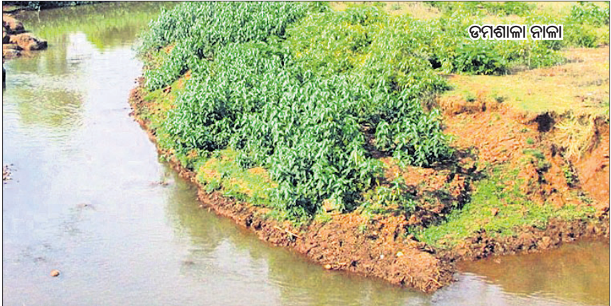
ତମଶାଳା ନାଳାରେ ବର୍ଜ୍ୟଜଳ ଛାଡ଼ିବା ମାମଲା ଲୁଗାଛପା ତଦନ୍ତକୁ ନେଇ ସନ୍ଦେହ

ଯାଜପୁର ଅଫିସ, ୧୬/୯ ବେଦାନ୍ତ ଫାକର ଓପ୍ରପାଳ କ୍ରୋମାଲଟ ଖଣିରୁ ପ୍ରାୟ ୧୫ ଲକ୍ଷ ଘନମିଟର ବର୍ଜ୍ୟଜଳ ତମଶାଳା ନାଳାକୁ ବିନା ଟ୍ରିଟମେଣ୍ଟରେ ଛାଡ଼ିବା ମାମଲାରେ ସିପିସିବି(ସେଣ୍ଟ୍ରାଲ ପଲ୍ୟୁଶନ କଣ୍ଟ୍ରୋଲ ବୋର୍ଡ) ତଦନ୍ତ ଆରମ୍ଭ କରିଛି।