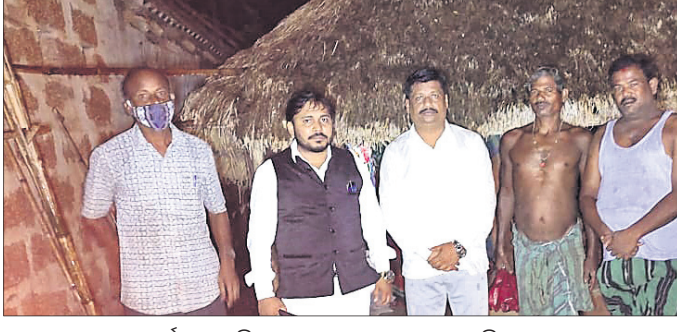
କଂଗ୍ରେସ ନେତା ଓ କର୍ମୀମାନେ ବିପଦକୁ ସହ ଆଲୋଚନା କରୁଛନ୍ତି ।

ଲଗାଗଣ ବର୍ଷା ନୟାଗଡ଼ ବ୍ଲକ୍‌ରେ ବ୍ୟାପକ କ୍ଷୟକ୍ଷତି କରିଛି । ଏହାର ପ୍ରଭାବରେ ବହୁ ଲୋକଙ୍କ ଘର ଭାଙ୍ଗିବା ସହ କାଢ଼ି ଭାଙ୍ଗି ଯାଇଛି । ଭଙ୍ଗା ଘର ଓ କାଢ଼ିର ଚପଟ ପାଇଁ କାହାରି ଦେଖାନାହିଁ ବୋଲି କଂଗ୍ରେସ ଅଭିଯୋଗ କରିଛି । ଗୁରୁବାର ଜିଲ୍ଲା କଂଗ୍ରେସ ସଭାପତି ବିଭାଗ ପକ୍ଷରୁ ଚପଟ କରାଯାଇନାହିଁ । ଏଭଳିସ୍ଥିତି ପୂର୍ଣ୍ଣ ଏକ ଲକ୍ଷରୁ ଅଧିକ ଚିତ୍ତାନ୍ତ କାରଣ ପାଲଟିଛି । ପ୍ରଶାସନିକ ଅଧିକାରୀମାନେ ତୁରନ୍ତ ବିପଦ ଚାଷୀଙ୍କୁ ଶିଖେଇ ଗାଁ ଭୁଲି ଘର ଭାଙ୍ଗି ଯାଇଥିବା ବିପଦକୁ ଭେଟି ସେମାନଙ୍କ ଚିତ୍ତସଂହାରଣ କରିଥିଲେ ।