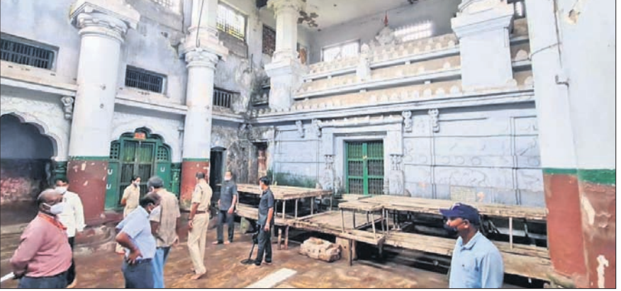
ରାଜ୍ୟ ପ୍ରଦତ୍ତ ବିଭାଗ ପକ୍ଷରୁ ଯାଞ୍ଚ କରାଯାଇଛି।

ପୁରୀ ଅଫିସ, ୧୬/୯ ବନ୍ଧୁଚର୍ଚ୍ଚିତ ଏମାର ମଠରେ ଗୁପ୍ତଧନ (ବିଭିନ୍ନ ମୂଲ୍ୟବାନ ସମ୍ପତ୍ତି) ଓ ରୁପାପତ୍ର ଥିବା ସନ୍ଧାନରେ ପୁଣି ଯାଞ୍ଚ ଆରମ୍ଭ ହୋଇଛି। ଗୁରୁବାର ଏମାର ମଠର ପାଠଶାଳା, ବାଟ ଅଗଣା, ଡିପ୍ଟକ, ଗାଦିଘର ସମେତ ଅନେକ ଗୁପ୍ତ କୋଠିକୁ ମେଟାଲ ଡିଟେକ୍ଟର ଦ୍ୱାରା ରାଜ୍ୟ ପ୍ରଦତ୍ତ ବିଭାଗ ପକ୍ଷରୁ ଟକ୍ସିଆ ହୋଇଛି।