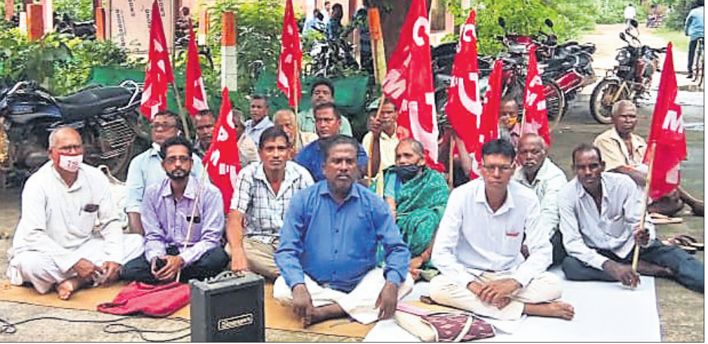
ସିପିଏମ୍ ନେତା ଓ କର୍ମୀମାନେ ଧାରଣା ଦେଇଛନ୍ତି ।

କଲେ ନାହିଁ କାହିଁକି ବୋଲି ପ୍ରଶ୍ନ ଉଠିଛି । ସେ ଗଣିଆ ସ୍ୱାସ୍ଥ୍ୟକେନ୍ଦ୍ର ଛାଡ଼ି ଅଟୋରିକ୍ଟରେ ସ୍ୱାମୀ ଫେରାର ହେବା ଘଟଣା ବିବାଦ ସୃଷ୍ଟି କରିଛି । ସ୍ୱାମୀ ଘରକୁ ଫେରି ପ୍ରକୃତ ସତ୍ୟ ପ୍ରଶାସନ ନିକଟରେ କହି ଦୋଷପୂର୍ଣ୍ଣ ହେବା ଦରକାର । ପୋଲିସ୍ ଉପରୋକ୍ତ ଦିଗକୁ ତଦନ୍ତ ପରିସର ଭୁକ୍ତ କରିବା ଦରକାର ବୋଲି ସାଧାରଣରେ ମତ ପ୍ରକାଶ ପାଇଛି । ଅନ୍ୟପକ୍ଷେ ଯଦି ଗର୍ଭପାତ ଲକ୍ଷଣ ଦେଖାଗଲା ତେବେ ସମ୍ପୂର୍ଣ୍ଣ ମହିଳା ନିକଟସ୍ଥ ଗଣିଆ ସ୍ୱାସ୍ଥ୍ୟକେନ୍ଦ୍ରକୁ ଯାଇପାରି ଥାଆନ୍ତେ । ଆଶା କର୍ମୀଙ୍କୁ ଏ ସଂକ୍ରାନ୍ତରେ ଜଣାଇବା ଦରକାର ଥିଲା, ହେଲେ ସେ ସେପରି