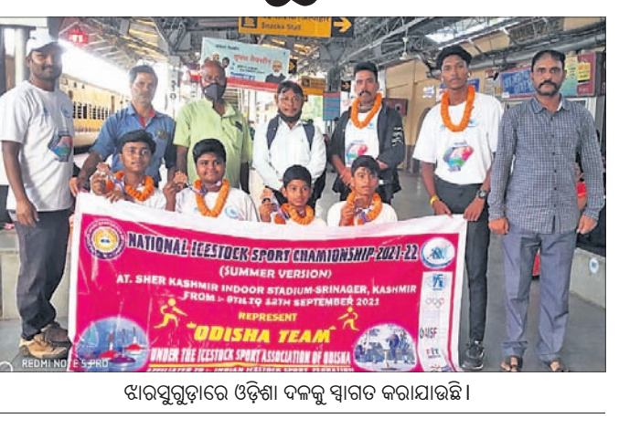
ଖାରସୁଗୁଡ଼ାରେ ଓଡ଼ିଶା ଦଳକୁ ସ୍ୱାଗତ କରାଯାଇଛି।