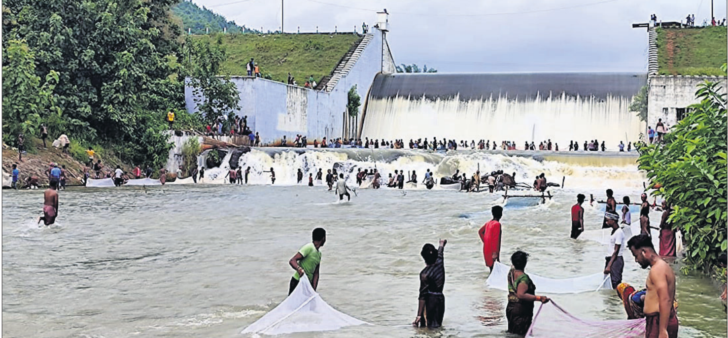
ଗଞ୍ଜାମ ଜିଲ୍ଲା ପୋଲସରଠାରୁ ପ୍ରାୟ ୧୨ କି.ମି. ଦୂର ଧନେଇ ଜଳଭଣ୍ଡାର ଶିଳ୍ପ କ୍ଷେତ୍ର ନିକଟରେ ବିପଜ୍ଜନକ ଅବସ୍ଥାରେ ଶତାଧିକ ଲୋକ ଗୁରୁବାର ମାଛ ଧରୁଛନ୍ତି।