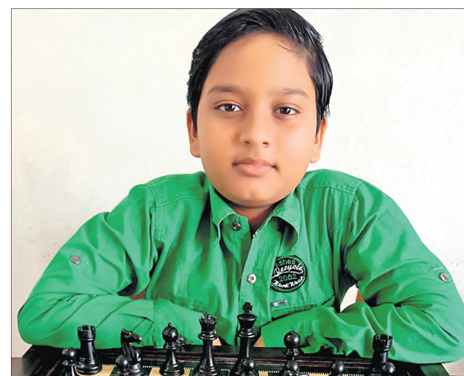
ଭୁବନେଶ୍ୱର, ୧୬.୯.୨୧(ଗ୍ରାହ୍ୟ ପ୍ରତିନିଧି):