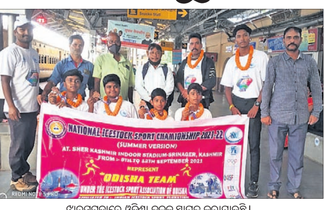
ଖାରସୁଗୁଡ଼ାରେ ଓଡ଼ିଶା ଦଳକୁ ସ୍ୱାଗତ କରାଯାଇଛି।