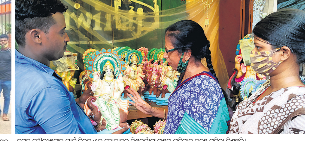
କଟକ ଗୌରୀଶଙ୍କର ପାର୍କ ନିକଟ ଏକ ଦୋକାନରୁ ବିକ୍ଷକର୍ମୀଙ୍କ ମୁଣ୍ଡପତ୍ରମାନଙ୍କୁ ଜଣେ ମହିଳା କିଣୁଛନ୍ତି।