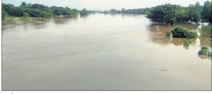
ଭାର୍ଗବୀ ନଦୀରେ ପ୍ରବାହିତ ହେଉଥିବା ବନ୍ୟା ଜଳ ।