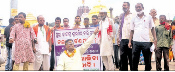
ଶ୍ରୀମନ୍ଦିର ସିଂହଦ୍ୱାର ସମ୍ମୁଖରେ ଶ୍ରୀକରନାଥ ସେବା ପକ୍ଷରୁ ଯାତ୍ରା ଦିଆଯାଇଛି ।

ଶ୍ରୀମନ୍ଦିର ସିଂହଦ୍ୱାର ସମ୍ମୁଖରେ ଶ୍ରୀକରନାଥ ସେବା ପକ୍ଷରୁ ଯାତ୍ରା ଦିଆଯାଇଛି । ଶ୍ରୀମନ୍ଦିରରେ ସାଧାରଣ ଦର୍ଶନ ଓ ମହାପ୍ରସାଦ ସେବନ ସ୍ୱାଭାବିକ ହୋଇଥିଲେ ମଧ୍ୟ ଶ୍ରୀକୃଷ୍ଣଙ୍କ ପ୍ରବେଶକୁ ନେଇ ବିବାଦ ଦେଖାଦେଇଛି। ପୁରୀ ସହରବାସୀଙ୍କୁ ଚାରିଦ୍ୱାରରେ ପ୍ରବେଶ ଓ ପ୍ରସ୍ଥାନ ଅନୁମତି ଦେବା ପାଇଁ ସହରବାସୀ ବନ୍ଧୁଗଣଙ୍କର ଦାବି କରିଛନ୍ତି। ଏହି ଦାବି ନେଇ ଶ୍ରୀକରନାଥ ସେବା, ପୁରୀ ଜିଲ୍ଲା ଯୁବ ଅଧିକାରୀ ସଂସଦ ଏବଂ ଜିଲ୍ଲା ଭୁଞ୍ଜନ ସଙ୍ଘଠନ ଗୁରୁବାର ଶ୍ରୀମନ୍ଦିର ସିଂହଦ୍ୱାର ସମ୍ମୁଖରେ ପୂଥକ ପୂଥକ ଭାବେ ଆନ୍ଦୋଳନ କରିଛନ୍ତି। ଏହି ସଙ୍ଘଠନଗୁଡ଼ିକର କର୍ମକ୍ରମମାନେ ଯୁକ୍ତି ବାଞ୍ଛିଛନ୍ତି ଯେ, ଶ୍ରୀକ୍ଷେତ୍ରବାସୀଙ୍କର ଦିନତମାମ୍ ଶ୍ରୀମନ୍ଦିରରେ ବିଭିନ୍ନ କାର୍ଯ୍ୟ ରହିଥାଏ। କିଏ ମହାପ୍ରସାଦ ପାଇଁ ତ ଆଉ କେହି ମହାପ୍ରଭୁଙ୍କ ଉଦ୍ଦେଶ୍ୟରେ ବୁଲୁଥିବା ଓ ପୁଲ ଅର୍ପଣ ପାଇଁ ଶ୍ରୀମନ୍ଦିରକୁ ଯାଇଥାନ୍ତି। ସବୁଦିନିଆ ଦର୍ଶନାର୍ଥୀମାନେ ଆଳତି, ବଡ଼ସିଂହାର ବେଶ ପ୍ରକୃତି ଦର୍ଶନ କରିଥାନ୍ତି। ପୁରୀର ବରିଷ୍ଠ ନାଗରିକମାନେ ପ୍ରତ୍ୟହ ବଡ଼ଦେଉଳ ଦର୍ଶନ ପାଇଁ ଲଢ଼ୁକ ଥିଲେ ମଧ୍ୟ ପ୍ରଶାସନର କଟକଣା ଏଥିରେ ବାଧକ ସାଜିଛି।