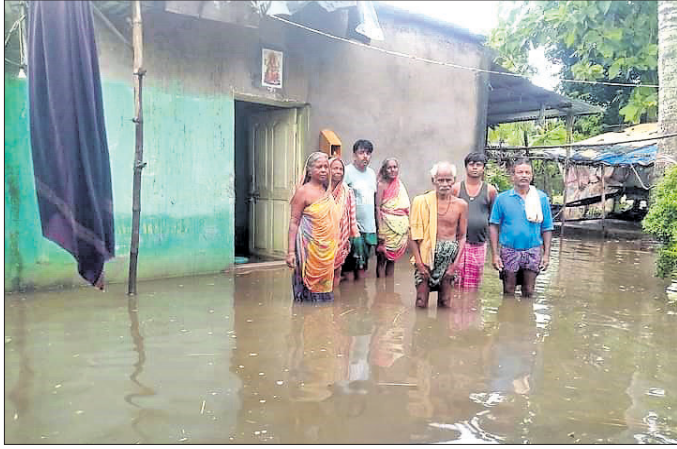
କଟକରେ ରହିଥିବା ଗ୍ରାମବାସୀ।

ଲଘୁତାପକନିତ ଲଗାଣବର୍ଷାରେ କଟକ ଜିଲ୍ଲା ନିର୍ଦ୍ଦିଷ୍ଟକୋଲ ବ୍ଲକରେ ବ୍ୟାପକ କ୍ଷୟକ୍ଷତି ହୋଇଛି। ଖାଲୁଆ ଜାଗାରେ ପାଣି ପଶିବା ସହ ଏବେବି ଅନେକ ଚାଷ କମି ପାଣିରେ ବୁଡି ରହିଛି। ଡ୍ରେନେଜ ବ୍ୟବସ୍ଥା ନ ଥିବାରୁ ବର୍ଷା ଜଳ ନିଷ୍କାସିତ ହୋଇ ପାଉନାହିଁ। ପ୍ରଶାସନର ପ୍ରାଥମିକ ତଦତ୍ତ ଅନୁଯାୟୀ, ବ୍ଲକରେ ୩୮୫୦ ପରିବାର ଲଗାଣ ବର୍ଷାରେ ପ୍ରଭାବିତ ହୋଇଥିବା ବେଳେ ୬୭୦୦ ହେକ୍ଟର ଧାନ କ୍ଷେତ ପାଣିରେ ବୁଡି ରହିଛି। ଅପରପକ୍ଷରେ ମହାନଦୀ, ଚିତ୍ରୋତ୍ପଳା ଓ ଲୁଣାନଦୀର ଜଳସ୍ତର ବୃଦ୍ଧିପାଇଥିବାରୁ ନଦୀପାଠରେ ଜଳସ୍ତର ବୃଦ୍ଧି ହୋଇଯାଇଛି। ଚାଷ ପ୍ରଶାସନ ଆକଳନ ଅନୁଯାୟୀ, ବ୍ଲକର ୧୩ ପଞ୍ଚାୟତର ୧୨ଗ୍ରାମରେ ଥିବା ୩୧ ଖାର୍ଡ ଏଥିରେ ପ୍ରଭାବିତ ହୋଇଛି। ବରାଦୋ ପଞ୍ଚାୟତର ୫ନଂ. ଖାର୍ଡ, ଜୟରାମପୁର,