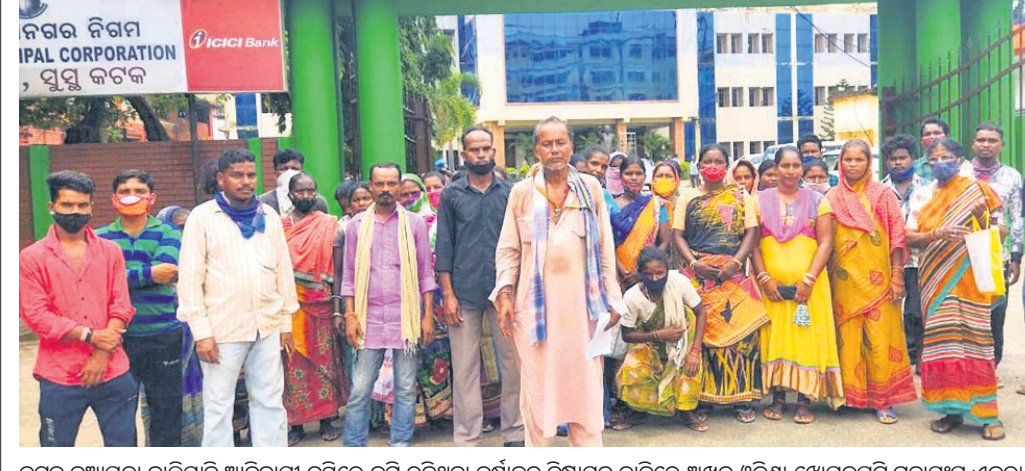
କଟକ ନୂଆପଡ଼ା ବାଲିସାହି ଆଦିବାସୀ ବସ୍ତିରେ ଜମି ରହିଥିବା ବର୍ଷାଜଳ ନିଷ୍କାସନ ଦାବିରେ ଅଖିଳ ଓଡ଼ିଶା ଷୋପଡ଼ପତି ମହାସଂଘ ଏକତୀକ୍ରମ ପକ୍ଷରୁ ଗୁରୁବାର କଟକ ମହାନଗର ନିଗମ କାର୍ଯ୍ୟାଳୟ ସମ୍ମୁଖରେ ବିକ୍ଷୋଭ ପ୍ରଦର୍ଶନ।