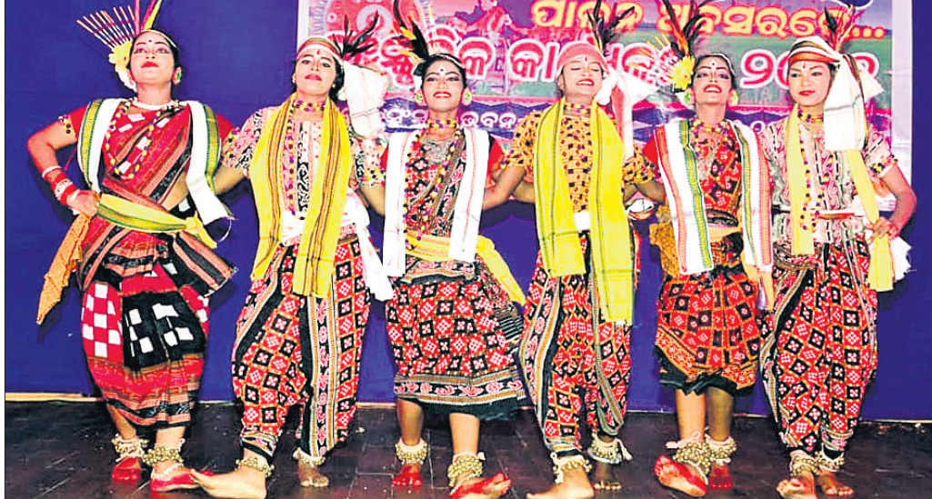
ପୁରୀ ଜିଲ୍ଲା ସଂସ୍କୃତି ପରିଷଦ ଆନୁକୂଲ୍ୟରେ ସଂସ୍କୃତି ଭବନରେ ନୂଆଁଖାଇ ଉତ୍ସବ ପାଳନ ଅବସରରେ କଳାକାରଙ୍କ ନୃତ୍ୟ ପରିବେଷଣ ।

ପତିଘର ଖଟଣେଇକୁ ବିଜେ କରାଯାଇ ଭୋଗ ଲାଗି ହୋଇଥିଲା। ମହାଭୋଇ ଘରର ବୋହୂମାନେ ଠାକୁରଙ୍କୁ ବନ୍ଦାପନା କରି କ୍ଷୀର, ସର, ଲବଣି ଖୁଆଇଥିଲେ। ସମସ୍ତ ନାଟି ସମ୍ପନ୍ନ ପରେ ମନ୍ଦିର ଠାକୁରାଣୀଙ୍କ ମନ୍ଦିର ନିକଟକୁ ଠାକୁର ବିଜେ କରିଥିଲେ। ସେଠାରେ ମଲ୍ଲ ଯୁଦ୍ଧ ନାଟି ପରେ ଠାକୁରମାନଙ୍କୁ ରାଜନୀତିର ସମ୍ମୁଖକୁ ନିଆଯାଇ କୁଡ଼ୁଳା ଉଦ୍ଧାରଣ ନାଟି ହୋଇଥିଲା। ପରେ ସିଂହଦ୍ୱାର ସମ୍ମୁଖ ବଡ଼ଛତା ମଠଠା ଆଗରେ କଂସବଧ ନାଟି ସମ୍ପନ୍ନ କରାଯାଇଥିଲା। ବାଲିସାହି ଆଖଡ଼ା ପକ୍ଷରୁ କଂସ ବଧ କୁଖେଳବେଷ୍ଟ ସାହି ଲବଣିଖୁଆ ଛକ ପତିଘରକୁ ନେଇଥିଲେ। ସେଠାରେ ଯାତ୍ରୀ ଯୋଗାଇ ଦେବାକୁ ଦାବି ହେଉଛି।