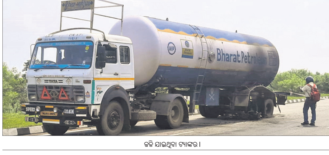
କଟି ଯାଉଥିବା ଟ୍ୟାଙ୍କର।

ବରା, ୧୭।୯(ଡି.ଏନ.ଏ.): ରାଜ୍ୟ ସରକାର ଲୋକଙ୍କ ପାଇଁ ଜନୁଆରୀ ମୁଖ୍ୟ ପର୍ଯ୍ୟଟନ ଯୋଜନା କରିଛନ୍ତି। କିନ୍ତୁ ଏହା ସତ୍ତ୍ୱେ ଏହି ଯୋଜନା ଅନେକ ସ୍ଥାନରେ ପହଞ୍ଚି ପାରୁନାହିଁ।