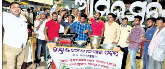
ସୋନପୁରରେ କଂଗ୍ରେସ ନେତୃତ୍ୱ ଓ ସମର୍ଥକ ପକ୍ଷରୁ ବିକ୍ରି କରି ପ୍ରତିବାଦ କରୁଛନ୍ତି ।