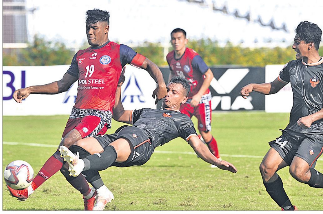
କୋଲକାତାରେ ଚାଲିଥିବା ଡୁରାଣ୍ଡ କପ୍ ପୂର୍ବରୁ ଚୁନାବଣରେ ଶୁକ୍ରବାର ଏହିପରି ଗୋଟା-ଜାମସେଦପୁର ଏହିପରି ମ୍ୟାଚ ଅନୁଷ୍ଠିତ ମ୍ୟାଚ।