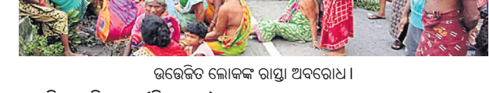
ଭବେଳିତ ଲୋକଙ୍କ ରାସ୍ତା ଅବରୋଧ।