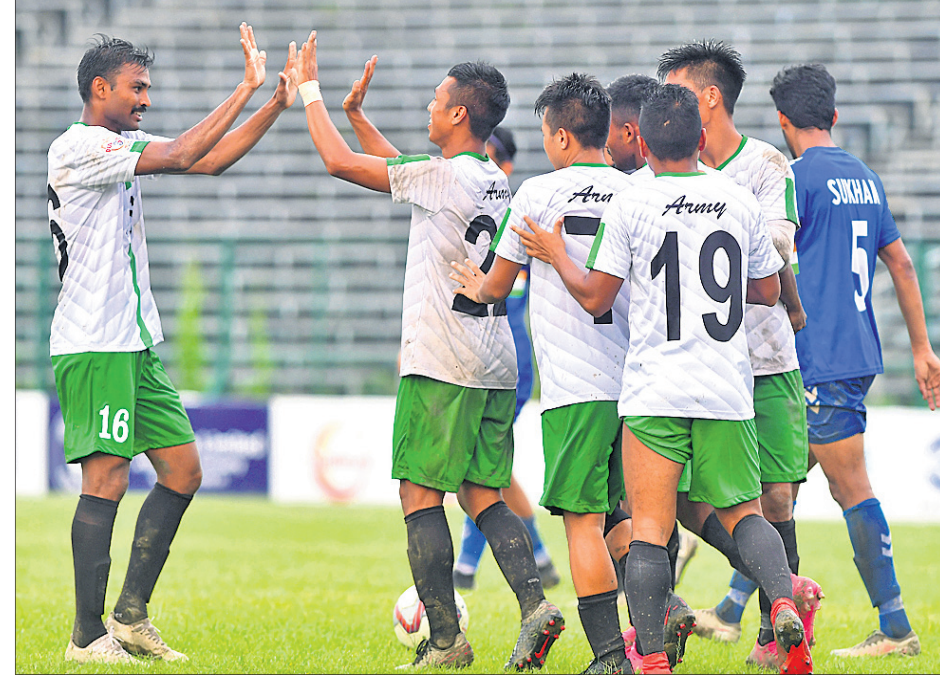
ସୁବେଦା ଦିଲ୍ଲୀ ଏହିପରି ପରାସ୍ତ ହେବାପରେ ଆର୍ମି ଗ୍ରାନ୍ ଦଳର ଖେଳାଳିମାନେ ଧୂସି ମନାଉଛନ୍ତି।