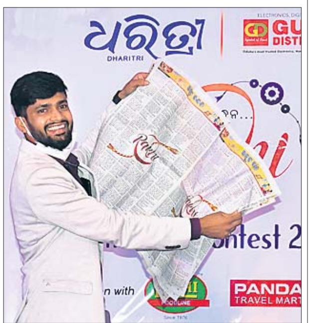
ଉତ୍ସବରେ ଜଣେ ପ୍ରତିଯୋଗୀ ଧରିତ୍ରୀରେ ପ୍ରକାଶିତ ତାଙ୍କ ବାର୍ତ୍ତାକୁ ଦେଖାଉଛନ୍ତି।