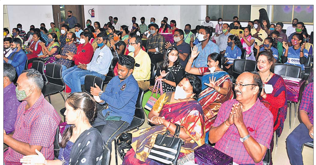
'ଅତୁଟ ବନ୍ଧନ' ବାର୍ତ୍ତା ପ୍ରତିଯୋଗିତାର ପୁରସ୍କାର ବିତରଣ ଉତ୍ସବରେ ଉପସ୍ଥିତ ବିଜେତା, ସେମାନଙ୍କ ସମ୍ପର୍କୀୟ ଓ ଧରିତ୍ରୀର ପାଠିକାପାଠକ।