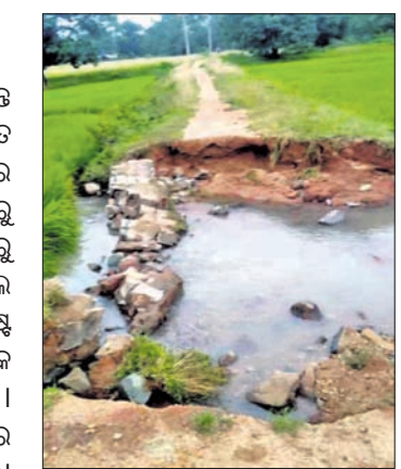
ବଣମହଲୁଡ଼ିଆରୁ ଦଲକୀ ସାହିକୁ ସଂଯୋଗ କରୁଥିବା କାଠ ପୋଲ ଭାବି ଯାଇଛି ।

କେନ୍ଦୁଝର ଜିଲ୍ଲା ପାଟଣା ବ୍ଲକ ଉପକଣ୍ଠ ଅଞ୍ଚଳ ଛୁମୁରିଆ ପଞ୍ଚାୟତ ଅନ୍ତର୍ଗତ ବଣ ମହଲୁଡ଼ିଆ ଗ୍ରାମର ଦଲକୀ ସାହିର ୪୨ପରିବାର ଏବେ ବାହ୍ୟ ଜଗତରୁ ବିଚ୍ଛିନ୍ନ ହୋଇଛି । ବଣମହଲୁଡ଼ିଆରୁ ଦଲକୀ ସାହିକୁ ସଂଯୋଗ କରୁଥିବା ବିଲ ମଧ୍ୟରେ ଦେଇ ଯାଇଥିବା ଫରେଷ୍ଟ ରାସ୍ତା ଉପରେ ବନ ବିଭାଗ ପକ୍ଷରୁ ଏକ କାଠ ପୋଲ ନିର୍ମାଣ କରାଯାଇଥିଲା । ଏହି ଅସୁବିଧା କାଠ ପୋଲଟି ଗୁରୁବାର ରାତି ଜଗାଣ ବର୍ଷାରେ ଭାବି ଯାଇଛି । ଫଳରେ ଏବେ ଦଲକୀ ସାହିକୁ ଯୋଗାଯୋଗ ସମ୍ପୂର୍ଣ୍ଣ ବିଚ୍ଛିନ୍ନ ହୋଇଛି ।