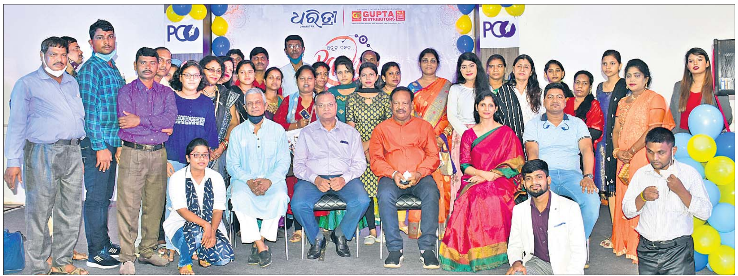
ଧରିତ୍ରୀ ପକ୍ଷରୁ ରକ୍ଷାବନ୍ଧନ ଉତ୍ସବ ଉପଲକ୍ଷେ କରାଯାଇଥିବା 'ଅତୁଟ ବନ୍ଧନ' ବାର୍ତ୍ତା ପ୍ରତିଯୋଗିତାର ଶନିବାର ଭୁବନେଶ୍ୱର ମାଷ୍ଟରକ୍ୟାଣ୍ଟିନସ୍ଥିତ 'ଦ ପ୍ରେସ୍ କ୍ଲବ୍ ଅଫ୍ ଓଡ଼ିଶା' ପରିସରରେ ଆୟୋଜିତ ପୁରସ୍କାର ବିତରଣ ଉତ୍ସବରେ ଅତିଥିଙ୍କ ଗହଣରେ ବିଜେତାମାନେ।