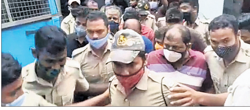
ବାଲେଶ୍ଵର ଜେଲ ପରିସରରୁ ୫ ଅଭିଯୁକ୍ତଙ୍କୁ ଜ୍ରାଜମତ୍ରାଞ୍ଚ କଟକ ପୁଞ୍ଜୀକାରକୁ ନିଆଯାଇଛି ।

ବାଲେଶ୍ଵର ରାଜପୁରପଲିକା ପ୍ରତିରକ୍ଷା ଗବେଷଣା ଏବଂ ବିକାଶ ସମାଠନ(ଡିଆରଡ଼ି)ର ରୁଦ୍ଧ ତଥ୍ୟ ଲିଫ୍ ମାମଲାରେ ଚିରଫ ହୋଇଥିବା ୫ ଅଭିଯୁକ୍ତଙ୍କୁ ଶନିବାର ଜ୍ରାଜମତ୍ରାଞ୍ଚ ଚଢ଼ିନିଆ ରିମାଷ୍ଟରେ ନେଇଛି ।