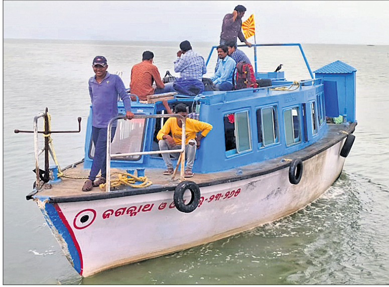
ଚିଲିକା ମଝିରେ ଅଚଳ ହୋଇପଡ଼ିଥିବା ଲକ୍ଷ ।

■ ଅଳ୍ପକେ ବର୍ତ୍ତିଲେ ୩୦ ଯାତ୍ରୀ ■ ୨ ଘଣ୍ଟା ପରେ ଉଦ୍ଧାର ହେଲେ