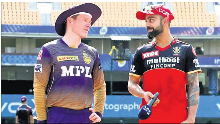
ନାଇଟ ରାଇଡର୍ସ ଅଧିନାୟକ ଇଅନ ମୋର୍ଗାନ ଓ ରୟାଲ ଚ୍ୟାଲେଞ୍ଜର୍ସ ଅଧିନାୟକ ବିରାଟ କୋହଲି

ସୁନାଲତେଡ ଆରବ ଏମିରେଟ୍ସ (ସୁଧଲ)ରେ ଇଣ୍ଡିଆନ ପ୍ରିମିୟର ଲିଗ୍ (ଆଇପିଏଲ୍)-୧୪ର ଦ୍ୱିତୀୟ ପର୍ଯ୍ୟାୟ ଉଦ୍‌ଘାଟନାରୁ ଆରମ୍ଭ ହୋଇଛି। ସୋମବାର ଲିଗ୍‌ର ୩୧ତମ ମୁକାବିଲାରେ ବିରାଟ କୋହଲିଙ୍କ ନେତୃତ୍ୱାଧୀନ ରୟାଲ ଚ୍ୟାଲେଞ୍ଜର୍ସ ବାଙ୍ଗାଲୋର ଓ ଇଅନ ମୋର୍ଗାନଙ୍କ କୋଲକାତା ନାଇଟ ରାଇଡର୍ସ ପରସ୍ପରକୁ ଭେଟିବେ। ପୂର୍ବରୁ ବୁଢ଼ପୁର ଆଇପିଏଲ୍ ଚାଲିଥିଲା ହାସଲ କରିଥିବା କୋଲକାତା ବିଜୟକୁ ଲିଗ୍‌ର ଦ୍ୱିତୀୟ ପର୍ଯ୍ୟାୟ ଆରମ୍ଭ କରିବା ଲକ୍ଷ୍ୟରେ ରହିଛି। ପ୍ରଥମ ପର୍ଯ୍ୟାୟରେ