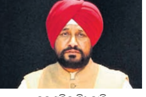
ଚରଣଜିତ୍ ସିଂ ଗାନ୍ଧି

ଚରଣଜିତ୍ ସିଂ ଚନ୍ ପଞ୍ଜାବର ୯୬ ମୁଖ୍ୟମନ୍ତ୍ରୀ ନିଯୁକ୍ତ ହୋଇଛନ୍ତି। ରବିବାର ପଞ୍ଜାବ କଂଗ୍ରେସ୍ ବିଧାୟକ ଦଳ (ସିଏଲ୍‌ସି) ଚୈତକ ସଭା ଚଳୁ ନେତା ନିର୍ବାଚନ କରାଯାଇଥିଲା। ଏହା ପରେ ସେ ରାଜ୍ୟପାଳ ବନଝରିଲାଲ୍ ପୁରୋହିତଙ୍କୁ ଭେଟି ସରକାର ଗଠନ ଲାଗି ବାଦି ଉପସ୍ଥାପନ କରିଛନ୍ତି। ସୋମବାର