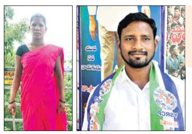
ନିର୍ବାଚିତ ହୋଇଥିବା ପ୍ରାର୍ଥୀ।

କୋରାପୁଟ/ପଟ୍ଟାଜୀ, (ସ.ପ୍ର./ଡି.ଏନ୍.ଏ.) ୧୯୮୯