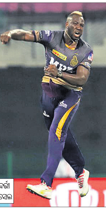
ଉଇକେଟ ନେବାରେ ସମ୍ପନ୍ନ ହୋଇଥିଲେ । ଆରସିବିର ୬୬ ସର୍ବନିମ୍ନ ସ୍କୋର