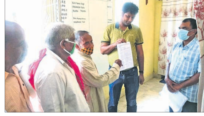
କମିଟି ପକ୍ଷରୁ କିଶୋରନଗର ବିତିଠକୁ ଦାବିପତ୍ର ପ୍ରଦାନ କରାଯାଇଛି।