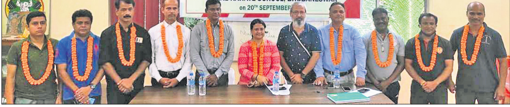
ଓଡ଼ିଶା ରାଜ୍ୟ କରାଟେ ସଂଘର ନବନିର୍ବାଚିତ କର୍ମକର୍ତ୍ତା ।

ନୂଆଦିଲ୍ଲୀ, ୨୦/୯ (ପି.ଟି.): ଛାତିରେ ସମସ୍ତା ଅନୁଭବ କରିବା ପରେ ପାରାଲିମ୍ପିକ୍ସ ଟ୍ରୋଫି ବିଜେତା ହାଇକମ୍ପର ଶରଦ କୁମାର ଅଲ୍ ଇଣ୍ଡିଆ ଲନସ୍ପୋର୍ଟ୍ସ୍ ଅଫ୍ ମେଡିକାଲ୍ ସାଇନ୍ସ (ଏମସି)ରେ ଭର୍ତ୍ତି ହୋଇଛନ୍ତି । କିଛି ସେ ବର୍ତ୍ତମାନ ସୁଦ୍ଧା ଅନୁଭବ କରୁଛନ୍ତି । ଅଗଷ୍ଟ ୩୧ରେ ଟୋକିଓ ପାରାଲିମ୍ପିକ୍ସ ଟି-୪୨ ହାଇକମ୍ପ ଇଭେଣ୍ଟରେ କୁମାର ଏକ ଟ୍ରୋଫି ପଦକ ଲାଭ କରିଥିଲେ । ୪ ଦିନ ପୂର୍ବେ ସେ ହସ୍ତିଚାଲରେ ଭର୍ତ୍ତି ହୋଇଥିଲେ । ଚେଷ୍ଟା ରିପୋର୍ଟକୁ ଅପେକ୍ଷା କରାଯାଇଛି । ତାଙ୍କର ପ୍ରତ୍ୟେକ ଦିନ ଚେଷ୍ଟା ହେଉଛି । ଆଗକୁ କ'ଣ କରିବାକୁ ହେବ ତାହା ଦିନେ ଅବା ଦୁଇ ଦିନ ମଧ୍ୟରେ ଜଣାପଡ଼ିବ ।