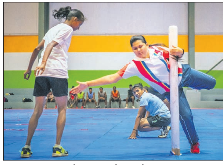
ଗ୍ରେନି ଅବସରରେ ମହିଳା ଖେଳାଳିମାନେ ।

ଭୁବନେଶ୍ୱର, ୨୦୧୯ (କ୍ରୀଡ଼ା ପ୍ରତିନିଧି) ଜାତୀୟ ଭୂମିୟର ଖୋ ଖୋ ଚାମ୍ପିୟନଶିପ୍‌ର ୪୦ତମ ସଂସ୍କରଣ ଓଡ଼ିଶାରେ ଆୟୋଜନ ହେବ । ଏହା ଚଳିତମାସ ୨୨ରୁ ୨୬ ପର୍ଯ୍ୟନ୍ତ ଅନୁଷ୍ଠିତ ହେବ । ଏଥିରେ ବିଭିନ୍ନ ରାଜ୍ୟ ଓ କେନ୍ଦ୍ର ଶାସିତ ଅଞ୍ଚଳରୁ ୬୦୦ରୁ ଊର୍ଦ୍ଧ୍ୱ ପ୍ରତିଯୋଗୀ ଅଂଶଗ୍ରହଣ କରିବେ । ଉଭୟ ବାଳିକା ଓ ବାଳକ ବିଭାଗରେ ପ୍ରତିଯୋଗିତା ହେବ । ଉଭୟ ବାଳିକା ଓ ବାଳକ ବର୍ଗରେ ଅଂଶଗ୍ରହଣକାରୀ ଦଳଗୁଡ଼ିକୁ ୮ଟି ଭୂମିୟର ବିଭକ୍ତ କରାଯାଇଛି । ଭୂମିୟର ପରେ ନକ୍ସାଭିତ୍ତିକ ମ୍ୟାଚ ଅନୁଷ୍ଠିତ ହୋଇ ବିଭେଦ ନିଶ୍ଚିତ ହେବ । ଆୟୋଜକ ଓଡ଼ିଶା ବାଳକ ବର୍ଗରେ ଭୂମିୟର ବିଭାଗ, ବିହାର, ମଧ୍ୟପ୍ରଦେଶ ଓ ଦେଲହାସ ସହିତ ସ୍ଥାନ ପାଇଛି । ବାଳିକା ବିଭାଗରେ ଓଡ଼ିଶା ଭୂମିୟର ଆକ୍ଷ ପ୍ରଦେଶ, ମିଶିପୁର ଓ କର୍ଣ୍ଣାଟକର ସହିତ ରହିଛି । ଆସନ୍ତା ବର୍ଷ ହରିୟାଣାର ପଞ୍ଚକୂଳାଠାରେ ୪୧ ଖେଳୋ ଇଣ୍ଡିଆ ଯୁବ ଗେମ୍ ଅନୁଷ୍ଠିତ ହେବ । ତେଣୁ ଆଗାମୀ ଜାତୀୟ ଚାମ୍ପିୟନଶିପ୍ ଯୋଗ୍ୟ ପର୍ଯ୍ୟାୟରୁ ଦୁର୍ଗାମେଖାଦେବ ବିବେଚିତ ହେବ । ଓଡ଼ିଶା