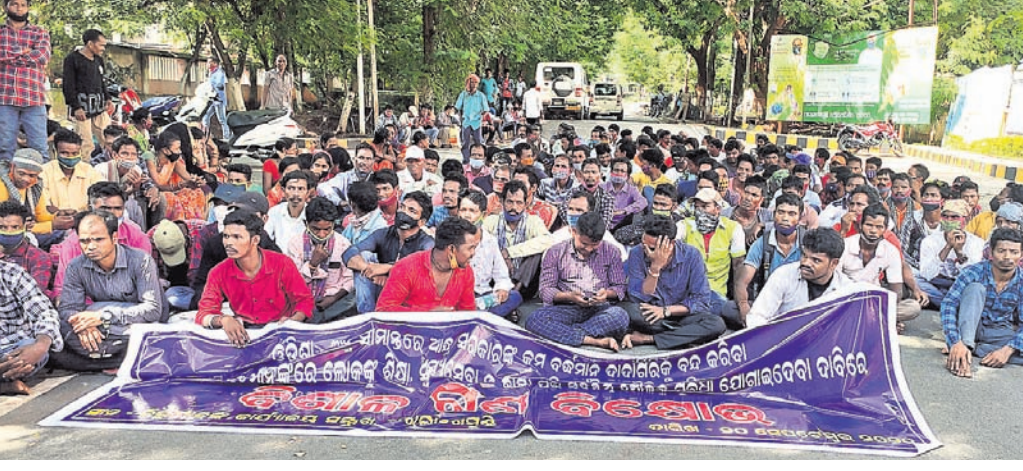
ଗଜପତି ଜିଲ୍ଲାପାଳଙ୍କ କାର୍ଯ୍ୟାଳୟ ଆଗରେ ବସିଥିବା ସୀମାନ୍ତ ଗ୍ରାମବାସୀ ।