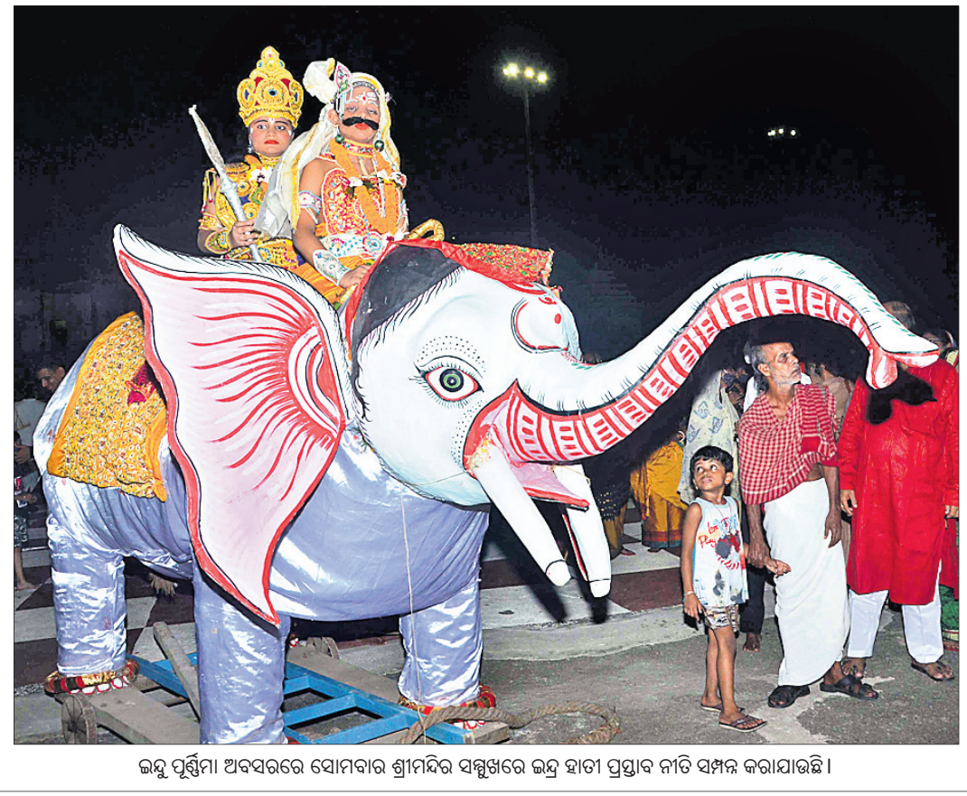
ଭଦ୍ର ପୂର୍ଣ୍ଣିମା ଅବସରରେ ସୋମବାର ଶ୍ରୀମନ୍ଦିର ସମ୍ମୁଖରେ ଭଦ୍ର ହାତୀ ପ୍ରସ୍ତାବ ନାଚି ସମ୍ପନ୍ନ କରାଯାଇଛି।

ଉତ୍ତର- ହଁ। ଦିନକୁ ଏକ ଘଣ୍ଟା ଗାତ ଅଭ୍ୟାସ କରେ। ପ୍ରଶ୍ନ- ବଲିଉଡ଼କୁ ଯିବା ପାଇଁ ସବୁ କଣ ଶିଖିବାକୁ ପଡ଼ିଲା? ଆପଣଙ୍କ ସେନିଟି ଇଚ୍ଛା ହୋଇନି କି? ଉତ୍ତର- ହଁ, ଇଚ୍ଛା ଅଛି କିନ୍ତୁ ସାମର୍ଥ୍ୟମାନଙ୍କର ସୁଯୋଗ ମିଳିନି।