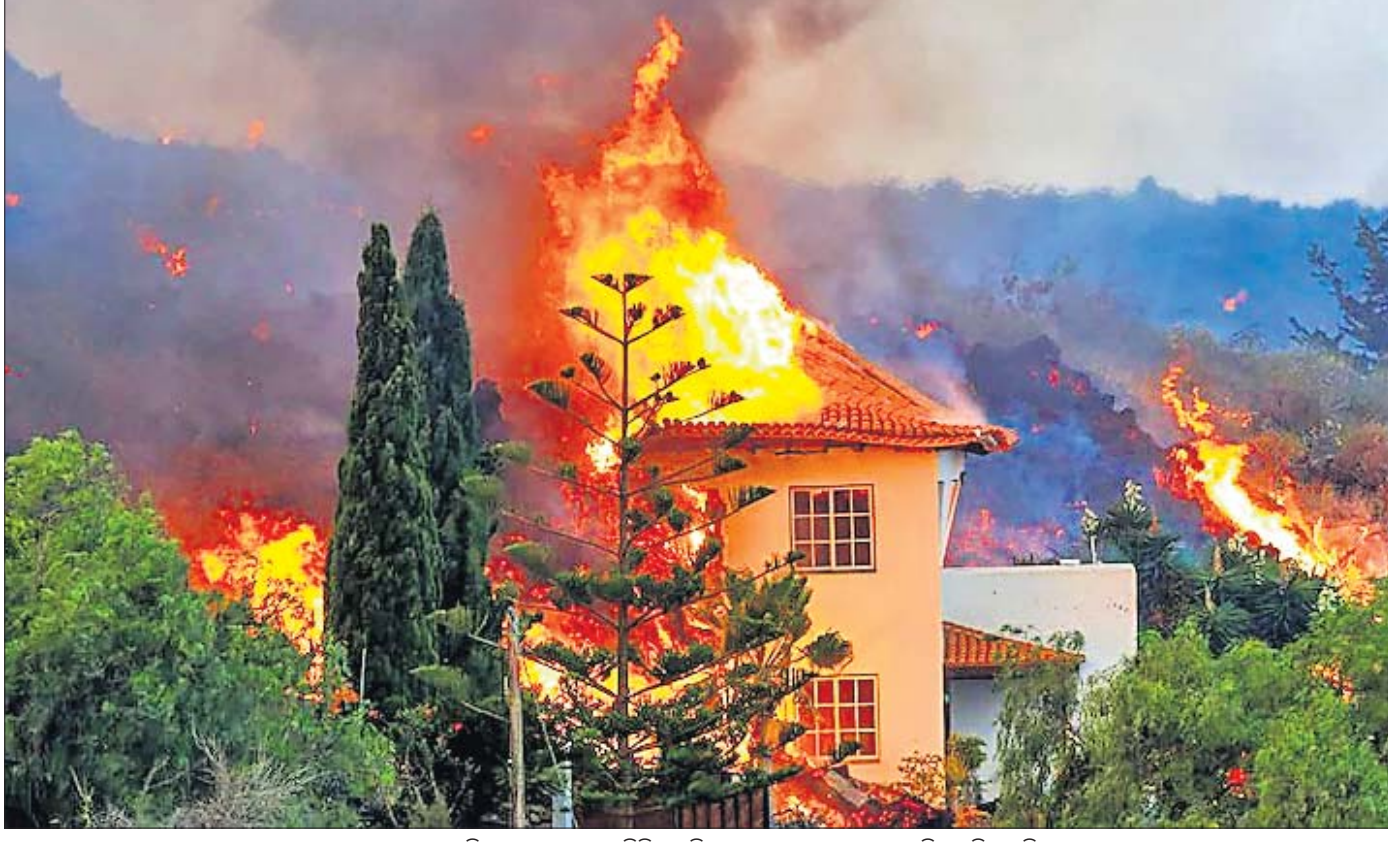
ସେନ୍ଦର କେନେରି ଦ୍ୱୀପରେ ଆଗ୍ନେୟଗିରି ଉଦ୍‌ଗିରଣ ଯୋଗୁଁ ଲାଲ୍‌ଭାରେ ଘରଗୁଡ଼ିକ ଜଳିଯାଇଛି।

ଆରମ୍ଭରୁ କହିବାକୁ ଚାହୁଁ ଯେ, ମାତୃଭାଷା ପାଇଁ ଆମର ଯଥେଷ୍ଟ ସମ୍ମାନ ଓ ଶ୍ରଦ୍ଧା ରହିଛି। ଏଠାରେ ଭାରତର ବିଭିନ୍ନ ଆଞ୍ଚଳିକ ଭାଷାକୁ କୌଣସି ଭାବରେ ଆଞ୍ଚ ଆଣିବାର ଉଦ୍ଦେଶ୍ୟ ନ ଥିଲେ ମଧ୍ୟ ନିକଟରେ ସରକାରଙ୍କ ଦ୍ୱାରା ଲଞ୍ଜିନିୟର୍ ପାଠକୁ ଓଡ଼ିଆ ସମେତ ଅନ୍ୟ ଆଞ୍ଚଳିକ ଭାଷାରେ ପଢ଼ାଇବାର ନିଷ୍ପତ୍ତିକୁ ସମର୍ଥନ କରିବା ଅବାସ୍ତବ ମନେହେଉଛି। ଓଡ଼ିଶାର ଛାତ୍ରଛାତ୍ରୀ ଆସନ୍ତା ଶିକ୍ଷାବର୍ଷରୁ ଓଡ଼ିଆ ଭାଷାରେ ଲଞ୍ଜିନିୟର୍ ପାଠ ପଢ଼ିପାରିବେ। ଅଲ୍ ଲଞ୍ଜିଆ କାଉନ୍ସିଲ୍ ଫର୍ ଚେକ୍‌ନିକାଲ ଏକ୍ସକେଗନ (ଏଆଇଏସିଟି) ପକ୍ଷରୁ ଏ ନେଇ ସବୁଜ ସଙ୍କେତ ମିଳିଛି। ଏବେ ଡାକ୍ତରୀ, ଡେଲୁଡିଂ, ମାଲ୍‌ସିଭିଜ୍, କନିଷ୍ଠ, ମରାଠୀ, ବଙ୍ଗଳା, ବେଙ୍ଗାଳୀ ଓ ହିନ୍ଦୀ ଭାଷାରେ ଲଞ୍ଜିନିୟର୍ ପଢ଼ାଯାଉଛି। ଏହିକି ଓଡ଼ିଆ ସମେତ ଉର୍ଦ୍ଦୁ, ପଞ୍ଜାବୀ ଓ ଅହମିଆ ଭାଷାରେ ଲଞ୍ଜିନିୟର୍ ପାଠ ପଢ଼ାଯିବ। ଏ ସଂକ୍ରାନ୍ତରେ ଖବର ପ୍ରକାଶ ପାଇବା ପରେ କେତେକେ ଏହାକୁ ସାଗତ କରିଛନ୍ତି। କୁହାଯାଉଛି ଓଡ଼ିଆରେ ଏହି ଦୈନିକ ପାଠ ପଢ଼ାଗଲେ ଛାତ୍ରଛାତ୍ରୀମାନେ ଭଲ ଭାବେ ବୁଝିପାରିବେ। ବାସ୍ତବରେ ମାତୃଭାଷାରେ ଏହି ବିଷୟ ପଢ଼ା ଗଲେ ଏହାର ମାନ କେଉଁ ଯୁଗରୁ ଯିବ ସେହି ଦିଗରେ କେହି ଗଭୀର ଭାବେ ଚିନ୍ତା କରୁନାହାନ୍ତି। ଲଞ୍ଜିନିୟର୍ ହେଉଛି ଏକ ଦୈନିକ ବିଦ୍ୟା, ଯାହାର ପରିସୀମା ଆଞ୍ଚଳିକତା ଭିତରେ ସୀମିତ ନୁହେଁ। ଦେଖିବାକୁ ଗଲେ ଆଜିର ଯୁଗରେ ଏହା ସମ୍ପୂର୍ଣ୍ଣ ଭାବେ ଅବହେଳା ପ୍ରଦାନ ପ୍ରତିଯୋଗୀଭାବେ ହେବା ଦରକାର। ଦେଶ ନିର୍ମାଣରେ ଲଞ୍ଜିନିୟରଙ୍କ ଅବଦାନ ଯଥେଷ୍ଟ ରହିଛି। ହେଲେ ଦେଖାଯାଉଛି ଭାରତରେ ଯେଉଁଭଳି ଲଞ୍ଜିନିୟର ସୃଷ୍ଟି ହେବା କଥା ହୋଇପାରେ ନାହିଁ। ଏହାର