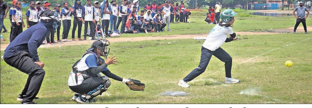
କଟକର ସତ୍ୟବ୍ରତ ଷ୍ଟାଡ଼ିୟମରେ ଚାଲିଥିବା ଜାତୀୟ ସର୍ବକ୍ରମର ସର୍ବୋଚ୍ଚ ଚାମ୍ପିୟନଶିପ୍ରେ ସୋମବାର ଦିଲ୍ଲୀ ଓ ହରିୟାଣା ମଧ୍ୟରେ ଅନୁଷ୍ଠିତ ମ୍ୟାଚ ।