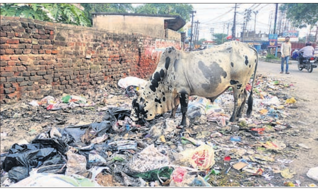
ଅନୁଗୋଳ ସହରର ଏକ ଗ୍ଲାମରେ ଜମା ହୋଇଥିବା ଆବଚନା।

ଅନୁଗୋଳ ଅଫିସ୍, ୨୦୧୧: ଠିକା ସଂସ୍ଥାକୁ ଅନୁକମ୍ପା ଦେଖାଉଛି ପୌରପାଳିକା ଠିକ ଭାବେ ହୋଇପାରୁନି ସଫେଇ କାର୍ଯ୍ୟ ସହରବାସୀଙ୍କ ମଧ୍ୟରେ ବହୁଛି ଅସନ୍ତୋଷ