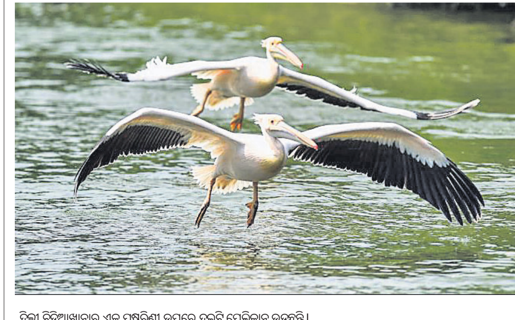
ଦିଲ୍ଲୀ ଚିଡ଼ିଆଖାନାର ଏକ ପୁଷ୍ପରିଣା ଉପରେ ଦୁଇଟି ପେଲିକାନ ଉଡ଼ୁଛନ୍ତି।