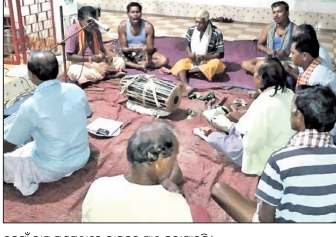
ରୁନଗାଁ ରାସ ମଞ୍ଚପାରେ ଭାଗବତ ପାଠ କରାଯାଇଛି।