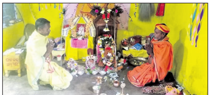
ବାଇଲମା ଠାରେ ଭାଗବତ ପାଠ କରାଯାଇଛି।