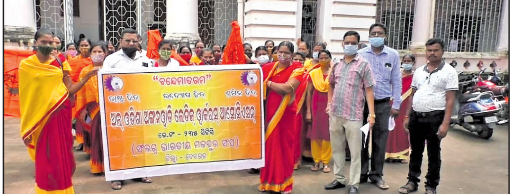
ଜିଲ୍ଲାପାଳ ଅଫିସ ସମ୍ମୁଖରେ ଅଜ୍ଞାନଝାଡ଼ି କର୍ମଚାରୀ ମହାସଂଘ କର୍ମକର୍ତ୍ତା।