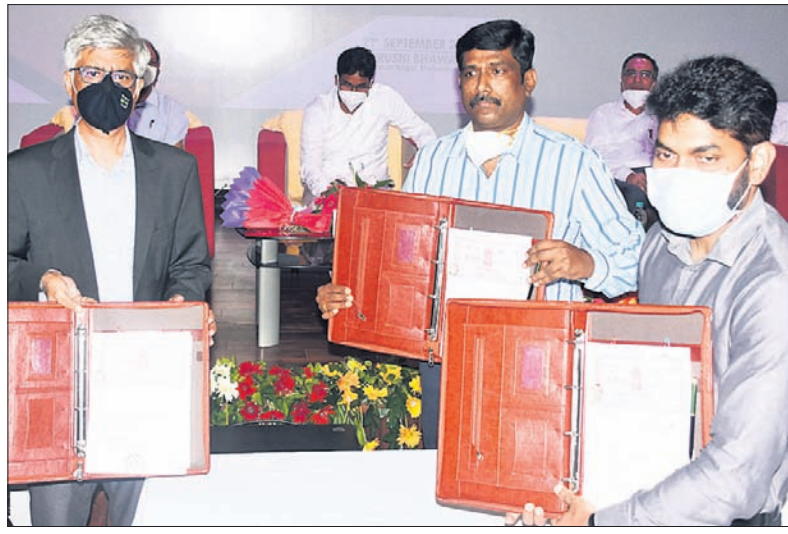
ରାଜ୍ୟ ସରକାର ଏବଂ ବିଲ୍ ଓ ମିଲିଆ ଗେରୁସ ଫାଉଣ୍ଡେଶନ ମଧ୍ୟରେ ବୃତ୍ତିନାମାପତ୍ର ସ୍ୱାକ୍ଷରଣ କରାଯାଇଛି

ଓଡ଼ିଶା ସରକାର ଓ ଗେରୁସ ଫାଉଣ୍ଡେଶନ ମଧ୍ୟରେ ବୃତ୍ତିନାମା ଉପକୃତ ହେବେ ନାମମାତ୍ର, ଭୂମିହୀନ ଗଣ୍ୟ