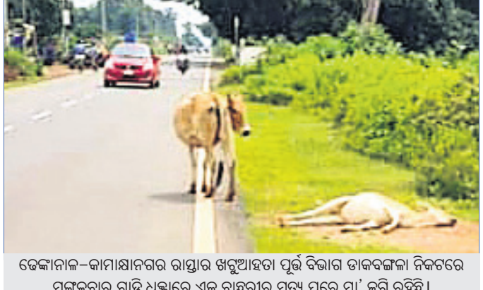
ଡେକାନାଲ-କାମାକ୍ଷାନଗର ରାସ୍ତାରେ ଖରୁଆହତା ପୂର୍ବ ବିଭାଗ ଡାକ୍ତରଖାନା ନିକଟରେ ମଙ୍ଗଳବାର ଗାଡ଼ି ଧକ୍କାରେ ଏକ ବାହୁରୀର ମୃତ୍ୟୁ ପରେ ମା' କରି ରହିଛି।