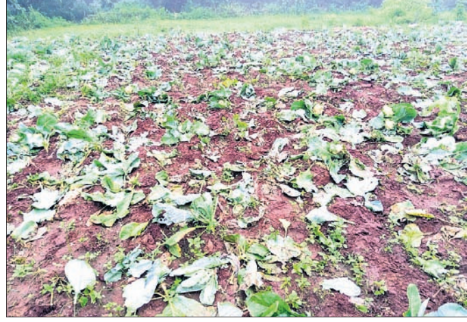
ହସ୍ତପା ରେଖାରେ ହାତୀ ନଷ୍ଟ କରିଥିବା କୋବି ଫସଲ।

ମାସେ ହେଲାଣି ନିୟମିତ ପଶିଆସୁଛନ୍ତି ହାତୀ। ଦଳି ଚକଟି ଦେଉଛନ୍ତି ଧାନ, ପୁର, କୋବି ଓ ମାକା ଫସଲ। ବାଦପଡୁଛି ବାଡ଼ିରେ ଥିବା କଦଳୀ ଓ ପଣସ ବଗିଚା। ଖବର ଯାଉଛି ବନ ବିଭାଗ ନିକଟକୁ। ହେଲେ ଗାଁରୁ ଯାଉଥିବା ଉପଦ୍ରବ ରୋକିବାରେ ବିଭାଗୀୟ ଅଧିକାରୀମାନଙ୍କ ଏପରି ଉଦାସୀନତା ଚିତାକଲାଣି ଚାଷୀଙ୍କୁ ଧୀରେ ଧୀରେ ତେଜିଲାଣି ସେମାନଙ୍କ ଯୈର୍ଯ୍ୟର ସୀମା।