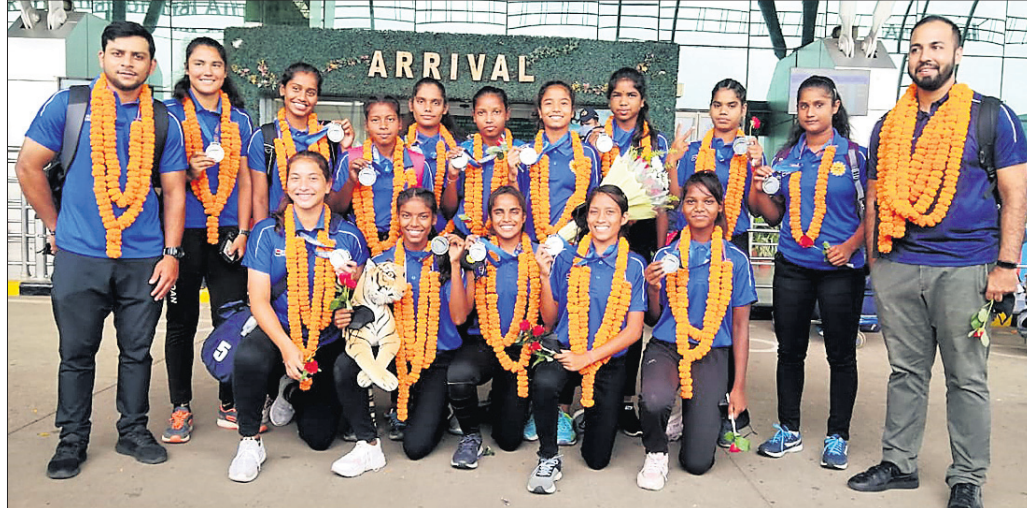
ଉତ୍ତମୋତ୍ତମରେ ଅନୁଷ୍ଠିତ ୧୮ ବର୍ଷରୁ କମ୍ ବାଳିକା ଏସିଆ ରନୁବା ୭ଏସ୍ ଟୁର୍ନାମେଣ୍ଟରେ ରୌପ୍ୟ ପଦକ ହାସଲ କରିଥିବା ଭାରତୀୟ ଦଳର ସଦସ୍ୟମାନେ ମଙ୍ଗଳବାର ଭୁବନେଶ୍ୱର ବିମାନବନ୍ଦରରେ ପହଞ୍ଚିବା ପରେ ପଦକ ପ୍ରଦର୍ଶନ କରୁଛନ୍ତି ।