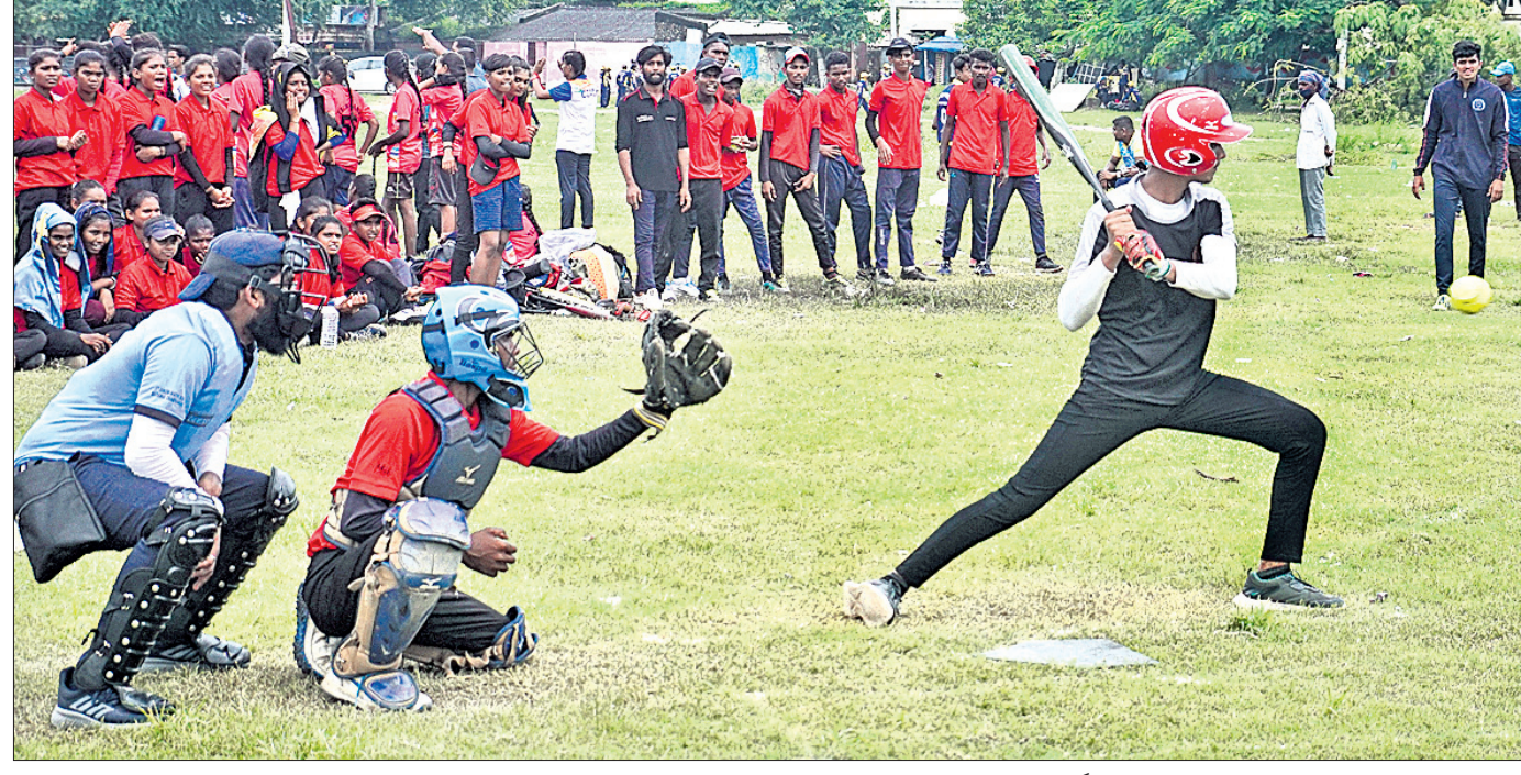
କଟକର ବାଲିଯାତ୍ରା ପଡ଼ିଆରେ ଚାଲିଥିବା ଜାତୀୟ ସର୍ବଜୁନିୟର ସଫ୍ଟବଲ୍ ପ୍ରତିଯୋଗିତାରେ ମଙ୍ଗଳବାର ମହାରାଷ୍ଟ୍ର ଓ କର୍ନାଟକ ମଧ୍ୟରେ ଅନୁଷ୍ଠିତ ବାଳକ ବିଭାଗ ମ୍ୟାଚ୍ ।

ହୋଇପାରିଛି । ଦଳକୁ କି ଶୀଘ୍ର ବ୍ୟାଲେଞ୍ଜର ସମ୍ପୂର୍ଣ୍ଣ ଅବଦାନ ପଡ଼ିବ ସନରାଇଜର୍ସ ହାଇଦ୍ରାବାଦ ସେ ନେଇ ସଚେତନ ଅଛି । ଆମର ବର୍ତ୍ତମାନ ଫ୍ଲୋ-ଅପ୍ରେ ସ୍ଥାନ ପାଇବା କଥା ଚିନ୍ତା କରୁ ନାହିଁ । ଉତ୍ତମୋତ୍ତମରେ ଦିଲ୍ଲୀର କାର୍ଯ୍ୟକାରୀ କରିପାରିବୁ ବୋଲି ସେ ବିଶ୍ୱାସ କରୁଛନ୍ତି । ଆମେ ଜନି ବେୟାରଣ୍ଟେଙ୍କ ଭଳି ଖେଳାଳିଙ୍କୁ ମିସ୍ କରିବୁ । ଦେଉଳି ଓର୍ନର ଯଦିଓ ବର୍ତ୍ତମାନ ଅଧିନାୟକ ନାହାନ୍ତି ତାଙ୍କଠାରୁ ଆମେ ବହୁତ କିଛି ଆଶା କରୁଛୁ । ସନରାଇଜର୍ସ ଦଳ ପାଇଁ ତାଙ୍କର ସମ୍ପୂର୍ଣ୍ଣ ଉଲ୍ଲେଖନୀୟ ଅବଦାନ ରହିଆସିଛି । ଆଇପିଏଲ୍ରେ ପ୍ରଥମ ଓ ଦ୍ୱିତୀୟ ପର୍ଯ୍ୟାୟ ମଧ୍ୟରେ ଭାରତର ବହୁ ଯୁବ ଖେଳାଳିଙ୍କ ପ୍ରଦର୍ଶନ ମୋଡେ ପ୍ରଭାବିତ କରିଛି । ଦ୍ୱିତୀୟ ପର୍ଯ୍ୟାୟରେ ଆମେ ସଚେତ ମନୋବୃତ୍ତି ନେଇ ଖେଳିବୁ । ସଚେତ ଅବଲମ୍ବନ ସହ ସକାରାତ୍ମକ ଭାବ ନେଇ ଖେଳିବା ଲାଗି ଆମେ ଦୃଢ଼ପରିବର । - (ଗୋପାଳ)