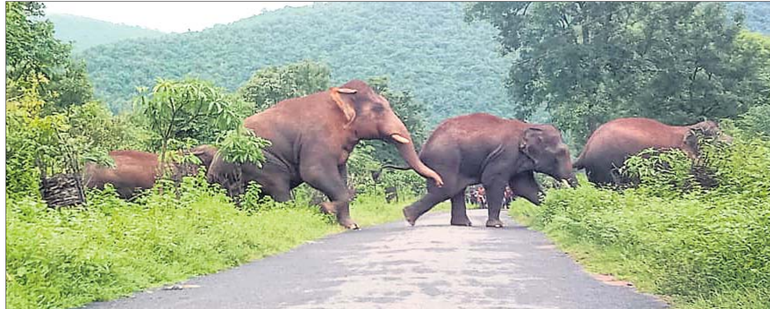
ଅନୁଗୋଳ ଜିଲ୍ଲା ହେଉଛି ରେଞ୍ଜି ଅନ୍ତର୍ଗତ ବଡ଼ହୁଲା-ଧୁଡ଼ି ଗ୍ରାମ ରାସ୍ତାକୁ ମଙ୍ଗଳବାର ହାତୀପଲ ପାର ହେଉଛନ୍ତି।