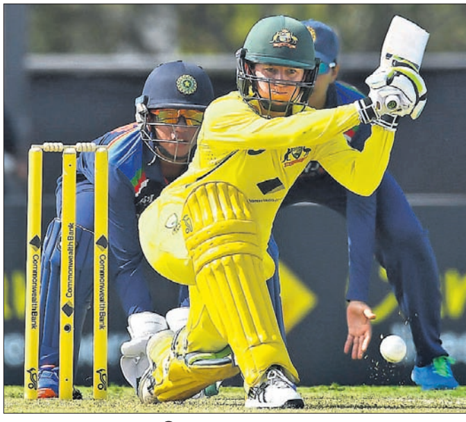
ଶର୍ ଖେଳିବା ଅବସରରେ ରାଜେଲ ହେଡ୍ ।

୧୨୬ ରନର ପାର୍ଟନରଶିପ୍ କରିସାରିଥିଲେ । ସେ ୮ ଚୋକା ଓ ବିଜୟ ହାସଲ କରିଛି । ଫଳରେ ଦଳର ଆୟାତ୍ମ, ଷ୍ଟୁଇ ଷ୍ଟୁଇ, ଅମିତ ମିଶ୍ରା, ଅନିଲ ଗୋର୍ଡ, ଆଭେସ ଖାଁ, ବେନ ଷ୍ଟାରଗରଜ୍, ଶିଖର ଶର୍ମା, କାରିସୋ ରାବାଡ଼ା, କୁଲଦେବ ଖେଟ୍ଟୋଲିୟା, ଲୁକମ୍ୟାନ ମେରିଫିଲ୍ଡ, ପ୍ରସାନ୍ତ ବୁଦ୍ଧେ, ଚମ୍ପୁ କୁରାନ, ଉମେଶ ଯାଦବ, ଅକ୍ଷୟ ପଟ୍ଟେଲ, ଲଳିତ ଯାଦବ, ମାର୍କସ୍ ଷ୍ଟୋଲିନିଓ, ରବିନ୍ଦ୍ରନ ଅଶ୍ୱିନ, ସାମ ବିଲିଙ୍ଗ୍ ଓ ବିଷ୍ଣୁ ବିନୋଦ । ସନରାଇଜର୍ସ ହାଇଦ୍ରାବାଦ ଦଳ: କେନ୍ ଫ୍ରିଲିଫ୍ଟସନ (ଅଧିନାୟକ), ଦେଉଳି ଓର୍ନର, ମନାଷ ପାଣ୍ଡେ, ଶେଫାଳି ରବିଚନ୍ଦ୍ର, ଚିକିତ୍ସା ଶାହା, ଶ୍ରୀହରୀ ଗୋସ୍ୱାମୀ, ରବିନ୍ଦ୍ର ଖାଁ, ବିଜୟ ଶଙ୍କର, ମହମ୍ମଦ ନବା, ଅଭିଷେକ ଶର୍ମା, ଭୁବନେଶ୍ୱର କୁମାର, ସିଦ୍ଧାର୍ଥ କାଉଲ, ଖଲିଲ ଅହମ୍ମଦ, ଟି. ନରାଜନ, ବାସିଲ ଥମ୍ପି, ସମୀପ ଶର୍ମା, ଶାହାବାଜ ନବାମ, ଅଦ୍ୱୈତ ସମାଦ, କରଦାଶା ସୁପ୍ରିୟା, ଜାସନ ହୋଲ୍ଡର, ବିରାଟ ସିଂ, ପ୍ରିମ ଗର୍ଗ, କେଦାର ଯାଦବ, ପୂଜିତ୍-ଉର୍-ରହମାନ ଓ ଜାସନ ରୟ ।