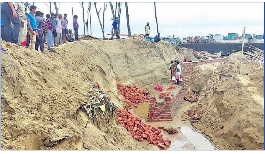
ଉଦୟପୁର ବେଳାଭୂମିରେ ପଣ୍ଡିମବଜାର ବେଆଇନ ପାଟେରି ନିର୍ମାଣ।

ଭୋଗରାଇ, ୨୧।୯ (ଡି.ଏନ୍.ଏ.) ବାଲେଶ୍ୱର ଜିଲ୍ଲା ଭୋଗରାଇ ବ୍ଲକ୍ ଅଧୀନ ଉଦୟପୁର ବେଳାଭୂମିକୁ ନେଇ ଉଭୟ ଓଡ଼ିଶା ଓ ପଣ୍ଡିମବଜା ମଧ୍ୟରେ ବିବାଦ ଘନାଭୂତ ହେବାରେ ଲାଗିଛି।