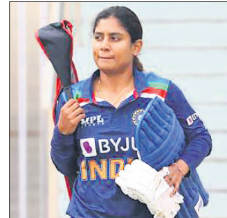
ଚାଲିକାରେ ୬୨୨ ରେଟିଂ ପଏଣ୍ଟ ହାସଲ କରି ୧ ନମ୍ବର ସ୍ଥାନ ବଜାୟ ରଖିଛନ୍ତି । ଓପନର ସ୍ମିତ ମାନ୍ଦା ସପ୍ତମ ସ୍ଥାନରେ ରହିଛନ୍ତି । ସେହିପରି ଦକ୍ଷିଣ ଆଫ୍ରିକା ୧୦-୨ରେ ଦିଲ୍ଲୀ, ମହାରାଷ୍ଟ୍ର ୭-୦ରେ କର୍ନାଟକ, ଛତ୍ତୀଶଗଡ଼ ୭-୦ରେ ଉତ୍ତର ପ୍ରଦେଶ ଏବଂ ଉତ୍ତରାଖଣ୍ଡ ୫-୦ରେ ଆନ୍ଧ୍ର ପ୍ରଦେଶକୁ ହରାଇ ଦେଇଛି ।