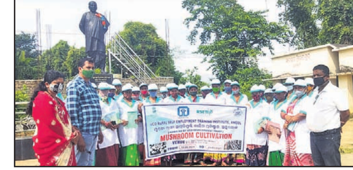
କାର୍ଯ୍ୟକ୍ରମରେ ଉପସ୍ଥିତ ମହିଳାମାନେ।