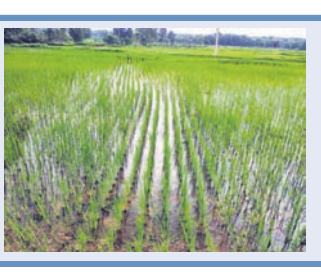
ମାଡ଼ ସେପ୍ଟେମ୍ବରରେ ପାଣିପାଗର ଚିତ୍ର ସାମ୍ପୂର୍ଣ୍ଣ ବଦଳି ଯାଇଥିଲା। ଲଭୁଚାପଜନିତ ବର୍ଷା ପାଣିରେ ଚାଷ ଜମି

ବନ୍ଧୁ ଭରିଯାଇଥିଲା। ଚାଷ ହୋଇଥିବା ୮୬ ହକ୍ଟର ୦୪୫ ହେକ୍ଟର ମଧ୍ୟରୁ ମାଡ଼ ୨୫୦ ହେକ୍ଟରରେ ଫସଲ ବୁଡ଼ି ଯାଇଥିଲା।