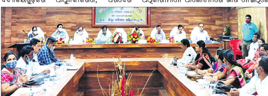
ବୈଠକରେ ଏମିତି, ବିଧାୟକ, ଜିଲ୍ଲାପାଳଙ୍କ ସମେତ ଅଧ୍ୟକ୍ଷମାନେ।

ସମାପ୍ତ ହେବା ଲାଗି ସ୍କୁଲ ପରିସରରେ କମ୍ପୋଷ୍ଟ ପିଟ ନିର୍ମାଣ, ସ୍କୁଲର ଜମିପତା ପ୍ରସ୍ତୁତି ସମ୍ପର୍କରେ ଆଲୋଚନା ହୋଇଥିଲା। କରୋନା ସଂକ୍ରମଣ ରୋକିବା ଲାଗି ଚେଷ୍ଟା ସଂଖ୍ୟା ବୃଦ୍ଧି, ଚିକାକରଣ, ସ୍ୱାସ୍ଥ୍ୟ ଉପରେ ସର୍ବାଧିକ ସଚର୍କତା ଅବଲମ୍ବନ, କୃଷିର ବିକାଶ ଲାଗି ଜଳସେଚନ, ଗ୍ରାମାଞ୍ଚଳରେ ପାଇପ ଯୋଗେ ପାନୀୟଜଳ ଯୋଗାଣ, ବିଦ୍ୟୁତ୍ ସେବାରେ ଉନ୍ନତି, ପ୍ରଧାନମନ୍ତ୍ରୀ ଗ୍ରାମ ସଡ଼କ ଯୋଜନା ରାସ୍ତା ନିର୍ମାଣ, ହାତୀର ଚଳାପ ନିର୍ଦ୍ଧାରଣ, ହାତୀ ଉପଦ୍ରବର ପ୍ରତିକାର କରିବାକୁ ଜନପ୍ରତିନିଧିମାନେ ଅନୁରୋଧ ପଦକ୍ଷେପ କରିଥିଲେ।