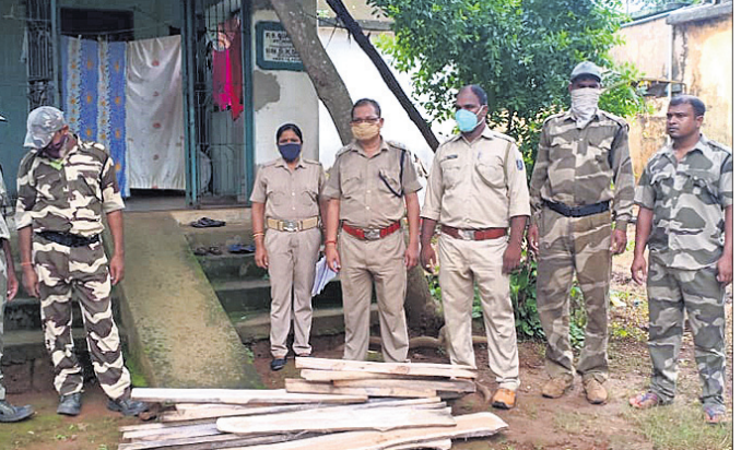
ଜବତ ହୋଇଥିବା ଶାରୁଆନ ପଟା।