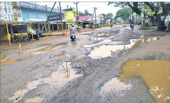
ଭୁବନ ସହର ଦେଇ ଯାଇଥିବା ୫୩୯ ନମ୍ବର ଜାତୀୟ ରାଜପଥ ଖାଲଖାମାରେ ଭର୍ତ୍ତି ହୋଇଛି।

ପୁରୀ-ଭୁବନେଶ୍ୱର ସଡ଼କପଥ ଉପରେ ନିର୍ଭର କରେ ଅଞ୍ଚଳର ବିକାଶ। ଆନ୍ଧ୍ରରାଜ୍ୟ ଏବଂ ଆନ୍ଧ୍ରଜିଲ୍ଲା ପରିସରରେ ବ୍ୟବସ୍ଥାକୁ ଅଧିକ ସୁଗମ କରିବା ଲାଗି ଜାତୀୟ ରାଜପଥ (ଏନ୍.ଏ.ଏ.)ର ଉନ୍ନତୀକରଣକୁ ସର୍ବଦା ଦିଆଯାଉଛି ପ୍ରାଥମିକତା।