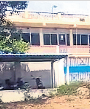
ଶ୍ରମିକମାନେ କାମ କରୁଥିବା ଚିକ୍କି ଉତ୍ପାଦନ ଯୁନିଟ୍ ।