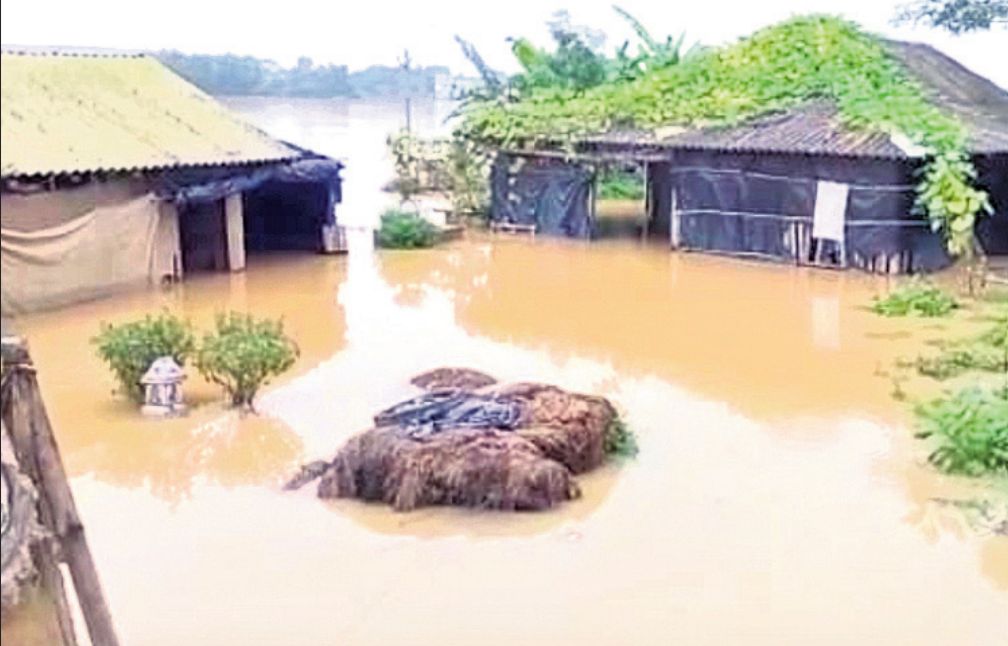
ପାଣି ଘେରରେ ଥିବା ଏକ ଗାଁ ।