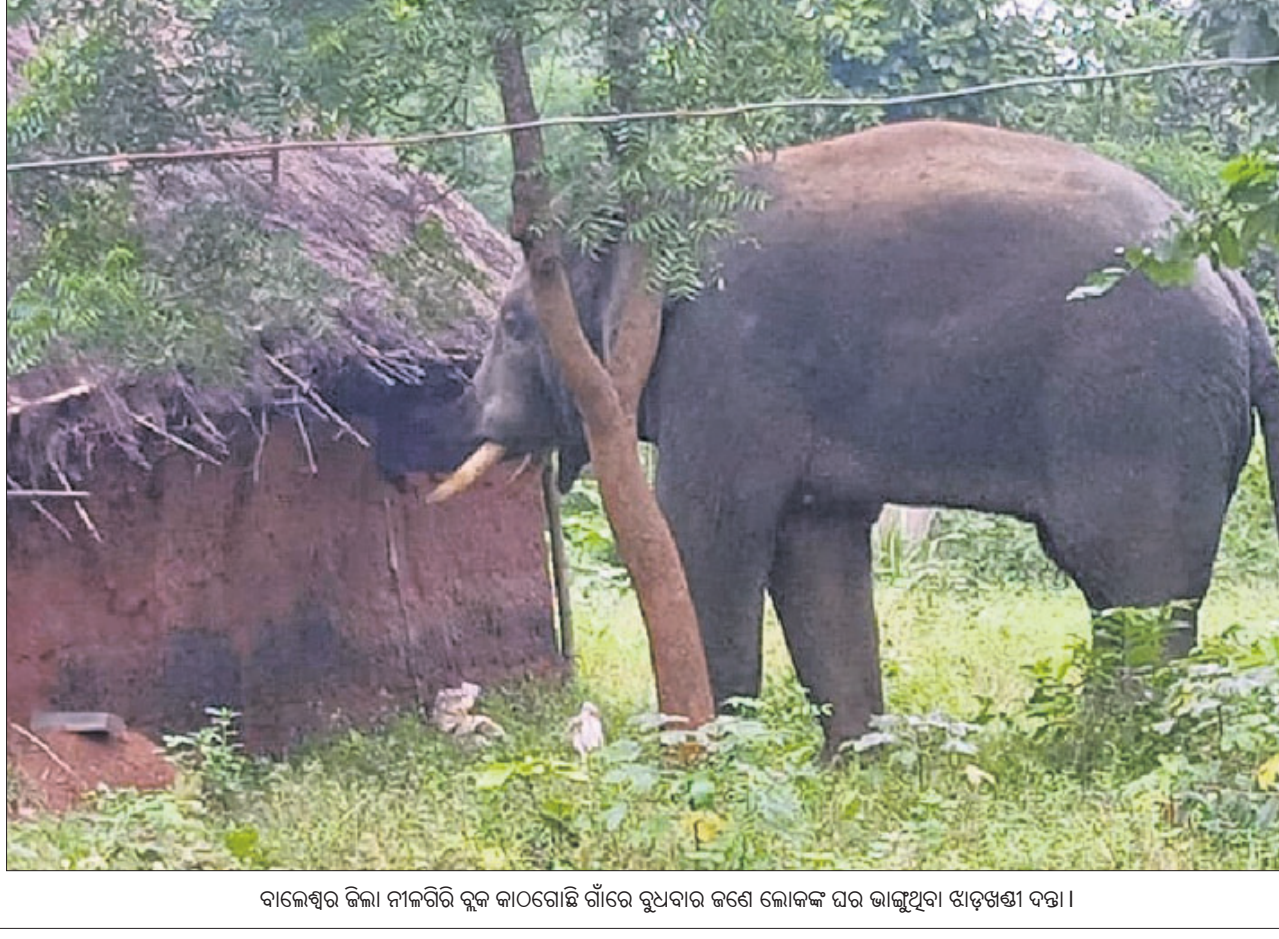
ବାଲେଶ୍ୱର ଜିଲ୍ଲା ନୀଳଗିରି ବୁକ କାଠଗୋଷ୍ଠି ଗାଁରେ ବୁଧବାର ଜଣେ ଲୋକଙ୍କ ଘର ଭାଙ୍ଗିଥିବା ଝାଡ଼ାଖଣ୍ଡୀ ଦଣ୍ଡ।