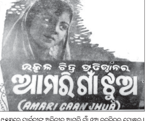
୧୯୫୩ରେ ପାର୍ବତୀଙ୍କ ଅଭିନୀତ ଆମରି ଗାଁ ଛୁଅ ଚଳଚ୍ଚିତ୍ରର ପୋଷ୍ଟର।

ଓଡ଼ିଆ ଚଳଚ୍ଚିତ୍ରର ବୁଲ୍ ସ୍ଲରଣୀୟ ବ୍ୟକ୍ତିତ୍ୱ ଗୌର ଘୋଷ ଓ ପାର୍ବତୀ ଘୋଷ। ଅଭିନୟ, ପ୍ରଯୋଜନା ଏବଂ ନିର୍ଦ୍ଦେଶନା କ୍ଷେତ୍ରରେ ଦୁଆ ଧାରୀ ଆଶିବା ସହ ଜାତୀୟସ୍ତରରେ ଏମାନଙ୍କ ଚଳଚ୍ଚିତ୍ରକୁ ସ୍ୱୀକୃତି ମିଳିଥିଲା। ଓଡ଼ିଆ ଚଳଚ୍ଚିତ୍ର ଜଗତକୁ ଏମାନଙ୍କ ଅବଦାନକୁ