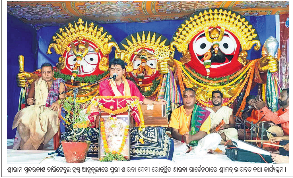
ଶ୍ରୀରାମ ସୁନ୍ଦରକାଣ୍ଡ ଚାରିଦେଶୁଳ ଗ୍ରହ ଆରମ୍ଭକ୍ରମରେ ପୁରୀ ଶାରଦା ଦେବୀ ଭୋଗସ୍ୱିତ ଶାରଦା ଗାର୍ଡେନରେ ଶ୍ରୀମଦ୍ ଭାଗବତ କଥା କାର୍ଯ୍ୟକ୍ରମ।