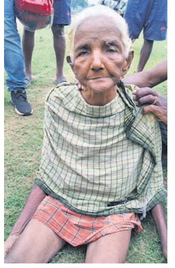
ରାମିଆଳ ନଦୀରୁ ଭଙ୍ଗା ବାଲି ତରାଇ।

‘ରଖେ ହରି ତ ମାରେ କିଏ’ ଓଡ଼ିଆ ପରିବାରର ଘରେ ଘରେ ପରିଚିତ ଏହି ଆପ୍ତ ବାକ୍ୟ ସତ୍ୟ ପ୍ରମାଣିତ ହୋଇଛି। ରାମିଆଳ ନଦୀରେ ୬ କି.ମି. ଭାସି ଯାଇଥିଲେ ମଧ୍ୟ ଜୀବିତ ଅବସ୍ଥାରେ ଭଙ୍ଗା ହୋଇଛନ୍ତି ଜଣେ ବୃକ୍ଷ। ତେଜନାଳ ଜିଲ୍ଲା ଭୁବନ ବୁକ ଅରଖ୍ୟାଳୟ ଗ୍ରାମରେ ବୁଧବାର ଘଟିଥିବା ଏହି ଘଟଣା ଚର୍ଚ୍ଚାର ବିଷୟ ପାଲଟିଛି। ଅଗ୍ନିଶମ ବିଭାଗ ପକ୍ଷରୁ ମିଳିଥିବା ସୂଚନା