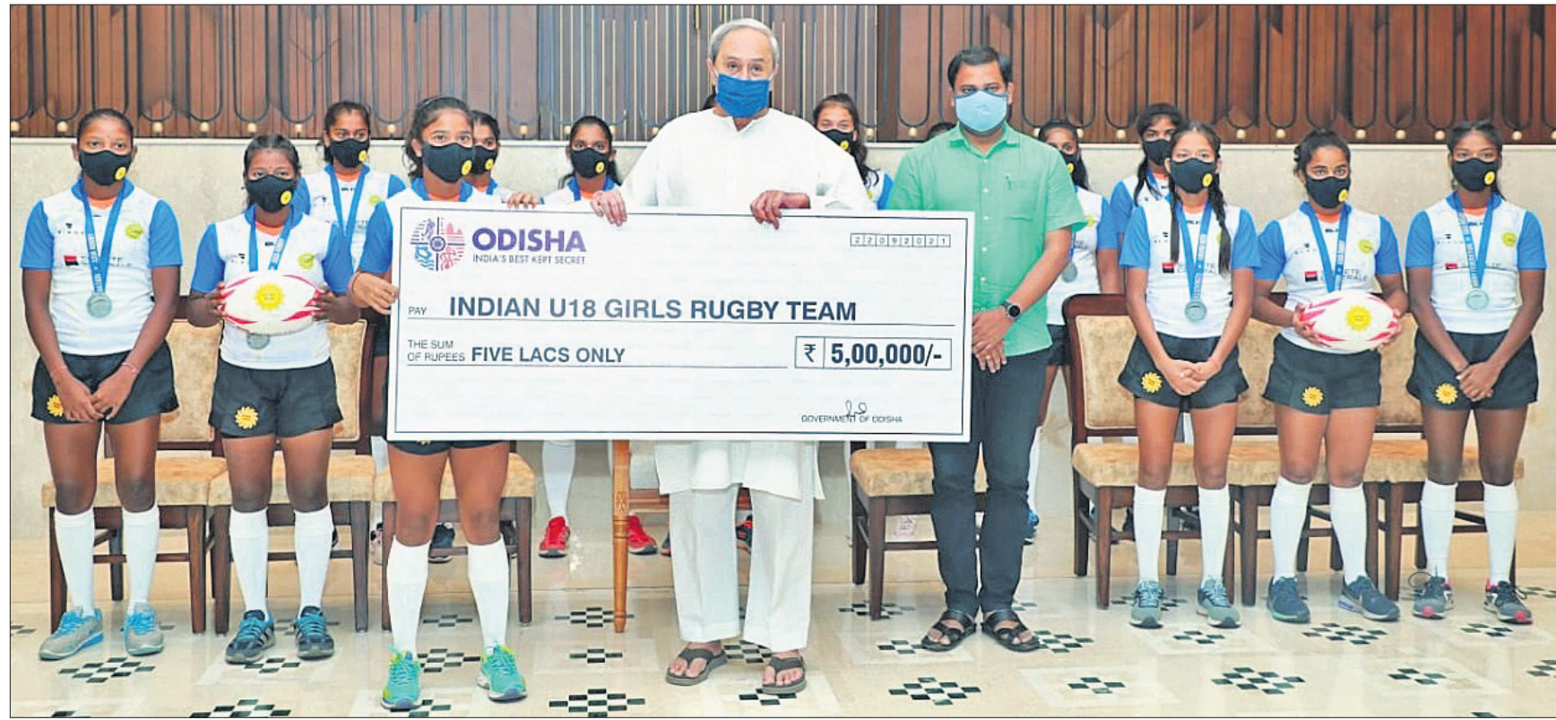
୧୮ ବର୍ଷରୁ କମ୍ ବାଳିକା ଏସିଆନ ରଗ୍ବୀ ସେଭେନ୍ସ ଚାମ୍ପିୟନଶିପ୍ରେ ରୌପ୍ୟ ପଦକ ବିଜୟୀ ଭାରତୀୟ ଦଳକୁ ୫ ଲକ୍ଷ ଟଙ୍କାର ଚେକ୍ ପ୍ରଦାନ କରୁଛନ୍ତି ପୁଖ୍ୟମନ୍ତ୍ରୀ ନବୀନ ପଟ୍ଟନାୟକ ।