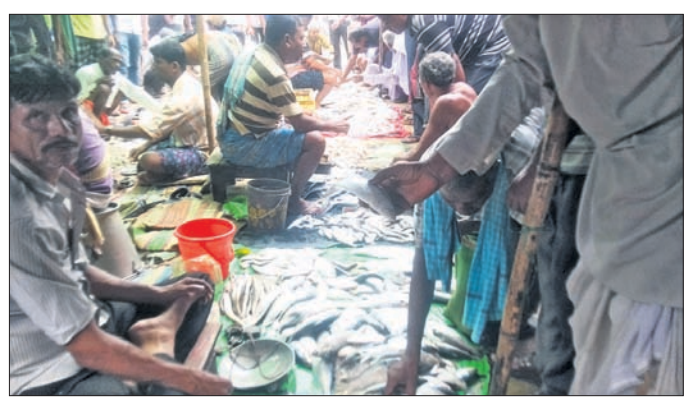
ହାଟ ବଜାରରେ ବିକ୍ରି ହେଉଥିବା ଛୋଟ ଇଲିଶି।

କଥାରେ ଅଛି ଚାଲିଯିବ କିମ୍ପା ପୋଲିସ୍, ମାଛ ଖାଇବ ଇଲିଶି। ଇଲିଶି ନାଁ ଶୁଣିଲେ ଆମିଷ ପ୍ରେମୀଙ୍କ ପାଟିରେ ଲାଲ ଗଢ଼େ। ଇଲିଶି ମାଛର ସ୍ୱାଦ ଅନନ୍ୟ ମାଛଠାରୁ ନିଆରା ହୋଇଥିବାରୁ ଏହାର ହାତଧାରି ଅଧିକ। କିନ୍ତୁ ଏବେ ଏହି ଇଲିଶିକୁ ନେଇ ଚିନ୍ତାରେ ପଡ଼ିଛନ୍ତି ମତ୍ସ୍ୟଜୀବୀ। ଗ୍ରାହକଙ୍କ ପସନ୍ଦ ଅନୁଯାୟୀ ବଡ଼ ଇଲିଶି ଜାଲରେ ପଡ଼ୁ ନ ଥିବା ବେଳେ ଛୋଟ ଇଲିଶି ଧରି ଯେନତେନ ସବୁଷ୍ଟ ହେଉଛନ୍ତି ମାଛ ଧରାଳି। ଲଘୁଗାପ ଜନିତ ଝିପିଝିପି ବର୍ଷା ଯୋଗୁ ଇଲିସି ଏବେ ଉପକୂଳସୂର୍ଯ୍ୟୀ। ବାଲେଶ୍ୱର ଉପକୂଳ ଉତ୍ତରପୁର, ତାଳସାରା, ବିଟିପୁର, କାରିନିଆ, ଚୌମୁଣ୍ଡା, ତରା, ବାହାବଳପୁର, କନ୍ଧାପଳ ସମେତ ପଡ଼ୋଶୀ ଦାସା, ଶଙ୍କରପୁର, ତାଳପୁର, ମାଧାରମଣି ଓ ଭୁବନପୁର ମତ୍ସ୍ୟ ଅବତରଣ କେନ୍ଦ୍ରରେ ସମସ୍ତ ହେଲେ ଛୋଟ ଇଲିସି ଆମଦାନୀ ହେଉଛି। ବଡ଼ ଇଲିସି ବଜାରକୁ କମ୍