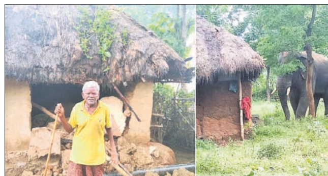
ହାତୀ ଭାଙ୍ଗି ଦେଇଥିବା ଘର।