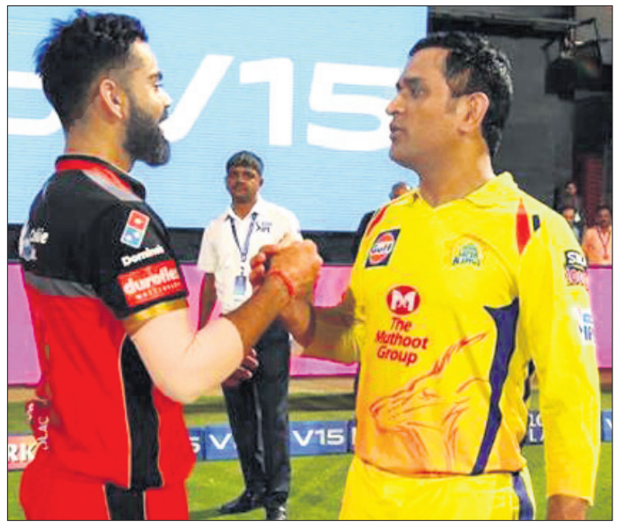
ବିରାଟ କୋହଲି ଓ ମହେନ୍ଦ୍ର ସିଂ ଧୋନୀ ।

ଶାରକା, ୨୩।୯ (ପି.ଟି.) ବହୁ ସ୍ଥାନ ଖେଳାଳିଙ୍କୁ ନେଇ ଗଠିତ ଉତ୍କଳ ବ୍ୟାଲେଟ୍ସ ବାଙ୍ଗାଲୋର (ଆରସିବି) ଶୁକ୍ରବାର ଖେଳାଳିବାକ୍ସୁଦା ଏକ ଇଣ୍ଡିଆନ ପ୍ରିମିୟର ଲିଗ୍ (ଆଇପିଏଲ୍) ମ୍ୟାଚ୍‌ରେ ମହେନ୍ଦ୍ର ସିଂ ଧୋନୀଙ୍କ ଚେନ୍ନାଇ ସୁପର କିଙ୍ଗ୍ସ (ସିଏସ୍କେ)କୁ ଭେଟିବ । ପୂର୍ବପରାଜୟକୁ ଭୁଲି ବିଜୟ ପଥକୁ ଫେରିବା ଲକ୍ଷ୍ୟ ନେଇ ଦଳ ପଡ଼ିଆକୁ ଓହ୍ଲାଇବ । ଅନ୍ୟପଟେ ରବିବାର ଗଡ଼ଧରଣ ଚାମ୍ପିୟନ ପୁସାଇ ଇଣ୍ଡିଆନ୍ସ ବିପକ୍ଷରେ ୨୦ ରନରେ ବିଜୟ ଲାଭ କରିଥିବାକୁ ସିଏସ୍କେର ମନୋବଳ ଉଚ୍ଚ ରହିଛି । ପଏଣ୍ଟ ଚେମ୍ପିୟନରେ ନିଜ ଛୁଟି ସୁଧାରିବାକୁ ହେଲେ ଆରସିବିକୁ ବ୍ୟାଟିଂରେ ଉନ୍ନତ ଆଶିବାକୁ ହେବ । ଓପନର ଦେବଦତ୍ତ ପଡ଼ିକାଲ (୨୧୭ ରନ) ଓ ଅଧିନାୟକ ବିରାଟ କୋହଲି (୨୦୩ ରନ)କୁ ଦୂର ଆରମ୍ଭ କରିବାକୁ ହେବ । ଓପନିଂ ଯୋଡ଼ିକୁ ଆହୁରି ମଧ୍ୟ ମିତଳ ଅର୍ଥରୁ ସହାୟତା ମିଳିବା ଆବଶ୍ୟକ । କୋଲକାତା ନାଇଟ ରାଇଡର୍ସ (କେକେଆର୍) ବିପକ୍ଷ ମ୍ୟାଚ୍‌ରେ ଆରସିବିର ମିତଳ ଅର୍ଥର ଉନ୍ନତ ପଡ଼ିଥିଲା । ଗ୍ରେନ ମାଙ୍କୁଡ଼େଲ