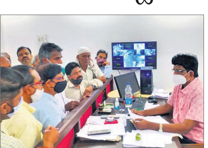
ଖଇରା ବଜାର ବ୍ୟବସାୟୀଙ୍କ ତରଫରୁ ଦାବିପତ୍ର ପ୍ରଦାନ କରାଯାଇଛି।