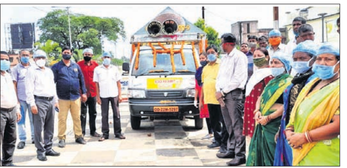
ସଚେତନତା ରଥ ଉଦ୍ଘାଟନ କରାଯାଇଛି।

ବାଲେଶ୍ୱର ଜିଲ୍ଲା ଅଧୀନ ଖଇରା ବଜାରରେ ଜଳ ନିଷ୍ଠାସନ ବ୍ୟବସ୍ଥା ଶୋଚନୀୟ ହୋଇପଡ଼ିଛି। ଆକାଶରେ ବାଦଲ ଭାସିଲେ ସ୍ଥାନୀୟ ବ୍ୟବସାୟୀ ଓ ଗ୍ରାମବାସୀ ଆତଙ୍କିତ ହୋଇପଡ଼ୁଛନ୍ତି। ସାମାନ୍ୟ ବର୍ଷାରେ ବଜାର ଗଳିକନ୍ଦିର ଆଖୁବ ଲୋଖାଏଁ ଜଳ ପ୍ରବାହିତ ହେଉଛି। ବଜାର ମଧ୍ୟ ବେଳ ଅତିକ୍ରମ କରିଥିବା ଯୋର-କୁପାରୀ ରାଜ୍ୟ ରାଜପଥରେ ବର୍ଷା ପାଣି ଲହଡ଼ି ମାଡୁଛି। ୫ବର୍ଷ ତଳେ ରାସ୍ତା ନିର୍ମାଣ ବେଳେ ଭେଦ ଅବରୋଧ କରି ଘର ନିର୍ମାଣ କରିଥିବା ବ୍ୟକ୍ତିଗଣଙ୍କୁ ତତ୍କାଳୀନ ତହସିଲଦାର ଭଲେଇ କରିବାର ବିଫଳ ହେବା ଯୋଗୁ ଜଳ ନିଷ୍ଠାସନରେ ଏହା ଅବରୋଧ ହୋଇଛି। କ୍ରମାଗତ ଲଘୁଗାପ ବର୍ଷା ବଜାରବାସୀଙ୍କ ନିବ ହଜାଇ ଦେଇଛି। ଏଭଳି ପରିସ୍ଥିତିରେ ଅସମ୍ପୂର୍ଣ୍ଣ ଆୟତ୍ତ କେନାଲରେ ମୁକ୍ତଳା