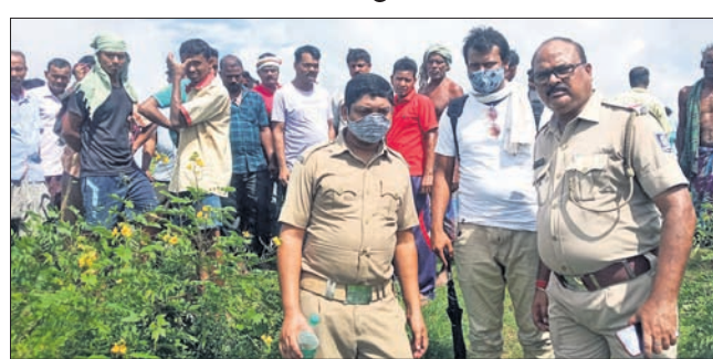
ଘଟଣାସ୍ଥଳରେ ପୋଲିସ୍ ଓ ଗ୍ରାମବାସୀ।