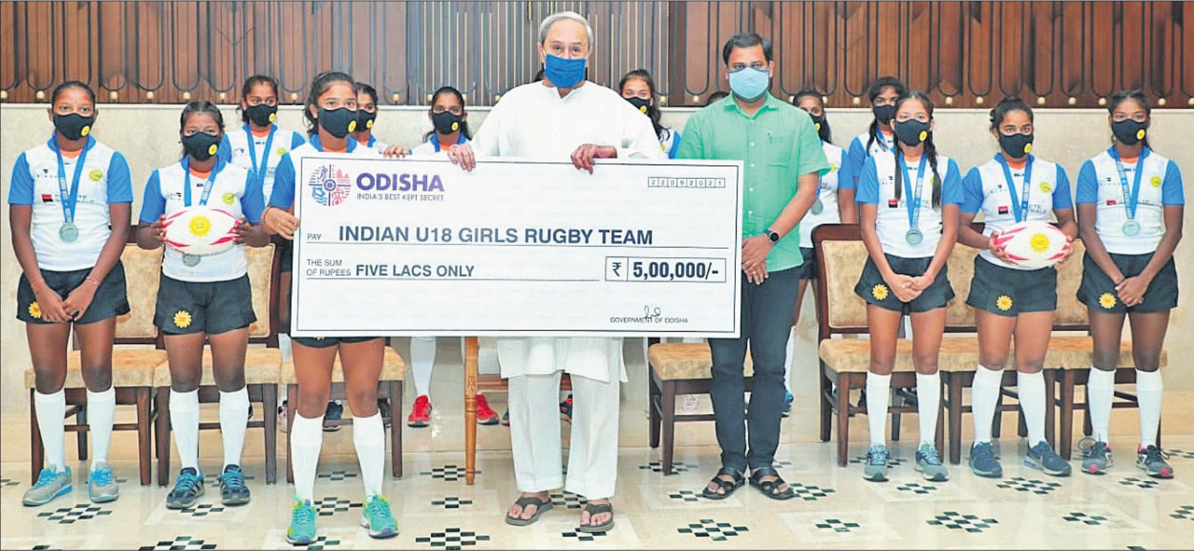
୧୮ ବର୍ଷରୁ କମ୍ ବାଳିକା ଏସିଆନ ରଗ୍ବୀ ସେଭେନ୍ସ ଚାମ୍ପିୟନଶିପ୍ରେ ରୌପ୍ୟ ପଦକ ବିଜୟୀ ଭାରତୀୟ ଦଳକୁ ୫ ଲକ୍ଷ ଟଙ୍କାର ଚେକ୍ ପ୍ରଦାନ କରୁଛନ୍ତି ପୁଖ୍ୟମନ୍ତ୍ରୀ ନବୀନ ପଟ୍ଟନାୟକ ।