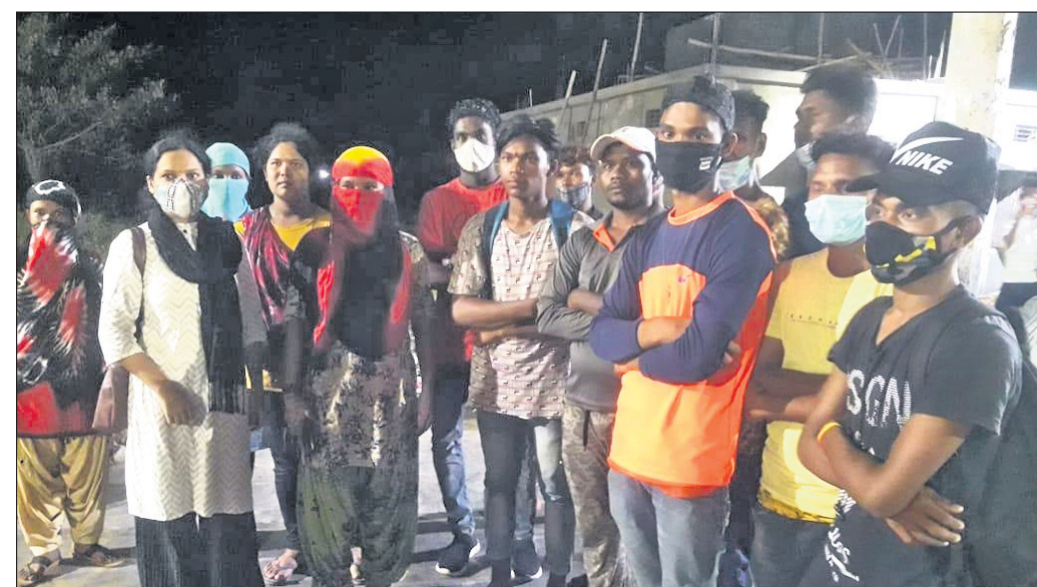
ସହକାରୀ ଶ୍ରମ ଅଧିକାରୀ ଗୁଣପୁର ଫେରିଥିବା ଶ୍ରମିକମାନଙ୍କ ସହ ଆଲୋଚନା କରୁଛନ୍ତି ।

ରାୟଗଡ଼ା ଜିଲ୍ଲା ଗୁଣପୁର ଉପଖଣ୍ଡର ପୁରୀ, ପିଆରୁଡ଼ି ଓ ପଦ୍ମପୁର ଅଞ୍ଚଳର ଶ୍ରମିକମାନେ କାମ କରିବାକୁ ଆନ୍ଧ୍ର ପ୍ରଦେଶ ସ୍ତେଷ୍ଟ ଗୋଦାବରୀ ଜିଲ୍ଲା ଜାମିନାମୀ ଅଞ୍ଚଳର କାଟ୍ଟାପାଲିଠି ଏକ ଚିଲ୍ଡ୍ର ଉଦ୍ଘାଟନ ଯୁକ୍ତ ଯାଜ୍ଞିତ୍ୟେ ।