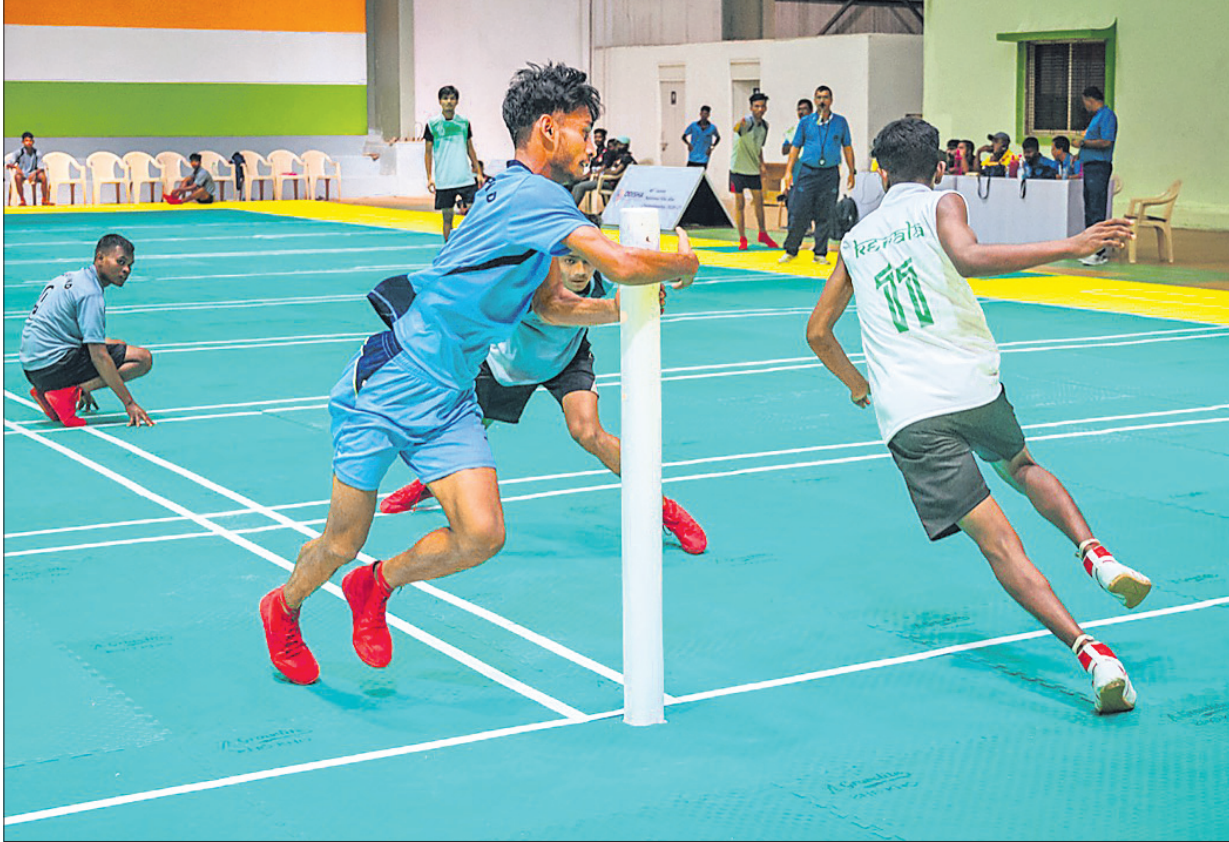
ଜାତୀୟ କୁନିୟର ଖୋ ଖୋ ଚାମ୍ପିୟନଶିପ୍ରେ ବାଳିକା ବିଭାଗରେ ପଶ୍ଚିମବଙ୍ଗ ଓ ମଧ୍ୟପ୍ରଦେଶ ଏବଂ ବାଳକରେ କେରଳ ଓ ଝାଡ଼ଖଣ୍ଡ ମଧ୍ୟରେ ଅନୁଷ୍ଠିତ ମ୍ୟାଚ୍ ।