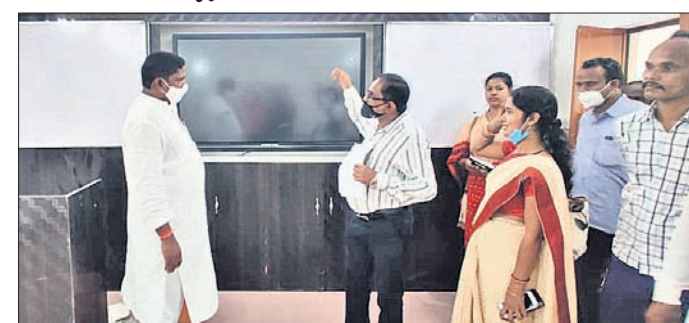
ଝରିଗାଁ, ୨୩।୯ (ଏ.ପ୍ର.)

ନବରଙ୍ଗପୁର ଜିଲ୍ଲା ଝରିଗାଁ ବ୍ଲକ ସଦର ମହକୁମାସ୍ଥିତ ନୋଡାଲ ସରକାରୀ ନୂତନ ପଞ୍ଚାୟତ ଉଚ୍ଚ ବିଦ୍ୟାଳୟରେ ୭୦ଲକ୍ଷ ଟଙ୍କା ଅଟଳ ମୂଲ୍ୟରେ ସ୍ମାର୍ଟ କ୍ଲାସ୍ ରୁମ୍ କାର୍ଯ୍ୟ ଚାଲିଛି ।