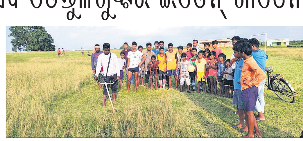
ସିଂଘାଳ୍ୟ ପକ୍ଷରୁ ମେଣିନ ସାହାଯ୍ୟରେ ଘାସ ସଫା କରାଯାଉଛି ।

ତେନ୍ତୁଳିଖୁଣ୍ଟି, ୨୩।୯ (ଡି.ଏନ୍.ଏ.) ନବରଙ୍ଗପୁର ଜିଲ୍ଲା ତେନ୍ତୁଳିଖୁଣ୍ଟି ବ୍ଲକର 'ଫୁଟବଲ ପାଗଳ ଇଡେନ୍ ଗାର୍ଡେନ' ରୂପେ ପରିଚିତ କାମପାଣ୍ଡିତ ଖେଳପଡ଼ିଆ ପୁଣି ଖେଳାଳି ଏବଂ ଦର୍ଶକଙ୍କୁ ନେଇ ଝଲସିବ ।