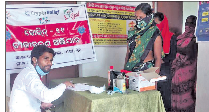
ମହିଳାମାନେ ଧାଡ଼ିରେ ଆସି ଚିକା ନେଉଛନ୍ତି ।