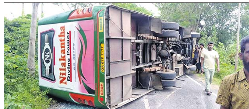
ରାସ୍ତାରେ ଓଲଟି ପଡ଼ିଥିବା ବସ୍ ।

ଗଞ୍ଜାମ ଜିଲ୍ଲା ସୋରଡ଼ା ନିକଟ କୁଳାଙ୍ଗା-କାଳିଆଗୋଡ଼ା ମଧ୍ୟରେ ଗୁରୁବାର ଏକ ବସ୍ ଓଲଟି ପଡ଼ିବାରୁ ୪୭ ଜଣ ଚାଷୀ ଆହତ ହୋଇଛନ୍ତି ।