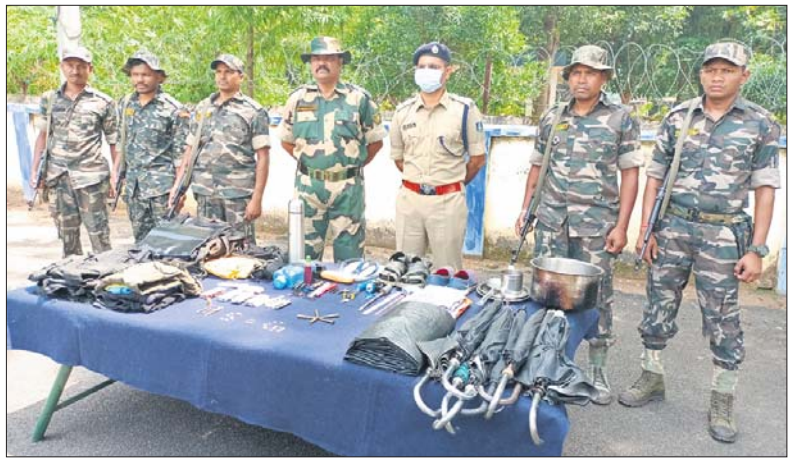
ଜବତ ହୋଇଥିବା ମାଓବାଦୀ ସାମଗ୍ରୀ ।

ମାଲକାନଗିରି ଜିଲ୍ଲା ମାଥିଲି ବ୍ଲକ୍ ତୁଳସୀ ପାହାଡ଼ରେ ପୋଲିସ-ମାଓବାଦୀ ମଧ୍ୟରେ ଗୁଳି ବିନିମୟରେ ପୋଲିସକୁ ସଫଳତା ମିଳିଛି ।