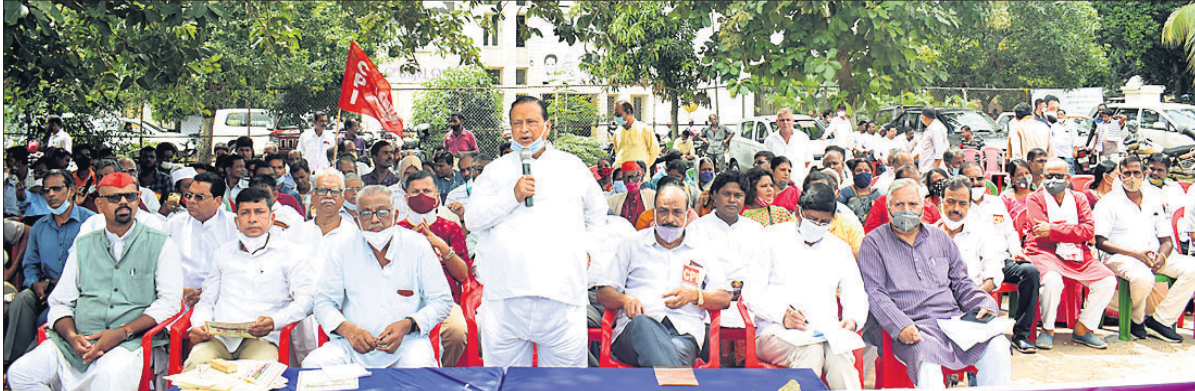
ଭୁବନେଶ୍ୱର ମାଷ୍ଟର କ୍ୟାଣ୍ଟିନ୍‌ରେ ଗୁରୁବାର ୭ ଦଳ ପକ୍ଷରୁ ଦିଆଯାଇଥିବା ଧାରଣା।