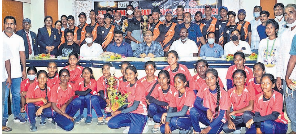
ଚାମ୍ପିୟନ ତେଲଙ୍ଗାନା ଓ ରାଜସ୍ଥାନ ଦଳର ଖେଳାଳିମାନେ ଅତିଥିକ ଗହଣରେ।