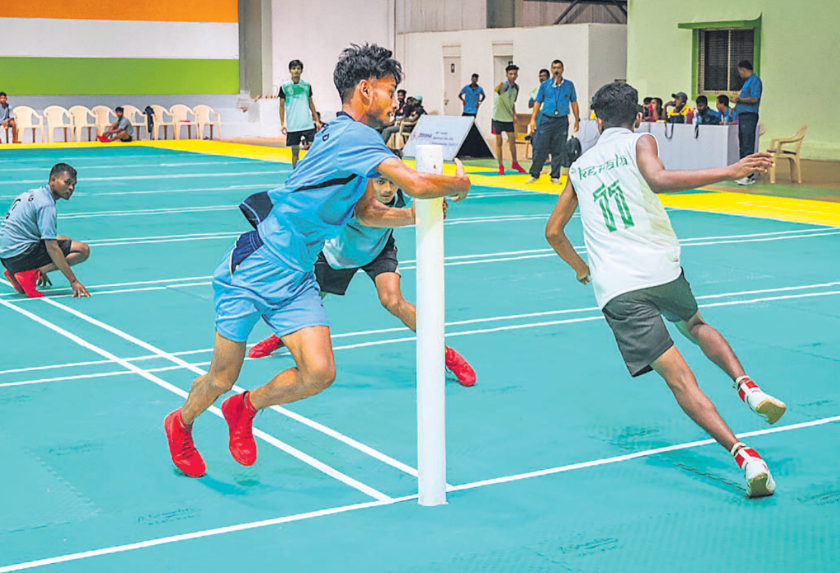
ଜାତୀୟ କ୍ରୀଡ଼ା ଖୋ ଖୋ ଚାମ୍ପିୟନଶିପ୍‌ରେ ବାଳିକା ବିଭାଗରେ ପଶ୍ଚିମବଙ୍ଗ ଓ ମଧ୍ୟପ୍ରଦେଶ ଏବଂ ବାଲକରେ କେନ୍ଦ୍ର ଓ ଖାଡ଼ଖଣ୍ଡ ମଧ୍ୟରେ ଅନୁଷ୍ଠିତ ମ୍ୟାଚ।