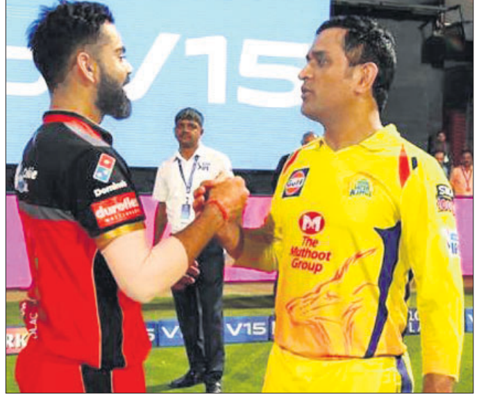
ବିରାଟ କୋହଲି ଓ ମହେନ୍ଦ୍ର ସିଂ ଧୋନୀ।

ସାରକା, ୨୩।୯ (ପି.ଟି.) ବହୁ ସ୍ତରର ଖେଳାଳିଙ୍କୁ ନେଇ ଗଠିତ ଉପାଧିକାରୀ ଚ୍ୟାଲେଞ୍ଜିଂ ବାଲାଲୋର (ଆରସିବି) ଶୁକ୍ରବାର ଖେଳାଳିବାଳୁଥିବା ଏକ ଇଣ୍ଡିଆନ୍ ପ୍ରିମିୟର ଲିଗ୍ (ଆଇପିଏଲ୍) ମ୍ୟାଚରେ ମହେନ୍ଦ୍ର ସିଂ ଧୋନୀଙ୍କ ଚେନ୍ନାଇ ସୁପର କିଙ୍ଗ୍ସ୍ (ସିଏସକେ)କୁ ଭେଟିବ। ପୂର୍ବପରାଜୟକୁ ଭୁଲି ବିଜୟ ପଥକୁ ଫେରିବା ଲକ୍ଷ୍ୟ ନେଇ ଦଳ ପଡ଼ିଆକୁ ଓହ୍ଲାଇବ। ଅନାମୟ ଚେନ୍ନାଇ ଗରୁଡ଼ ଗର୍ଭରେ ଗାମ୍ବିୟନ ମ୍ୟୁଲ୍ୟା ଲାଭ କରିଥିବା ସିଏସକେର ମନୋବଳ ଭଙ୍ଗା ରହିଛି। ପଏଣ୍ଟ ଟେବୁଲରେ ନିଜ ସ୍ଥିତି ସୁଧାରିବାକୁ ହେଲେ ଆରସିବିଙ୍କୁ ବ୍ୟାଟିଂରେ ଉନ୍ନତ ଆଶିବାକୁ ହେବ। ଓପନର ଦେବଦତ୍ତ ପଡ଼ିକାଳ (୨୧୭ ରନ) ଓ ଅଧିନାୟକ ବିରାଟ କୋହଲି (୨୦୩ ରନ)ଙ୍କୁ ଦୂର ଆରମ୍ଭ କରିବାକୁ ହେବ। ଓପନିଂ ଯୋଡ଼ିକୁ ଆହୁରି ମଧ୍ୟ ମିତଳ ଅର୍ଥରୁ ସହାୟତା ମିଳିବା ଆବଶ୍ୟକ। କୋଲକାତା ନାଇଟ ରାଇଡର୍ସ (କେକେଆର୍) ବିପକ୍ଷ ମ୍ୟାଚରେ ଆରସିବିର ମିତଳ ଅର୍ଥର ଭୁଣ୍ଡି ପଡ଼ିଥିଲା। ଗ୍ରେନ ମାଙ୍କୁଡ଼େଲ