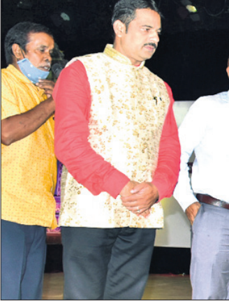
କାର୍ଯ୍ୟକ୍ରମକୁ ଅତିଥି ଭଦ୍ରାଚରଣ କରୁଛନ୍ତି ।