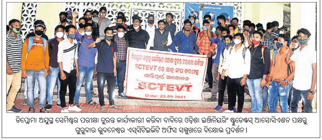
ଡିପ୍ଲୋମା ଅନୁର ସେମିଷ୍ଟର ପରୀକ୍ଷା ରୁଚିତ କାର୍ଯ୍ୟକାରୀ କରିବା ଦାବିରେ ଓଡ଼ିଶା ଇଞ୍ଜିନିୟରିଂ ୟୁଥ୍‌ସେକ୍ଟ୍ ଆସୋସିଏସନ ପକ୍ଷରୁ ଗୁରୁବାର ଭୁବନେଶ୍ୱର ସର୍ବସ୍ୱତନ୍ତ୍ର ଅଫିସ୍ ସମ୍ମୁଖରେ ବିରୋଧ ପ୍ରଦର୍ଶନ ।