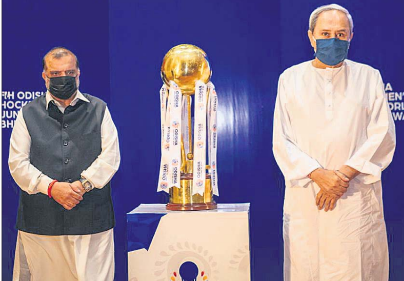
ଟ୍ରଫି ଉନ୍ମୋଚନ ଅବସରରେ ଏମ୍.ଆଇ.ଏସ୍ ଅଧ୍ୟକ୍ଷ ନରିନ୍ଦର ଧୂବ ବାତ୍ରା ଓ ମୁଖ୍ୟମନ୍ତ୍ରୀ ନବୀନ ପଟ୍ଟନାୟକ।

ଭୁବନେଶ୍ୱରର କଳିଙ୍ଗ ଷ୍ଟାଡିୟମରେ ହେବ ଜୁନିୟର ହକି ବିଶ୍ୱକପ୍। ଏହା ନଭେମ୍ବର ୨୪ରୁ ଆରମ୍ଭ ହୋଇ ଡିସେମ୍ବର ୪ ପର୍ଯ୍ୟନ୍ତ ଚାଲିବ। ଗୁରୁବାର ଲୋକସେବା ଭବନରେ ମୁଖ୍ୟମନ୍ତ୍ରୀ ନବୀନ ପଟ୍ଟନାୟକ ଏହା ଘୋଷଣା କରିବା ସହ ତୁର୍ନାମାରେ ଟ୍ରଫି ଓ ଲୋଗୋ ଉନ୍ମୋଚନ କରିଛନ୍ତି।