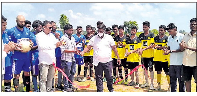
ଚୂର୍ଣ୍ଣାମେଣ୍ଟକୁ ଉଦ୍ଘାଟନ କରାଯାଇଛି।