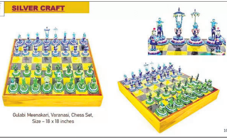
ପ୍ରଧାନମନ୍ତ୍ରୀ ଉପହାର ଦେଇଥିବା ଚେସ୍ ସେଟ୍।