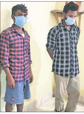
ଗିରଫ ମୁହଁକ ବୟା।