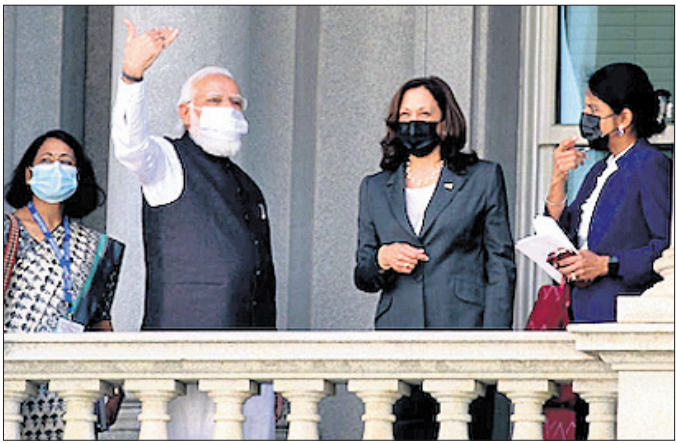
ଆମେରିକା ଉପରାଷ୍ଟ୍ରପତି କମଳା ହାରିସ୍କୁ ସହ ସେଲି ନେଉଛନ୍ତି ପ୍ରଧାନମନ୍ତ୍ରୀ ନରେନ୍ଦ୍ର ମୋଦି।