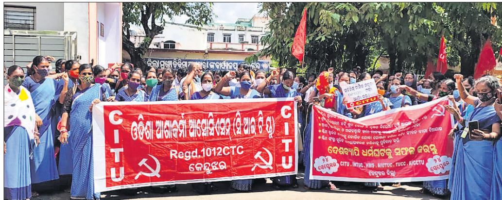
ଆଶାକର୍ମୀମାନେ ଧାରଣା ଦେଇଛନ୍ତି।

ଅତିରିକ୍ତ ଜିଲ୍ଲାପାଳ ସହାୟକ ନାଏକଙ୍କୁ ପ୍ରମାଣପତ୍ର ପ୍ରଦାନ କରିଛନ୍ତି। ଏଥିରେ ସମସ୍ତ ବିଦ୍ୟାଳୟ ଗୁଡ଼ିକ ନିଜ ନିଜର ପ୍ରମାଣପତ୍ର ଗଠନ କରିବାକୁ ନିର୍ଦ୍ଦେଶ ଦିଆଯାଇଛି।