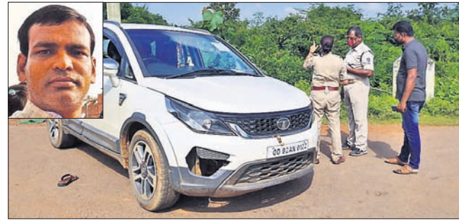
ମୃତ ଦାପକ ମାହୁଡ଼ (ଉତ୍ତରପୂର୍ବ) । ଘଟଣାସ୍ଥଳରେ ପୋଲିସର ଚଢ଼କ।