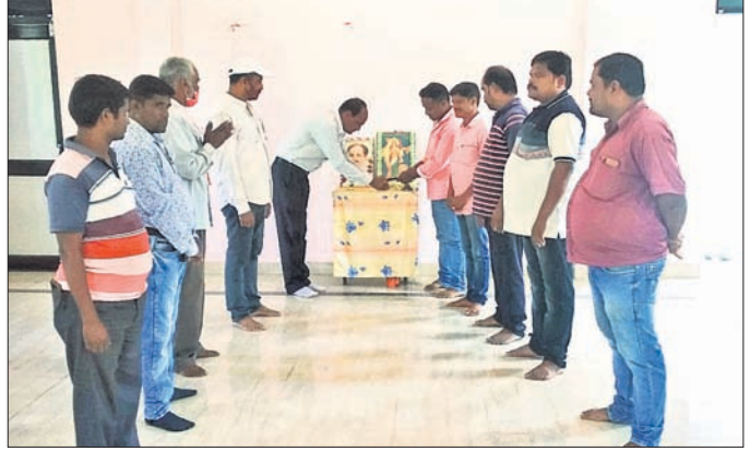
ବରଷାରେ ଆୟୋଜିତ କାର୍ଯ୍ୟକ୍ରମରେ ଭାଜପା କର୍ମଚାରୀମାନେ।

କିଶୋରନଗର ବ୍ଲକ୍ ବରଷା ଶିଶୁମିତ୍ରି ନିକଟରେ ଶନିବାର ମଣ୍ଡଳ ଭାଜପା ପକ୍ଷରୁ ପଞ୍ଚିତ ଦୀନନ୍ଦୟାଳ ଉପାଧ୍ୟାୟଙ୍କ ଜୟନ୍ତୀ ପାଳିତ ହୋଇଯାଇଛି।