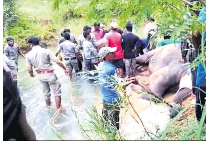
ମାଙ୍କଡ଼ହାତୀ ନିକଟରେ ଉପସ୍ଥିତ ବନ କର୍ମଚାରୀ।

କେନ୍ଦୁଝର ଜିଲ୍ଲା ଚଞ୍ଚୁଆ ବନାଞ୍ଚଳରେ ତିନିଦିନ ଧରି ପ୍ରସ୍ତବ ବେଦନାରେ ଛଟପଟ ହେଉଥିବା ମାଙ୍କଡ଼ହାତୀର ଶନିବାର ଅସ୍ତ୍ରୋପଚାର କରାଯାଇ ଏକ ମୃତ ହାତୀ ଶାବକକୁ ପ୍ରସ୍ତବ କରାଯାଇଛି।