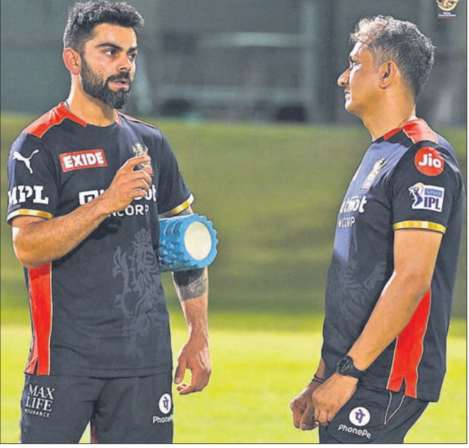
ବ୍ୟାଟ୍ସମ୍ୟାନମାନେ ଦୁଇ ଦଳ ଚଳାଏକ୍ସ୍ ଖେଳୁଛନ୍ତି।

ବ୍ୟାଟ୍ସମ୍ୟାନମାନେ ଦୁଇ ଦଳ ଚଳାଏକ୍ସ୍ ଖେଳୁଛନ୍ତି। ଏମାନେ ଆଶାକରତା ପ୍ରଦର୍ଶନ କରିପାରିନାହାନ୍ତି।