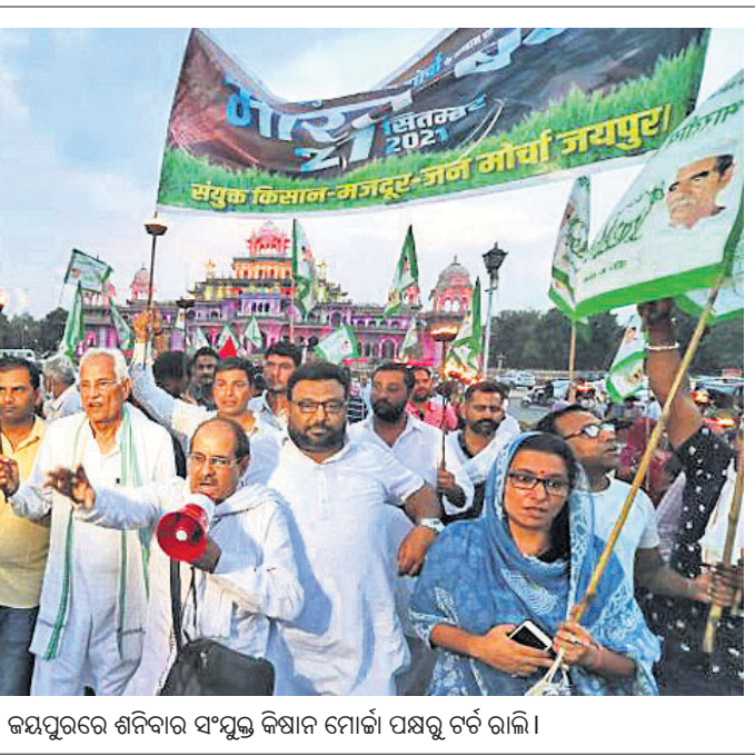
ଯୋଗଦାନ ଭାରତ ବନ୍ଦ ପୂର୍ବରୁ ରାଜସ୍ଥାନର ଜୟପୁରରେ ଶନିବାର ସଂସ୍କୃତ କ୍ୟାମ୍ପ ମୋର୍ଚ୍ଚା ପକ୍ଷରୁ ଚଳିଲା।

ହେବ ବୋଲି ପ୍ରଧାନମନ୍ତ୍ରୀ କହିଛନ୍ତି। ଭାରତ-ପ୍ରଶାନ୍ତ ମହାସାଗର ଅଞ୍ଚଳରେ ତାଲିବାନ ସମର୍ଥନ ଦର୍ଶାଉଥିବା ବିରୋଧରେ ଏକାଠି ହେବାକୁ ଆହ୍ୱାନ ଦେଇଛନ୍ତି।