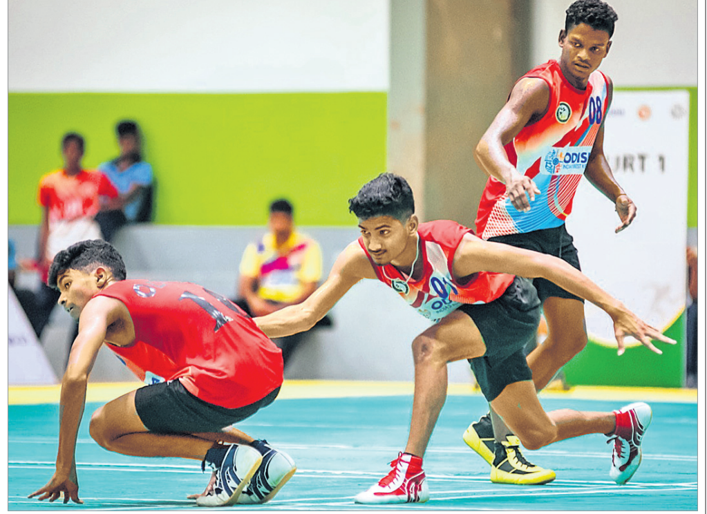
ଓଡ଼ିଶା ଓ ଚେନ୍ନାଇ ମଧ୍ୟରେ ଅନୁଷ୍ଠିତ କ୍ୱାର୍ଟର ଫାଇନାଲ ମ୍ୟାଚ୍।

ଘୁନାୟ କିଏ ବିଶ୍ୱବିଦ୍ୟାଳୟର ବିଜୁ ପଟ୍ଟନାୟକ ଇନ୍ସ୍ଟିଚ୍ୟୁଟ୍ ଅଫ୍ ଟେକ୍ନୋଲୋଜିରେ ଚଳିଥିବା ୪୦ତମ ଜାତୀୟ କ୍ରିକେଟ ଖେଳା ଚାମ୍ପିୟନଶିପ୍ରେ ଆୟୋଜକ ସେମିରେ ଓଡ଼ିଶା ଓ ଚେନ୍ନାଇ ମଧ୍ୟରେ ପ୍ରତିଯୋଗିତା ହେବ।