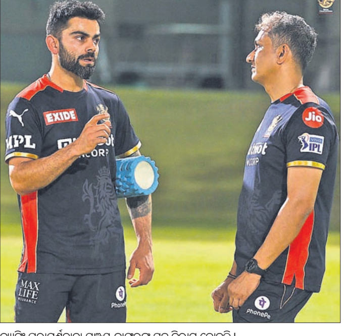
କୋହଲି-ରୋହିତ ମୁକାବିଲାରେ ଅଧିକାରୀ ହେବେ।

କୋହଲିଙ୍କ ନେତୃତ୍ୱାଧୀନ ଉତ୍ତମ ଟ୍ୟାଲେଣ୍ଟ ବାଙ୍ଗାଲୋର (ଆରସିଏ) ଓ ରୋହିତଙ୍କ ମୁମ୍ବାଇ ଇଣ୍ଡିଆନ୍ସ ମଧ୍ୟ ଟପ୍ ଟିମ୍ ମ୍ୟାଚ୍ରେ ଖେଳିବେ। କୋହଲିଙ୍କ ନେତୃତ୍ୱାଧୀନ ଉତ୍ତମ ଟ୍ୟାଲେଣ୍ଟ ବାଙ୍ଗାଲୋର (ଆରସିଏ) ଓ ରୋହିତଙ୍କ ମୁମ୍ବାଇ ଇଣ୍ଡିଆନ୍ସ ମଧ୍ୟ ଟପ୍ ଟିମ୍ ମ୍ୟାଚ୍ରେ ଖେଳିବେ।