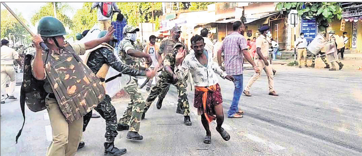
ବରଗଡ଼ ଏସ୍ପି ଅଫିସ ଆଗରେ ବିଶୋଭକାରୀଙ୍କୁ ଗୋଡ଼ାଇ ଗୋଡ଼ାଇ ପିଟୁଛି ପୋଲିସ।