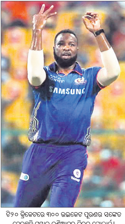
୧୨୦ ରନରେ ୩୦୦ ରନରେ ପୁରଣର ସକ୍ଷେପ ଦେଖାଇଥିବା ଇଣ୍ଡିଆନ୍ କିରନ ପୋଲାଟ୍।