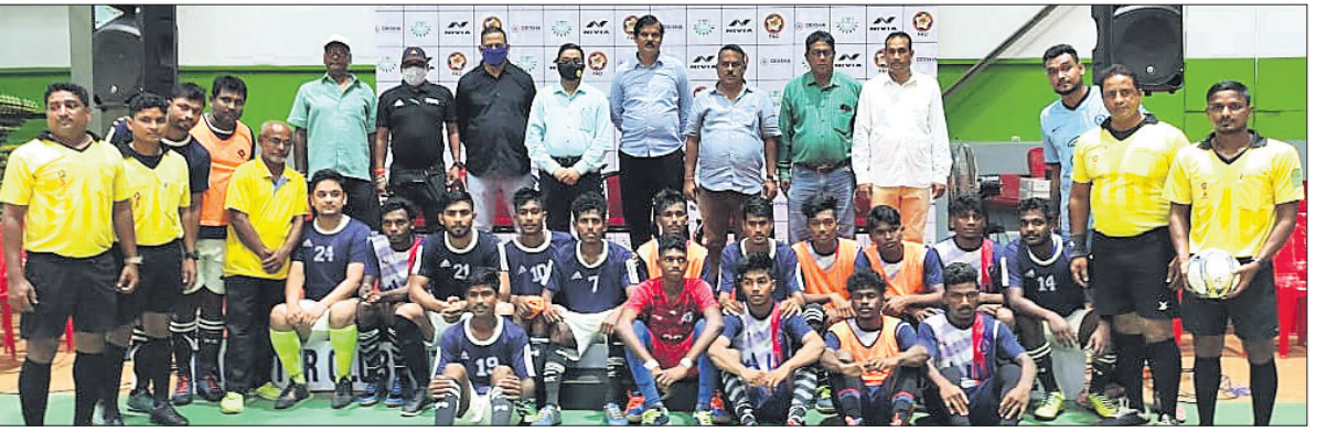
ଉଦ୍‌ଘାଟନୀ ମ୍ୟାଚ୍ ପୂର୍ବରୁ ଅତିଥି ଓ କର୍ମଚାରୀଙ୍କ ଗହଣରେ ଖେଳାଳିମାନେ।

ଭୁବନେଶ୍ୱର, ୨୮/୯ (କ୍ରୀଡ଼ା ପ୍ରତିନିଧି) ରାଜ୍ୟ ସରକାରଙ୍କ କ୍ରୀଡ଼ା ବିଭାଗ ଏବଂ ପୁରସ୍କାର ଆସୋସିଏସନ୍ ଅଫ୍ ଓଡ଼ିଶା (ଫାଓ) ଆନୁକୁଲ୍ୟରେ ଆନ୍ତଃକୁଳ ପୁରସ୍କାର (ପ୍ରତି ଦଳରେ ୫ ଖେଳାଳି) ଚାଳିଷାନ୍ତରାଳ ମଙ୍ଗଳବାର କିର୍ ଇନ୍‌ଡୋର ଷ୍ଟାଡ଼ିୟମ୍‌ରେ ଆରମ୍ଭ ହୋଇଛି। ପ୍ରଥମ ଦିବସରେ ମୋଟ ୬ଟି ମ୍ୟାଚ୍ ଅନୁଷ୍ଠିତ ହୋଇଛି। ପ୍ରଥମ ମ୍ୟାଚ୍‌ରେ କଟକର ମଙ୍ଗଳା କ୍ଲବ୍ ୧୫-୨ ଗୋଲରେ କିର୍ପୁ ପରାସ୍ତ କରିଛି। ଯାକପୁରର କଳିଙ୍ଗ ନଗର ସେଣ୍ଟି ଏକାଡେମୀ ଓ କେନ୍ଦୁଝରର ବିଚାକ୍ଷି ମଧ୍ୟରେ ଅନୁଷ୍ଠିତ ଦ୍ୱିତୀୟ ମ୍ୟାଚ୍ ୭-୬ ଗୋଲରେ ଡ୍ର ହେଇଛି। ତୃତୀୟ ମ୍ୟାଚ୍‌ରେ କଟକ ବିଚାକ୍ଷି କ୍ଲବ୍ ୪-୩ ଗୋଲରେ ଭୁବନେଶ୍ୱରର କିଶୋର କ୍ଲବ୍, ୪ଥ ମ୍ୟାଚ୍‌ରେ ଭୁବନେଶ୍ୱର କ୍ରୀଡ଼ା ଛାତ୍ରାବାସ