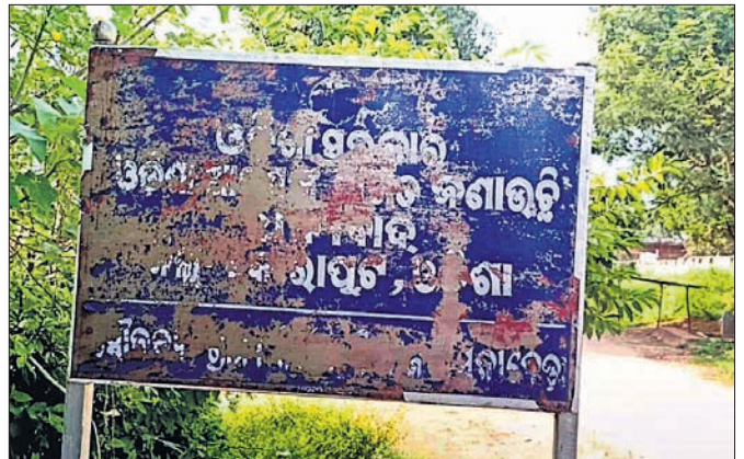
ଓଡ଼ିଶାର ନାମଫଳକକୁ ଲିଭାଇ ଦେଇଛି ଆନ୍ଧ୍ର ।

କୋରାପୁଟ ଜିଲ୍ଲା ପଟ୍ଟାଣୀ ବ୍ଲକ୍ ଅନ୍ତର୍ଗତ ତଥା ଆନ୍ଧ୍ର ସାମାଜ୍ୟ କୋଟିଆ ପଞ୍ଚାୟତକୁ ନେଇ ଓଡ଼ିଶା-ଆନ୍ଧ୍ର ମଧ୍ୟରେ ଦୀର୍ଘଦିନ ଧରି ବିବାଦ ଲାଗି ରହିଛି । ତେବେ ଏହି ବିବାଦକୁ ବେଶି ବଢ଼ାଇଛି ଆନ୍ଧ୍ର ପୁଞ୍ଜିକୋର୍ଟ ଦେଇଥିବା ନିର୍ଦ୍ଦେଶକୁ ପାଳନ ନ କରି ଆନ୍ଧ୍ର କୋଟିଆରେ ଅନୁପ୍ରବେଶ କରି ନିଜ କାର୍ଯ୍ୟକ୍ରମ ଚାଲି ରଖିଛି । କୋଟିଆରେ ପୂର୍ବରୁ ଓଡ଼ିଶା ପକ୍ଷରୁ କୋରାପୁଟ ଜିଲ୍ଲା ପ୍ରଶାସନ ନାମଫଳକ ଲଗାଯାଇଥିଲା । ସାମାଜ୍ୟର ଆନ୍ଧ୍ର କୋଟିଆର ପ୍ରତି ଗ୍ରାମରେ ନିଜର ନାମଫଳକ ଲଗାଯାଇଥିଲା । ତେବେ ଏହି ସମୟରେ ଆନ୍ଧ୍ର ଓଡ଼ିଶା ପକ୍ଷରୁ ନେତୈତ୍ୱାଧୀନ ଗ୍ରାମରେ ମରାଯାଇଥିବା ନାମଫଳକୁ ଆନ୍ଧ୍ରର ଅଧିକାରୀମାନେ ଆନ୍ଧ୍ର ସହ୍ୟ କରି ପାରୁ ନ ଥିବା ପ୍ରକାଶ କରିଛନ୍ତି । କୋରାପୁଟ ଜିଲ୍ଲା ପ୍ରଶାସନ ପକ୍ଷରୁ ଏ ଦିଗରେ କଡ଼ା ପଦକ୍ଷେପ ନେବାକୁ ଦାବି ହେଉଛି । ସୂଚନାଯୋଗ୍ୟ, ଓଡ଼ିଶା-ଆନ୍ଧ୍ର ସାମାଜ୍ୟ ବିବାଦ ନେଇ ଓଡ଼ିଶା ସରକାର ପୁଞ୍ଜିକୋର୍ଟର ଆଶ୍ରୟ ନେଇଥିଲେ । ନିକଟରେ ଏହି