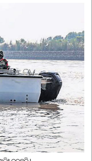
ବିଏସ୍ଏଫ୍ ଯବାନମାନେ ଭାରତ-ପାକିସ୍ତାନ ସୀମା ତେନାବ ନଦୀରେ ବୋର୍ଡ଼ ଯୋଗେ ପାଟ୍ରେଲିଂ କରୁଛନ୍ତି।

ଆସିବା ପରେ ଗତ ୧୮ ତାରିଖରୁ ଅନୁପ୍ରବେଶ ନିରୋଧୀ ଅଭିଯାନ ଆରମ୍ଭ ହୋଇଥିଲା। ୨୬ ତାରିଖ ସକାଳେ ଅନୁପ୍ରବେଶକାରୀଙ୍କ ଏକ ଗଣ୍ଠି ଆଗ୍ରା ପୁଲିସ୍ ଡିଭିଜନରୁ ଗଠିତ ହୋଇଥିଲା।