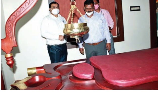
ଆୟୁର୍ବେଦିକ ସ୍ତ୍ରୀ କେନ୍ଦ୍ର ଉଦ୍ଘାଟନ କରୁଛନ୍ତି ଜିଲାପାଳ ।