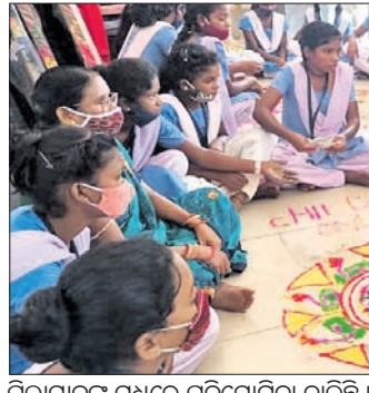
ପିଲାମାନଙ୍କ ମଧ୍ୟରେ ପ୍ରତିଯୋଗିତା ଚାଲିଛି ।

ଲୁଲୁ, ପକାରୀ, ବାଲ୍ୟାପତା ଓ କୁସରମାଣ୍ଡ ଗ୍ରାମ ପଞ୍ଚାୟତର ବିଭିନ୍ନ ଗ୍ରାମରେ ଅଞ୍ଚଳସ୍ତର କର୍ମ, ଆଶା କର୍ମୀ ଓ ଶିଶୁମାନଙ୍କୁ ନେଇ ବିଭିନ୍ନ କାର୍ଯ୍ୟକ୍ରମ ଆୟୋଜିତ ହୋଇଥିଲା । ପିରିଫିଆ ବିଭିନ୍ନ ଉପାନ୍ତ ଅଞ୍ଚଳରେ ଅନୁଷ୍ଠିତ ହୋଇଯାଇଛି । ପିରିଫିଆ ବୁକ ସାହିରାକୁ, ଲୁଲୁ, ପକାରୀ, ବାଲ୍ୟାପତା ଓ କୁସରମାଣ୍ଡ ଗ୍ରାମ ପଞ୍ଚାୟତର ବିଭିନ୍ନ ଗ୍ରାମରେ ଅଞ୍ଚଳସ୍ତର କର୍ମ, ଆଶା କର୍ମୀ ଓ ଶିଶୁମାନଙ୍କୁ ନେଇ ବିଭିନ୍ନ କାର୍ଯ୍ୟକ୍ରମ ଆୟୋଜିତ ହୋଇଥିଲା । ପିରିଫିଆ ବିଭିନ୍ନ ଉପାନ୍ତ ଅଞ୍ଚଳରେ ଅନୁଷ୍ଠିତ ହୋଇଯାଇଛି । ପିରିଫିଆ ବୁକ ସାହିରାକୁ,