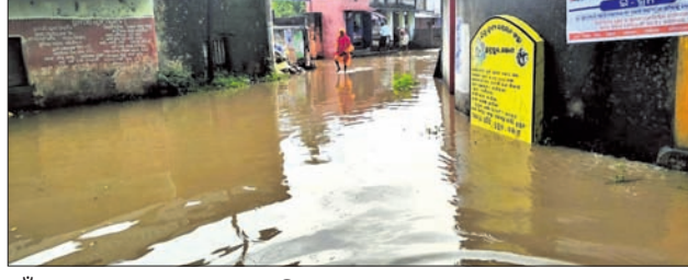
ଗାଁ ଛକରେ ଜମା ହୋଇଥିବା ପାଣି ।

ହେଲେ ମଧ୍ୟ ପାଣି ନିଷାସନ ହୋଇନପାରି ଛକରେ ଜମି ରହିଛି । ପଞ୍ଚାୟତର ଉନ୍ନତି ପାଇଁ ବିଭିନ୍ନ ଯୋଜନାରେ ସରକାର କୋଟି କୋଟି ଟଙ୍କା ଖର୍ଚ୍ଚ କରୁଛନ୍ତି । ଗ୍ରାମର ନାକ ନର୍ଦ୍ଦମା ସଫେଳ ସହ ପରିଷ୍ଠାର ନିକଟରେ ସ୍କୁଲ ଓ କଲେଜ ରହିଛି । ତେବେ କୌଣସି କର୍ତ୍ତୃପକ୍ଷ କାର୍ଯ୍ୟାଳୟକୁ ଯିବା ପାଇଁ ଏକମାତ୍ର ରାସ୍ତା । ତେବେ ସାମାନ୍ୟ ବର୍ଷା ଗ୍ରାମବାସୀ ଅଭିଯୋଗ କରିଛନ୍ତି ।