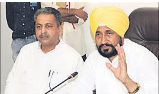
ଚଣ୍ଡିଗଡ଼ରେ ଖବରଦାତା ସମ୍ମିଳନୀକୁ ସମ୍ବୋଧିତ କରୁଥିବା ପଞ୍ଜାବ ପୁଞ୍ଜାପୁଞ୍ଜା ଚରଣକିନ୍ଦ ସିଂ ଚନ୍ନି।

କ୍ରିକେଟରରୁ ରାଜନେତା ସାଜିଥିବା ନବକୋଡ଼ ସିଂ ସିଦ୍ଧୁ କଂଗ୍ରେସ ସଭାପତି ପଦକୁ ଇସ୍ତଫା ଦେବା ପରେ ପଞ୍ଜାବ ରାଜନୀତିରେ ଅନିଶ୍ଚିତତା ଦେଖାଦେଇଛି।